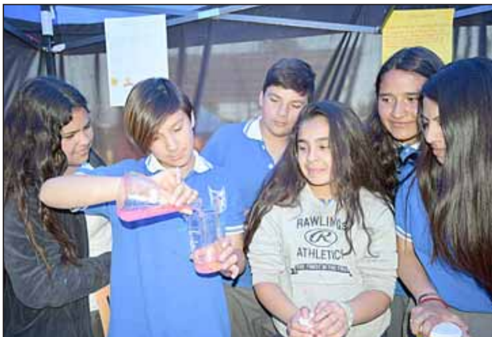
JÓVENES CIENTÍFICOS.- Ellos son los más grandes de la escuela, habilidosos estudiantes que ya tienen un buen manejo de la Química.

vas, cada uno explicó a los apoderados visitantes de qué trataba cada trabajo.