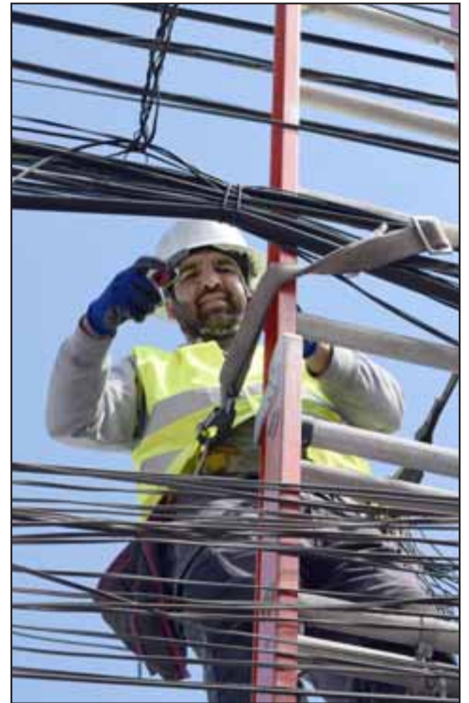
MENOS CABLE.- Varios empleados de empresas de telefonía desde hace semanas están acomodando y retirando cables de nuestra ciudad.