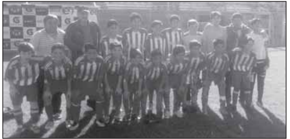
La selección de San Felipe avanzó de manera dramática hasta la tercera fase del Regional U13.

Al cierre de la presente edición de El Trabajo Deportivo , en Viña del Mar,