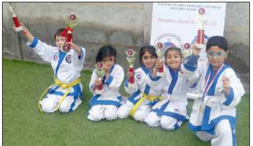
MUCHAS MEDALLAS.- Estos pequeñitos muestran con alegría sus medallas y trofeos.