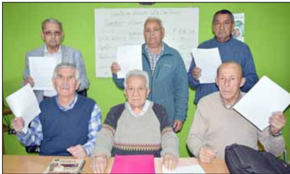
LÍDERES VECINALES. - Estos dirigentes vecinales muestran a Diario El Trabajo las recurrentes solicitudes que ellos han presentado a las autoridades en busca de soluciones concretas.

tera, es que los reductores son para zonas urbanas, y si bien es cierto este sector es zona urbana, es un camino público que está bajo tui-