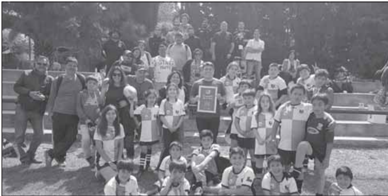
Treinta niños (as) de los Halcones participaron en un encuentro de rugby formativo en Mendoza.

Entre el sábado 7 y domingo 8 recién pasados, treinta pequeños del club Halcones de Calle Larga vivieron una gran experiencia deportiva de gran altura al ser parte del Festival de Rugby Máximo Navesi, cita que tuvo lugar en la vecina ciudad trasandina de Mendoza.