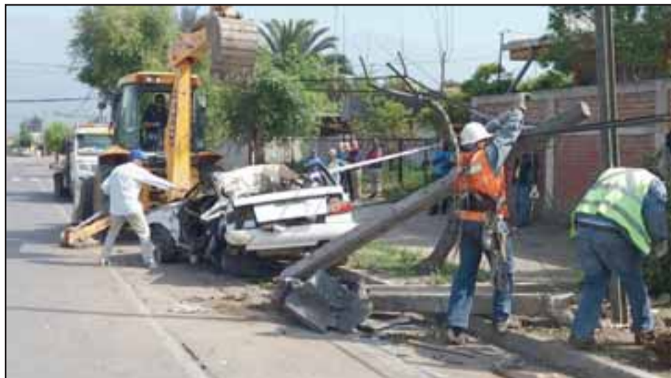
Este era el escenario este lunes en Encón, luego que un automóvil se estrellara contra este puente.