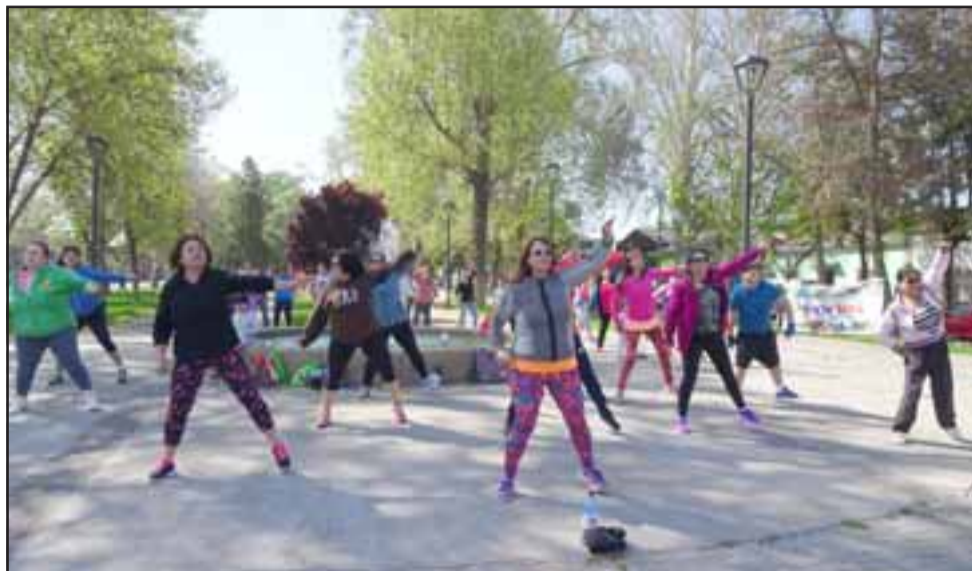
Las actividades deportivas partieron la mañana del sábado con una zumba al aire libre en la Alameda Chacabuco.

mentó lo fundamental que ha sido el respaldo de la Municipalidad para realizar la actividad: «El apoyo de la Municipalidad ha sido primordial, porque ellos nos han dado el espacio físico que es muy importante para realizar este evento, nos ha colaborado con el arbitraje, medallas para los