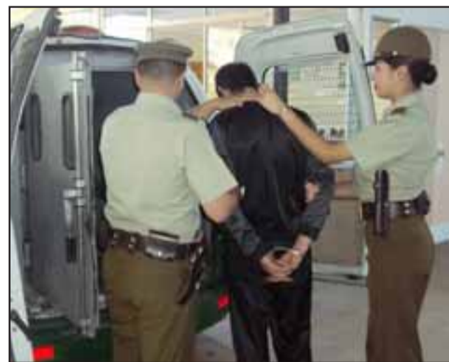
El sentenciado fue capturado por Carabineros de la Tenencia de Putaendo, siendo enjuiciado por el delito de receptación de especies robadas de una casa.

Este fin de semana en la comuna de Llay Llay: