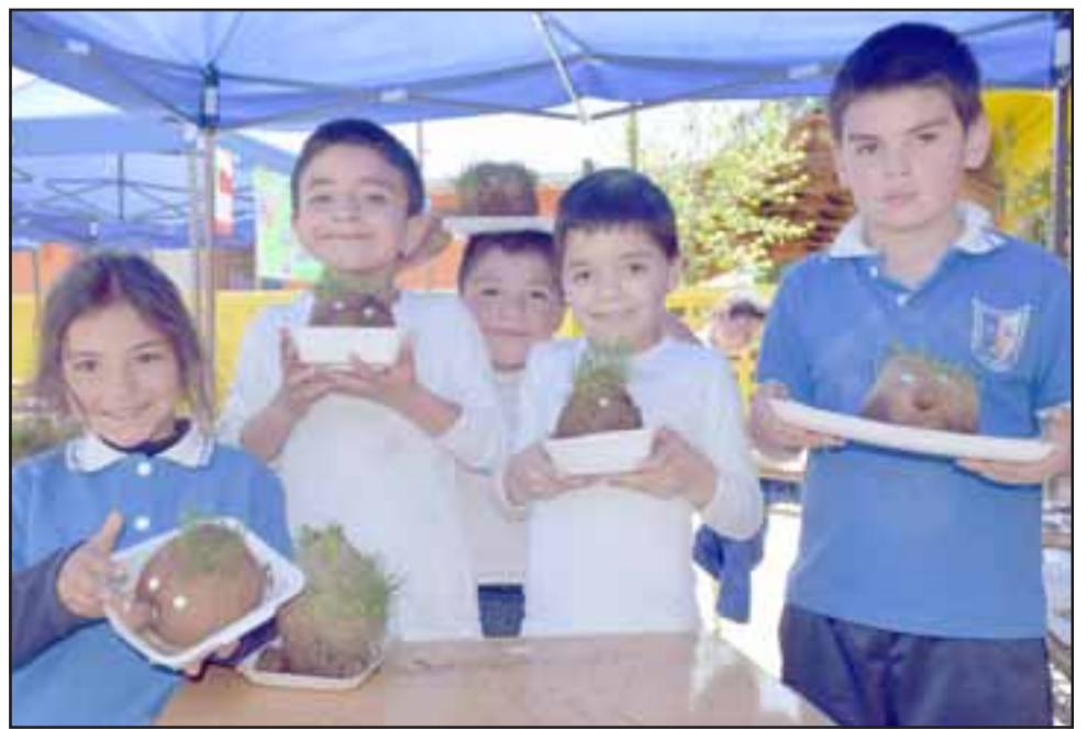
PEQUEÑOS CIENTÍFICOS.- Estos pequeñitos en cambio, lo apostaron todo a las plantas y su proceso de germinación.