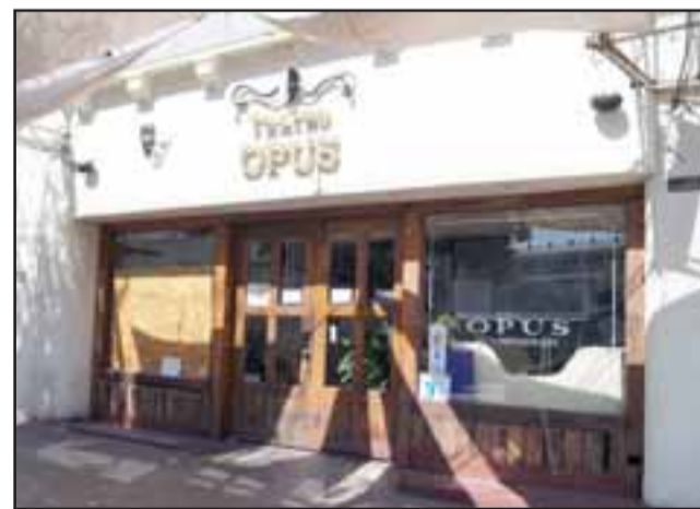
El conocido y céntrico bar Opus fue el escenario de una noche de furia de una mujer que causó daños por 800 mil pesos.

La mujer fue puesta a disposición del Tribunal de Garantía de Los Andes y formalizada por los delitos