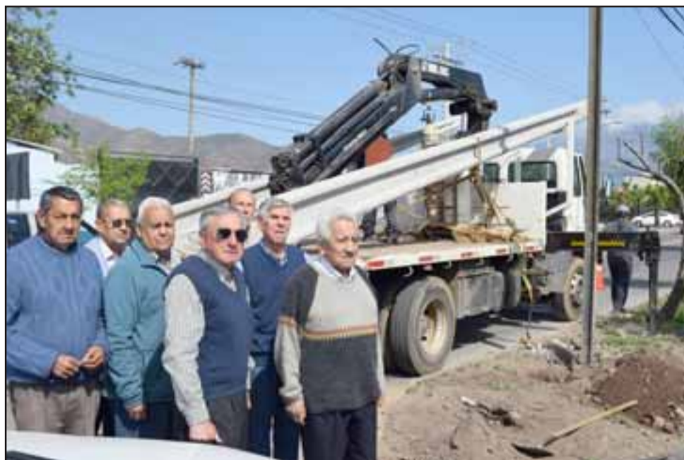
SIGUEN ESPERANDO. - Estos vecinos durante años han clamado por una justa solución al problema de inseguridad vial que reina en el camino Encón. Ayer fue instalado un nuevo poste en el lugar del accidente del lunes.

- Según lo que dicen los expertos y lo que nos permite hacer el Manual de Carre-