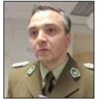
Mayor de Carabineros San Felipe, Héctor Soto Moeller.