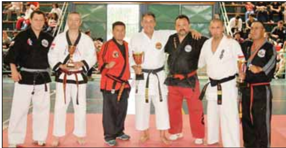
La competencia de Formas en cintos negros fue una de las más destacadas y entretenidas de la jornada de artes marciales.

Competidores y espectadores con mucha motiva-