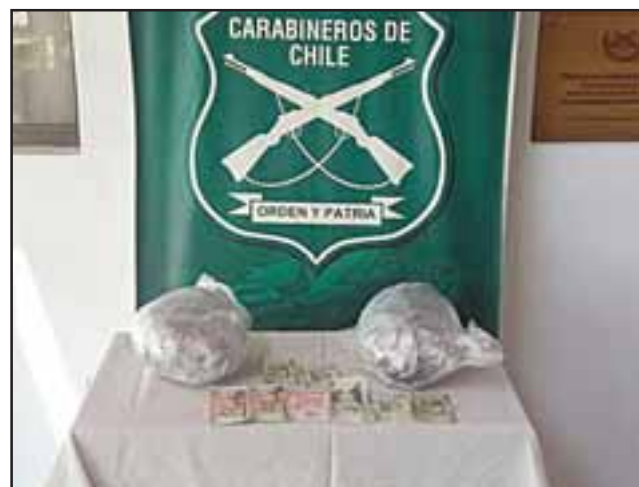
Alrededor de tres kilos de marihuana incautó Carabineros de la Siat y Carreteras de San Felipe desde el interior de un vehículo que circulaba por la ruta 5 Norte a la altura de Llay Llay la tarde de ayer lunes.

Víctima perdió la vida de seis heridas con cuchillo cocinero: