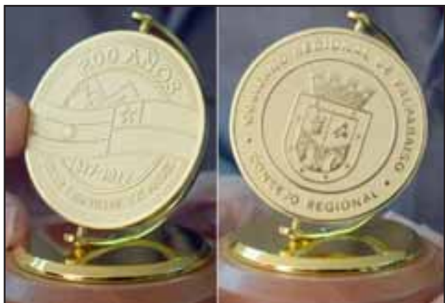
¡GRACIAS!.- Esta es la brillante medalla otorgada a Diario El Trabajo por el Consejo Regional de Valparaíso.