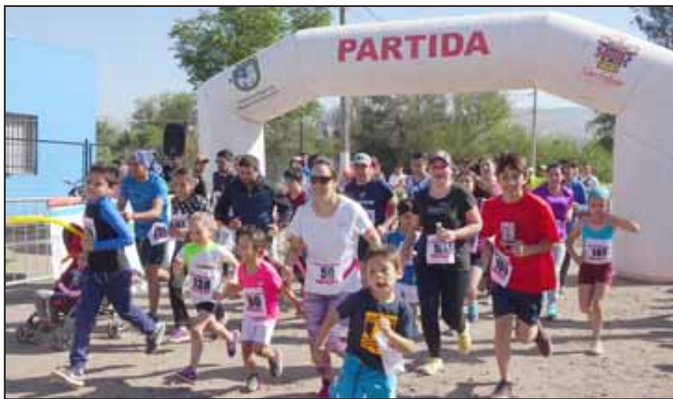
La Tercera corrida organizada por Depto. Deportes y Mesa Promoción de la Salud tuvo su punto de partida y meta en la Villa Bernardo Cruz, donde participaron más de un centenar de personas.

Por otra parte, entre el viernes 13 y el domingo 15, se llevó a cabo el campeonato de vóleybol damas 'Copa Aniversario Liceo Bicentenario Cordille-