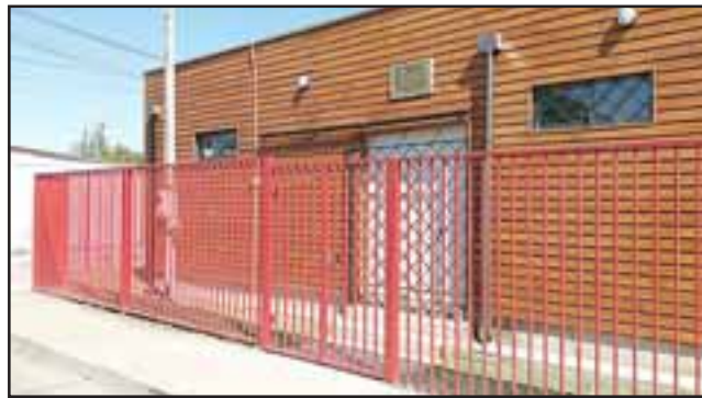
Tras varios meses de retraso, hace pocos días se entregó la recepción definitiva de este inmueble para que los vecinos de Población Juan Cortés puedan hacer uso de su nueva sede social.