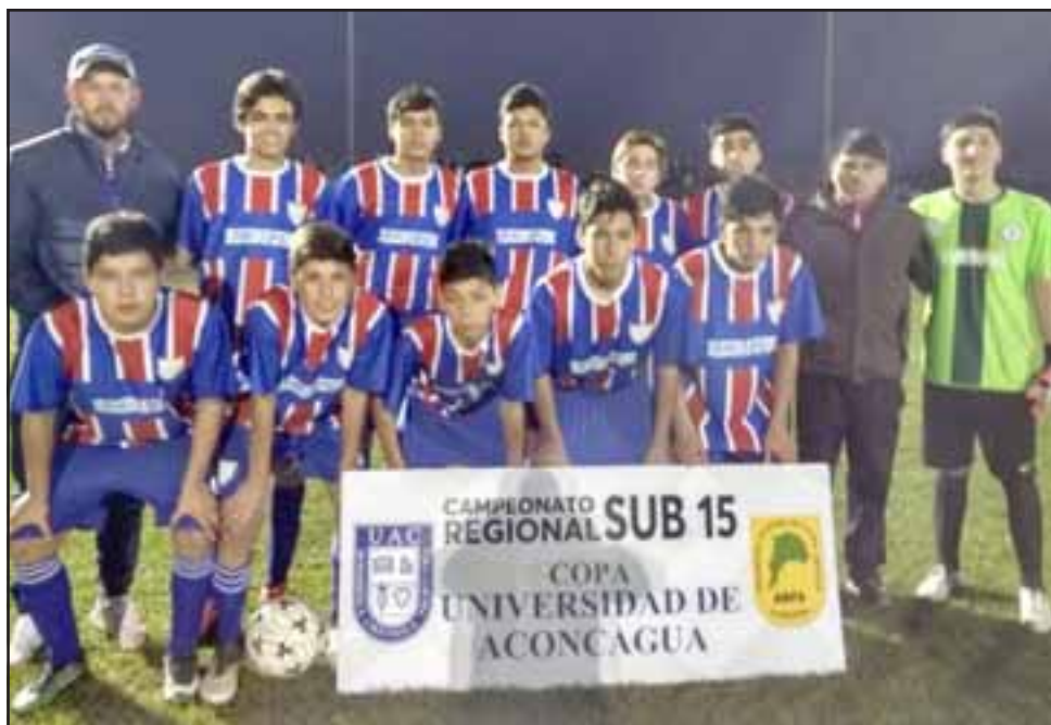
La selección de Catemu cayó por 2 goles a 1 en su visita a Villa Alemana.