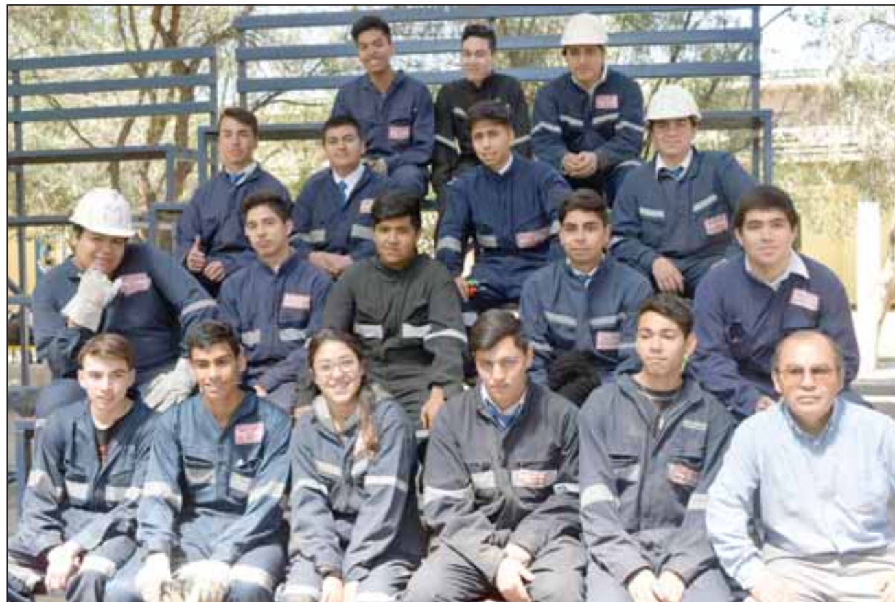
UN EQUIPAZO DETRÁS DE TODO. - Ellos son los jóvenes de la Industrial que ayer lunes preparaban los módulos para estas II Olimpiadas de Habilidades Técnicas WorldSkills 2017.