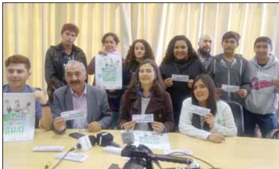
Alcalde de San Felipe, Patricio Freire, acompañó a jóvenes del consejo consultivo de la comuna en el lanzamiento de campaña contra la discriminación.

campaña: “Hay una visión de respeto y eso es importante, tal como dice el slogan, aunque seamos de generaciones distintas el respeto tiene que ser mutuo, también en lo que se refiere a otro tipo de diferencias, cada persona es distinta y no siempre se piensa lo mismo, pero siempre nos tenemos que respetar”, concluyó el jefe comunal.