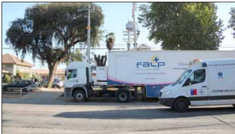
La iniciativa se realizará los días 19, 20 y 21 de octubre. Las mujeres interesadas deben inscribirse en el Centro de Salud Familiar Valle de Los Libertadores de Putaendo.

La iniciativa está destinada a mujeres desde 50 a 69 años, que pertenezcan a Fonasa y que no se hayan realizado el examen en los últimos tres años. También pueden acceder damas de 35 años o más que tengan antecedentes familiares de cáncer de mamá y no se hayan hecho mamografías en el último año. Desde el Cesfam Valle de Los Libertadores ha-