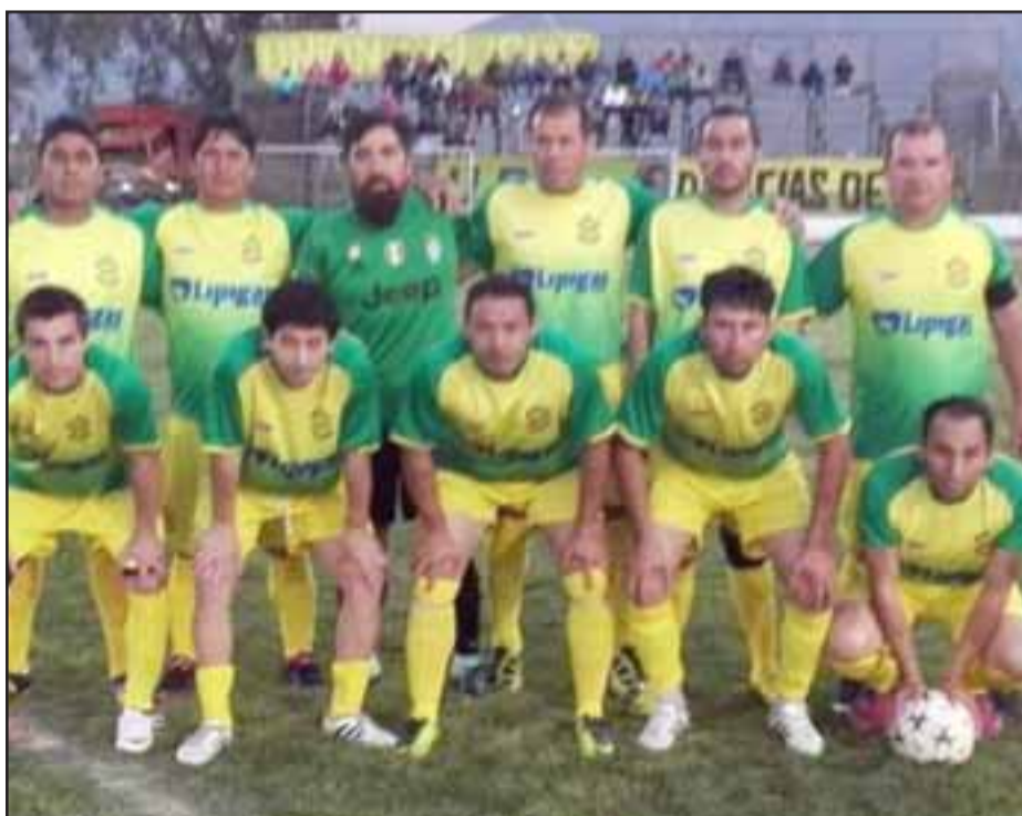
Unión Delicias partirá como local la llave clasificatoria del Regional Sénior frente al Cóndor de San Antonio.