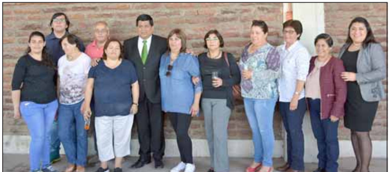
Autoridades junto a dirigentes y vecinas del sector durante el acto de firma de traspaso del terreno.

SECRETARIO(S) JUZGADO DE LETRAS DE SAN FELIPE.