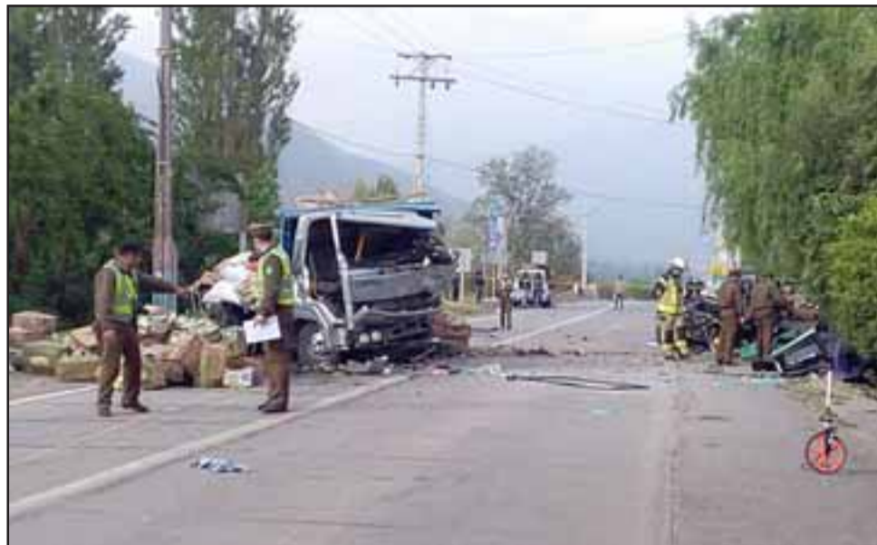
La imagen habla por sí sola y da cuenta de la magnitud de la tragedia que cobró cuatro vidas la madrugada de ayer en Calle Larga.

los cuatro fallecidos son ocupantes de la SUV y el herido grave corresponde al conductor del camión, “pero la hipótesis que se baraja es un manejo en estado de ebriedad, no obstante que todo se está investigando”.