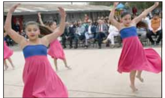
PEQUEÑAS ARTISTAS. - Las niñas de esta escuela sanfelipeña mostraron su dominio artístico frente a los invitados y autoridades de nuestra comuna.