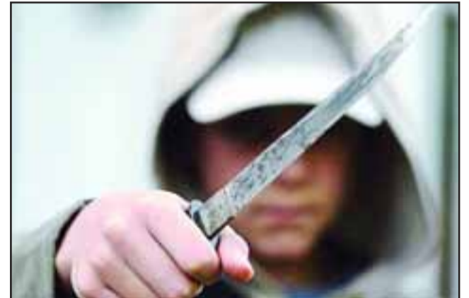
Los adolescentes intimidaron con cuchillas y agredieron a golpes a una comerciante en la comuna de Llay Llay. (Foto Referencial).

Dos menores de 15 años de edad fueron capturados por Carabineros de la comuna de Llay Llay para ser formalizados en tribunales por este delito.