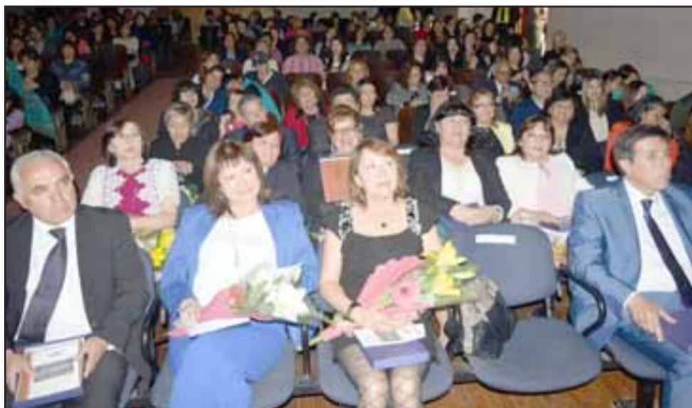
DÍA DEL PROFESOR. - La Gala se desarrolló en el Teatro Roberto Barraza del Liceo Roberto Humeres, la tarde de este martes dentro del marco del Día Nacional del Profesor 2017.