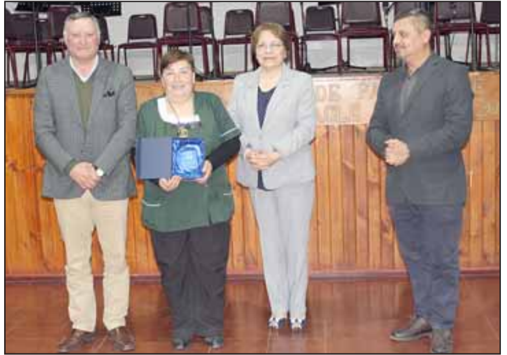
En total fueron 21 los estímulos entregados a docentes, asistentes y otros de los distintos colegios de Panquehue.

«Como alcalde, tiene un valor muy especial hacer un reconocimiento a aquellos docentes que se han destacado por sus años de servicio, desempeño que se traduce en la entrega que han hecho por mejorar la educación, por lo mismo, creo que no es menor que las autoridades realicen este reconocimiento en vida, sobre el trabajo de cada uno de los docentes. Desde que asumí como alcalde en el año 2008, una de mis prioridades fue mejorar la educa-