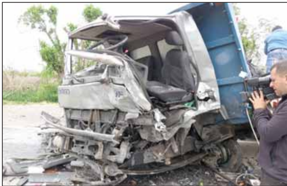
Pese a la mayor envergadura del camión, la violencia del impacto igualmente causó estragos en el vehículo de carga.

Añadió que al menos dos de las víctimas fatales son oriundos de Quillota y se encontraban en la zona por razones laborales.