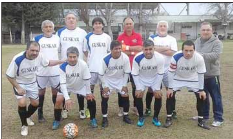
Con su triunfo sobre Tsunami, Santos escaló un lugar en la tabla de posiciones de la Liga Vecinal.