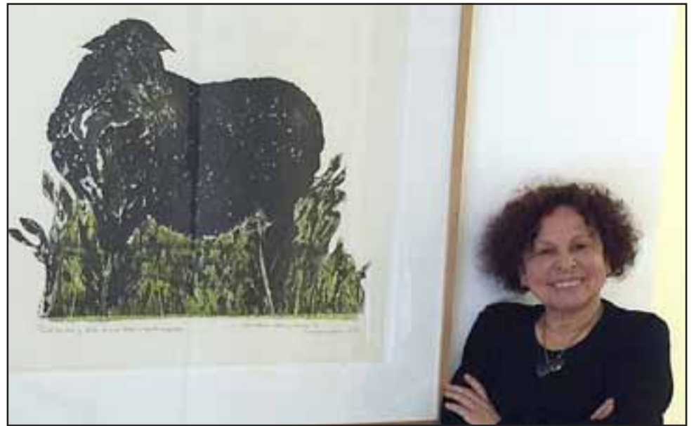
SIEMPRE VIRGINIA .- Aquí tenemos a la artista mostrando uno de sus grabados.

Las obras se inspiraron en la naturaleza de nuestra región, desde mar a cordillera, y responden a las técnicas de litografía, principalmente, como de xilografía, metales y otras. Los exponentes, quienes acompañan a la artista natural de Los Andes, son exalumnos y ahora colegas.