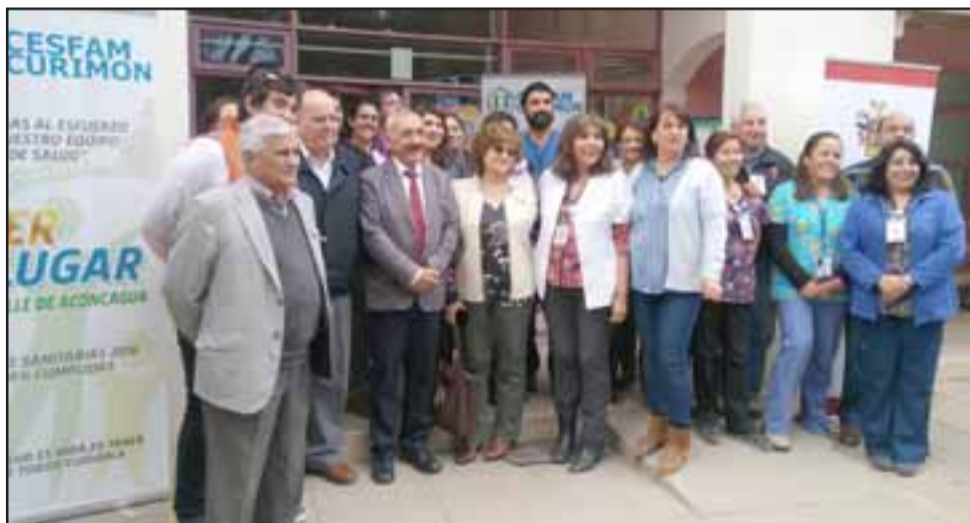
Alcalde de San Felipe, Patricio Freire, junto al equipo de trabajo del Cesfam Curimón.