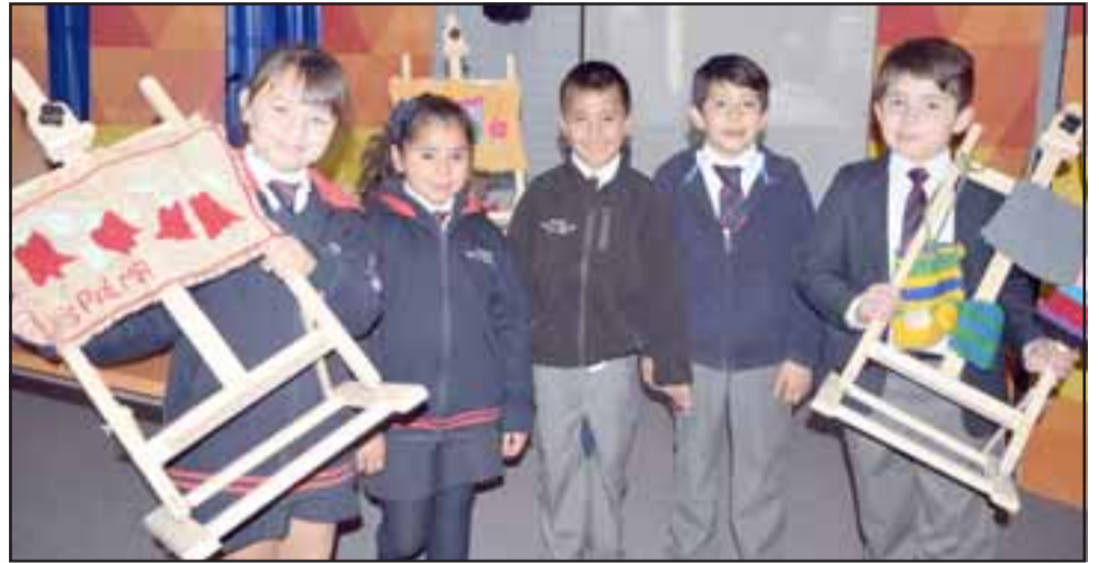
HOMENAJE A VIOLETA. - Estos pequeñitos muestran a Diario El Trabajo sus trabajos en arpilleras, en honor a Violeta Parra.