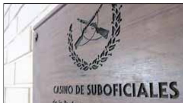
Cocineros y garzones podrán incorporarse a la planta de Carabineros como funcionarios de Apoyo Logístico, debiendo postular a una de las 30 vacantes disponibles para el cargo de 'Ranchero'.

Asimismo, según informó el Departamento de Reclutamiento y Selección de Carabineros, los oponentes deben provenir de la vida civil, tener salud compatible con la labor a realizar,