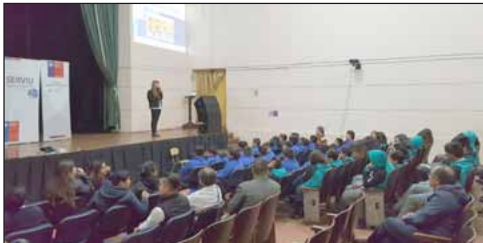
En el marco de la construcción de ciclovías en la comuna, Conaset, Serviu y el municipio incentivan su buen uso y entregan consejos de seguridad.

El ciclo de charlas contempla la realización de tres jornadas más con diversos actores de la comunidad de San Felipe.