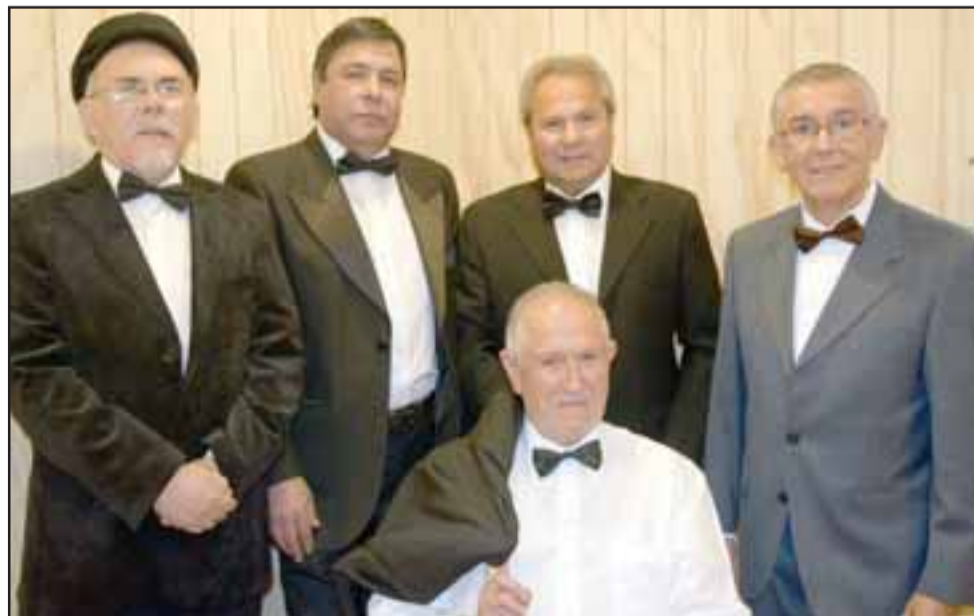
SIEMPRE THE STRIKERS. - El cierre magistral estuvo a cargo de los tremendos The Strikers , experimentados músicos de La Nueva Ola, ellos lograron envolver con su ritmo cada rincón del teatro y corazones de los presentes.