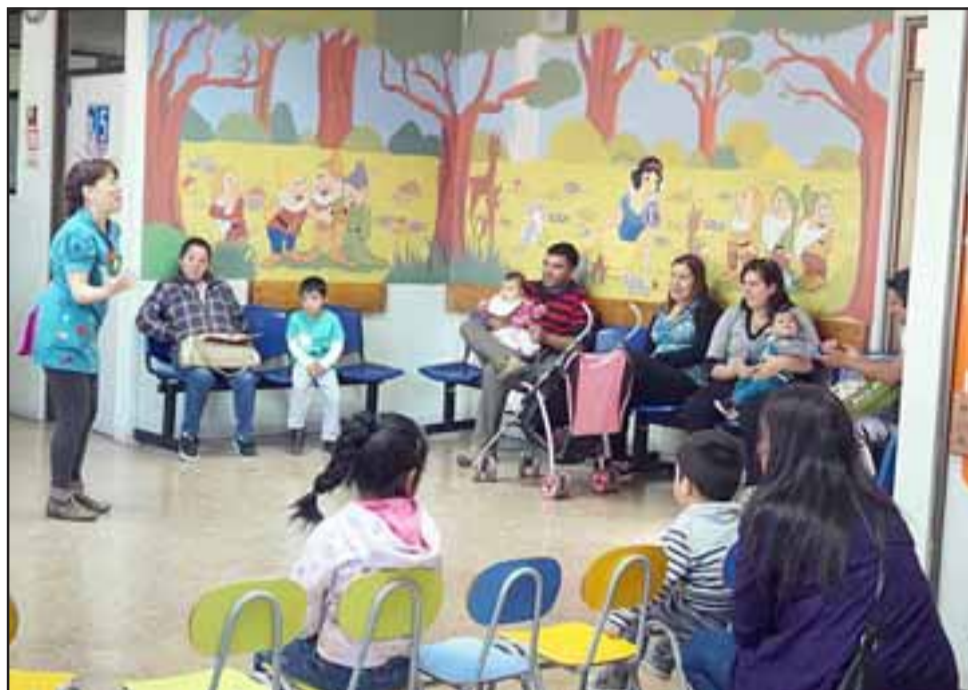
Mucho más agradable y placentera se vuelve la espera cuando la ‘Cuenta Cuentos’ comienza a relatar sus historias al público del Hospital San Camilo.

finalizará con un taller abierto al público, el cual tendrá como objetivo entregar herramientas para contar historias a personas de diferentes edades.