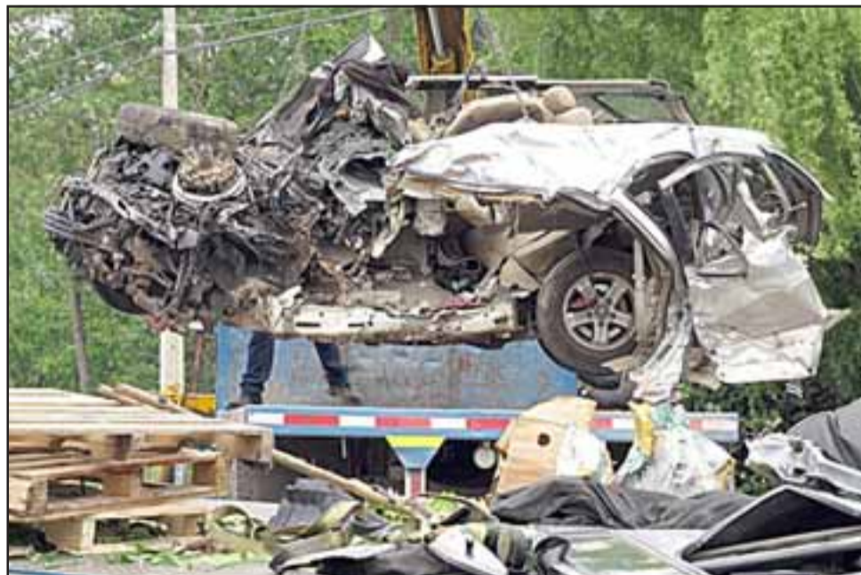
La Suv Kia Sorento resultó prácticamente desintegrada en el costado izquierdo, donde recibió la mayor fuerza del impacto.