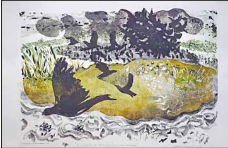
HUMEDAL .- Esta obra se llama Humedal, como ésta, la profesional nos presentará otras excelentes propuestas esta tarde.