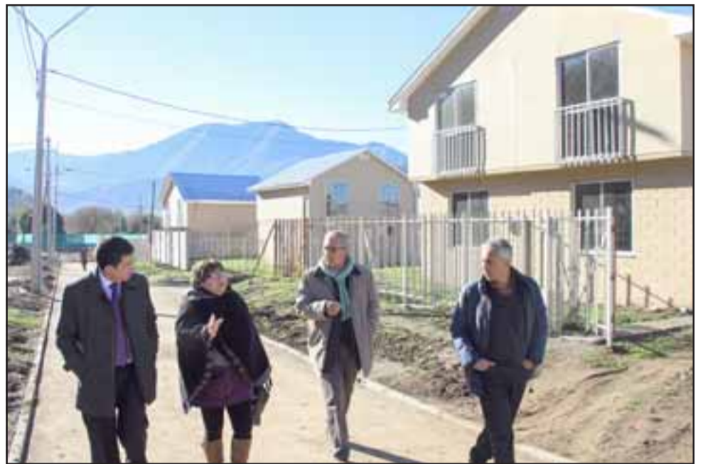
La Villa San José de la Dehesa se encuentra prácticamente terminada, con un avance del 99,66 por ciento, obras que quedaron paralizadas y que hoy podrán reanudarse.

Recordemos que este proyecto habitacional quedó con obras inconclusas por insolvencia económica de la empresa constructora,