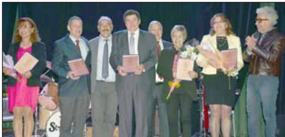
UNA VIDA DE TRIUNFOS. - También otros profesores sanfelipeños fueron premiados por sus amplias trayectorias en el mundo de la Enseñanza.