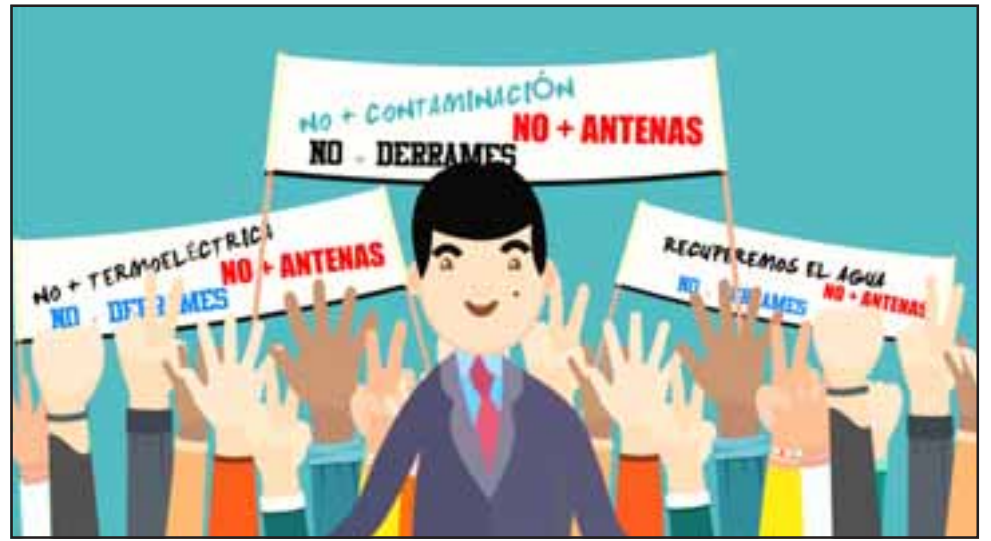
El video del diputado Urizar puede ser visto en la página web del parlamentario: www.urizar.diputado.cl

mos querido hacer algo entretenido y de fácil llegada a los electores, los grandes impresos con muchas páginas llenos de cifras y frases para el bronce la gente en su mayoría ni siquiera los mira, es una gran cantidad de material que se va directo a la basura, por ello hicimos este comic colorido y también con contenido que llame la atención de las personas, en el que en vez de la típica foto del candidato, aparezco convertido en un dibujo que va mostrando mi historia, trayectoria y parte de mi gestión".