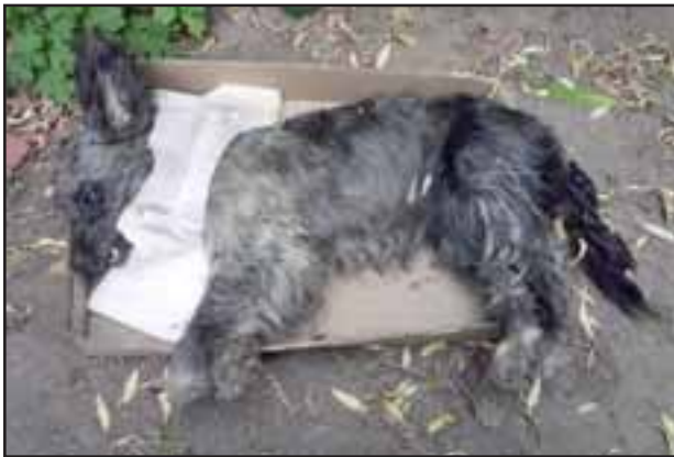
FOTO DENUNCIADA.- Una grave situación es la que se está generando en Calle La Troya, sector Casas Chicas de Quilpué, luego que aparecieran varios perritos envenenados en las cercanías de un Paking. Según denunciaron algunos vecinos, estos animalitos, callejeros y domésticos, están perdiendo la vida por envenenamiento.