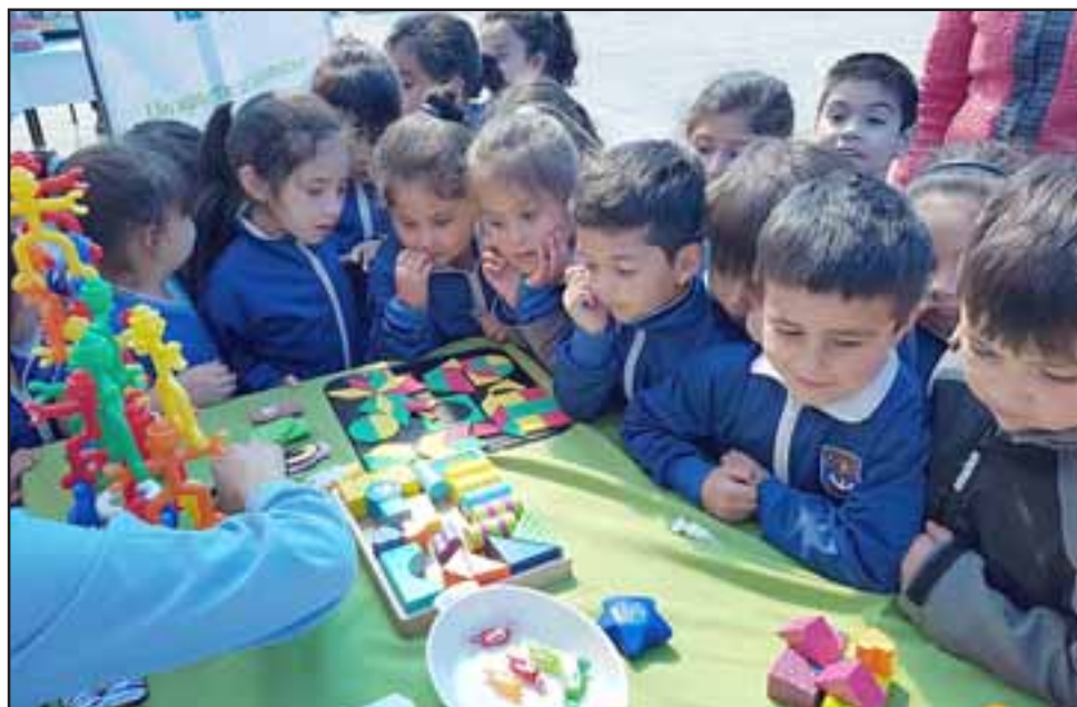
Esta actividad contó con la colaboración de diferentes instituciones como Senda, Lipigas, Habilidades para la vida (I y II) y Cesfam Curimón.

públicas, las que destacan el constante apoyo de Senda y Cesfam de Curimón, mismas que además a partir de este año son parte de la alianza formada a través del Proyecto Aulas de Bienestar. Por último, los programas comunales de Habilidades para la Vida y Psicosocial del Daem, quienes frecuentemente están presentes en nuestro quehacer educativo ayudándonos a prevenir enfermedades de tipo laboral y escolar, permitiendo de esta forma una salud integral no solo de los niños sino también de toda la comunidad educativa», puntualizó Donoso.