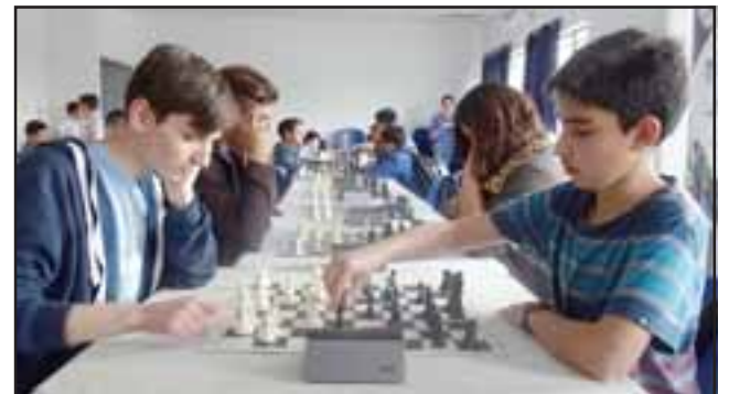
El viernes pasado se realizó en la Universidad de Aconcagua el primero de tres torneos de ajedrez en el que participaron más de 60 estudiantes de diversos establecimientos escolares.