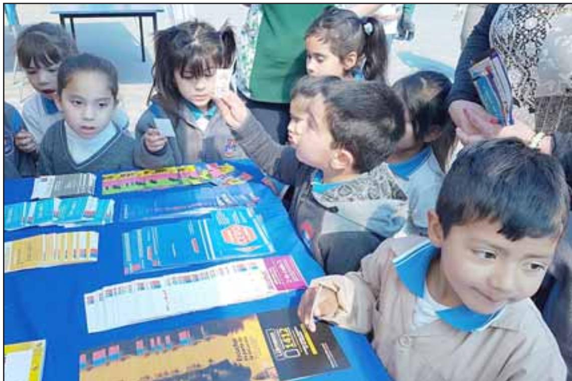
El pasado fin de semana se desarrolló la 4ª Feria Preventiva en la Escuela Carmela Carvajal de Prat, de Curimón, con el objetivo de sensibilizar a la comunidad educativa en torno a la necesidad de prevenir diversas problemáticas.

Según lo explicó la profesional, «estas instituciones privadas y públicas se comprometen activamente, deteniendo un día sus labores para presentar en el patio de nuestra escuela los protocolos de actuación frente a un riesgo o vulneración, es el caso de las instituciones