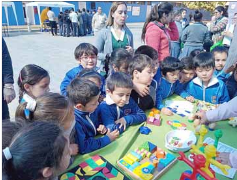
Estas actividades están dirigidas a prevenir situaciones en las que los niños eventualmente puedan entrar en contacto con el licor, el cigarrillo y otras drogas.