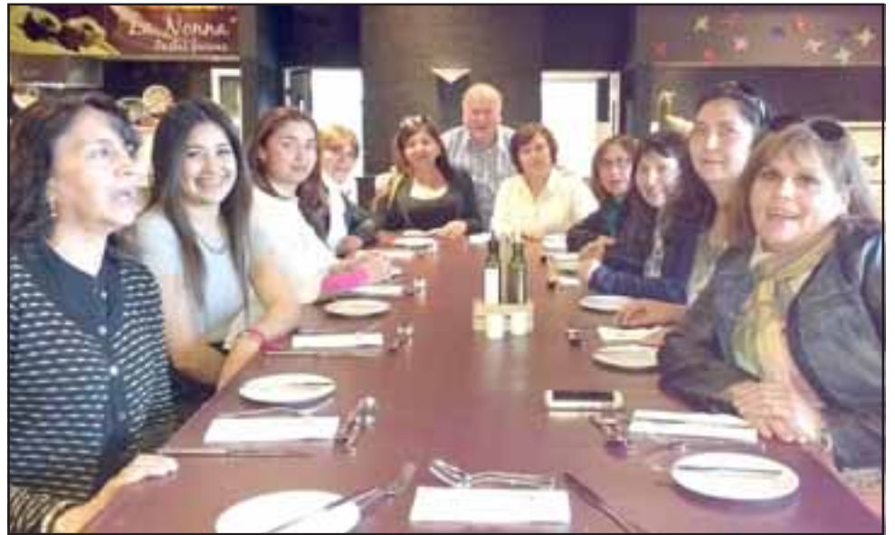
BUEN APETITO.- Profesores de la Escuela Especial María Espínola disfrutaron de un ameno Tenedor Libre en Enjoy Santiago.