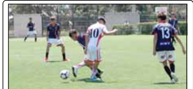
Productiva fue la fecha para las fuerzas básicas del Uní Uní ante Deportes Copiapó.

otras actuaciones individuales convirtieron a Aconcagua Trail Running en el club más ganador del evento al conseguir 15 preseas.