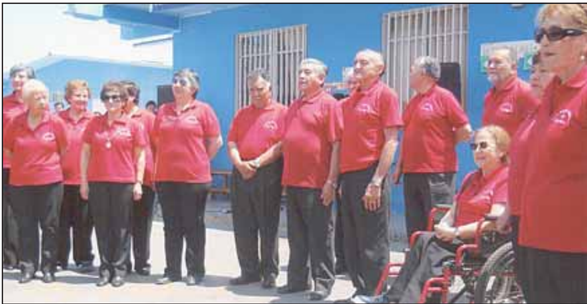
CORISTAS DE VIAJE.- Aquí vemos a estos viajeros coristas por tierras del norte de nuestro país.

La gira duró doce días y en total fueron seis las presentaciones desarrolladas en público. Roberto González Short