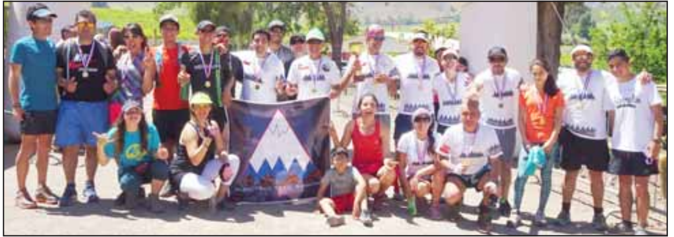
Los integrantes de Aconcagua Trail Running mostraron su felicidad por la gran cantidad de podios que consiguieron en la carrera sabatina.

El circuito preparado para esta ocasión consistió en un trazado de 7 y 10 kilómetros, que se caracterizó por su dificultad técnica, cosa que los competidores agradecieron, ya que fueron exigidos al máximo de sus capacidades para poder conseguir el objetivo de subir al podio, como era el caso de los avezados, o simplemente poder terminar la carrera, que era lo que bus-