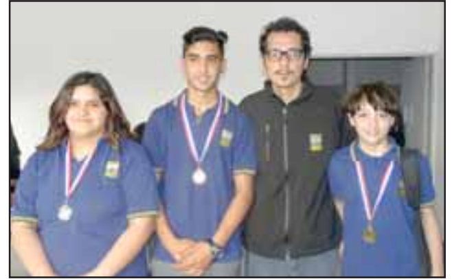
Alumnos del Liceo San Felipe obtuvieron el primer lugar en categoría 10 a 12 años, y el 3° y 4° en categoría 13 a 18 años.