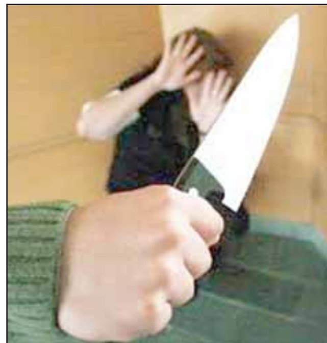
El agresor fue sentenciado a la pena de tres años de cárcel tras apuñalar a su pareja a principios de este año en la comuna de Panquehue. (Foto Referencial).

Cabe señalar que el sentenciado permanece en prisión preventiva desde el día de los hechos, a la espera de que la sentencia quede firme y ejecutoriada. Pablo Salinas Saldías