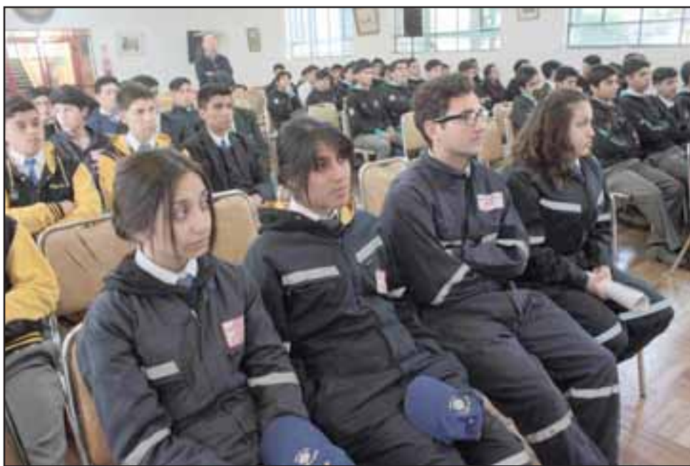
Jóvenes de las especialidades de Mecánica Industrial y Electricidad participaron de la última exposición 2017 del programa Andina más Cerca en el Liceo de San Felipe.

La actividad fue la última del ciclo de charlas 2017 en el establecimiento de San Felipe. Durante este año, profesionales de distintas especialidades de la empresa compartieron con los estudiantes sus conocimientos y experiencias laborales, en áreas como la aplicación de energía y nuevas tecnologías, seguridad al interior de las faenas mineras, transporte y carguío a nivel mina rajo abierto y subterránea, entre otras, como una forma de aportar a su formación académica.