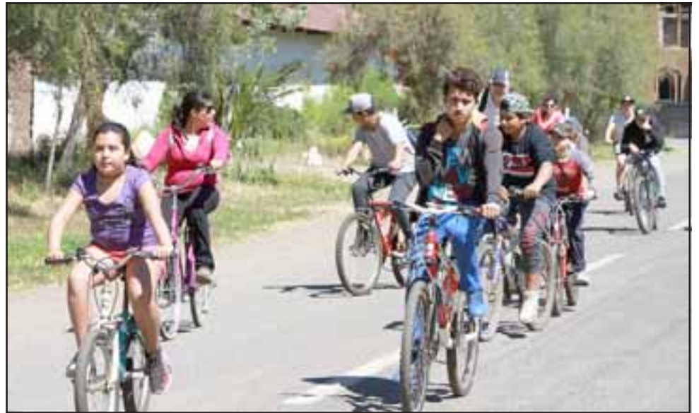
En la plaza Prat de Putaendo concluyó el recorrido que se inició y recorrió el sitio histórico de El Combate de Achupallas en Casablanca, la Capilla de El Tártaro y la Hacienda de Lo Vicuña.

El recorrido comenzó en el sector de Casablanca, específicamente en el sitio histórico de El Combate de Achupallas. Posteriormente, el pedaleo continuó hacia la Capilla de El Tártaro; después pasó por la Hacienda de Lo Vicuña y concluyó en la plaza Prat de Putaendo. En cada uno de los lugares visitados, niñas y niños recibieron una pequeña reseña histórica para iden-