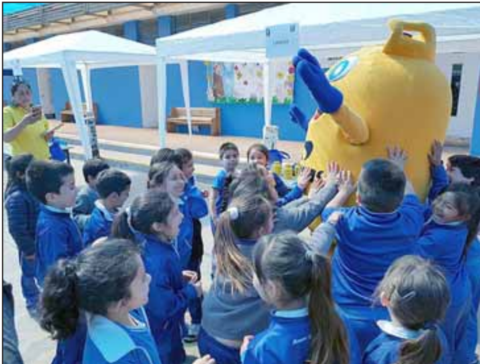
A TODO GAS.- Estos pequeñitos disfrutaron a lo grande en compañía de la mascota oficial de la empresa Lipigas durante la actividad.