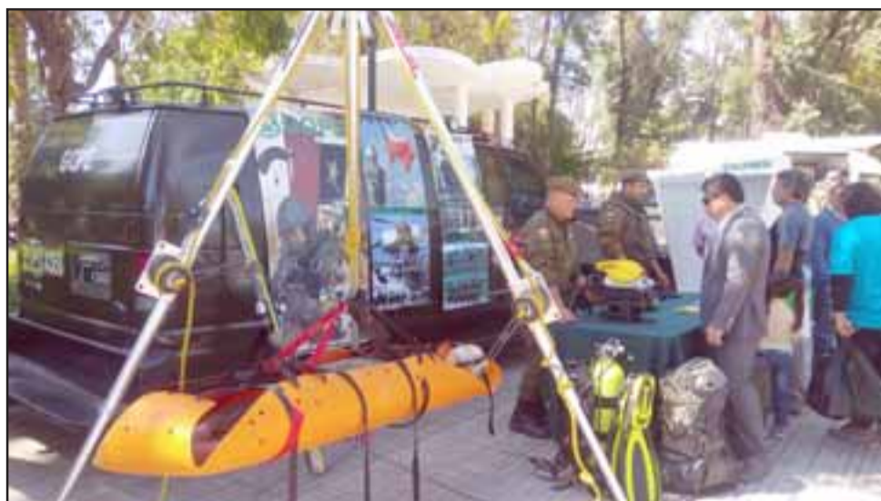
Una de las atracciones que llamó más la atención de los sanfelipeños, fue la exposición de las herramientas del Gope.

"Cuando le permitimos a los jóvenes ponerse un escudo policial, interactuar con un bastón 'Isomer', con la misma indumentaria que utilizan las fuerzas especiales, ahí le damos la posibilidad para que un joven sienta cómo un carabinero vive un procedimiento y el