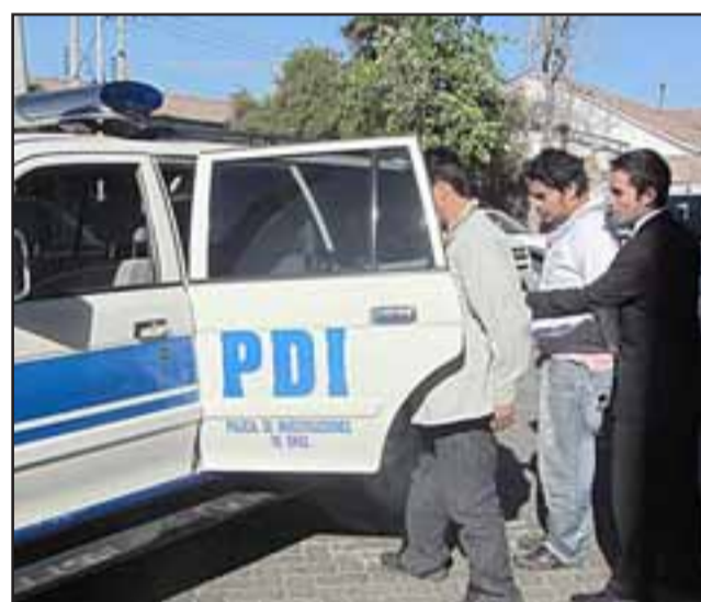
Personal de la PDI de Los Andes llevó a efecto la expulsión de ciudadanos bolivianos condenados por tráfico de drogas, quienes el año 2016 fueron sorprendidos transportando ovoides de cocaína en el interior de sus cuerpos.

Cabe destacar que lo anterior se da en el marco de un beneficio a los que pueden optar los ciudadanos extranjeros con son condenados por la justicia chilena, quienes pueden cambiar la pena de cárcel por la expulsión, y en este caso los dos bolivianos quedaron con prohibición de ingreso al país por los próximos 10 años; "pero si eso no se cumpliera y ellos en ese período vuelven a entrar, deberán cumplir sus penas de manera efectiva en los centros de reclusión de nuestro país".