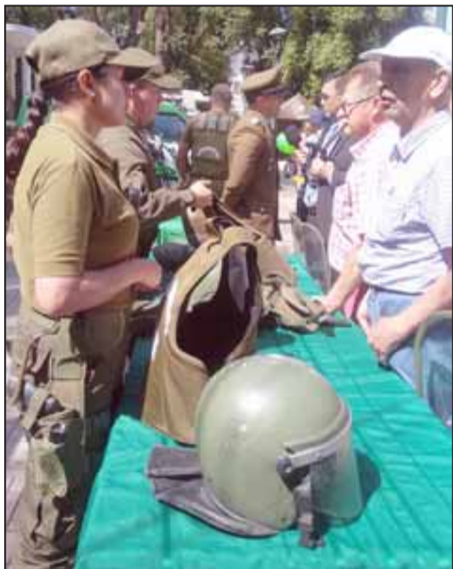
Cientos de sanfelipeños pudieron tomar la indumentaria de las Fuerzas Especiales de Carabineros: casco, escudo, bastón, chaleco antibalas, entre otras.