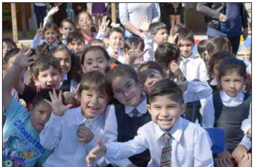
PROMESA DE VIDA.- Aquí está la chispa de la vida, estos pequeñitos sólo están esperando la gran oportunidad para arrebatar el éxito al destino.