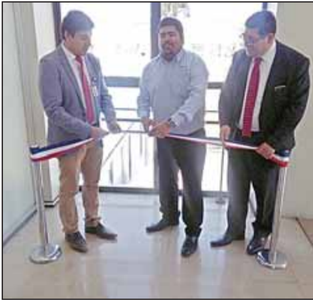
Autoridades hicieron el tradicional corte de cinta a esta nueva etapa de desarrollo de energía y medioambiente.

Montiglio sostuvo que esto es parte de una política pública que pretende llegar de aquí al año 2050 con el 70% de la matriz energética que provenga de energías renovables no convencionales.