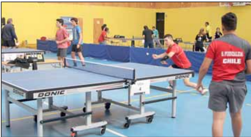
Tenimesistas de muy buen nivel se dieron cita en el Open organizado por Aconcagua Tenis de Mesa.