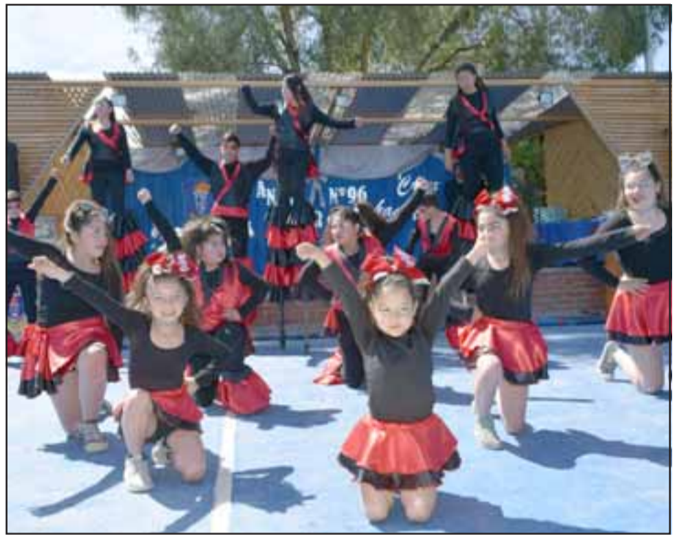
PEQUEÑOS GRANDES ARTISTAS.- Ellas son quienes dan vida al Taller de Circo-Teatro y Cheerleader estudiantil en la Escuela José Manso de Velasco.