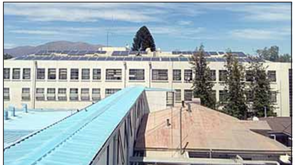
Los paneles del Hospital San Juan de Dios de Los Andes requirieron una inversión de $33.000.000, tienen una capacidad de 25 kW, lo que corresponde a un 3% de su autoconsumo, lo que les permitirá ahorrar hasta 13 millones y medio de pesos al año que podrán ser destinados a otros ítems del recinto.