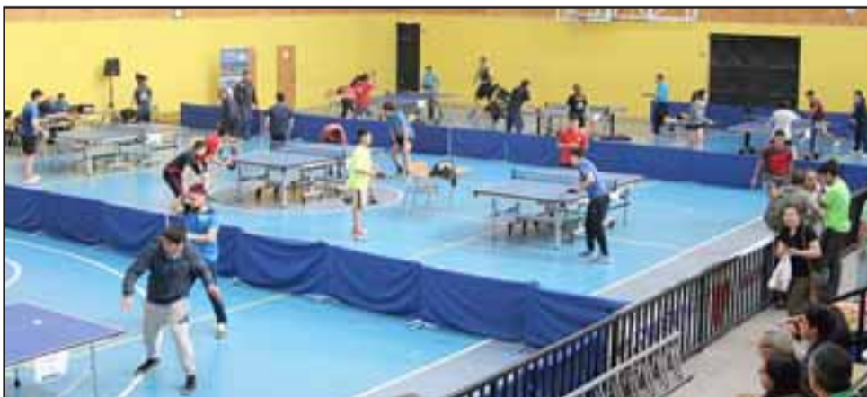
Así lució el sábado pasado la carpeta central del gimnasio del Liceo Corina Urbina.

Felices, satisfechos y muy ilusionados de cara a lo que se les vendrá para el futuro cercano, se mostraron en la interna del club Aconcagua Tenis de Mesa, luego del éxito que tuvo el Open que el sábado pasado organizaron en el gimnasio del liceo Corina Urbina, recinto al que llegaron más de un centenar de tenimesistas del país; algunos de gran calidad y con ranking nacional.