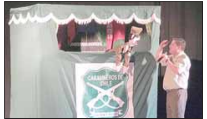
De manera lúdica los uniformados enseñaron a los pequeños el autocuidado y la normativa de tránsito.

Durante la lúdica presentación, los títeres y los mismos carabineros enfatizaron a los niños que no deben conversar ni aceptar objetos de personas extrañas, como también el respe-