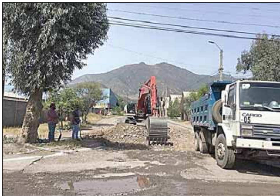
La pavimentación de la calle ya comenzó, lo cual mejorará considerablemente la calidad de vida de los vecinos del sector.

Por su parte, el Seremi de Vivienda y Urbanismo de Valparaíso, Rodrigo Uribe, destacó los recursos aprobados. «Hemos puesto el foco gracias al Pro-