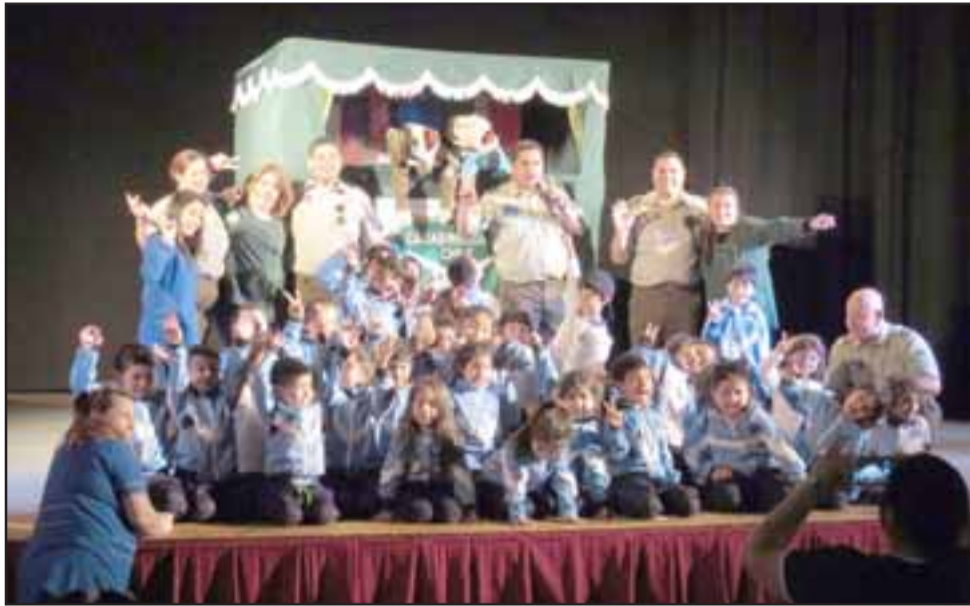
Carabineros de Llay Llay junto a los escolares en la función teatral de títeres.

Cerca de 400 escolares de diferentes establecimientos educacionales de la comuna de Llay Llay, disfrutaron de una entretenida función teatral de títeres a cargo del personal de Carabineros de la Oficina de Integración Comunitaria de esa localidad, con el objetivo de enseñar a los más pequeños el autocuidado y conocer la normativa de tránsito.