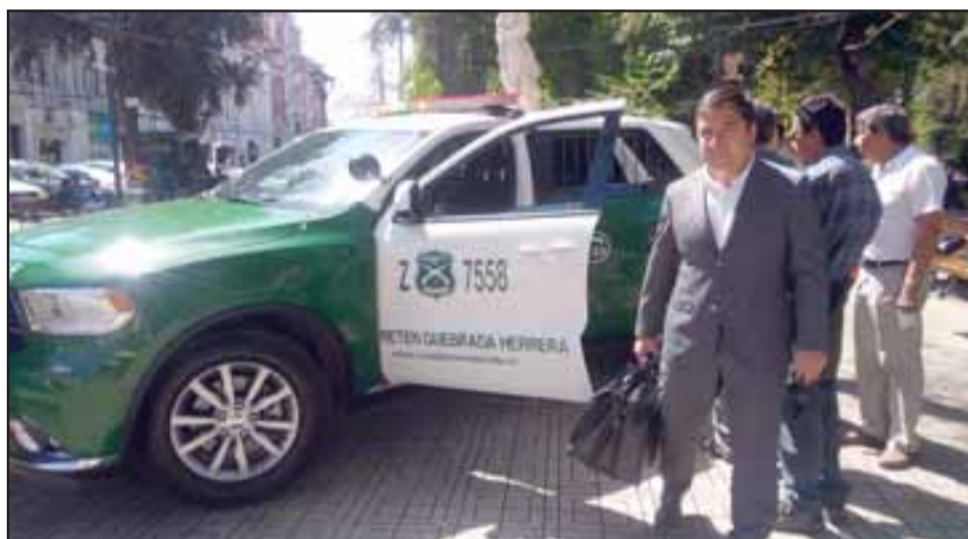
Niños y adultos pudieron conocer por dentro las modernas patrullas americanas blindadas marca Dodge.

carse a la ciudadanía y argumentó que "lo más importante es que la gente tenga contacto directo con los diferentes medios logísticos, las funciones de cada uniforme, para que tanto los padres, como los jóvenes puedan motivarse e ingresar a Carabineros de Chile", fundamentó el oficial.