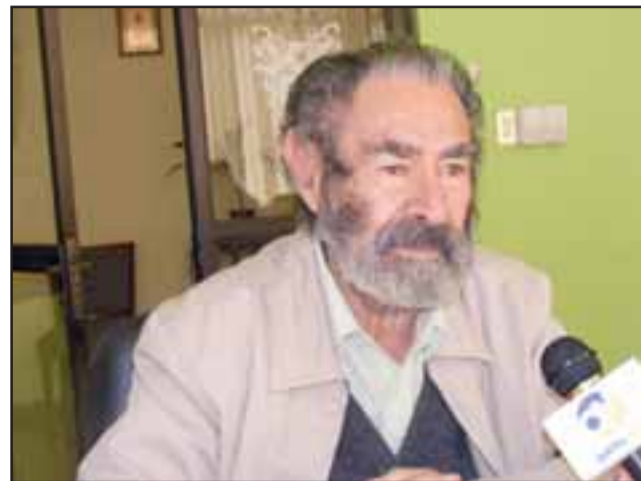
Saúl Schkolnik, el afamado escritor que fue nominado en dos ocasiones al Premio Nacional de Literatura, falleció este miércoles en su casa en Rinconada de Silva.

En 1979, Schkolnik obtuvo el primer lugar en el Concurso Latinoamericano de Literatura Infantil, certa-