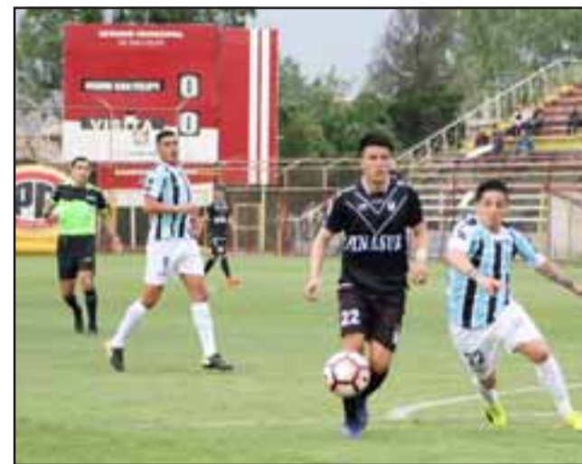
El conjunto sanfelipeño está obligado a sumar ante Deportes La Serena, ya que de lo contrario puede ver comprometida su permanencia en la Primera B.