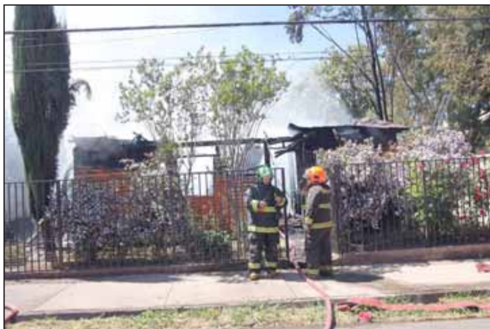
El siniestro ocurrió durante la mañana de ayer en el sector de Rinconada de Silva en Putaendo.

Momentos más tarde, controlado el incendio por parte de Bomberos, durante la remoción de escombros fue hallado el cuerpo calcinado de una persona de sexo femenino, debiendo informarse al personal de Carabineros quienes al tomar contacto con el fiscal de turno, se dispuso de las labores investigativas por parte de la PDI.