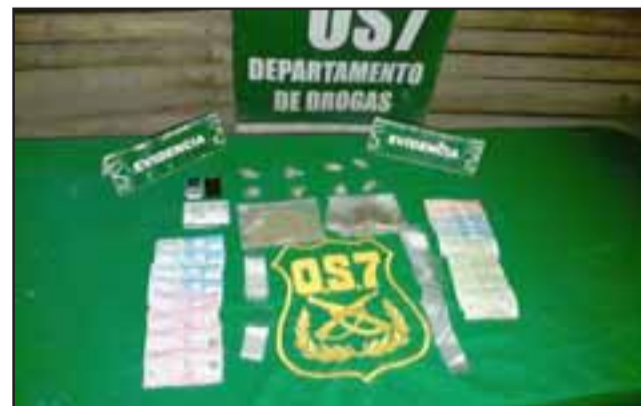
Un total de 200 dosis de drogas, dinero en efectivo y otros elementos fue el resultado del allanamiento ejecutado por el OS7 de Carabineros.

Los detenidos fueron individualizados con las iniciales M.A.M.P. (29) y N.D.B.B. (28) ambos con antecedentes penales por delitos de tráfico de drogas. Sus detenciones fueron con-