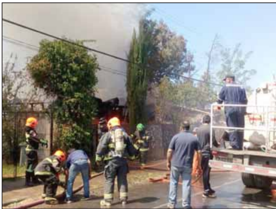
Una adulta mayor fue hallada muerta a raíz del voraz incendio controlado por Bomberos de las tres compañías de esa comuna.

Bomberos de las tres compañías concurren a controlar el incendio que se originó en la vivienda a un costado del Liceo República de Estados Unidos, cuyas llamas calcinaron gran parte de la estructura del domicilio donde se encontrarían dos adultas mayores, una de ellas habría resultado lesionada, debiendo ser trasladada hasta un centro hospitalario.