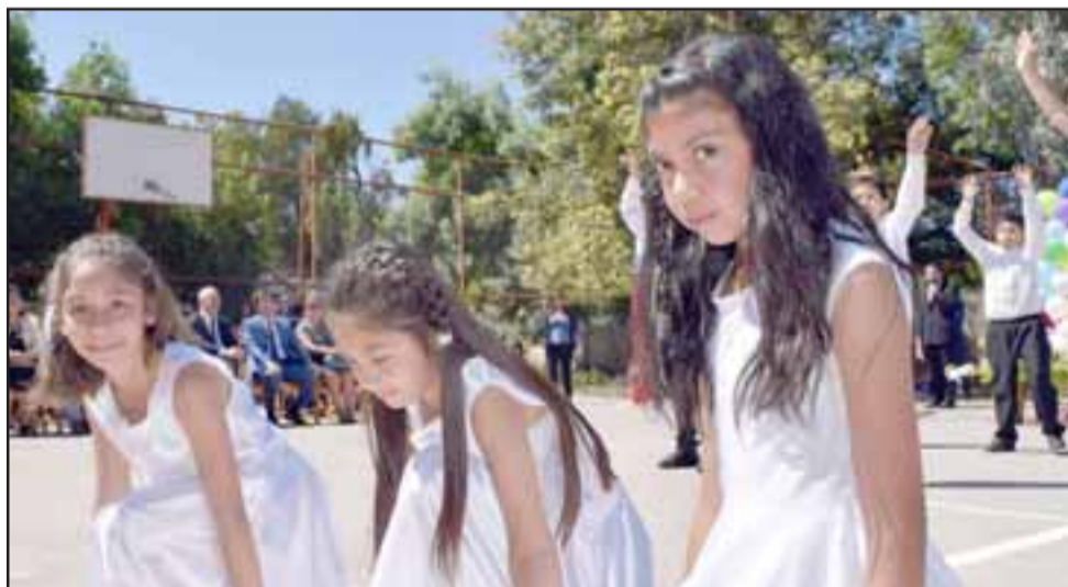
BAILARINAS POR SIEMPRE.- La inocencia y candor de estas niñas tomó gran protagonismo durante su presentación artística.