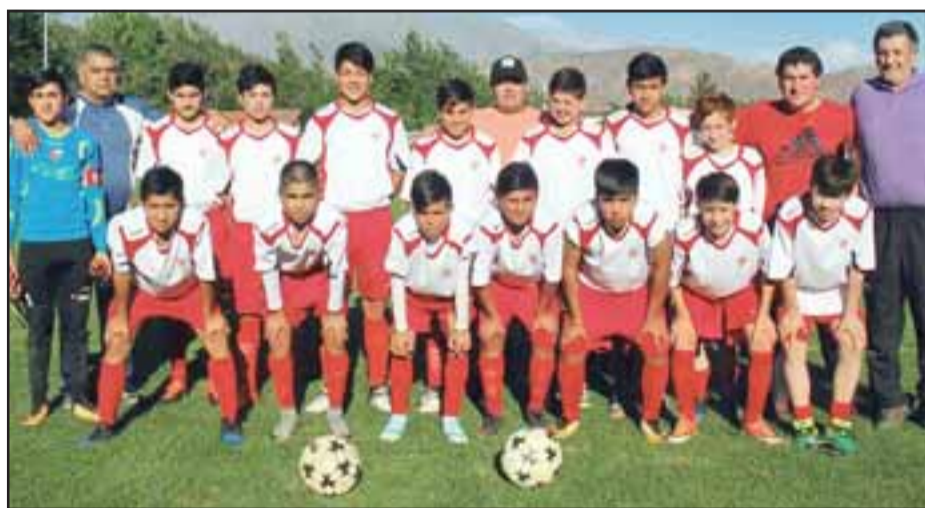
Frente a un combinado viñamarino la selección de San Felipe deberá buscar sus pasajes hacia las semifinales del Regional U13.