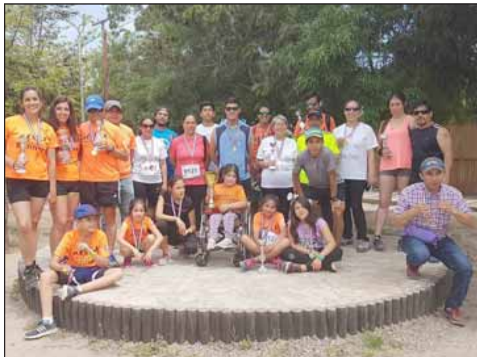
Un fin de semana muy intenso en competencias y actividades recreativas tuvo el club aconcagüino Evolution Runners.

El primer partido se jugará a las 12:30 horas en el Complejo Anfa Las Torres en Viña del Mar, mientras que la revancha quedó agendada para las 12:30 horas de este domingo en el Estadio Municipal.