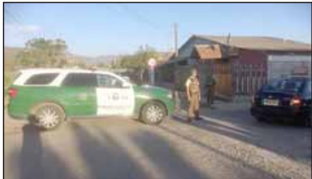
El operativo policial se ejecutó al interior de una vivienda ubicada en la Villa Nuevo Amanecer de Llay Llay la tarde de este martes.