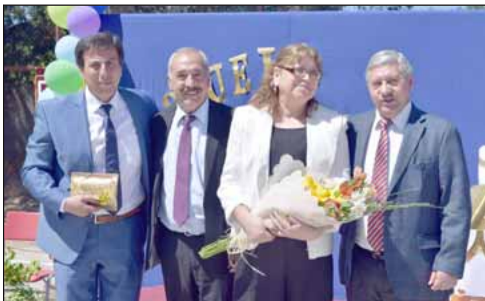
Algunos profesionales y apoderados también recibieron el homenaje de nuestras autoridades de Educación y Municipio.