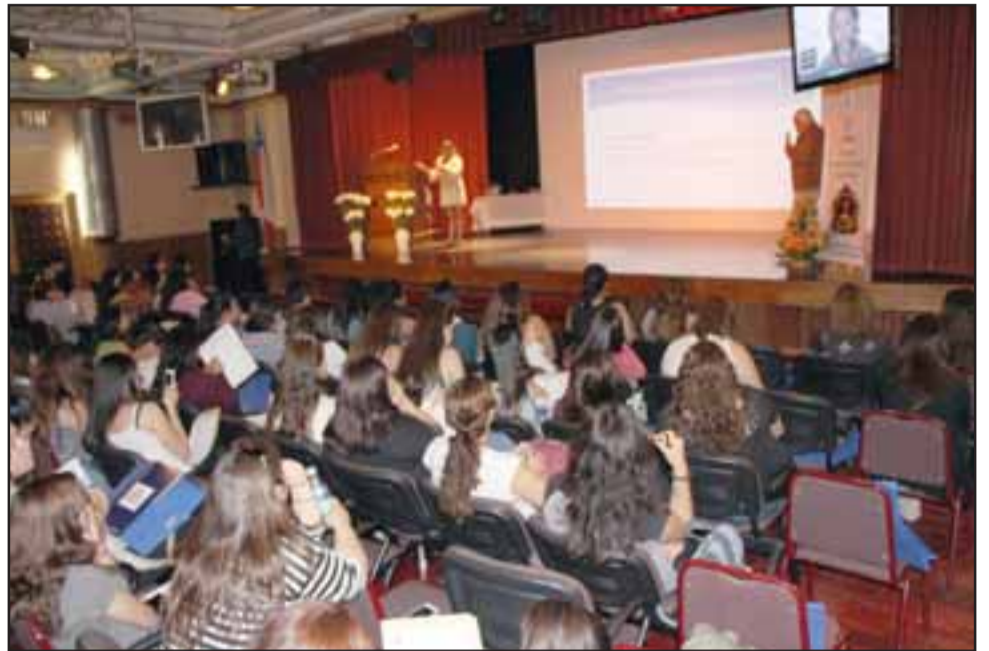
La actividad, organizada por el equipo del Programa de Integración Escolar del establecimiento, se desarrolló en el Teatro Municipal y contó con la participación de más de 100 personas.

autismo y, también, conocer diversas herramientas que permitan apoyar a los estudiantes extranjeros. «Surge desde una necesidad de poder sensibilizar a la comunidad educativa y a toda la comunidad de San Felipe con respecto a lo que es la inclusión. Este es una de las iniciativas del Programa de Integración de la Escuela John Kennedy y agradecer en primer lugar a la directora del establecimiento y a todo su equipo por hacer esta iniciativa, porque es un esfuerzo y trabajo. Estamos muy contentos que esté presente la comunidad, vemos que hay alumnos de la Universidad de Playa Ancha para que se puedan interiorizar un poco de qué es lo que ocurre en las aulas, así que estamos muy contentos de que se realice este evento», finalizó.