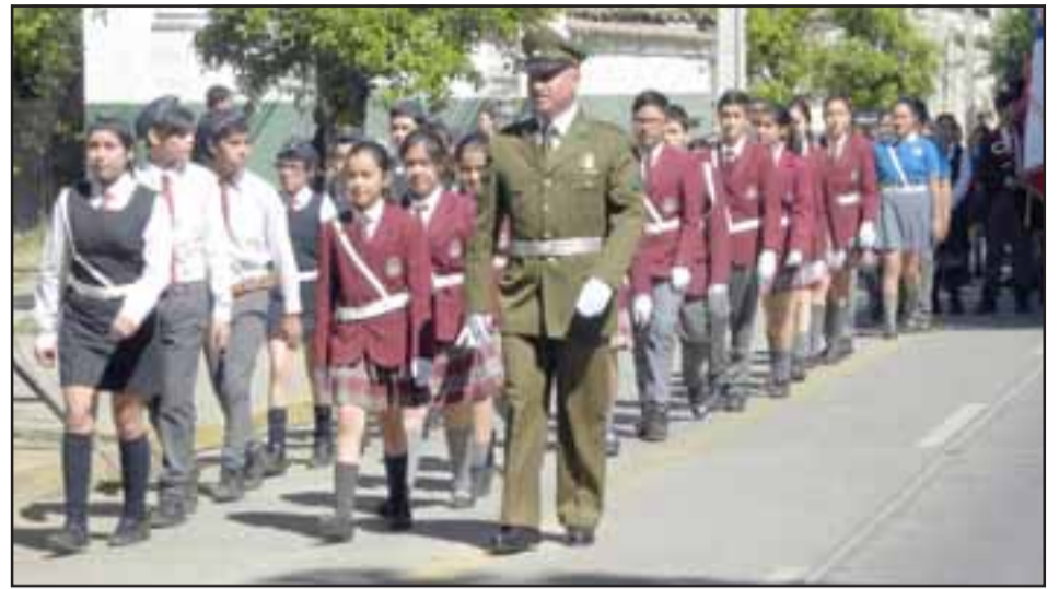
Con un llamativo desfile frente a la Prefectura de Carabineros Aconcagua se celebró el Día de las Brigadas Escolares de Tránsito.

A sólo dos cuadras de la Plaza de Armas, amplias, acogedoras, construcción sólida y nueva, dos ambientes, ideal consulta profesional. Interesados llamar a los fonos : 34-2-34 31 70 - 9 8479 5521