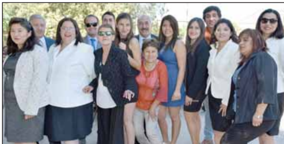
PROFESORES REGALONES.- Autoridades, profesores y asistentes de la educación posan con alegría para las cámaras de Diario El Trabajo.