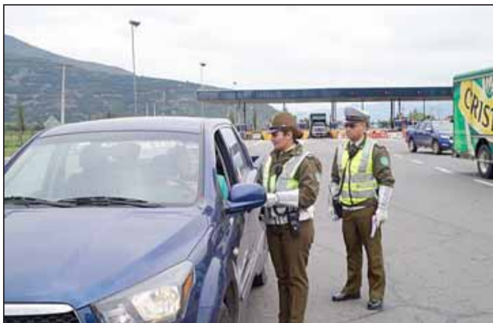
A partir de hoy jueves Carabineros pondrá en marcha el 'Plan Weekend', intensificando controles vehiculares en las principales rutas de Aconcagua.

"A contar de este jueves a las 16:00 horas comenzará el plan weekend, apostando personal de tránsito en las ruta 5 Norte, 60CH y Libertadores con la finalidad de marcar presencia policial de los puntos con-