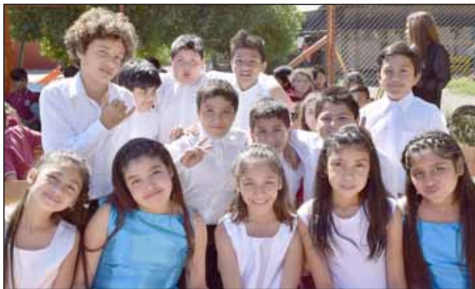
APUESTAN A LO SEGURO.- Estos jovencitos son la promesa de un futuro lleno de éxitos personales para ellos reservados por la vida.