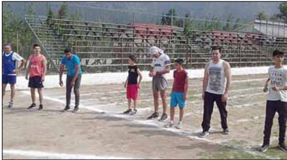
Atletas de distintas comunas de la zona central del país compitieron en el torneo que organizó el Club Atlético Infantil de Deportes de Llay Llay.

meño, que aseguró que seguirán adelante con este tipo de eventos: «Siempre se aprende y quedan lecciones; ya dimos el primer paso que muchas veces es el más difícil, así que el próximo (torneo) que organicemos será mejor y de mayor calidad, porque apostamos en el tiempo se convierta en uno de los mejores de la región y la zona central del país», finalizó.