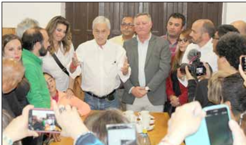
En su visita a Panquehue, Sebastián Piñera se comprometió a estudiar el proyecto de construcción del embalse de Catemu, obra que estaría perjudicando los recursos hídricos de la comuna, como asimismo fortalecer el programa de construcción de viviendas sociales.

Sobre la construcción de viviendas, argumentó que