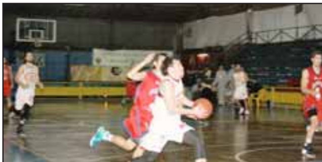
El Prat ha tenido un arranque perfecto en la Segunda División de la Liga Nacional.

Hoy cuando el reloj indique que son las cuatro de la tarde con treinta minutos, el equipo de honor del club Arturo Prat emprenderá rumbo hasta la ciudad de Los Ángeles para enfrentar a Andino, en un partido que está programado para las veinte horas del sábado.