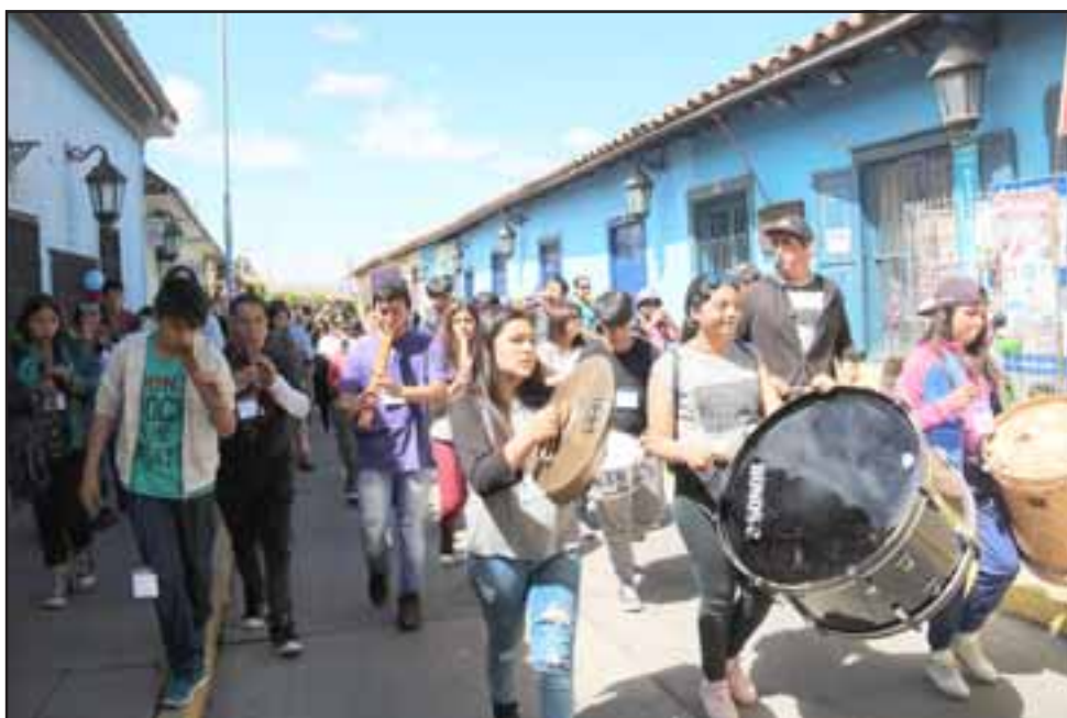
Una colorida y sonora Caravana se desplazó por Calle Comercio de Putaendo, en el inicio del 'VII Encuentro Binacional de Orquestas Latinoamericanas'.

Cabe destacar que participen orquestas provenientes de Osorno, Angol, Lanco, Valdivia, Cunco, Quilleco, Santiago, Valparaíso, San Felipe y La Serena. Además, dos agrupaciones argentinas provenientes de San Martín de Los Andes y Viedma.