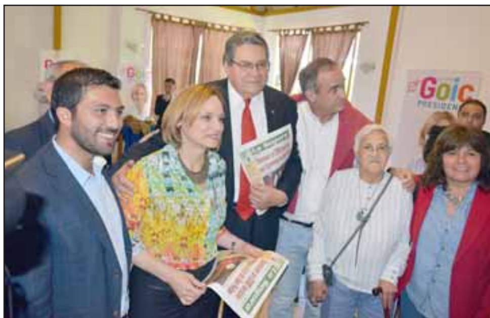
Carolina Goic visitó la comuna de San Felipe, donde expuso parte de su propuesta de gobierno.

En la oportunidad, Goic aprovechó de hacer referencia a una parte de su propuesta de Gobierno, detallando que "en materia del plan de salud, que quizás es lo más importante que tenemos en términos de responder a las necesidades de la gente, nuestra propuesta de Ley Nacional del Cáncer, de Salud Mental, de acompañamiento al envejecimiento, de fortalecimiento de infraestructura hospitalaria y también de rehabilitación", puntualizó, agre-