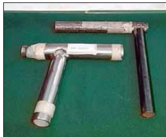
La escopeta hechiza fue incautada por Carabineros al momento de la detención del entonces imputado en el mes de marzo de este año en la comuna de Llay Llay.

Por su parte la defensa mantiene un plazo de 10 días para elevar eventualmente un recurso de nuli-