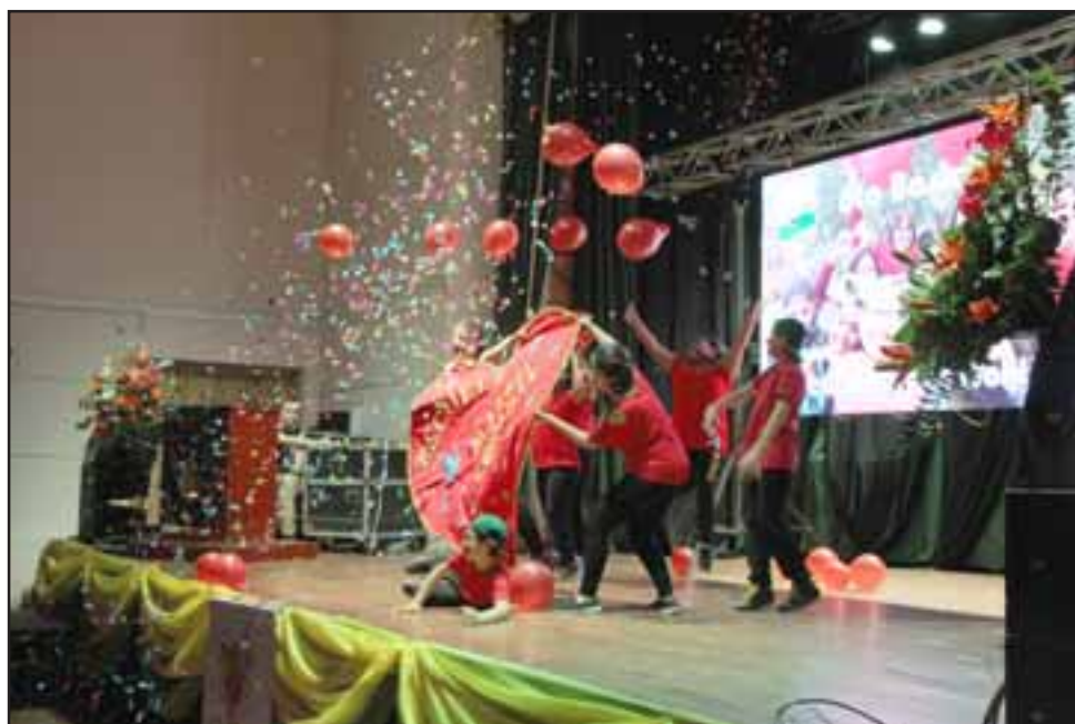
Un verdadero espectáculo constituyó el 'Festivalense', certamen musical en lengua de señas único en Chile y que además incorporó un sistema de votación del público a través de una aplicación para celulares.

«Estamos muy contentos como equipo y colegio, esto fue un trabajo de muchos meses y es un éxito total, Hemos cumplido el pri-