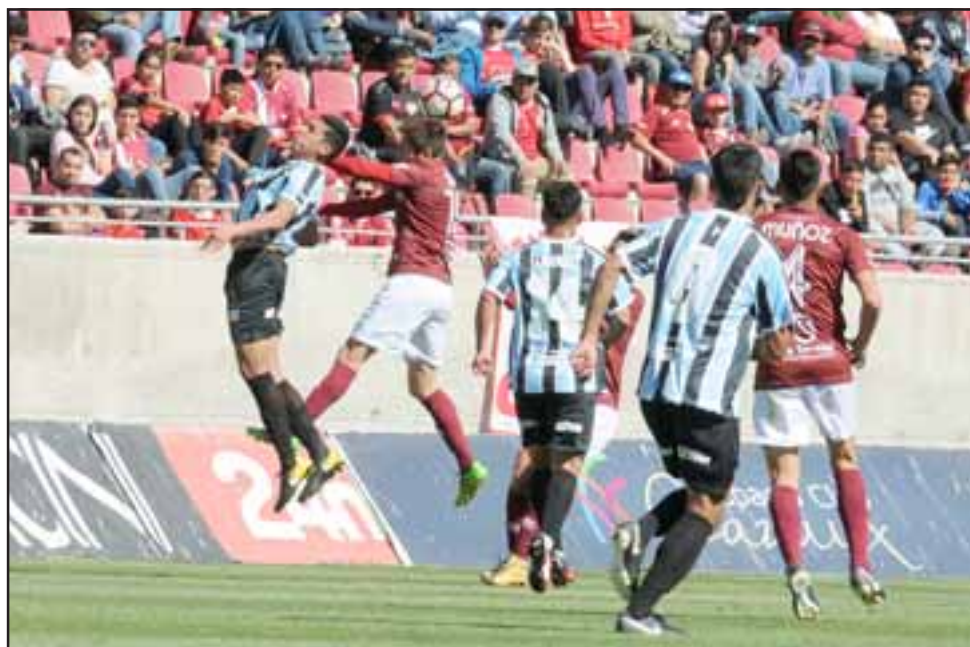
Unión San Felipe por segunda semana consecutiva jugará como visitante.