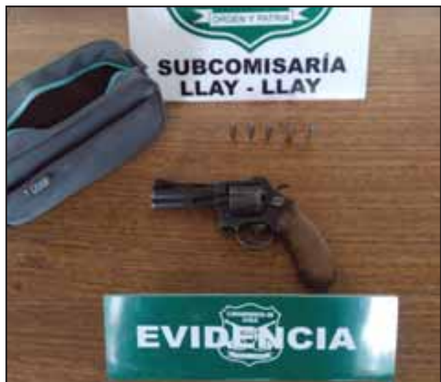
Carabineros de la Subcomisaría de Llay Llay detuvieron al antisocial manteniendo un arma de fuego calibre 38 y cinco municiones del mismo calibre.

aceptada por el Juez de Garantía fijando un plazo de investigación de 120 días. Pablo Salinas Saldías