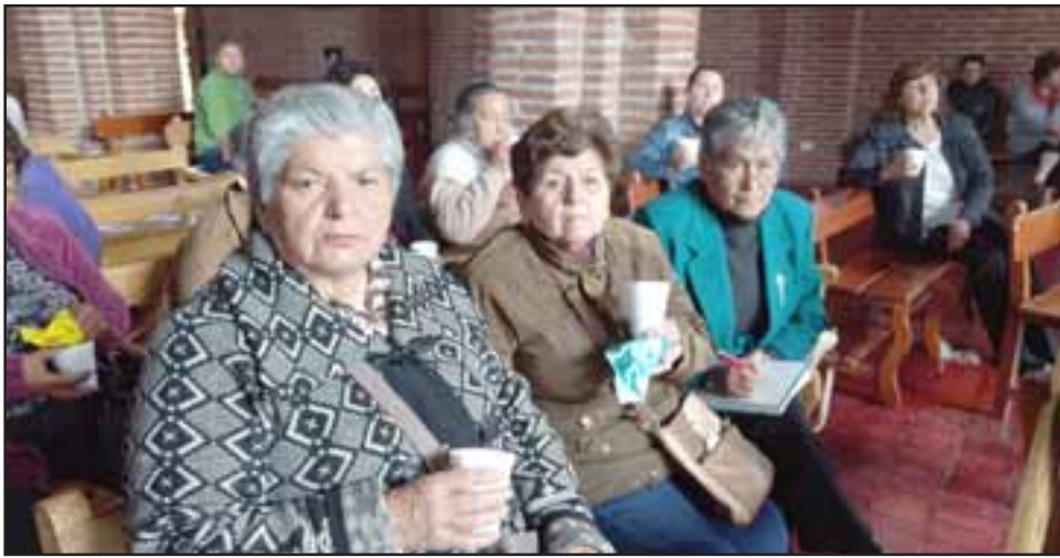
Varios adultos mayores de Putaendo asistieron a la actividad, para seguir de cerca esta importante iniciativa.