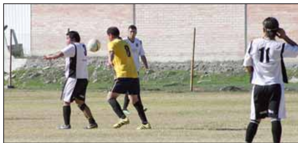
En el torneo de la Asociación de Fútbol Amateur de San Felipe se jugará la sexta fecha de la segunda rueda.

Resto del Mundo – Villa Los Álamos; Villa Argelia – Aconcagua; Unión Esfuerzo – Unión Esperanza; Barcelona – Los Amigos; Tsunami – Carlos Barrera; Santos – Hernán Pérez Quijanes; Andacollo – Pedro Aguirre Cerda.