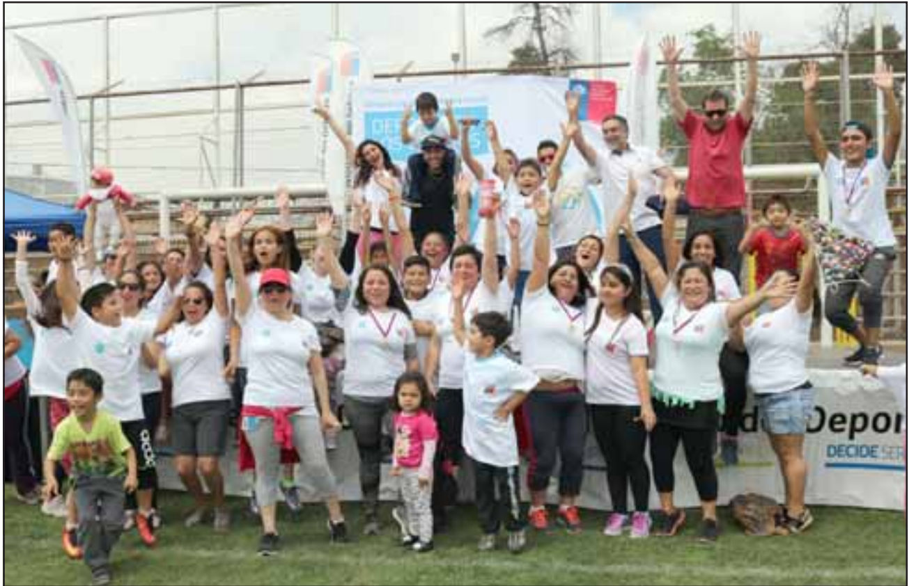
El programa 'Deporte en tu barrio' vuelve para llevar vida sana y ejercicio a los vecinos de San Felipe.