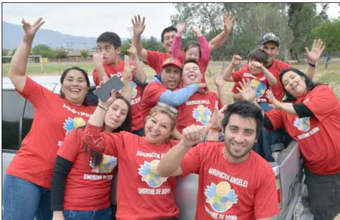
AGRUPACIÓN ÁNGELES.- Ellos son el equipo anfitrión de este 8º Encuentro Nacional de personas con Síndrome de Down.

- Nuestra agrupación Ángeles Síndrome de Down es una entidad de padres