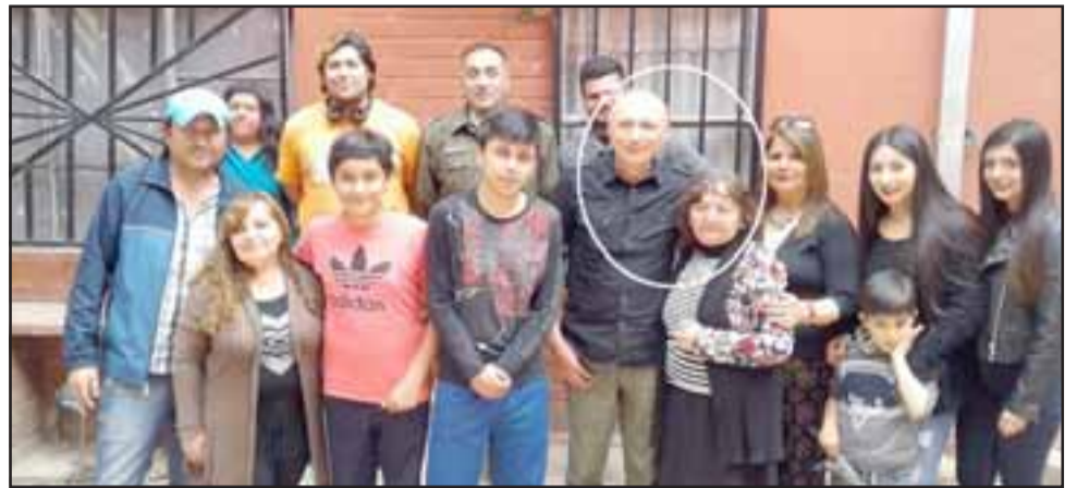
POR FIN UNIDOS. - En el círculo vemos a la madre con su hijo, después de tantos años. Les acompaña el resto de su familia.