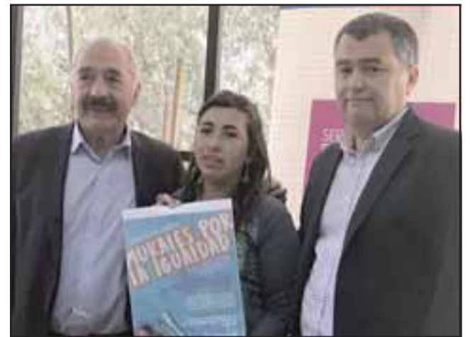
AÚN HAY TIEMPO.- Los dibujos, que deben entregarse en las dependencias del Centro de la Mujer hasta el próximo lunes 13 de noviembre, deben enfocarse en temáticas de violencia contra las mujeres.