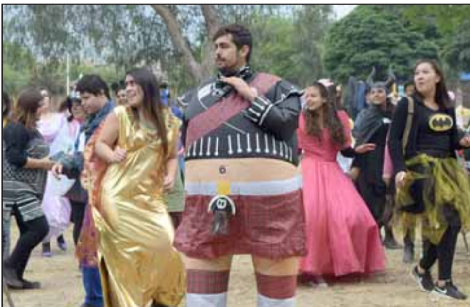
LA GORDURA ES BELLEZA. - Los más entregados, se disfrazaron a lo grande para alegrar a todos en esta actividad.

Este sábado fue la gran jornada del 8º Encuentro Nacional de personas con Síndrome de Down , actividad que dio inicio desde las 10:00 horas y terminó cerca de las 19:00 horas. Fue una actividad masiva de alta convocatoria a nivel país, pues al Estadio Fiscal llegaron agrupaciones como Alegría Down, de Santiago; Agua Marina de Viña del Mar, así como otros grupos de Ovalle, Temuco y Quilicura.