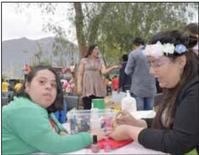
REGALONEADA. - Esta damita recibió un trato de Reina, pues hubo para ella mil atenciones y regalos especiales.