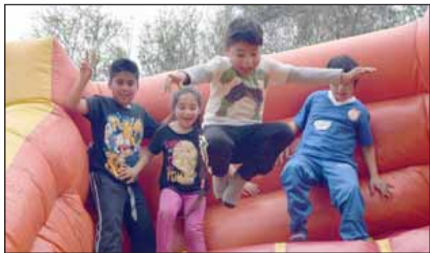
ELECTRIZANTE. - La foto no miente, los más pequeños sí que lo pasaron bien en los juegos inflables para ellos instalados.