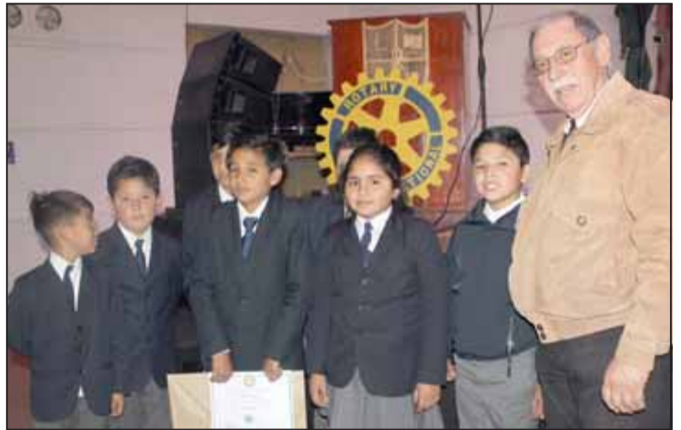
SIEMPRE ROTARY.- Peques y grandes aprendieron que todo en esta vida, por lo general, vale la pena hacerlo amigablemente.