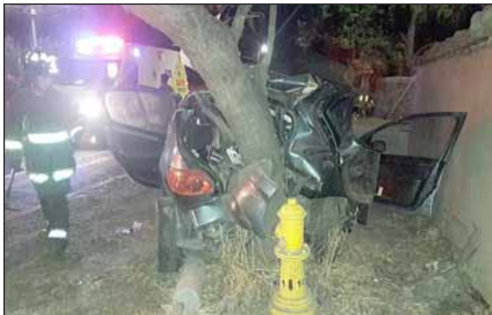
Personal de la Siat de Carabineros investiga las causas basales del trágico accidente con resultado de muerte.