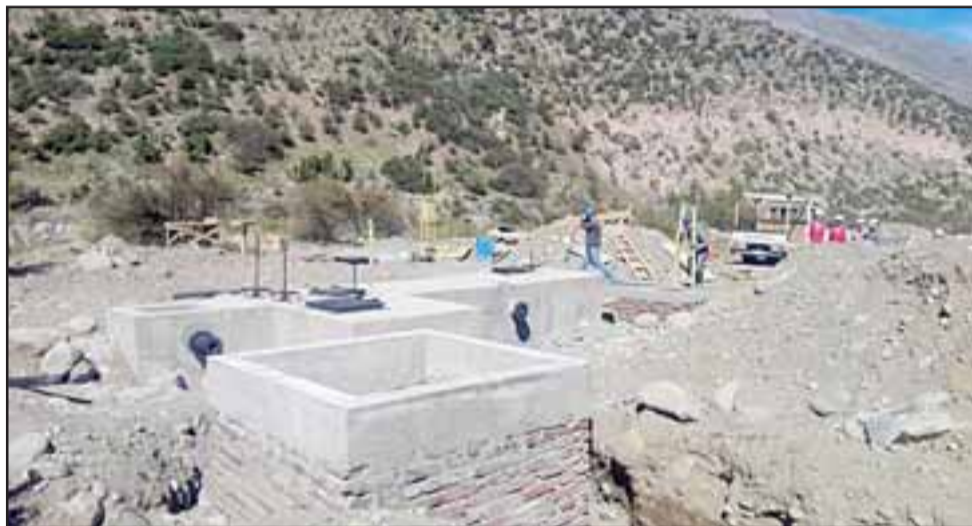
Recursos solicitados desde DOH permitirían dar una solución definitiva al abastecimiento de agua potable a la localidad de Casablanca.

«En un momento la misma comunidad reclamó que las obras que se estaban haciendo no eran las adecuadas para la decantación real del volumen que necesita esta APR, que sirve a mucha gente, entonces Obras Públicas está buscando la forma para llevar el agua desde el Rocín hacia el APR», advirtió Stevenson.