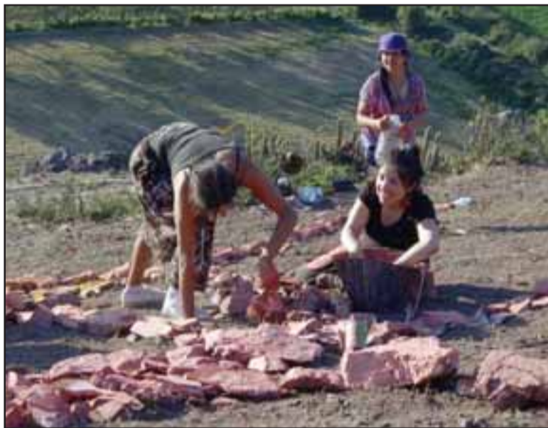
PIEDRA POR PIEDRA. - Ellos hicieron, piedra por piedra y con sus propias manos, una de las figuras ancestrales más conocidas en el Valle de Aconcagua.