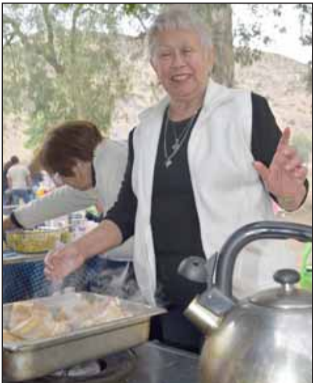
MUCHO SABOR. - Esta señora se encargó de preparar el mejor pollo frito para el grupo familiar que tuvo a su cargo.