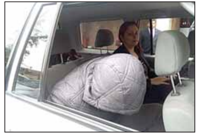
Nueve víctimas reconocieron plenamente a este sujeto como el autor de este ilícito de ofensas a la moral y buenas costumbres.