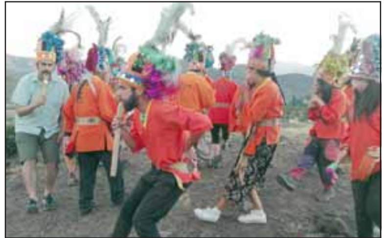
DANZA ANCESTRAL. - Una danza ancestral fue celebrada en este cerro, en homenaje al Chamán de Putaendo, hecho por la Agrupación Sociocultural Los Gatos Plomos, de Putaendo.