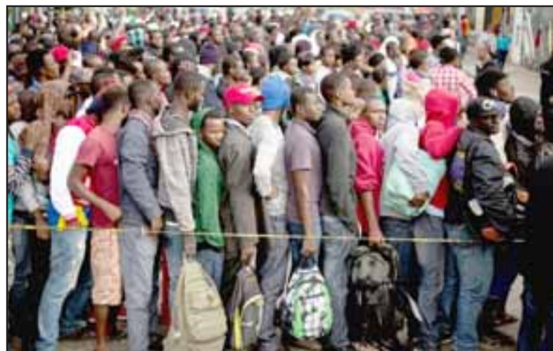
PROBLEMA EN AUMENTO. - Según la entrevistada, los aconcgüinos están perdiendo su fuente laboral agrícola, a causa de la gran cantidad de haitianos en el valle. (Referencial)

- ¿Mala?, pésima. Hay mucho haitiano ocupando los puestos de trabajos que eran de nosotros y ahora nos tienen a todos sin pega, he ido a los supermercados a dejar documentos y para qué le digo, estaban los haitianos, así es que nos dijeron esperen, esperen y ya llevamos seis, siete meses