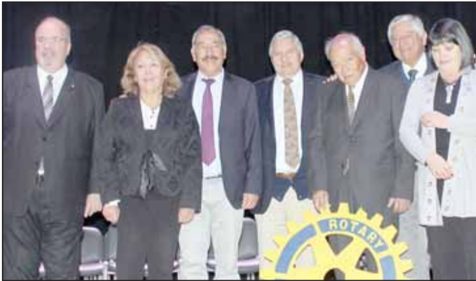
PROFES TAMBIÉN.- También los profesores y directores de colegios de nuestra comuna participaron activamente en esta jornada de Rotary San Felipe.