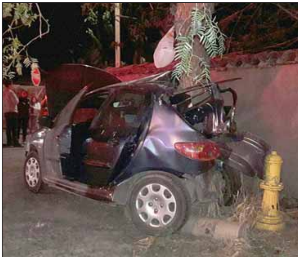
Las tres jóvenes resultaron lesionadas tras el accidente ocurrido pasada la medianoche de este viernes en el kilómetro 14 de la Carretera San Martín.