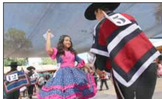
Peques y grandes gozaron en grande este festival de la cueca en su escuela, en El Asiento.