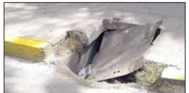
Este es el desperfecto que hay en la intersección de Calle Coimas con Santo Domingo en San Felipe.

Este desperfecto se viene a unir a uno especialmente peligroso que está ubicado en Calle 5 de Abril con Padre Alberto Hurtado, en San Felipe, que en su momento también representó