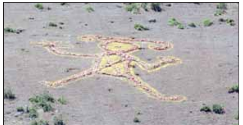
NUESTRO CHAMÁN. - Este es el Chamán de piedra que luce esplendoroso en uno de los cerros putaendinos.