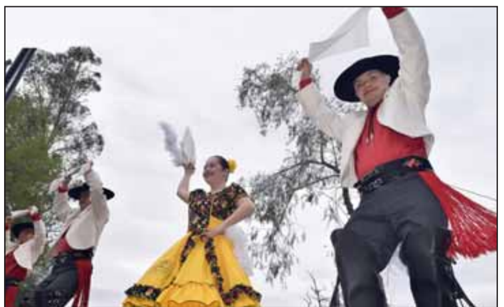
ALEGRÍA DOWN. - Ellos son Alegría Down, jóvenes artistas que con sus bailes hicieron de las suyas en este escenario.