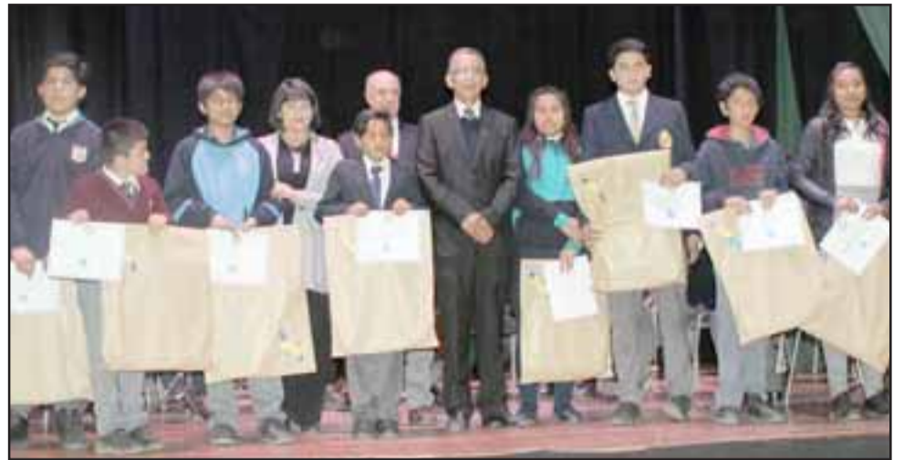
MUY AMIGABLES.- Estos jovencitos recibieron un homenaje especial en premio a sus excelentes relaciones humanas.

A ello se sumó el reconocimiento de Rotary a las mamás que acaban de dar a luz, quienes fueron visitadas la semana pasada en el Hos-