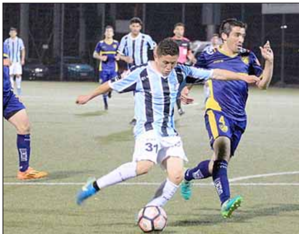
Unión San Felipe consiguió un agónico empate ante un duro y porfiado equipo de Barnechea.

Sin el más mínimo margen para errar, a los sanfe-