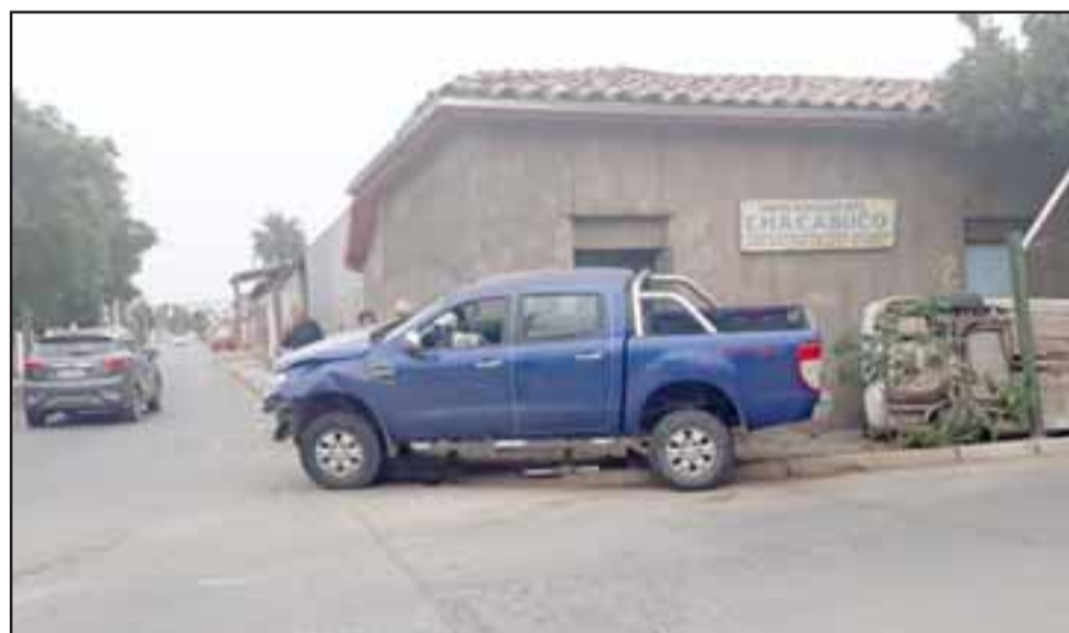
La vista panorámica muestra ambos vehículos involucrados en el violento accidente de tránsito.