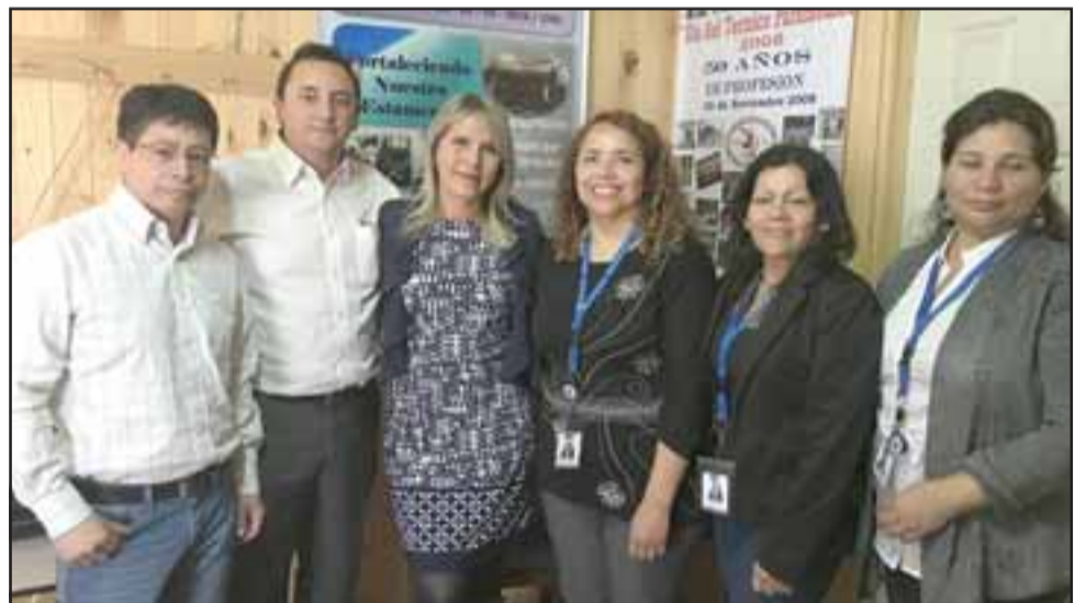
La Senadora Lily Pérez se reunió con la Federación de Técnicos en Enfermería de Aconcagua, quienes están pidiendo un reconocimiento a su experiencia, trayectoria y trabajo en el área de la Salud.

que ellos cumplen una serie de actividades al interior de los recintos de salud que tienen que seguir una serie de protocolos e indicaciones que no están visibilizadas en el Código Sanitario», indicó la Senadora Lily Pérez.