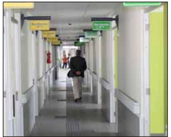
Pese a su avance del 98%, el Cesfam Panquehue aún no puede atender al público que espera desde hace años esta obra.

«Con esta actitud, están castigando a los vecinos de Panquehue, a la gente más vulnerable, que necesita una atención más digna, además a los funcionarios del Cesfam, que requieren de un lugar que cumpla las condiciones para poder prestar salud.