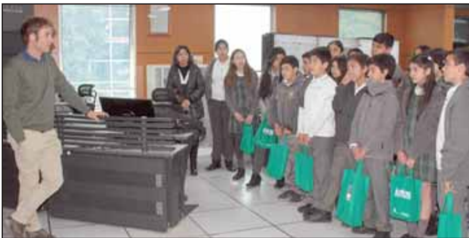
En el Centro Integrado de Operaciones los alumnos vieron cómo operan los camiones, en tiempo real, en la Cordillera de Los Andes gracias a la tecnología de Codelco Andina.