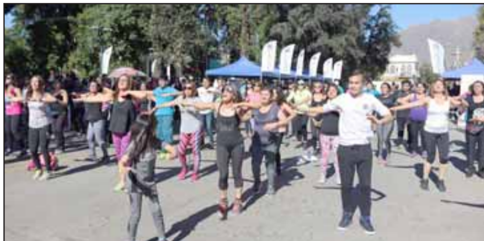
Las tres actividades son desarrolladas y cuentan con el apoyo de la Municipalidad de San Felipe.

La Maratón, que este 2017 partirá y finalizará en Los Andes (mientras que el próximo año lo hará en San