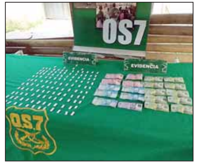
Personal del OS7 de Carabineros efectuó el allanamiento este martes al interior de una vivienda de la Villa Nueva Esperanza de Llay Llay, incautando papelinas de pasta base y dinero en efectivo.

El imputado fue individualizado con las iniciales R.R.R.R., de 28 años de edad, quien fue derivado la mañana de ayer miércoles hasta el Juzgado de Garantía de San Felipe