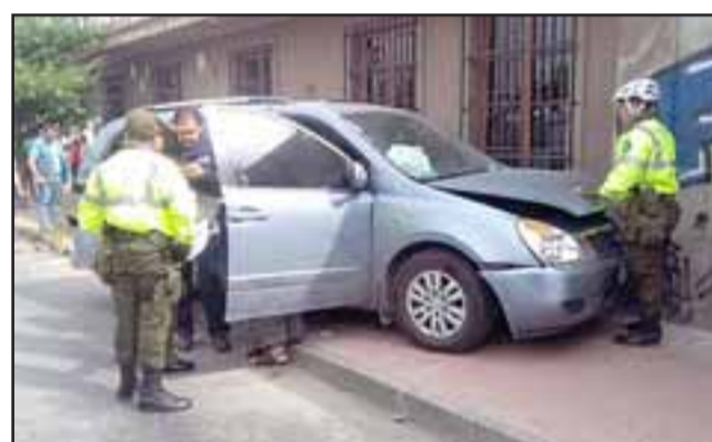
La Kia Carnival resultó con importantes daños tras colisionar con el microbús de una empresa contratista.

Añadió que el sujeto supuestamente solicitó este permiso para ir a visitar a su esposa, no obstante eso es materia de investigación.