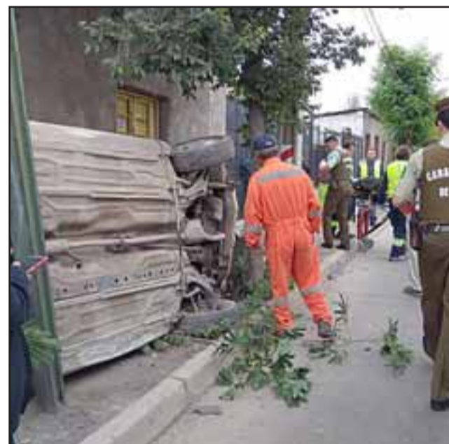
El vehículo marca Suzuki terminó volcado tras colisionar con la camioneta marca Ford, cerca de las 07:30 horas de la mañana de ayer miércoles en la esquina de Artemón Cifuentes con Navarro en San Felipe.