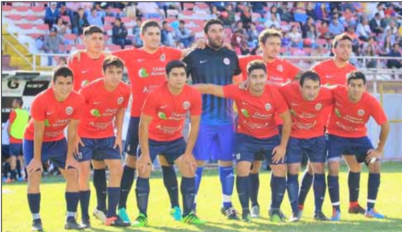
Desde Arfa Quinta se informó que hasta el momento no se sabe nada respecto a algún castigo sobre el club Almendral Alto.

El directivo no se cerró a la posibilidad de sancionar al actual monarca regional si es que la Asociación de Santa María aplica e informa un castigo sobre dicha institución. "Todas