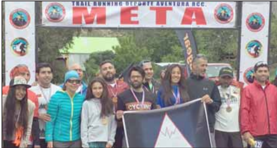
LÍDER DE LA MANADA.- Los atletas del país le respetan y reconocen como uno más de los suyos, al final de la carrera son todos hermanos.

mer lugar el pasado 21 de octubre en el primer Trail Running que se organizó en San Felipe, siendo el mejor corredor de la distancia máxima de 10 Kilómetros», comentó satisfecho el atleta sanfelipeño.