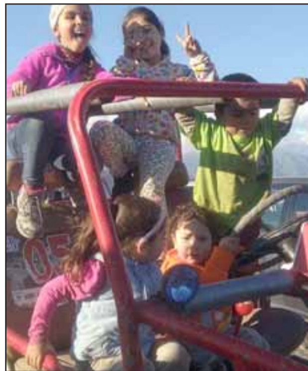
Los niños también tendrán su espacio en esta Tuercatón 4X4 2017.

Se trata de un grupo de jeeperos, voluntarios del Colegio María Leiva, varios clubes femeninos del sector, el Centro Femenino de Las Coimas y hasta tres juntas vecinales, Fuerzas Vivas del sector que desde hace una década vienen apoyando en grande a los niños de la Teletón. La entrada vale $1.000, hay agua potable, comidas, bebidas e