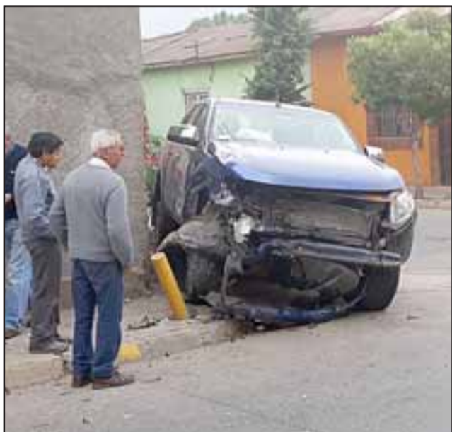
El conductor de la camioneta marca Ford circulaba por calle Navarro.