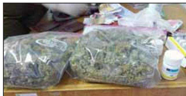
Personal de Subcomisaría IAT de San Felipe detuvo al matrimonio trasladando marihuana al interior de su vehículo en la ruta 5 Norte la mañana de ayer miércoles.