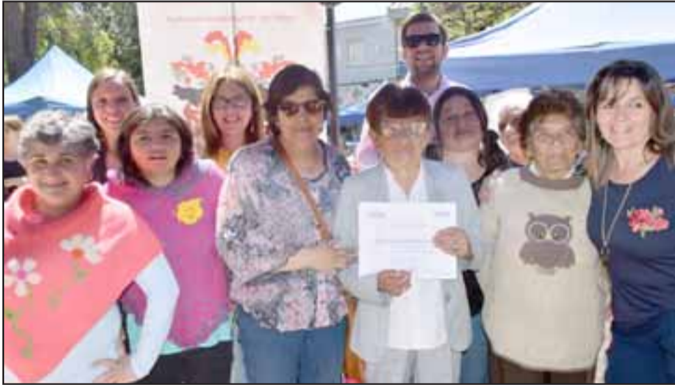
DAMAS CREATIVAS. - Aquí vemos a estas damas, mostrando a nuestros lectores los trabajos que ellas hacen.