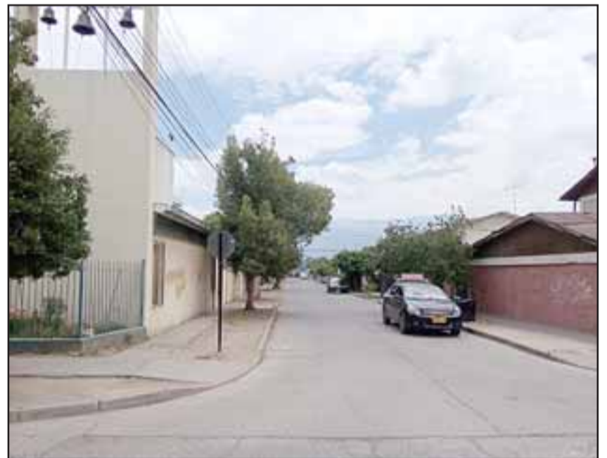
En los alrededores de esta calle fue el primer ataque del día martes.

ron la respectiva denuncia en Carabineros de la Segunda Comisaría de San Felipe.