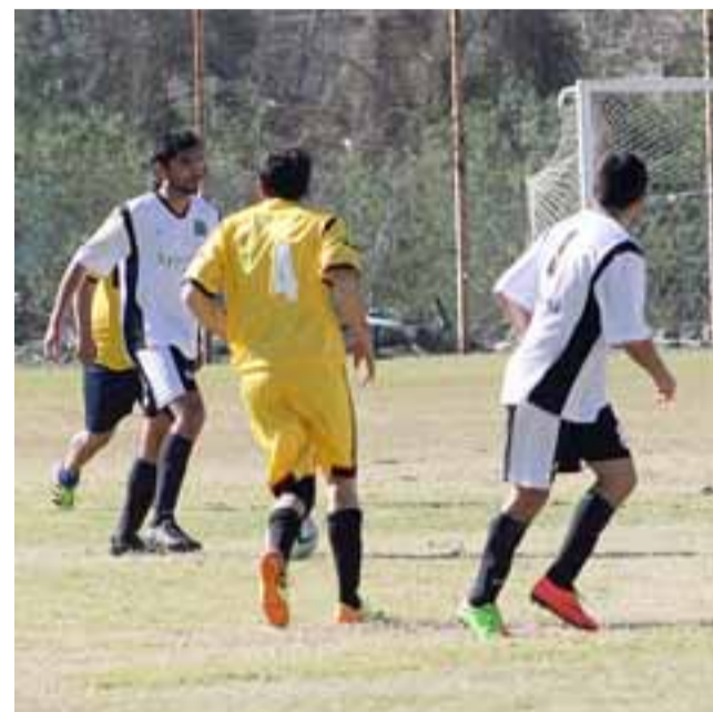
En la Asociación de Fútbol Amateur de San Felipe se jugarán solo los partidos pendientes.

Al cierre de la presente edición de El Trabajo Deportivo no se confirmaba la fecha, ya que en la reunión de directorio (anoche) se determinaría programar los partidos pendientes.