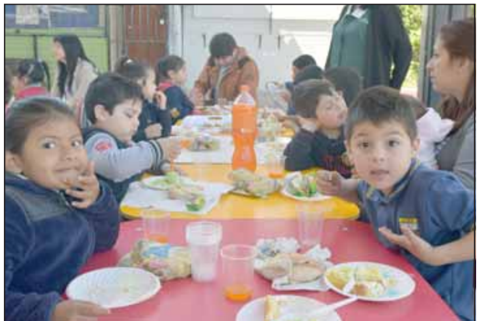
SE LO MERECE.- Estos pequeñitos vieron cómo la prensa más leída en Aconcagua ahora les visita con más regularidad.