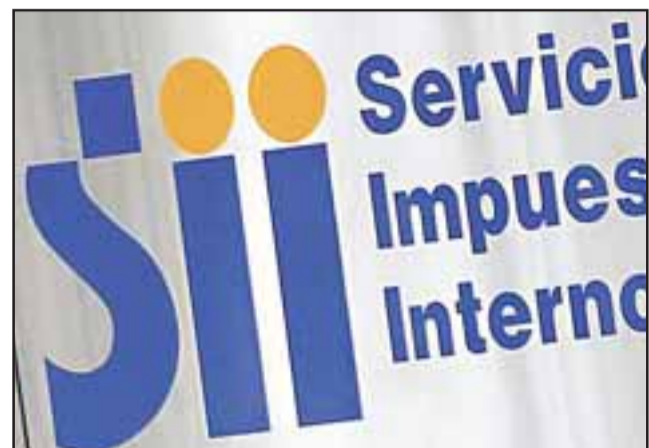
Más de 56.344 contribuyentes de la región de Valparaíso utilizaron la propuesta de IVA en su segundo mes de implementación.

Cada vez más personas están utilizando esta innovación del SII para declarar su impuesto mensual, de forma tan simple y fácil como ocurre con la Declaración de Renta.