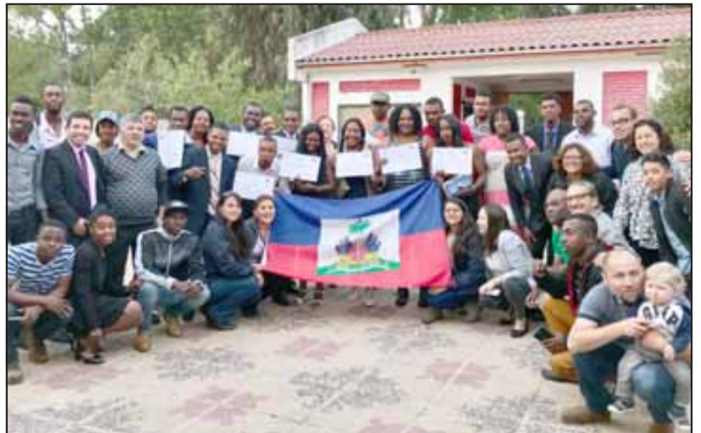
Un total de 14 inmigrantes se graduaron tras realizar un curso de español que les permitirá mejorar su capacidad de comunicación en nuestro país.

Actualmente hay otro grupo de inmigrantes que sigue en clases con Despagnes. Además, se siguen realizando capacitaciones de idioma a funcionarios municipales, en el Cefam Valle de Los Libertadores. A