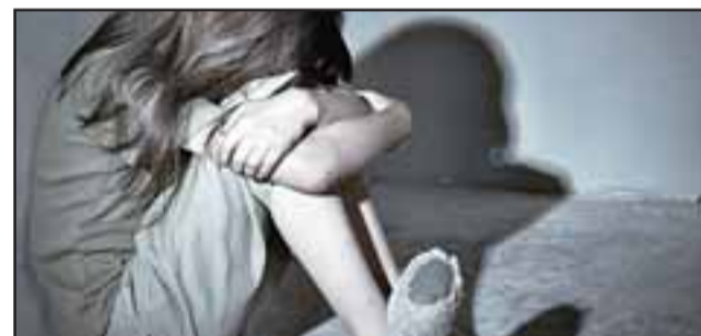
En aquel entonces la niña de 9 años de edad se encontraba bajo el cuidado del actual sentenciado, siendo agredida sexualmente el año 2015. (Foto referencial).

La Fiscalía vislumbra que este tribunal pudiera condenar al sentenciado a penas que parten desde los