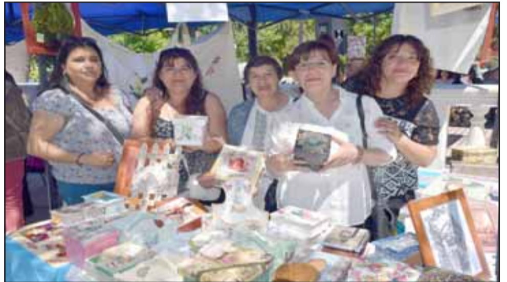
MUJERES ACTIVAS. - Unos 38 talleres femeninos, de los 81 existentes, fueron certificados ayer en la terraza de nuestra Plaza de Armas.