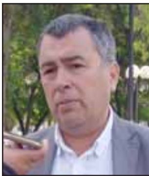
El Gobernador Eduardo León advirtió el peligro de incendios forestales y situaciones que pongan en peligro la salud de las personas.

Los números habilitados de los organismos de emergencias disponibles para denuncias de quemadas de pastizales y dar aviso ante la ocurrencia de incendios forestales son CONAF (130), Bomberos (132) y Carabineros (133).