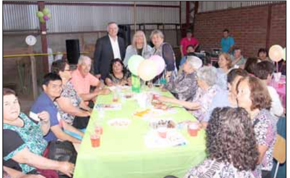
La convivencia con los adultos mayores de Panquehue cierra las actividades de celebración del sector.

Para lo anterior y con el fin de facilitar su traslado,