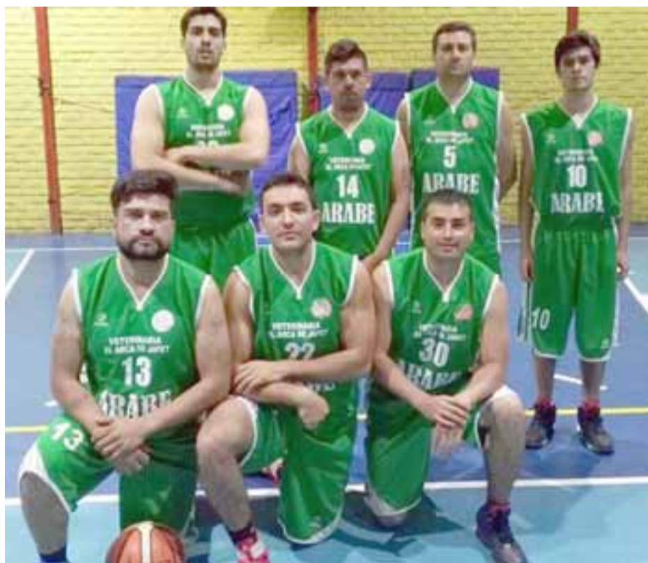
El Árabe enfrentará a Canguros en la primera fecha del torneo de Clausura de Abar.

18:00 horas: Dinos IAC- San Felipe Basket