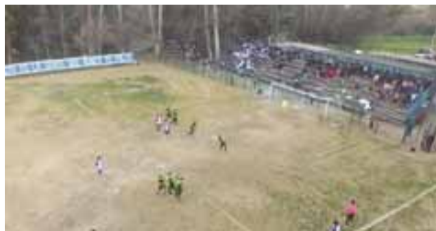
A través de la señal básica del CDF, los aconcagüinos podrán ver un capítulo dedicado al fútbol aficionado catemino.