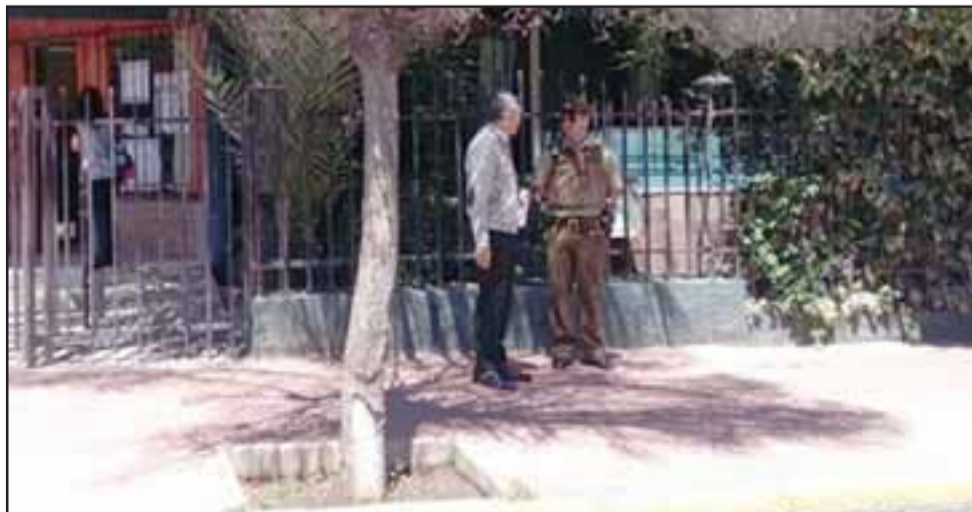
El incidente se registró en horas de la mañana, sin que exista claridad respecto a lo que originó la agresión.

La autoridad llamó a la comunidad andina a condenar este hecho, "porque es impresentable lo que sucedió esta madrugada y la rapidez con que llegaron sus compañeros impidió que no sufriera lesiones de gravedad".