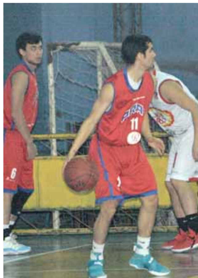
En el Fortín Prat se jugará el sábado el encuentro entre el Prat y Brisas.