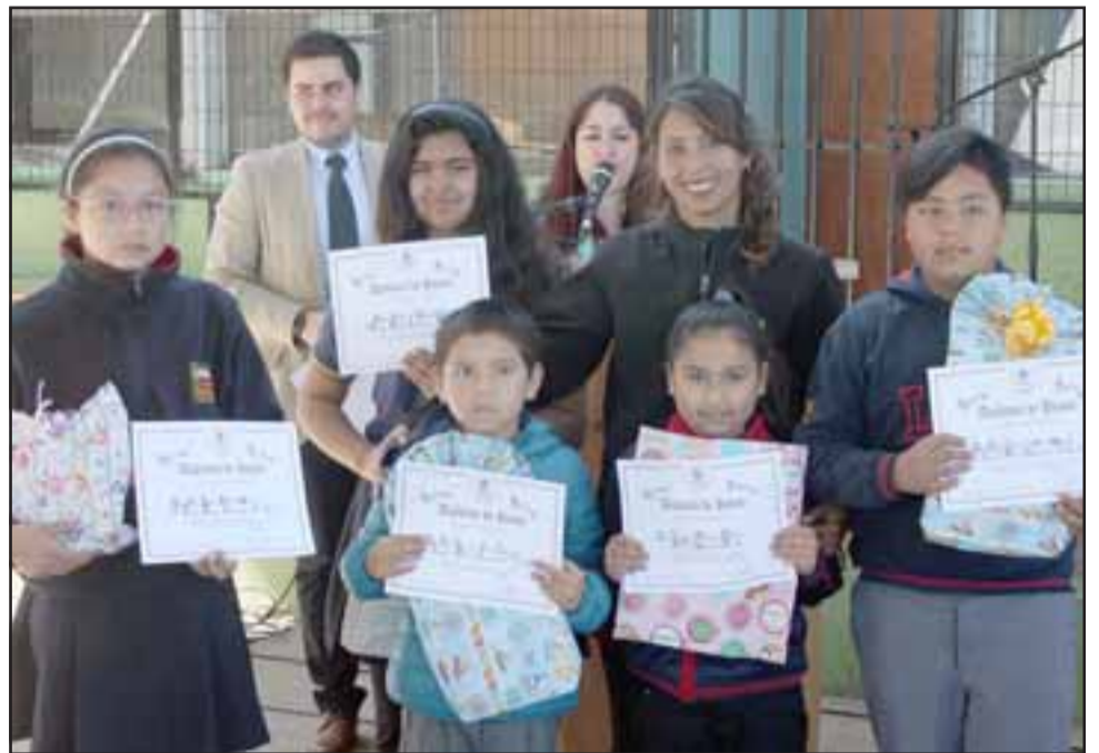
BACAAAAAN.- Ellos son los escolares con mejores calificaciones y excelentes relaciones humanas en el Liceo San Felipe.