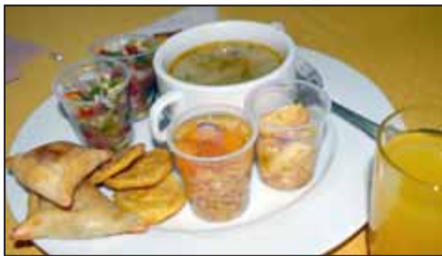
UNA DELICIA.- Ceviches de verdura y de cochayuyo; pasteles de mariscos y de choclo; Valdivianos; empanadas de pino; sopaipilla, pebre, mote con huesillo, leche asada y jugos naturales.