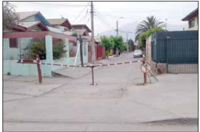
En este pasaje se habría producido el segundo ataque sexual, el mismo día martes.

De ello se dieron cuenta cuando fueron a constatar lesiones, donde el médico le comentó que anteriormente había ido otra mujer por