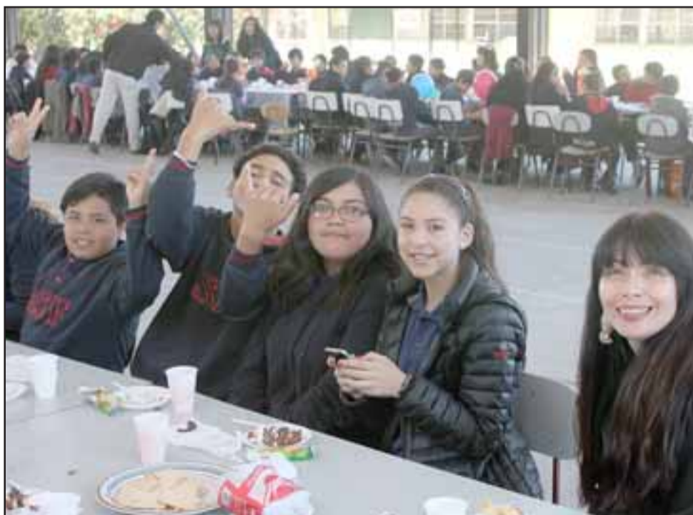
LA JUVENTUD IMPONE.- Aquí tenemos a estos regalones estudiantes, siempre dispuestos a regalarnos una sonrisa.