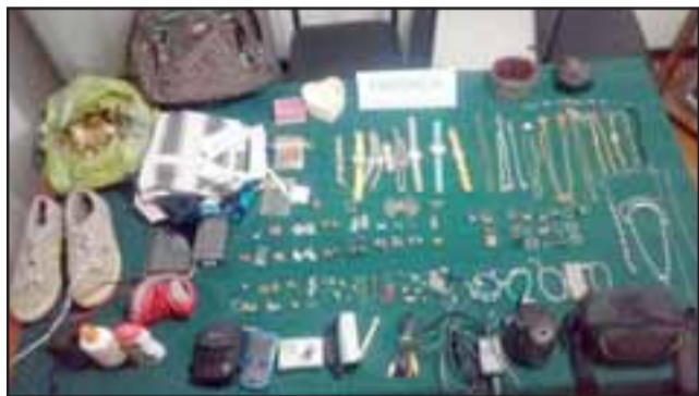
Las especies recuperadas por Carabineros de Putaendo pertenecientes a dos víctimas del sector Las Coimas.

Diligencias efectuadas por OS7 de Carabineros