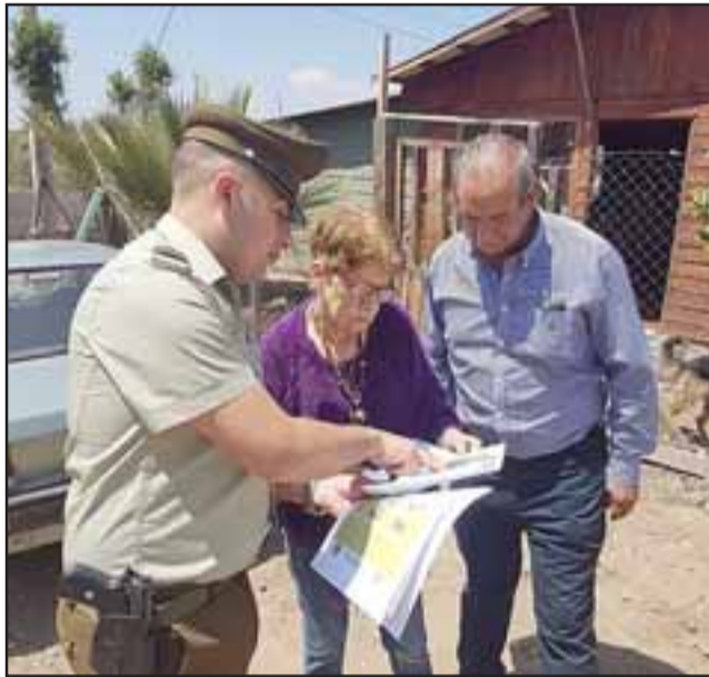
La policía uniformada entregó volantes informativos para la prevención de incendios forestales en la zona de Aconcagua.