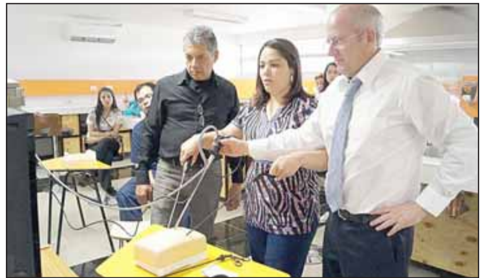
Simuladores del cuerpo humano realizados de manera local y a bajo costo, permitirán principalmente a los nuevos médicos aprender a través de la experiencia en modelos inanimados.