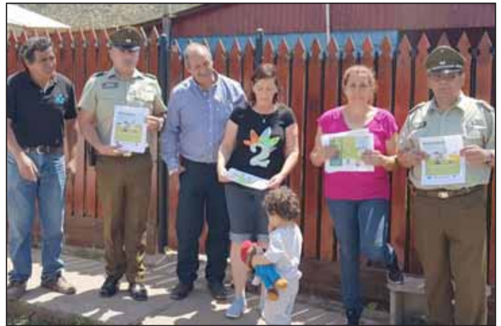
Carabineros de la Oficina de Integración Comunitaria de San Felipe junto a los vecinos del sector rural El Asiento.

La ley 20.653 estipula que provocar un incendio forestal es un delito que tiene penas de cárcel desde los 5 años y un día a 20 años. No obstante Carabineros, en su labor preventiva y de acercamiento con la comunidad, entregó ciertas recomendaciones como: No hacer fuego en