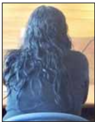
La imputada deberá abandonar la casa que habita junto a su conviviente, arriesgando una pena de 61 días de cárcel.

LOS ANDES.- Una mujer de esas modernas, que no creen en eso del ‘sexo débil’, demostró que en cuestiones de violencia intrafamiliar, no siempre el hombre es el malvado de la historia. Fue así como, tras discutir con su nuevo conviviente, puso fin a la disputa de dos certeras estocadas en una de sus piernas.