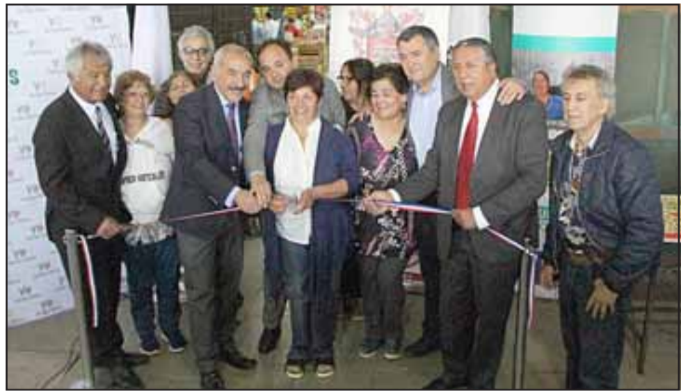
Autoridades junto a locatarios inauguraron el tercer mejoramiento de la feria central de Yungay.

“Hoy día estamos haciendo una promesa cumplida, con el Alcalde, el Gobernador nos comprometimos el 2014, a través del programa de fortalecimiento de ferias libres, que las ferias de la comuna de San Felipe iban a ser financiadas en la medida que postularan a proyectos, y aquí tenemos un proyecto del mercado central, que ganó el 2014, que sacó el proyecto de luminarias, el 2015 el radier del patio del estacionamiento, y hoy día las baldosas antideslizantes que cubren