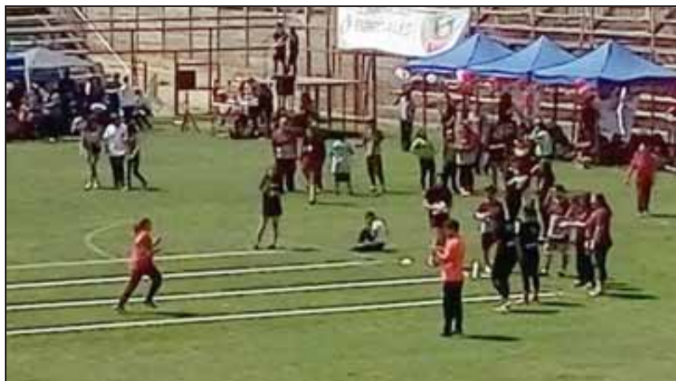
El estadio municipal de San Felipe recibió la segunda y última jornada de competencias tales como fútbol-lito, carreras, lanzamiento de jabalina de espuma, entre otras.