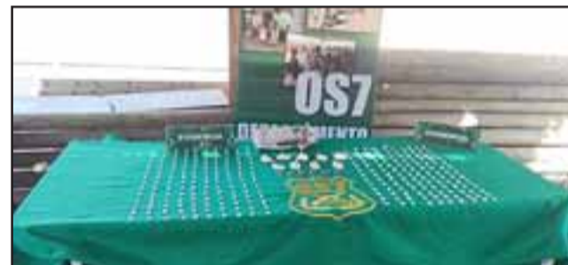
Personal de OS7 de Carabineros Aconcagua incautó las papelinas de pasta base y marihuana, además de dinero en efectivo, desde un domicilio ubicado en la Población Los Libertadores de Los Andes, siendo detenida una mujer apodada ‘La Abuela’.