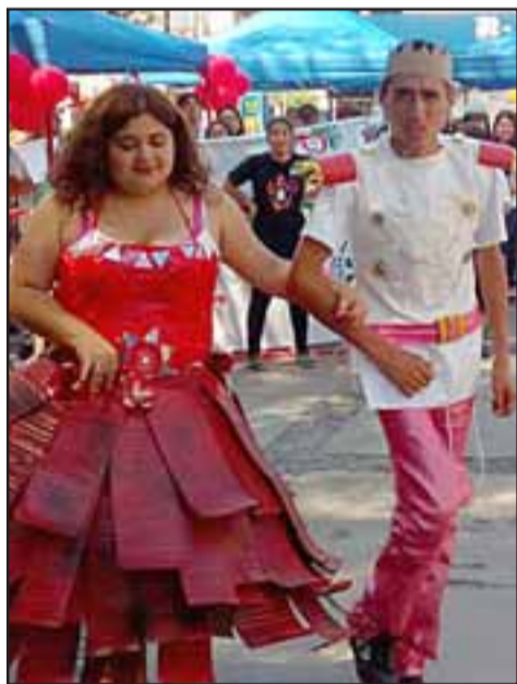
Cada una de las Escuelas participantes debía presentar a sus reyes vestidos con un traje reciclable.

nuestros estudiantes año a año vienen organizando estas olimpiadas, que es una fiesta de la inclusión, donde todos los niños participan en distintas actividades, en deportes adaptados, para que precisamente estos jóvenes tengan la oportunidad de divertirse y hacer deporte”, aseveró Ibáñez.