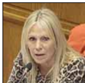
La senadora Lily Pérez decidió donar el dinero destinado al cierre de campaña a bomberos de la región, tras la declaración de alerta amarilla por incendios forestales.

Un total de 12 serán las Compañías de Bomberos beneficiadas considerando aquellas que son cercanas a zonas más rurales de la región.