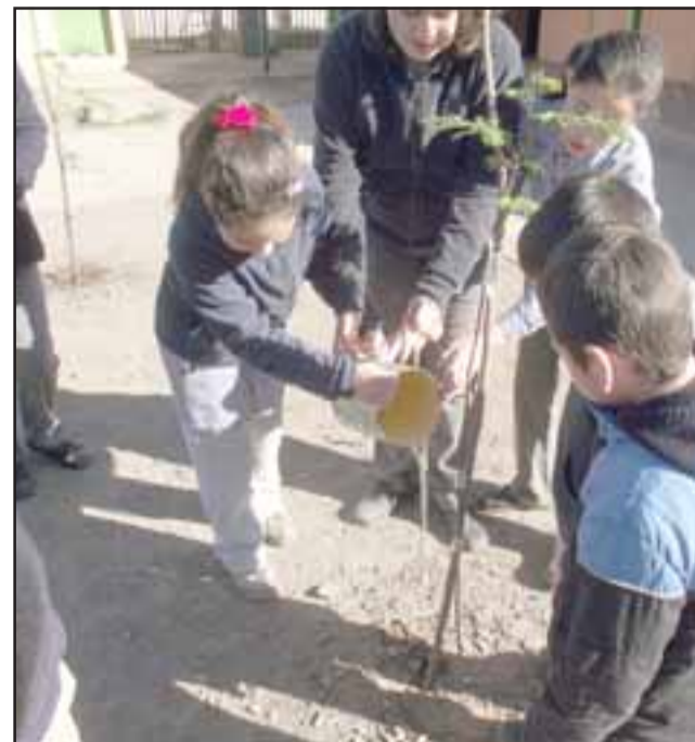
En la imagen de archivo, alumnos de la Escuela Juan Gómez Millas de Los Villares plantando árboles en un proyecto de arborización.

Reclamó que a ella nadie le ha informado o dado una explicación sobre los motivos del cierre, se enteró este martes.