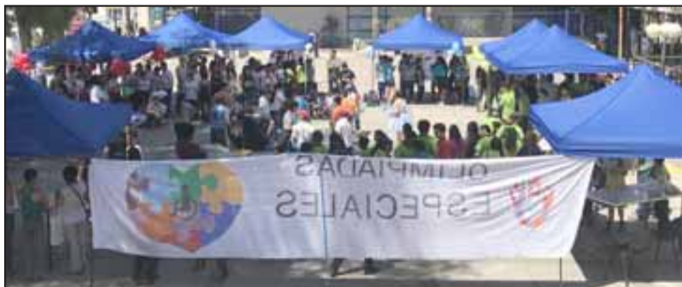
El martes las olimpiadas se llevaron a efecto en la Plaza Cívica de San Felipe, hasta donde llegaron Escuelas Especiales de distintas comunas del Valle de Aconcagua.