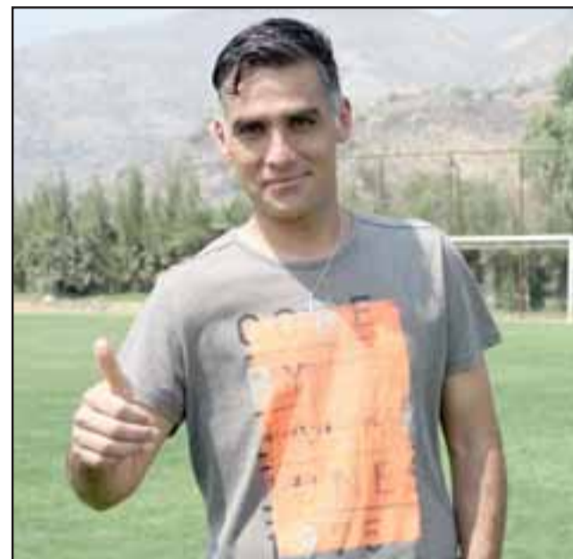
El experimentado zaguero central hizo un sincero análisis colectivo e individual del Uní Uní en el pasado Transición.

- Soy un agradecido de Raúl (Delgado) por haberse fijado y acordado de mí, ya que es muy difícil que alguien se fije en un jugador de esa división.