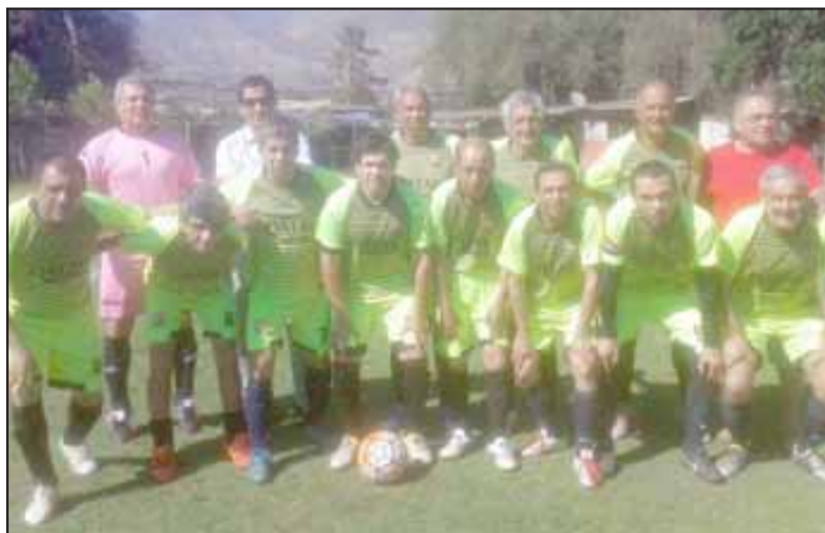
El equipo de Santos quiere recuperar su sitio de equipo de punta en la Liga Vecinal.