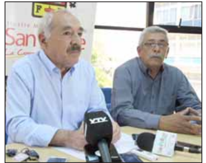
El alcalde Patricio Freire adelantó que los locales ya están dispuestos para las elecciones este domingo.

Llay Llay: Escuela Básica Agustín Edwards, Calle Edwards N° 501; Liceo Politécnico Llay Llay B-15, San