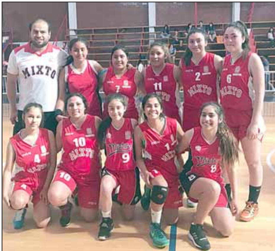
Liceo Mixto de San Felipe fue el mejor en damas de este 2017 en la Liga Escolar de Aconcagua.

La jornada final fue emotiva e igualmente intensa, tanto en emotividad como por los disputado de los partidos que tuvieron como escenario el impecable y espectacular gimnasio del Mixto sanfelipeño.