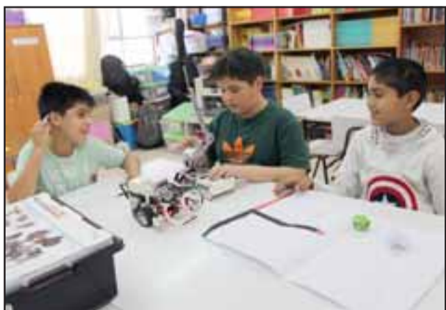
El robot cuenta con sensores que le permiten seguir una línea negra que le indicará el camino e identificar y apartar el papel por su color.

Los niños están tan entusiasmados que ahora están trabajando en la instalación de una 'garra' que permita que el trabajo de 'Felipito' sea mucho más eficiente.