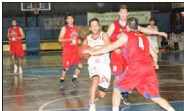
El equipo sanfelipeño deberá vencer a Ceppi para seguir como puntero de su zona en el torneo de la serie B de la LNB.

El encuentro entre el quinteto sanfelipeño y los de la capital está programado para las 20:00 horas, aunque antes del duelo estelar hay programados al menos dos partidos en los cuales intervendrán otros elencos del Prat.