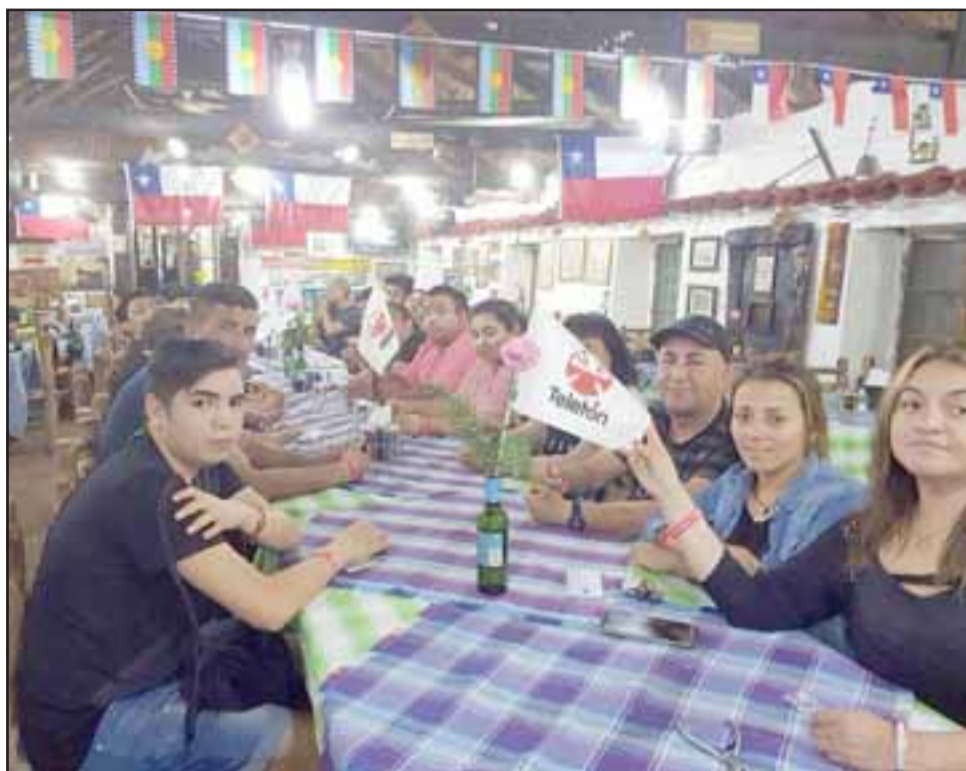
Los vecinos reunidos en el restaurante La Ruca en su primera cita.

“Es por eso que hacemos una invitación a todas las personas de estos sectores a cooperar con esta noble