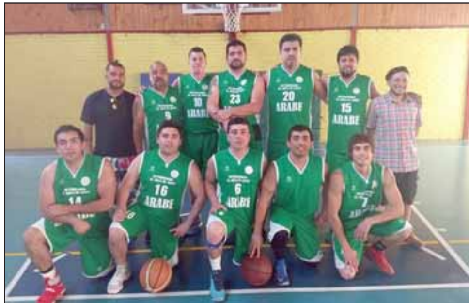
Tras su triunfo del domingo pasado, Árabe quedará libre en la jornada programada para este sábado en la Sala Samuel Tapia Guerrero.

19:30 horas: Lobos de Calle Larga – Alikanto