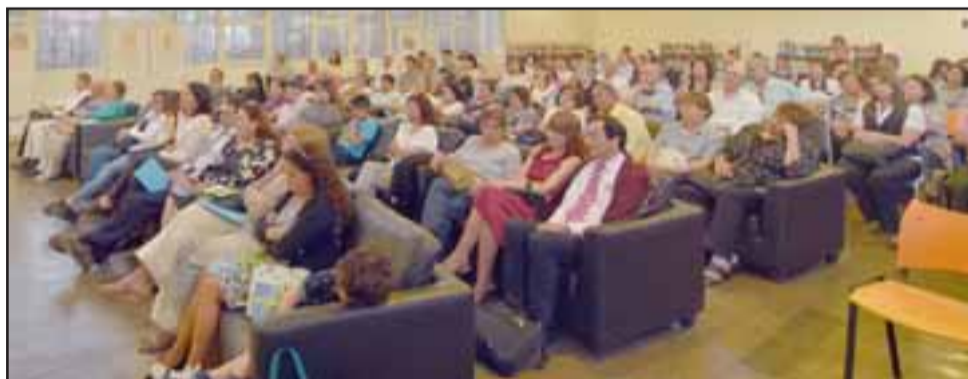
Gran cantidad de público asistió a la primera celebración del Día del Escritor en la comuna de Santa María.