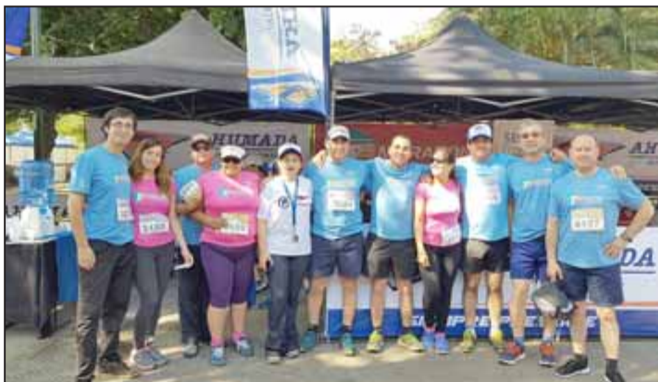
Más de cien trabajadores de Ahumada y sus familias, participaron de este mega evento deportivo, todos auspiciados por la empresa.