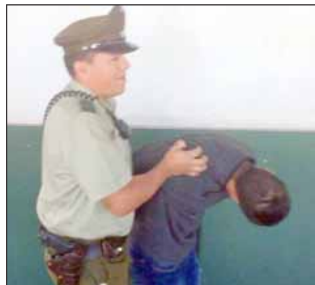
El menor de edad detenido por Carabineros fue derivado hasta Tribunales por robo con intimidación. (Foto Referencial).

OS7 de Carabineros incautó pasta base y clorhidrato de cocaína: