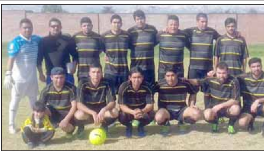
El Pentzke festejará a lo grande sus 92 años de vida.