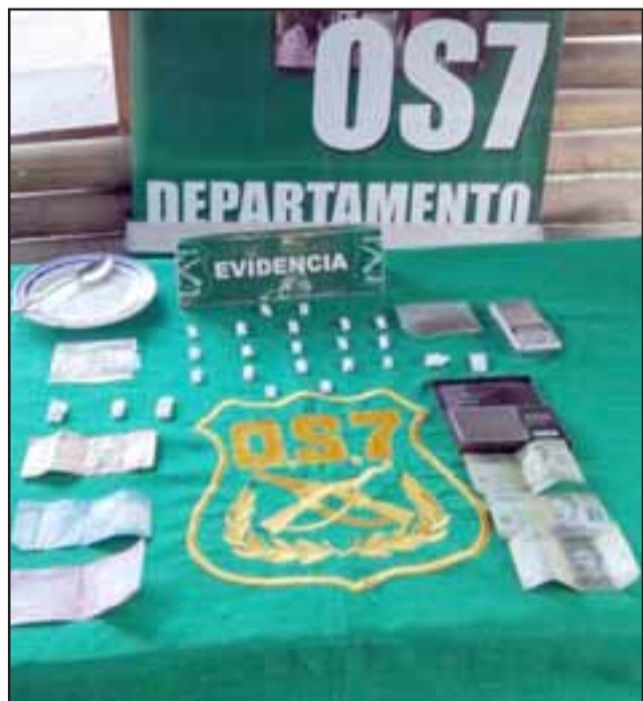
Tras un allanamiento al interior de una vivienda de Villa El Sendero de Putaendo, personal del OS7 de Carabineros incautó las drogas en poder de la imputada apodada 'La Fanny' quien quedó bajo cautelar de prisión preventiva.

En prisión preventiva quedó una mujer apodada 'La Fanny', quien se dedicaría al comercio ilícito de drogas en su domicilio en la Villa El Sendero de Putaendo, quedando al descubierto tras un allanamiento efectuado por OS7 de Carabineros, incautando 50 dosis de pasta base de cocaína.