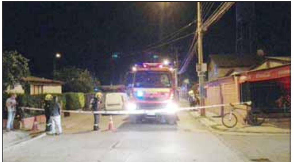
Personal especializado de Bomberos preparándose para trabajar en el lugar de la emergencia.

"No era peligroso el producto, pero el hecho de lavarlo con cloro tuvo una reacción totalmente distinta y eso fue lo que produjo una especie de gas, donde las personas comenzaron a sentirse mal, llegando rápidamente las unidades de Panquehue para poder controlar a cien metros junto con Carabineros, esperando la llegada de personal especializado", indicó el oficial. La mujer que tuvo los