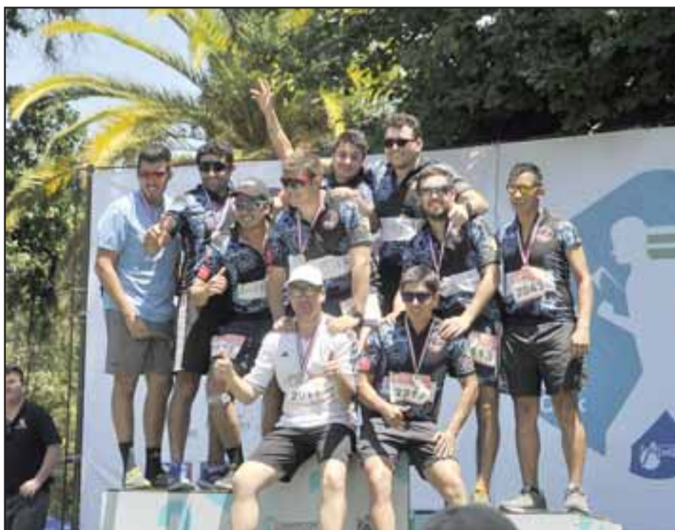
Los runners de Santa María participaron sin costo en la Maratón, con el apoyo de Ahumada.