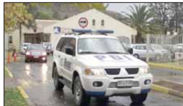
Personal de la PDI debió constituirse en la Clínica Río Blanco donde falleció el menor tras ingerir pesticida en una bodega agrícola en San Esteban.