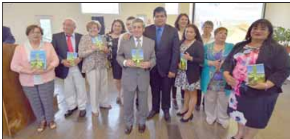
Alumnos del taller Literario Biblioteca Gabriela Mistral, quienes compusieron el libro 'Romancero Santamariano'.