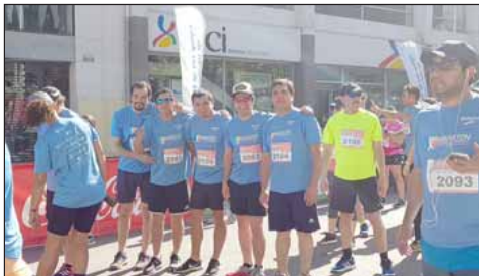
Colaboradores de la Empresa de Buses Ahumada participaron entusiastas en esta Primera Maratón del Valle de Aconcagua.