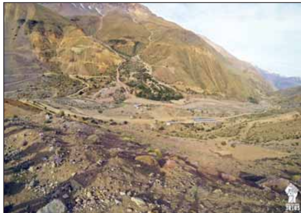
Asentamiento de Andes Copper en el sector Las Tejas, Putaendo.