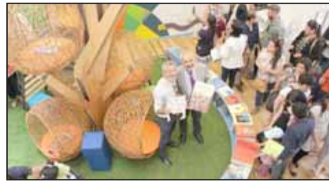
La biblioteca cuenta con libros especialmente diseñados para personas ciegas, confeccionados en distintos sistemas, además de bastante tecnología para acercar la lectura a todos los niños de la comuna.

“Estoy muy contento de estar en la inauguración de esta biblioteca inclusiva, porque queremos una comuna de todos y todas y que la cultura llegue a todos los sectores, especialmente a las personas con capacidades diferentes, y sobre todo a los niños, por ello al Fondo de la Cultura, mis agradecimientos”.