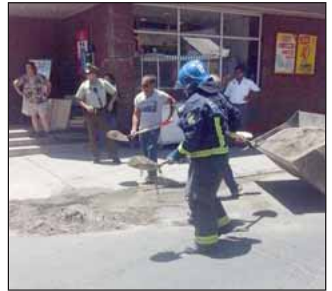
Personal de Bomberos y la municipalidad de San Felipe esparcen arena sobre la bencina.