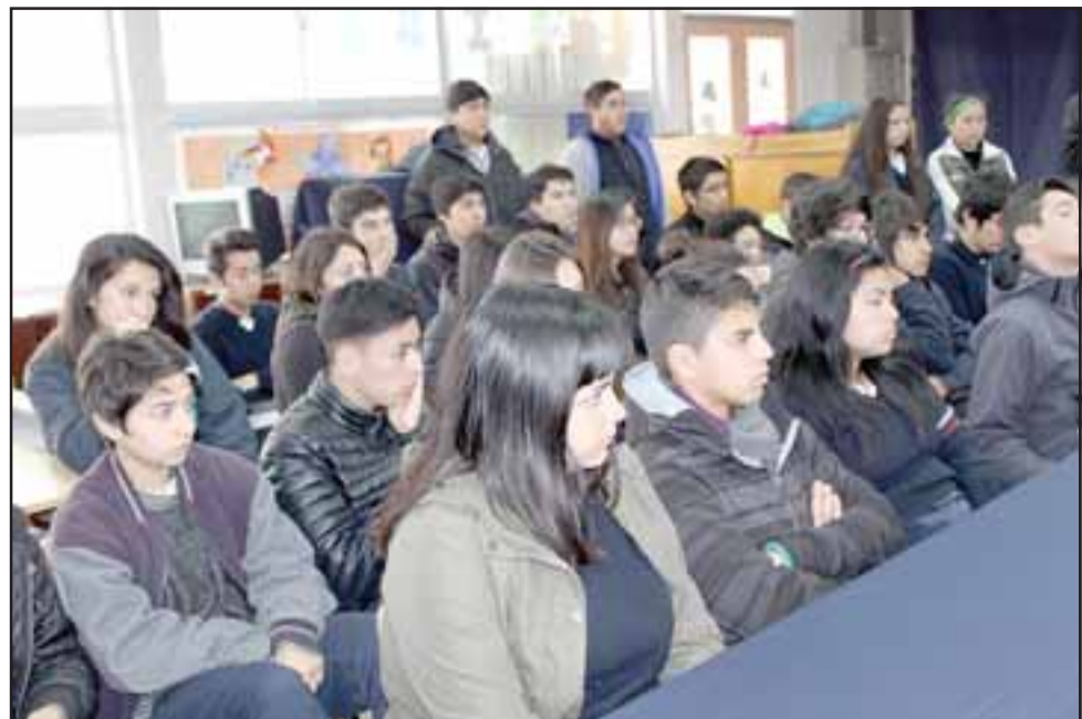
El Bono al Logro Escolar es un beneficio que se entrega a los alumnos que obtienen mejores rendimientos académicos. (Foto referencial).

En Llay Llay, en tanto, el establecimiento con mayor