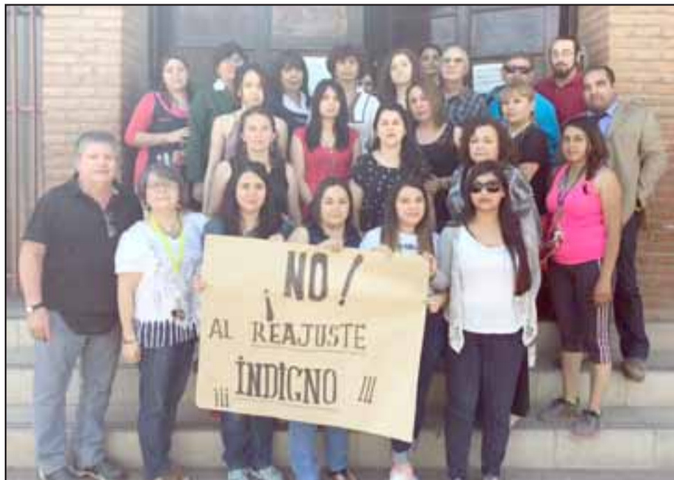
Los profesores muestran el cartel donde califican como indigno el reajuste al sector público.

El presidente reiteró su llamado a los profesores a colegiarse.