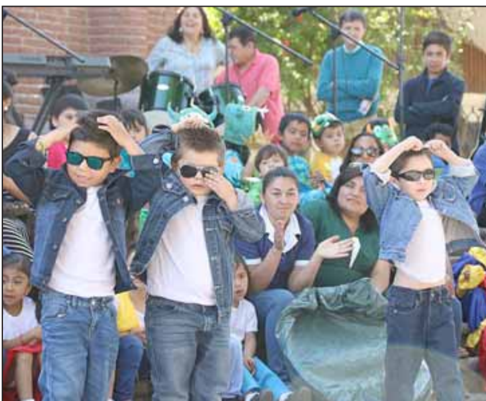
La clásica comedia musical 'Grease Brillantina' de John Travolta y Olivia Newton Jones, fue revivida por los alumnos del Liceo República de EEUU.

taendo acompañó en la animación del evento. Sin lugar a dudas, una actividad que demostró el lindo y comprometido trabajo que se hace en la comuna en materia de Educación Parvularia.