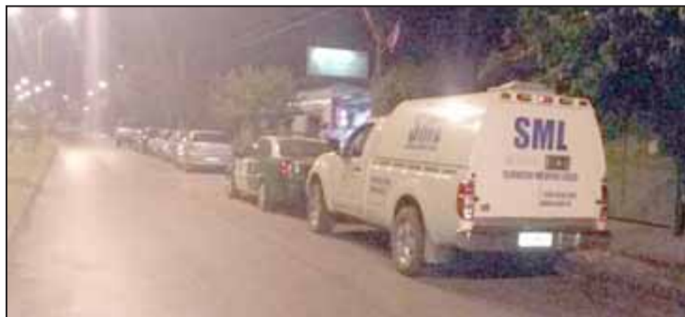
En horas de la noche de este sábado el cuerpo fue derivado hasta el Servicio Médico Legal de San Felipe para ser sometido a la autopsia de rigor.

terceras personas en el hecho, sin embargo el cuerpo fue sometido a la correspondiente autopsia de rigor en el Servicio Médico Legal para determinar la causa de muerte.