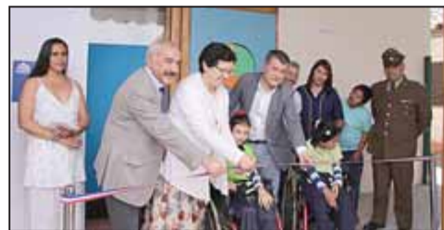
El tradicional corte de cinta que inaugura este proyecto presentado al Consejo de la Cultura, logrando recursos por alrededor de 45 millones de pesos que permitieron dotar a la fundación de una importante cantidad de material destinado a personas con discapacidad visual.