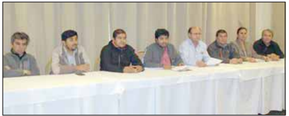
Trabajadores rechazan Cierre del Proceso Productivo de la Mina Subterránea y denuncian posible conflicto de intereses entre directivos de Andina.

Ante esto, los Sindicatos SIIL y SUT no podemos quedar silentes ante estos hechos que se está llevando a cabo, pues cuenta con una serie de elementos que no se quiere reconocer la realidad de los hechos que comprometen seriamente a la División Andina, ya que a partir de los antecedentes que se tienen, se puede demostrar que el afán de cierre de la actual Mina Subterránea, que probadamente cuenta con importantes reservas mineras que le brinda futuro a la División, se está privilegiando el interés privado mediante el