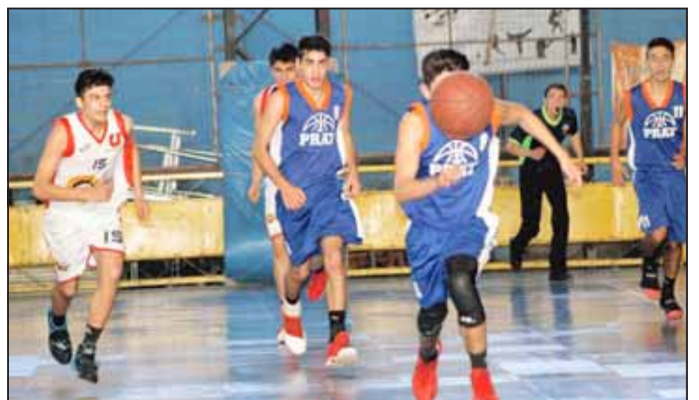
En el Prat esperan que, con un buen trabajo previo, su equipo juvenil sea protagonista en el Domani 2018.

- Apuntarle con los dos refuerzos, ya que en este tipo de torneos ellos hacen la diferencia; nosotros estamos ilusionados en que los que incorporaremos nos darán el plus para marcar