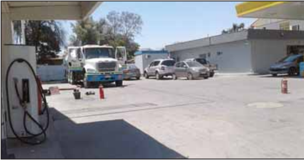
Este es el camión de enex que sufrió la pérdida de aire de sus frenos.

por una falla mecánica, al parecer perdió el aire en sus frenos, el camión se desplazó hacia la calzada soltando la manguera la cual estaba descargando el combustible, derramándolo a la calzada desde la salida del