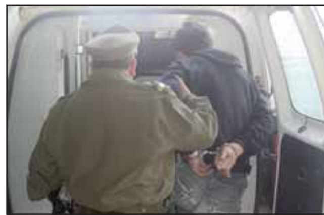
El imputado fue detenido por Carabineros del Retén de Curimón la tarde de este viernes. (Foto Referencial).

Deceso se produjo la tarde de este sábado: