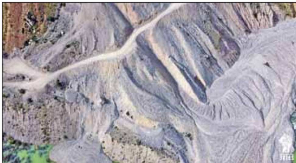
Construcción de caminos y movimientos de material, provocaron aludes que terminaron con un extenso y profundo embancamiento del río.