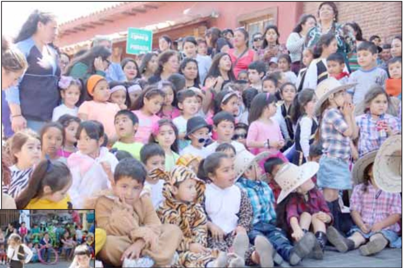
Cientos de alumnas y alumnos de kínder y prekínder de los diferentes establecimientos de la comuna, llegaron a tomarse la Plaza Prat de Putaendo.

Cientos de personas llegaron hasta la Plaza Prat para ver el show organizado por el Daem Putaendo, donde pequeñas y pequeños de kínder y pre-kínder demostraron talentos y bailes en una alegre jornada y provechosa jornada de Educación Pública.