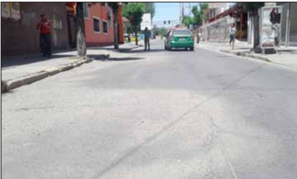
Personal de Carabineros resguardando el lugar y se aprecia la arena sobre la bencina.

Según lo verificado en el lugar, no hubo personas intoxicadas, eso sí era notorio el intenso olor a bencina en el lugar.