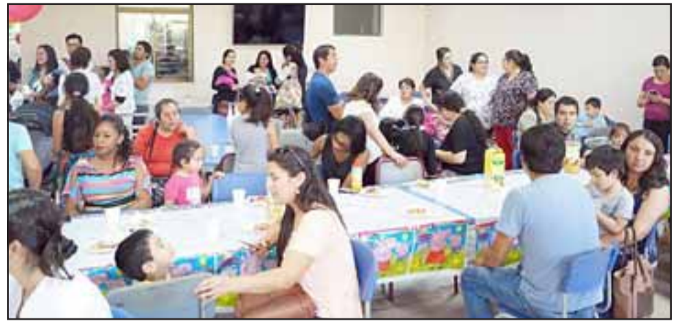
Celebrando el día internacional del prematuro, el establecimiento sanfelipeño realizó una actividad para saludarlos y demostrarles que con los cuidados correspondientes, estos niños tienen una vida completamente normal

brevidad del 95% y en el caso de los prematuros extremos un 79%. “En nuestro servicio cuidamos y mantenemos a estos pequeños en control hasta los 10 años y más si es necesario. Cada vez son más los niños prematuros que logran sobrevivir gracias a una multiplicidad de beneficios que tienen dentro del sistema público a través del GES o de diferentes pro-