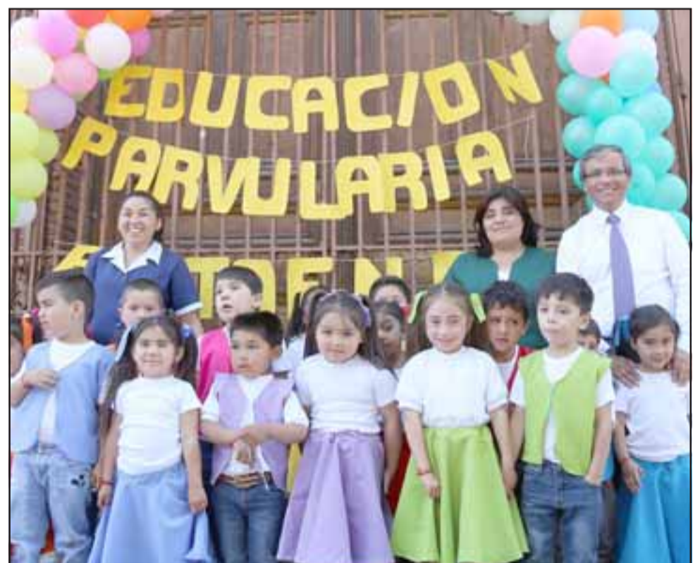
Los pequeños alumnos de la Escuela Eduardo Becerra de Casablanca posan para las cámaras de Diario El Trabajo.