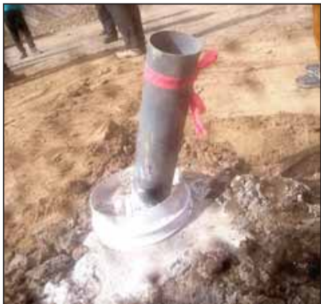
Agrupación ambientalista constató sondajes mineros de 1.000 metros de profundidad pertenecientes a la minera canadiense Los Andes Copper.

En este contexto, las proyecciones del líder de la Coordinadora Tres Ríos son apocalípticas: "lo que hay ahora, comparado con lo que puede pasar en el futuro es horrendo, prácticamente Putaendo se destruye, la cuenca del Río Rocín desaparece, porque la fauna misma está emplazada en el lecho del río... la boca de la mina tendría que tener un cráter de tres a seis kilómetros, en circunstancia que la cuenca del río tiene 680 metros de ancho, entonces desaparecen las dos cordilleras, oriente y poniente. De acuerdo a propuestas que desde nuestro punto de vista son estúpidas, van a entubar el río, de ser así la fauna muere y si viene una crecida milenaria, va a ser un tubo capaz de resistir, si pasa por encima o por el lado de la mina, la cantidad de muertos sería impresionante y Putaendo se quedaría sin agua para su desarrollo", concluyó.