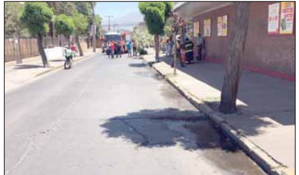
Acá se aprecia la bencina desparramada sobre la calzada.