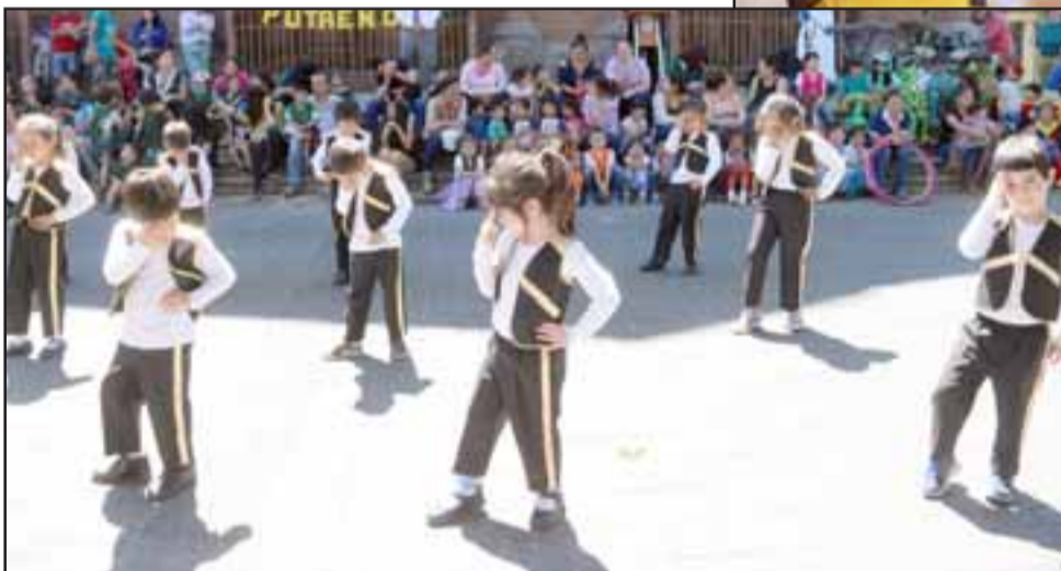
Los pequeños de la Escuela Paso Histórico también hicieron su presentación.

Además, en plena Plaza Prat se instalaron diferentes stands con presentaciones de cada una de las escuelas y liceos. Destacó ahí el 'Proyecto de Investigación Científica', con el Liceo República de Es-