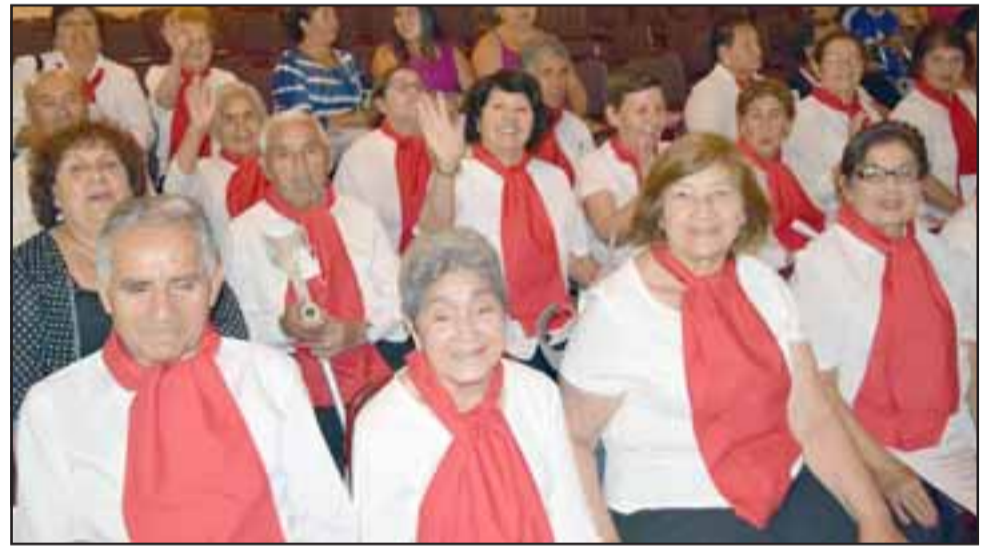
ELLOS TAMBIÉN. - Aquí tenemos a los integrantes del Centro Diurno del Adulto Mayor, quienes también cantaron a viva voz.