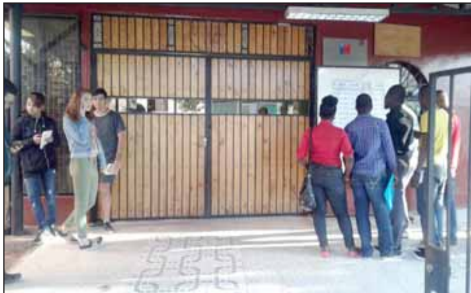
Estudiantes haitianos y chilenos esperando poder ingresar a rendir la prueba.

Los lugares en San Felipe son Liceo Roberto Humeres, Liceo Corina Urbina y Escuela 62.