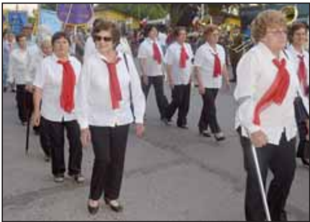
Los Clubes del Adulto Mayor, como siempre presentes.