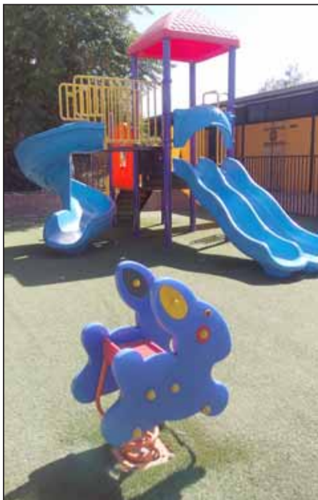
Cuatro millones de pesos fue la inversión para la adquisición de juegos infantiles.

vo, ver materializadas mejoras a los baños y manifestó que «mejora inmediatamente las condiciones del servicio que estamos brindando como escuela y también el ámbito de la convivencia; salud, seguridad escolar, o sea, estamos hablando de que esta mejora también inyecta otra sensación en la comunidad y el contexto de nuestra escuela», afirmó González, agre-