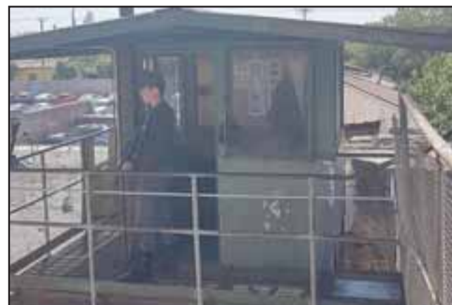
S.O.S. GENDARMERÍA.- Paupérrimas son las condiciones, según lo denuncian los mismos funcionarios de Gendarmería, en las que tienen que laborar en el CCP San Felipe.

- Por supuesto que sí, por medio de la directiva Ansog provincial de San Felipe, se presentó el 20 de noviembre una denuncia a la Seremi de Salud, el Seremi nos da 20 días para darnos una respuesta, pero el problema aquí es que las ratas no entienden esas cosas, los ratones siguen avanzando y comiéndose toda la madera y los cables eléctricos, siguen multiplicándose y poniendo en riesgo la salud del personal y de los internos. Ansog provincial de San Felipe seguirá los oficios lega-