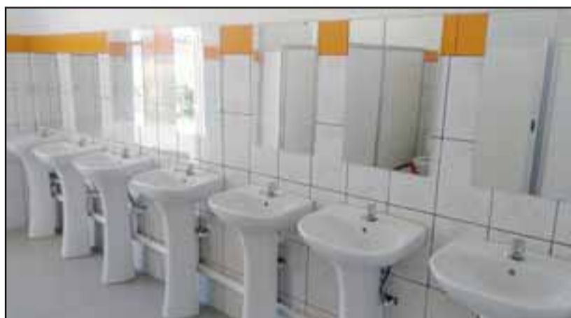
Alrededor de $12 millones se invirtieron en la construcción de nuevos baños en la Escuela Manuel Rodríguez.