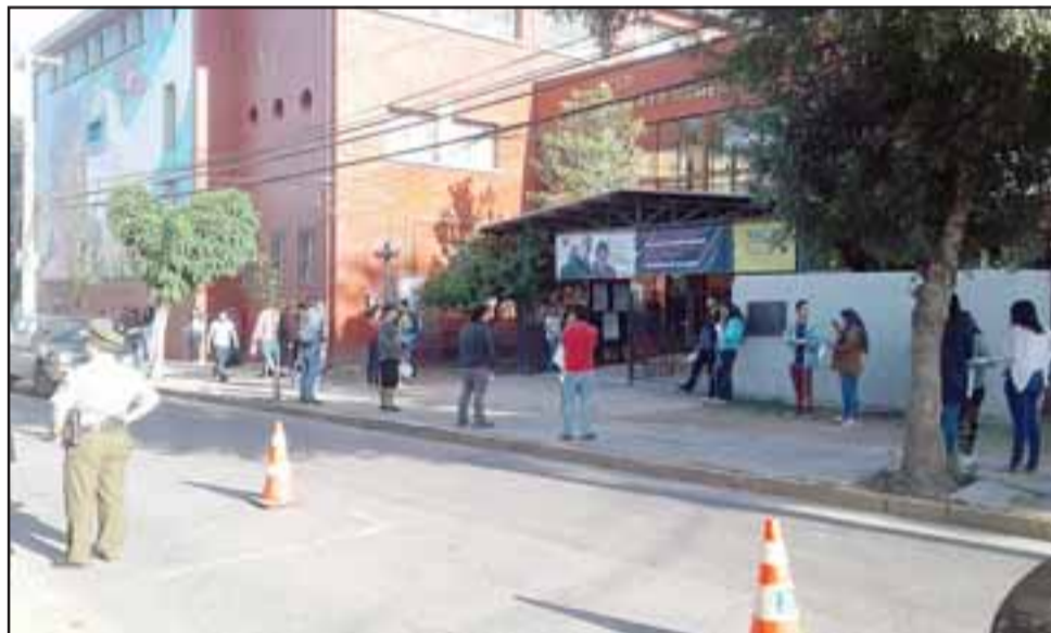
Carabineros presente en el exterior del Liceo Roberto Humeres Oyaneder.