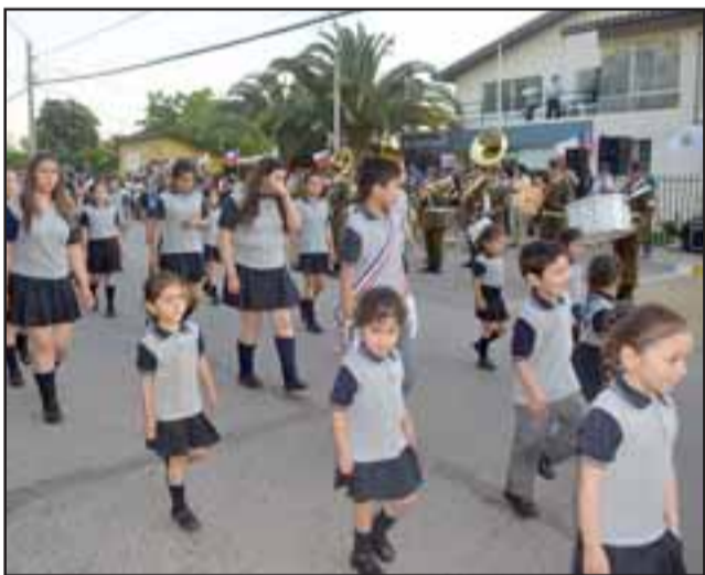
Alumnos de los distintos establecimientos educacionales también participaron del desfile aniversario.