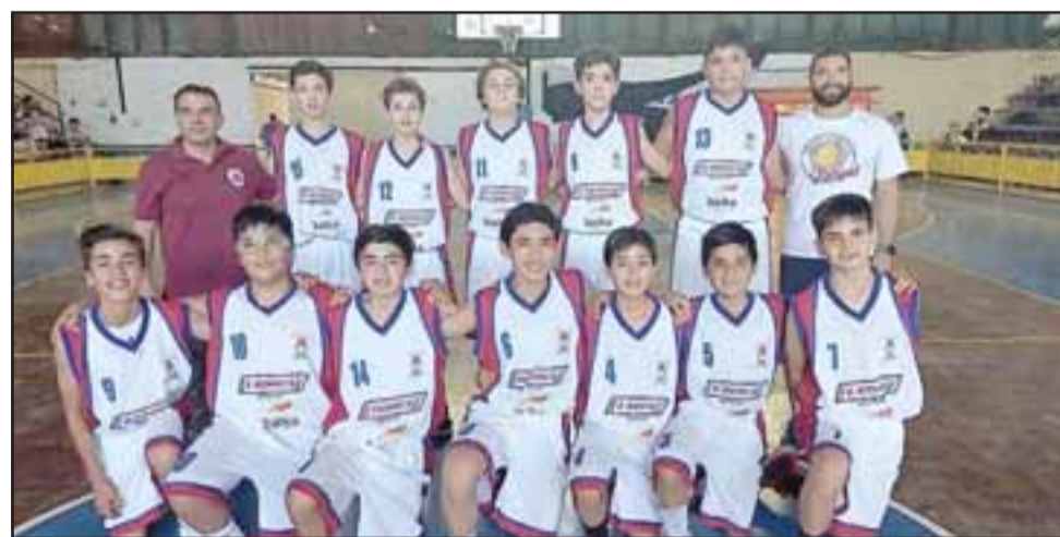
La selección U13 de San Felipe, de manera limpia y categórica, logró su clasificación al Nacional de la categoría.