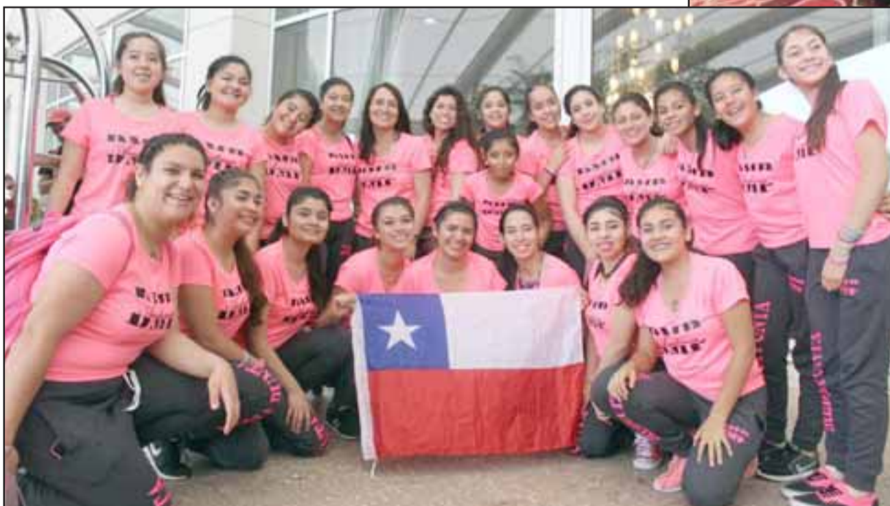
Todas las integrantes de la Academia Media Punta.