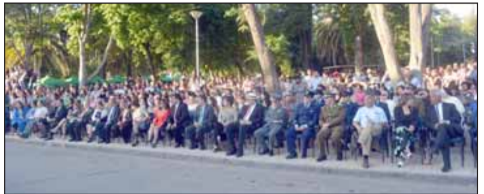
Gran cantidad de público se dio cita en la plaza de la comuna para presenciar el desfile aniversario.