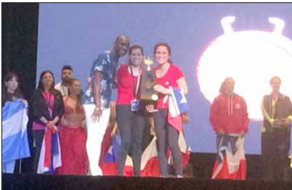
Recibiendo el premio de una las categorías.