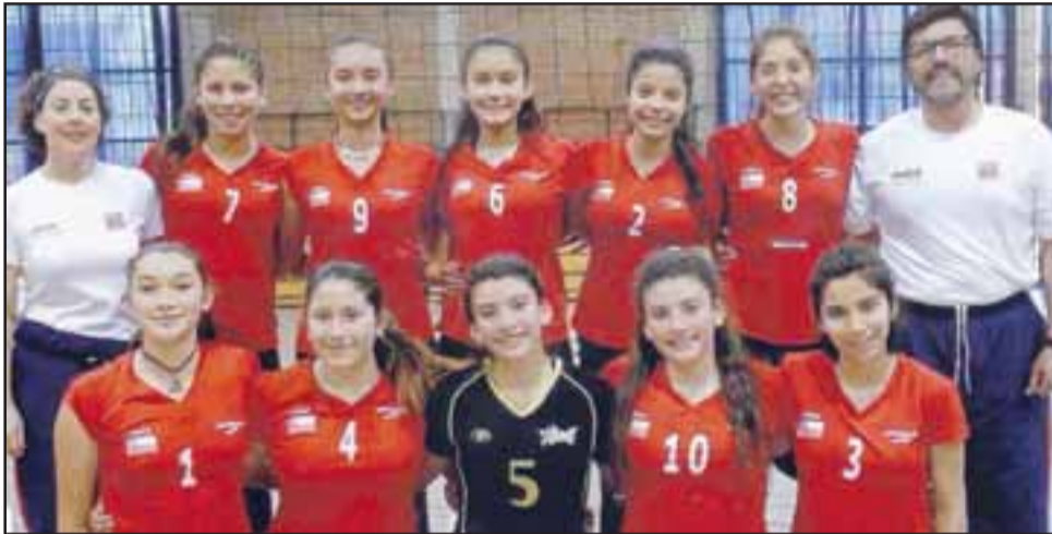
VAN A COCJABAMBA.- Estas jovencitas en cambio, volarán este viernes a tierras altiplánicas para vivir el Sudamericano de Vóleybol 2017.