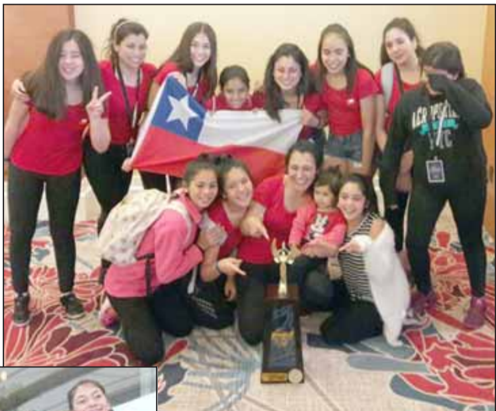
Tercer lugar categoría juvenil de 12 años modalidad contemporáneo, nivel estudiante.