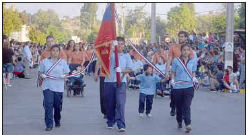
Alumnos de la escuela especial también desfilaban ante las autoridades.