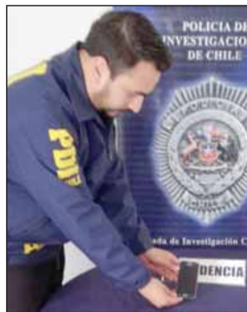
La Bicorn de la PDI de San Felipe efectuó las diligencias para recuperar el teléfono celular denunciado por su propietaria.