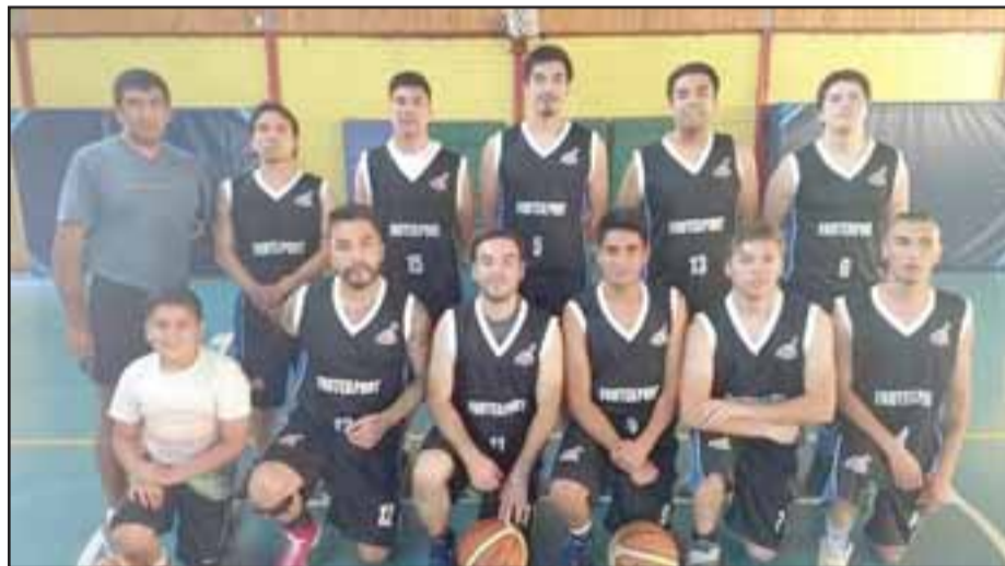
La escuadra de Frutexport venció a San Felipe Basket.