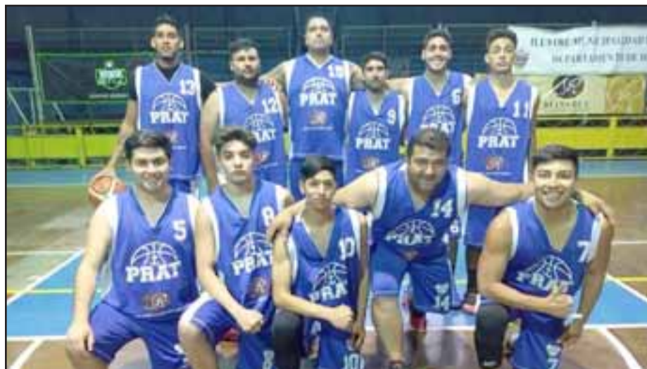
El alternativo equipo pratino no tuvo mayores inconvenientes para doblegar a Iball.