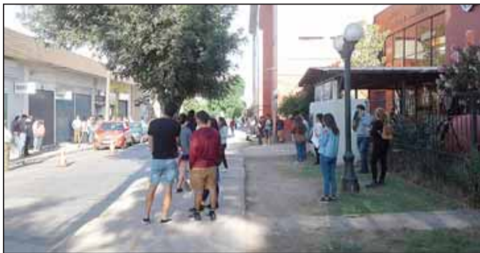
Los estudiantes en calle santo Domingo esperando rendir la prueba.