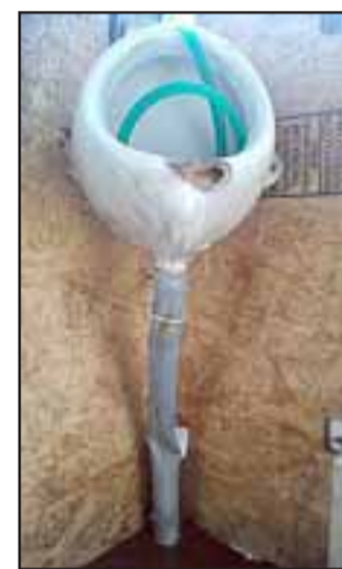
DA LÁSTIMA.- Este es el estado de los orinales que Gendarmería ofrece a sus funcionarios, hasta se podría especular que los presos cuentan con mejores instalaciones.