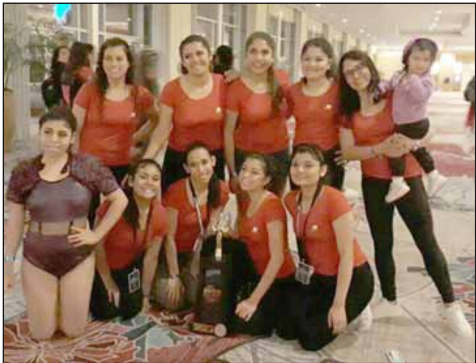
Acá están las integrantes que lograron el Segundo lugar en juveniles de 13 a 17 años modalidad lyrical.

La profesora y directora de la academia 'Media Punta' agradece a través de nuestro medio a: Kineactive, Urbina y González, Joyerías Ramas, Thermomack, Sancris, Distribuidora Betty, Centro Cultural Antumamaral, BioRec, Tsclicks, Capacitaciones T&C y Transportes Guskar, al Club de Tenis La Troya, donde ella arrienda para hacer funcionar la Academia, a todos ellos ¡Muchas gracias! Por su apoyo.