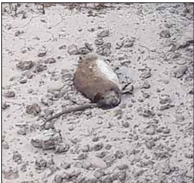
HUESPEDES NO INVITADOS.- Una plaga de ratones está afectando la salud mental de quienes laboran en el CCP San Felipe, según estas denuncias.