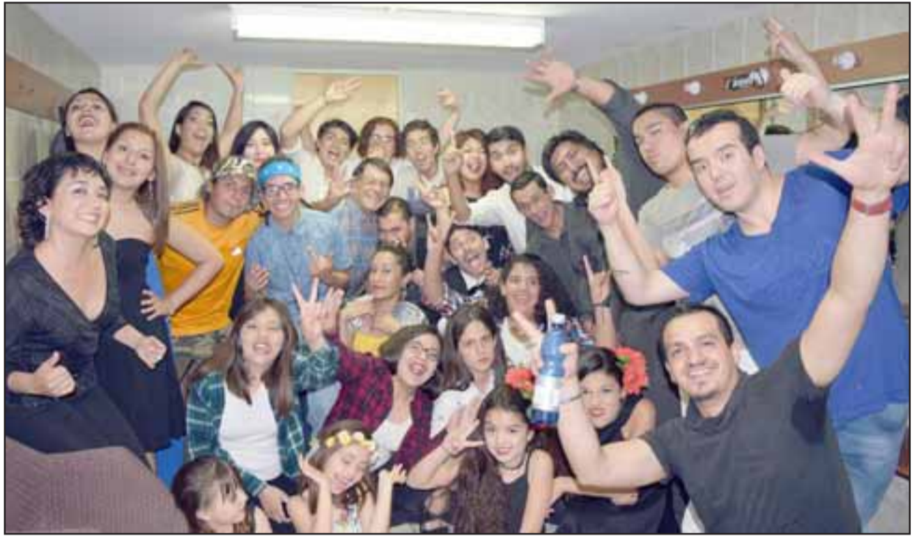
SAN FELIPE CANTA. - Ellos son los sanfelipeños que culminaron este 2017 su Taller de Canto, actividad que desarrollaron en el teatro municipal de San Felipe.