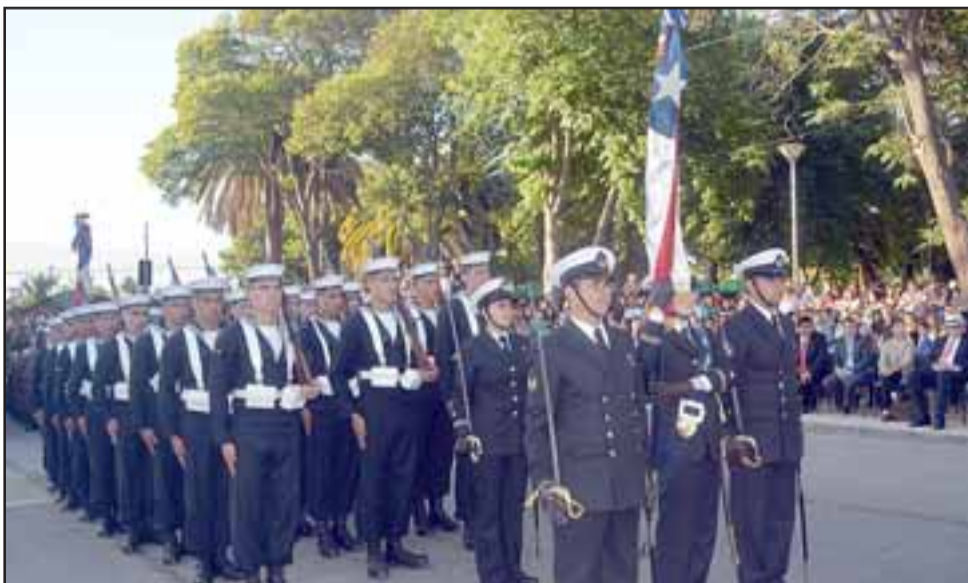
Una delegación de la Armada concurrió especialmente a desfilarse en el aniversario de la comuna.