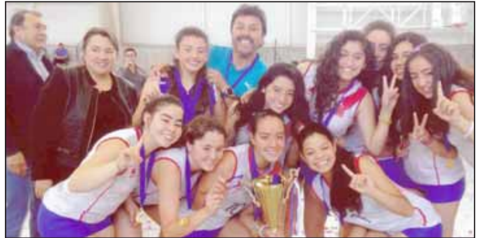
NUESTRAS CAMPEONAS.- Ellas son las flamantes campeonas nacionales del Vóleybol U16, quienes sudaron todo un mes para traernos la copa dorada.