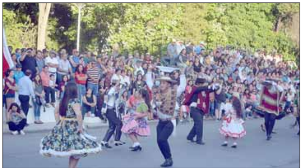
Nuestro Baile Nacional no podía estar ausente a cargo de agrupaciones folclóricas de la comuna.