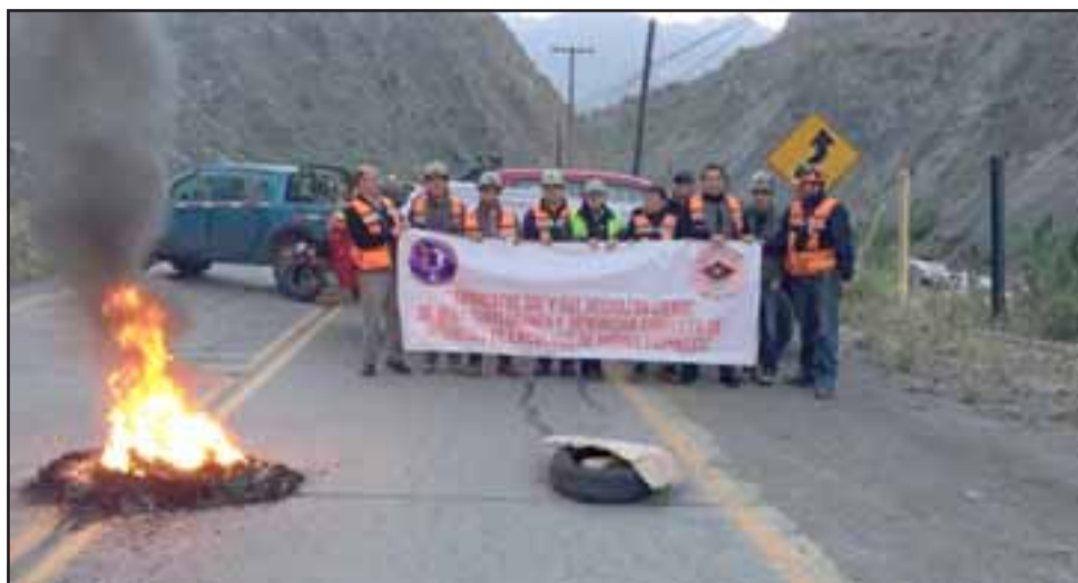
Dirigentes de los Sindicatos Unificado y de Integración Laboral de la División Andina de Codelco, bloquearon el acceso al área industrial de la empresa levantando barricadas y encendiendo fogatas.

Este hecho no es nuevo y se preveía en los Planes Mineros, ya que la División dejó hace varios años de desarrollar proyectos de nuevas minas subterráneas considerando que la explotación por rajo aprobada era la mejor alternativa. De hecho, Codelco ha desarrollado el Proyecto Nuevo Sistema de Traspaso Andina,