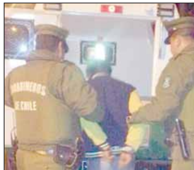
El imputado fue detenido por Carabineros de la Subcomisaría de Llay Llay tras ser reconocido por la víctima como autor del delito de robo en lugar habitado. (Foto Referencial).

OS7 de Carabineros en población Santa Brígida: