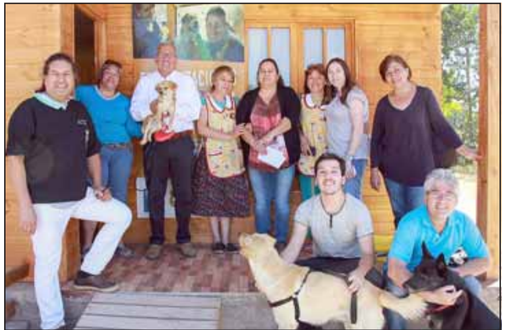
El sábado pasado en la sede de la Junta de Vecinos Nueva Esperanza de la población La Plazuela de Quebrada Herrera, comenzó el proceso de esterilización de mascotas. Hoy continúa en Rinconada de Silva.

Para mayor información, las personas interesa-