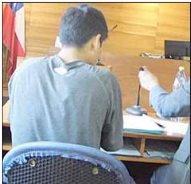
El detenido fue identificado como N.A.C.R., de 19 años, oriundo de la ciudad de Viña del Mar.

LOS ANDES.- Dos delincuentes atacaron a una mujer que se encontraba en un paradero de locomoción colectiva, con el objetivo de arrebatarle su teléfono celular.