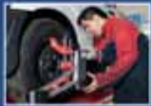
Taller de Mecánica