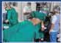
Pabellones de Práctica