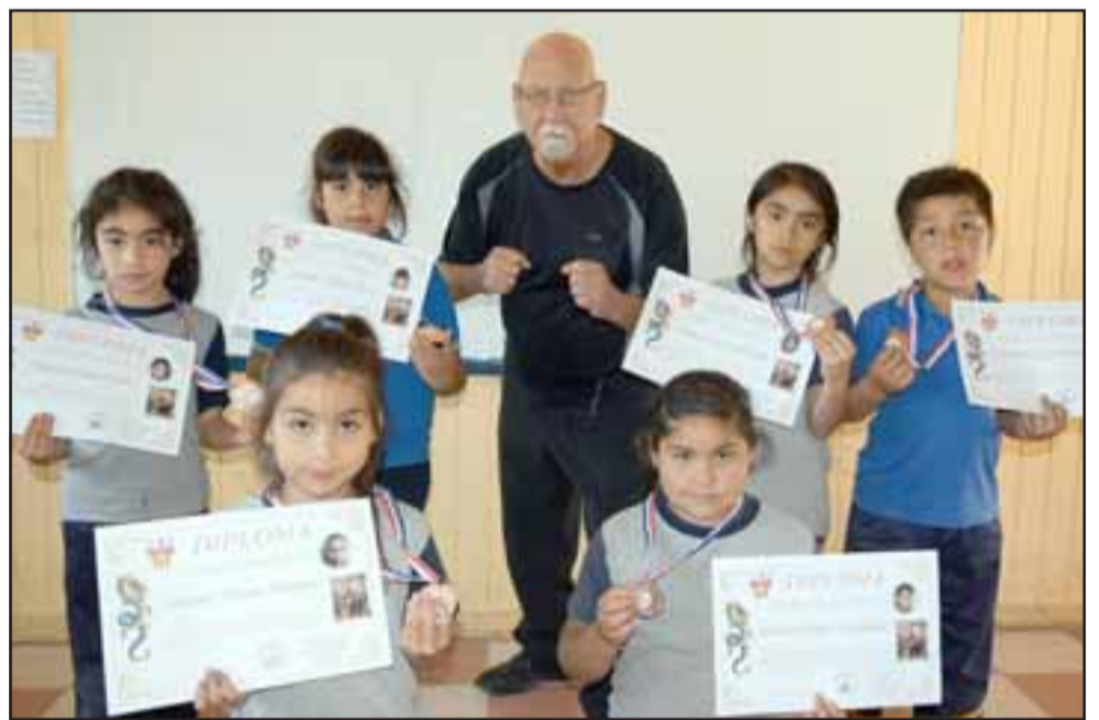
TALLER MUNICIPAL DE KARATE.- Ellos son nuestros campeones del Karate escolar, todos estudiantes de la Escuela Heriberto Bermúdez, de El Algarrobal.

dillo , quien es conocido deportista dedicado a la formación deportiva de niños, jóvenes y adultos de esta disciplina en nuestra comuna.