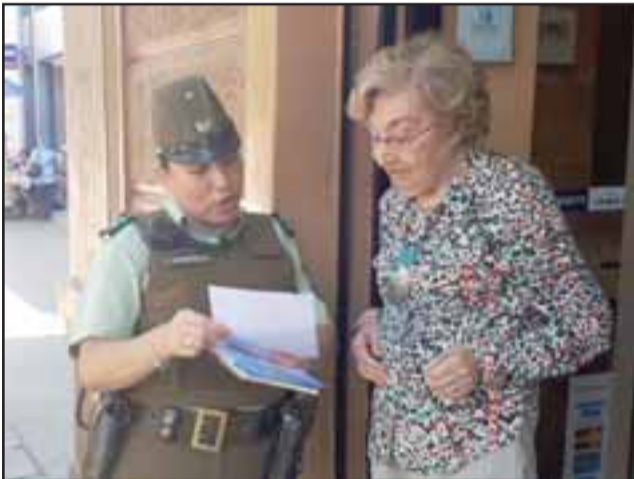
Carabineros hizo entrega de volantes para el autocuidado para evitar delitos de robo en locales del centro de la comuna de San Felipe.