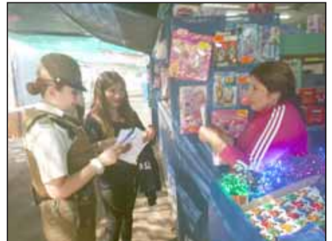
La campaña de Carabineros llegó también hasta la Feria del Juguete de San Felipe.