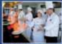
Taller de Gastronomía