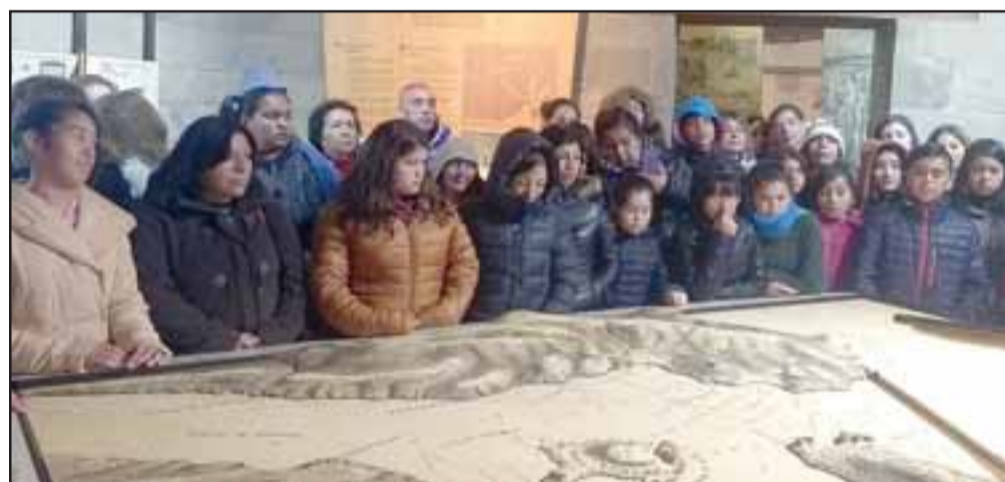
VISITARON MUSEO. - También los escolares visitaron el Museo de Niebla, a pocos kilómetros de Puerto Corral.