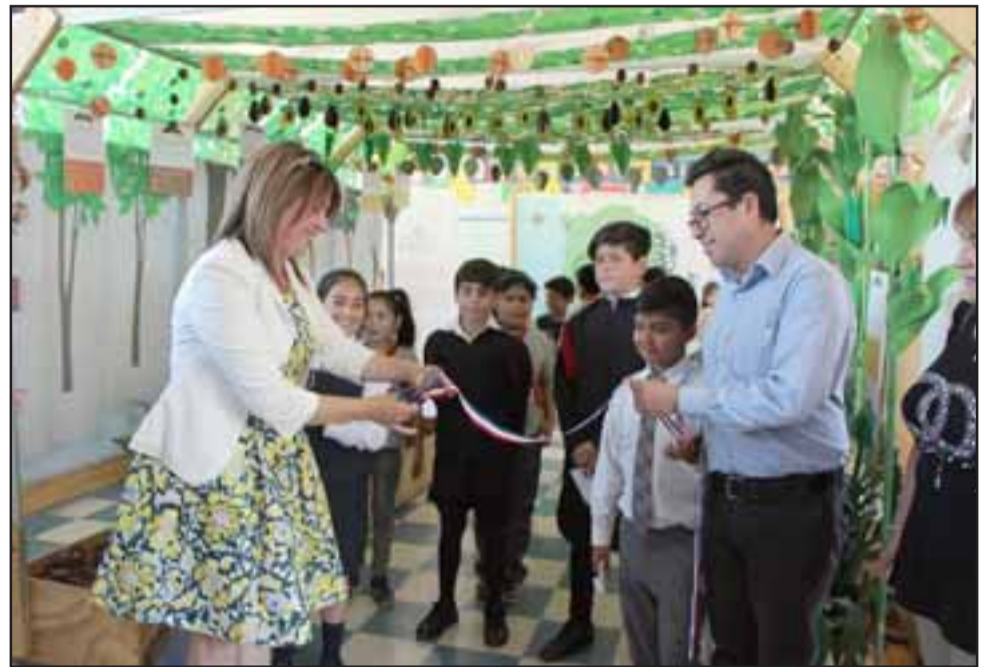
'Explora tu huerta', una interesante presentación de frutos y hortalizas que se producen en nuestra región, fue inaugurada en la Escuela José Manso de Velasco.