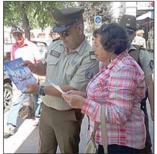
La Oficina de Integración Comunitaria de Carabineros junto a vecinos informando la campaña 'Navidad Segura'.