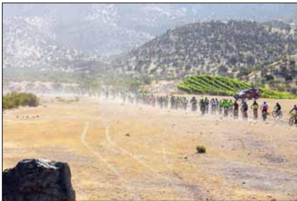
Fueron más de 600 los competidores que llegaron hasta Santa María para competir en el Desafío Mesetas de Jahuel