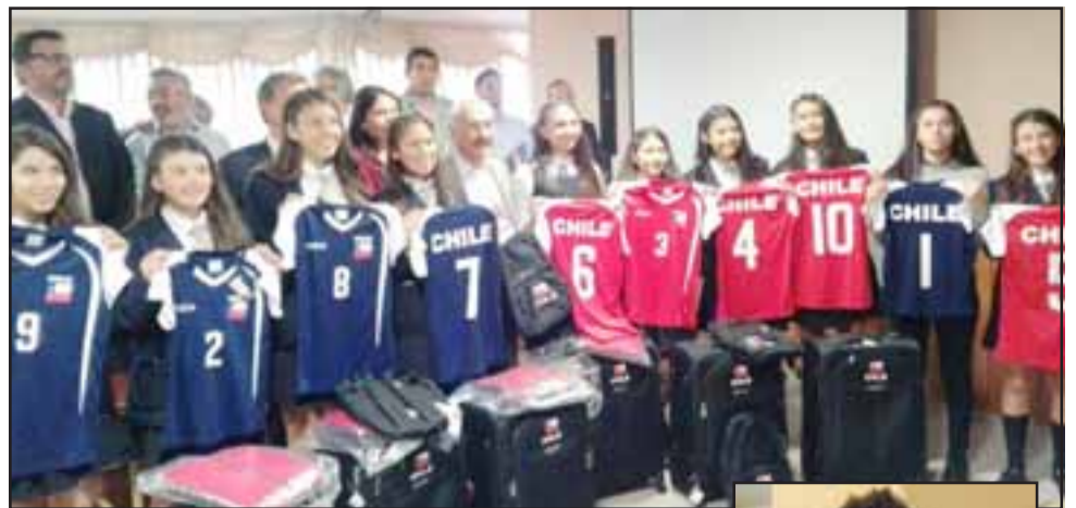
Equipo de vóley del Liceo Bicentenario Cordillera recibió implementación deportiva completa por parte del IND.

de trabajar acá en San Felipe, como hemos podido trabajar desde la etapa intercurso comunal, provincial, regional, nacional, hasta esta clasificación del liceo bicentenario a un sudamericano, esta colaboración que se ha estado desarrollando con la realización de los juegos deportivos escolares generan estas posibilidades de venir a hacer este reconocimiento en terreno, frente a los apoderados, las autoridades del mismo colegio y las autoridades de la comuna” , añadió el personero del IND