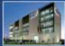
AIEP San Joaquín