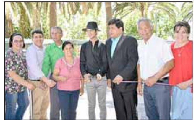
EXPO MUJER 2017. - Las autoridades comunales, provinciales y regionales hicieron el tradicional Corte de Cinta de esta Expo Mujer 2017.