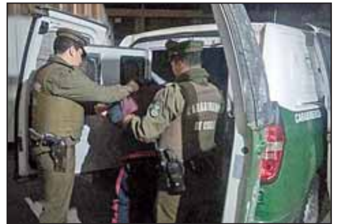
Los delincuentes fueron detenidos por Carabineros tras el reconocimiento de la víctima del robo con violencia ocurrido en Putaendo. (Foto Referencial).