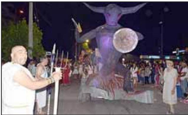
KRONOS Y LOS DIOSES. - Villa Padre Hurtado con el segundo lugar, estos vecinos presentaron el carro Dioses del Olimpo, ganando así los $200.000 que el Municipio dispuso.

Las cámaras de Diario El Trabajo tomaron regis-