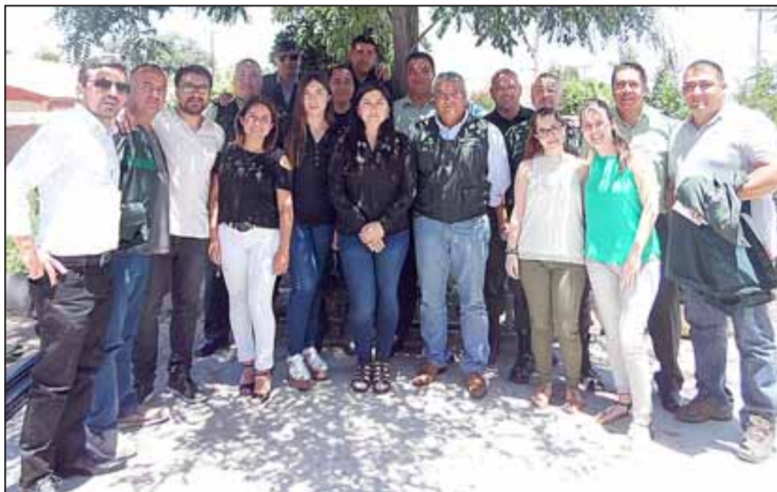
Este establecimiento alberga a 19 efectivos, tanto civiles como uniformados, y tiene una población penal de 41 usuarios, quienes trabajan en los distintos talleres que funcionan en él.

El día posterior a la actividad sin duda fue distin-