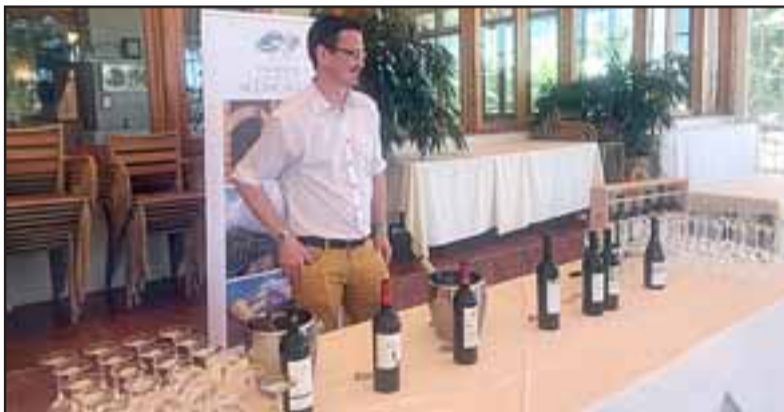
Algunos de los participantes mostraron sus productos durante la actividad.

Negocios, el convenio con Sence que ofrece capacitación, pero tenemos que estar todos sentados a la mesa para actuar. Hoy están las condiciones para poder armar una asociatividad para avanzar en esta línea que le va a dar valor agregado a la economía del Valle de Aconcagua», concluyó la máxima autoridad provincial.