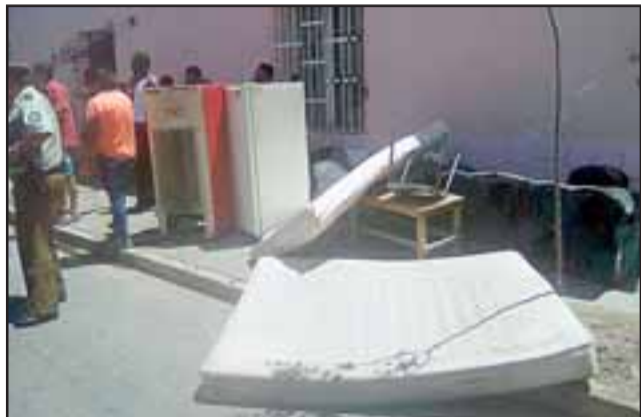
CON LO PUESTO.- Los residentes sólo pudieron sacar unas pocas pertenencias, tal como lo muestra esta gráfica.