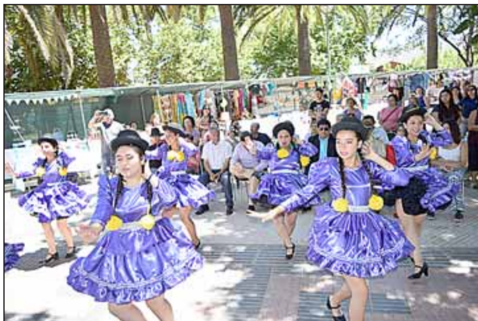
BELLEZA Y TALENTO. - Estas bellas jovencitas son quienes dan vida y resplandor al Ballet Folclórico Municipal de Santa María, siempre presentes en estas actividades de la comuna.