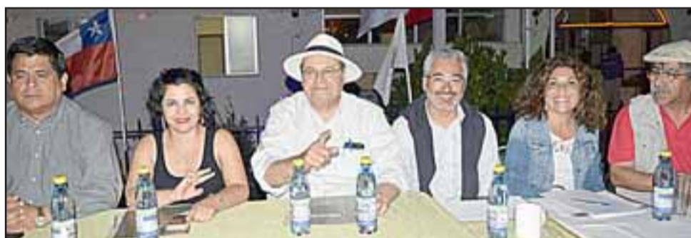
JURADO TIKI TAKA. - Estas conocidas personas fueron quienes conformaron el Jurado calificador de los carros alegóricos.