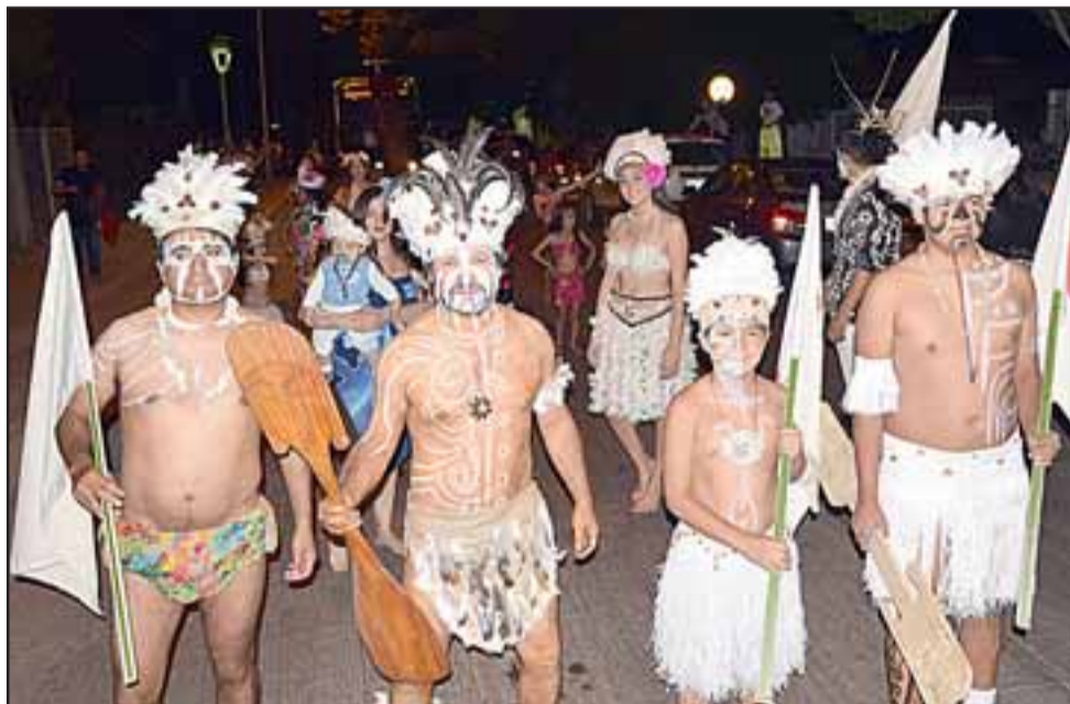
CARRO GANADOR. - Estos vecinos de Población Roberto Huerta ganaron el primer lugar con su carro alegórico 'Isla de Pascua' ($300.000).