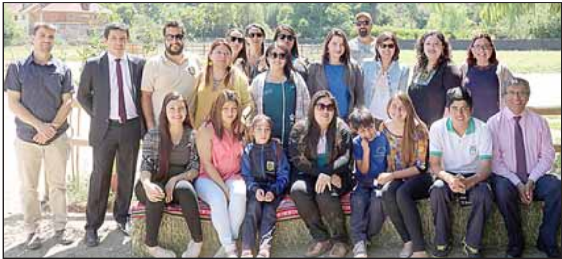
Vecinos de Putaendo y del resto del Valle de Aconcagua han aprovechado de los servicios de Equiendo.

conocer parte los resultados de la equinoterapia, donde un niño pudo levantarse y quedar de pie sobre el caballo, potenciando su salud física y mental. Se espera que el próximo año se siga trabajando en este tipo de actividades terapéuticas.