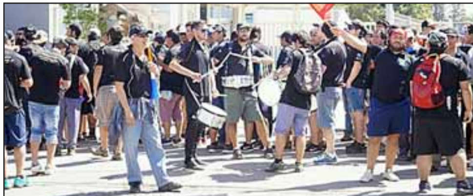
En huelga legal se encuentran estos trabajadores de la empresa Renault-Cormecánica, de Los Andes, quienes en el curso de la presente semana han estado realizando manifestaciones en el frontis de la planta de Avenida San Rafael.

A través de un comunicado, la empresa lamentó no haber logrado aún un acuerdo con sus trabajadores, ya que la huelga impacta la imagen de Cormecánica. Producto de esta acción