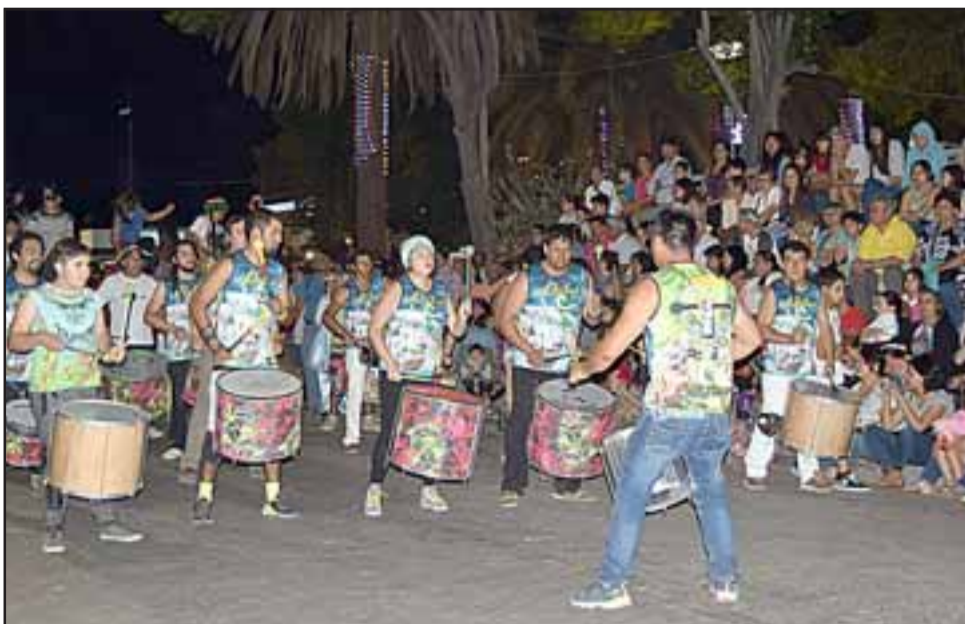
CON MUCHA ENERGÍA. - Ellos son los Batuqueros que abrieron el desfile de carros alegóricos 2017, en el centro de la ciudad de Santa María.