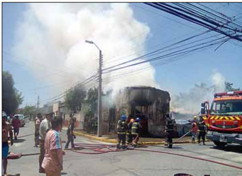
TRISTE DOMINGO.- Las llamas hicieron su siniestro trabajo en estas viviendas, ubicadas en esquina San Martín con Navarro.