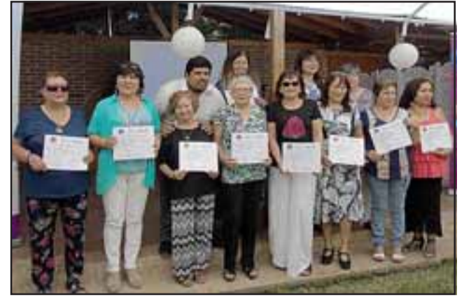
Unas 47 mujeres de la provincia de Los Andes fueron certificadas por haber sido parte de la Escuela de Formación Política para la Igualdad de Género, que desarrolló la Fundación Prodemu.