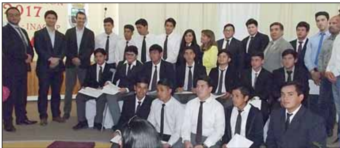
Ellos son parte de los titulados en este curso Forcom de soldadura.

citación dictada a través del programa de Formación por Competencias (Forcom) para educación media, son estudiantes de las especialidades de Montaje Industrial y Administración de Empresas mención en Recursos Humanos.