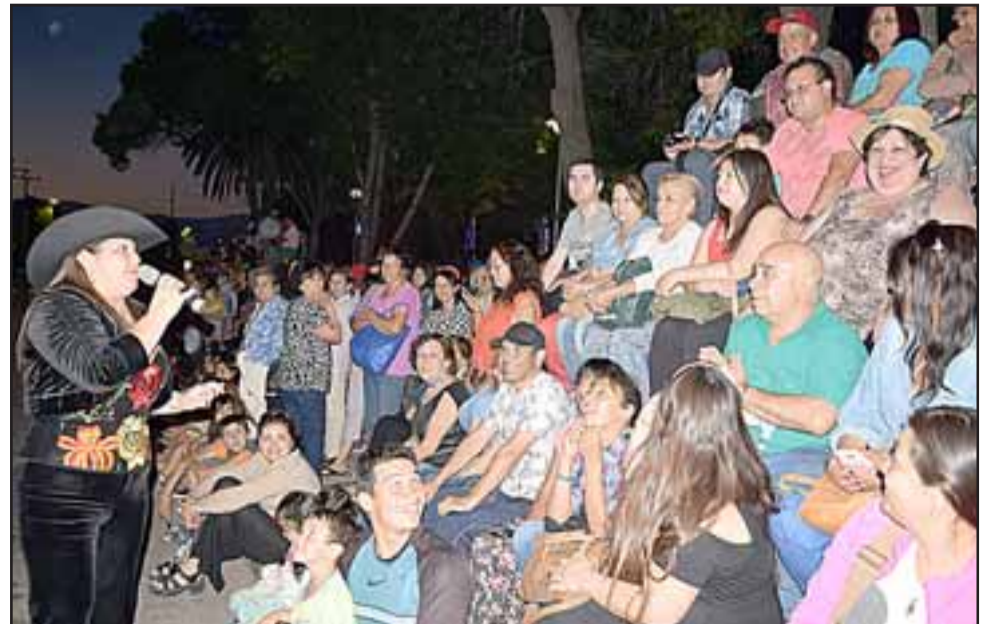
SIEMPRE LUCERO. - Así conquistó una vez más el corazón de su público la artista aconcajiña Lucero Fernández, quien lleva más de 12 CD producidos.