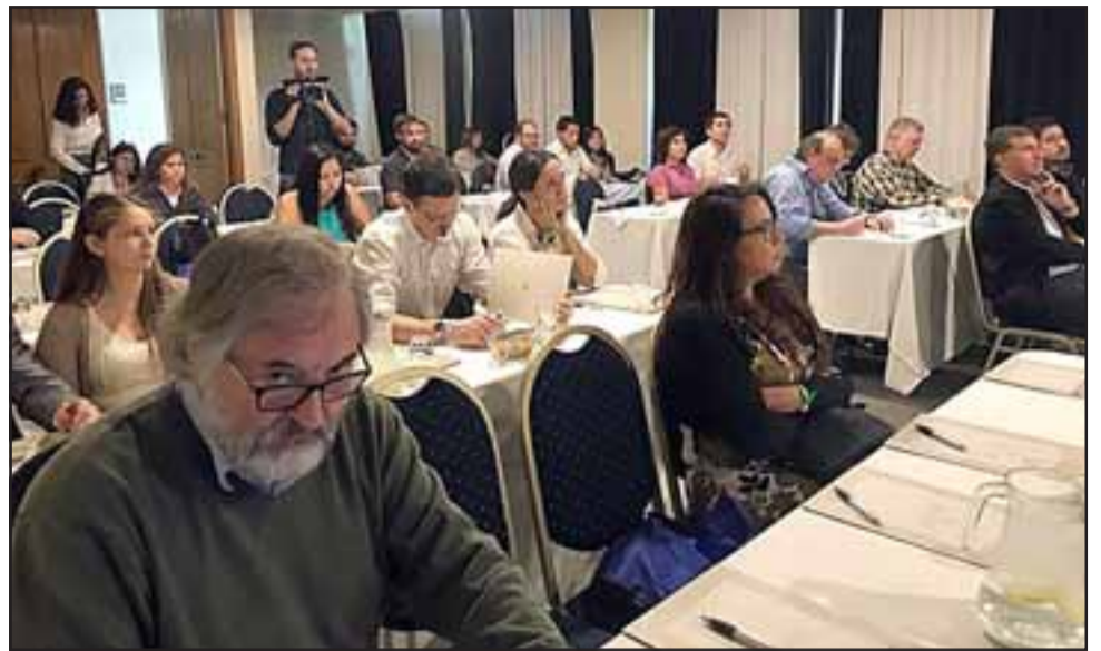
Empresarios aconcaguinos participaron con gran interés en este seminario.

Para lograr este objetivo, el apoyo entregado por la Fundación ProAconcagua ha sido de suma relevancia puesto que ha jugado «el rol de ser articulador de esto que es tan importante como es la asociatividad. Nosotros podemos ser el punto de unión para poder trabajar. Tenemos la visión del