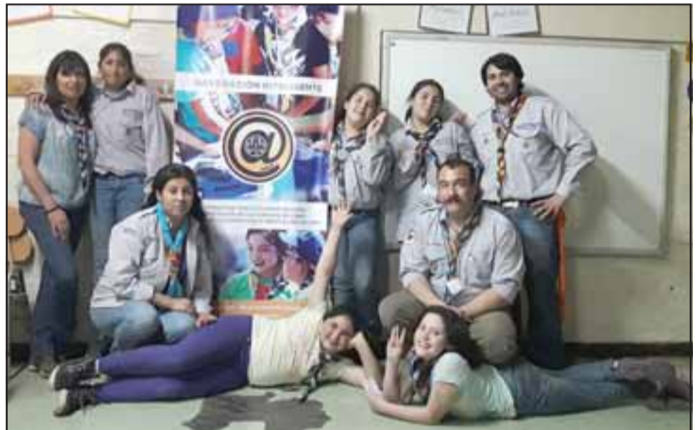
SIEMPRE ALERTAS. - Estos chicos por ejemplo, recibieron recientemente una capacitación para navegar en Internet de manera segura.

San Felipe estará conformado por los siguientes grupos de guías y scouts: Grupo guías y Scouts Cumbres de Aconcagua, cuyo lugar de trabajo es el Colegio Greenland, los días sábados entre las 10:00 y las 12:00 horas; el Grupo guías y Scouts San Pedro Nolasco, su