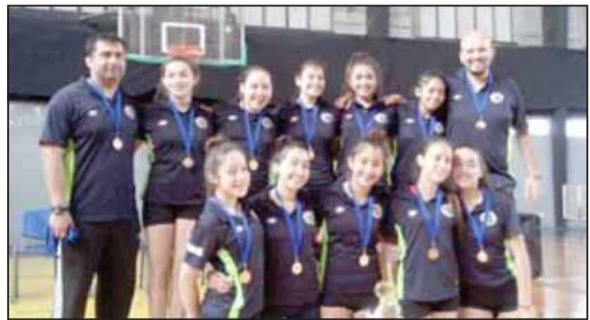
En la ciudad de Victoria, San Felipe Vóley se convirtió en campeón nacional federado en la serie U14.