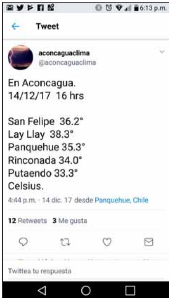
El tweet de Aconcaguaclima con las máximas registradas en la provincia.