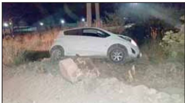
Así concluyó la loca carrera efectuada por el imputado tras haber atropellado al Suboficial de Carabineros, quien se aferró al capot del automóvil.