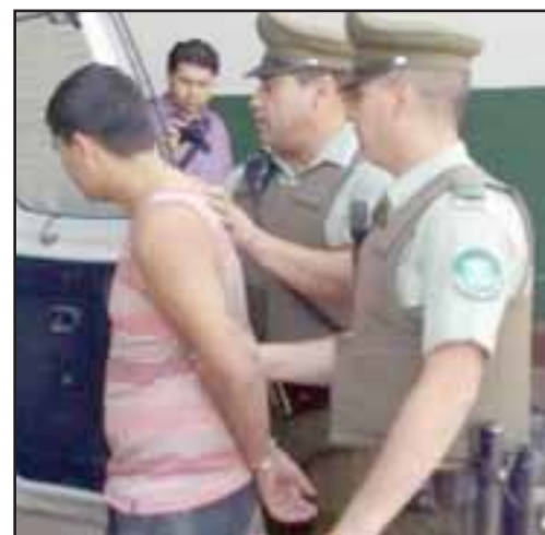
El imputado, tras permanecer en la cárcel, deberá recluirse las 24 horas en su domicilio por disposición de la Corte de Apelaciones de Valparaíso.

Fue así que la Corte de Apelaciones de Valparaíso resolvió otorgar la libertad del acusado el día 9 de diciembre, quedando citado a comparecer el pasado lunes hasta el Juzgado de Garantía de Los Andes para au-