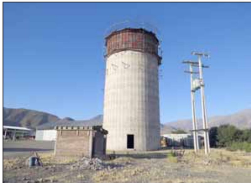
La copa de Lo Galdámez que finalmente será terminada y podrá aumentar tanto el caudal y presión como actuar de acopio para los pozos nuevos de la Cooperativa de Agua Potable de Santa Filomena.

na de Santa María, humildemente, le llegaron más de 1.200 millones de pesos, tanto de FNDR (Fondo de Desarrollo Regional) como de la Circular 33. En FNDR tenemos un proyecto que es muy emblemático y es el término del proyecto de expansión de agua potable para la Cooperativa de Santa Filomena. Son 761 millones de pesos que vienen a