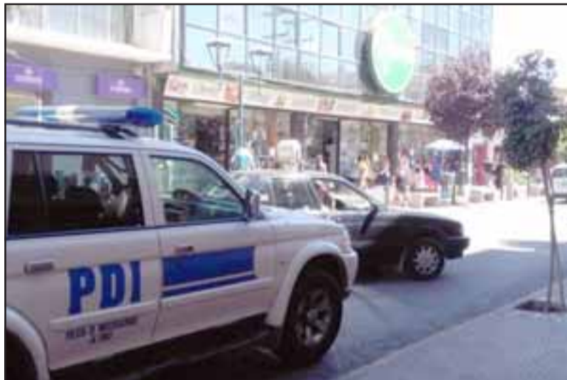
Los delincuentes ingresaron al local rompiendo un tragaluz de acrílico de la techumbre, llevándose entre cinco a diez millones de pesos en especies.

Hasta el local concurren oficiales de la Brigada