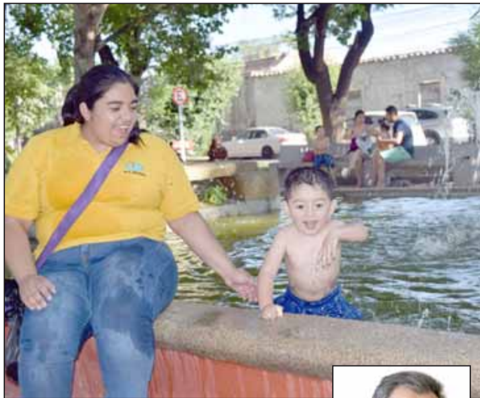
Un pequeño escapa de la alta temperatura de ayer en la pileta de los sapitos, en Avda. O'Higgins de San Felipe.

Producto de estas condiciones el Gobernador de la Provincia de San Felipe, Eduardo León, se refirió a la ola de calor que azotará el Valle durante estos días y manifestó que “efectivamente tenemos una alerta preventiva por el aumento de las temperaturas sobre los 30°, también sabemos que la humedad estará baja y la probabilidad que el viento supere los 30 kms/h, así que es-