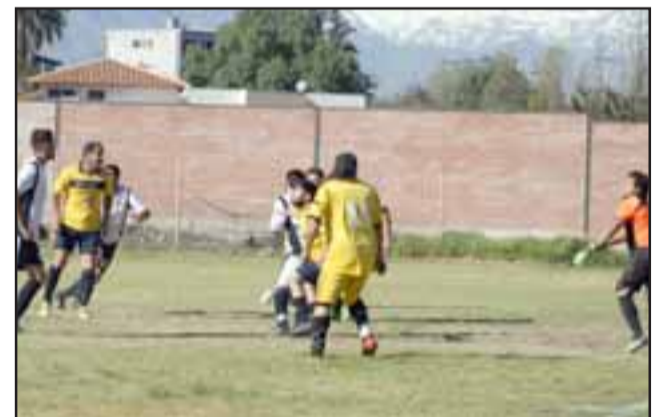
Hoy tendrá lugar la ceremonia de premiación y clausura del campeonato 2017 de la Asociación de Fútbol Amateur de San Felipe.

Reinoso también dio a conocer que aparte de los trofeos que se entregarán a los clubes campeones en las respectivas series, también se premiará a todas las instituciones.