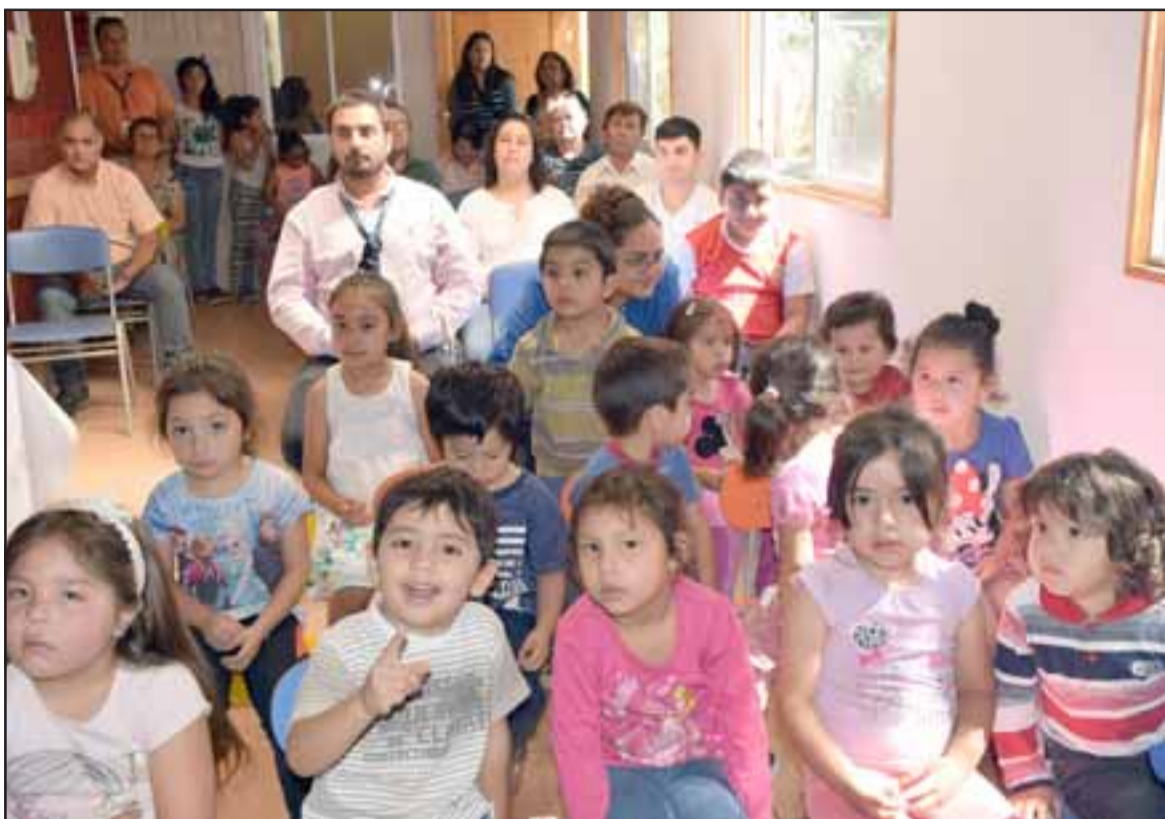
UNA VIDA SALUDABLE.- Niños, madres y padres de familia en general se mostraron felices y esperanzados con la inauguración de este nuevo punto de salud satelital.