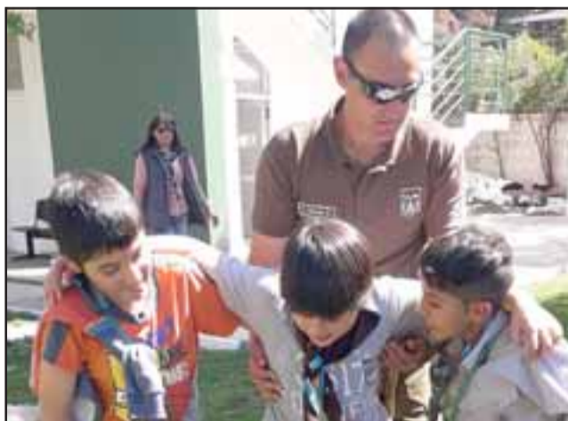
APRENDEN JUGANDO. - Aquí vemos a estos niños Scouts, recibiendo entrenamiento en la capacitación impartida en la Escuela de Fronteras Teniente Hernán Merino Correa, de Carabineros de Chile.