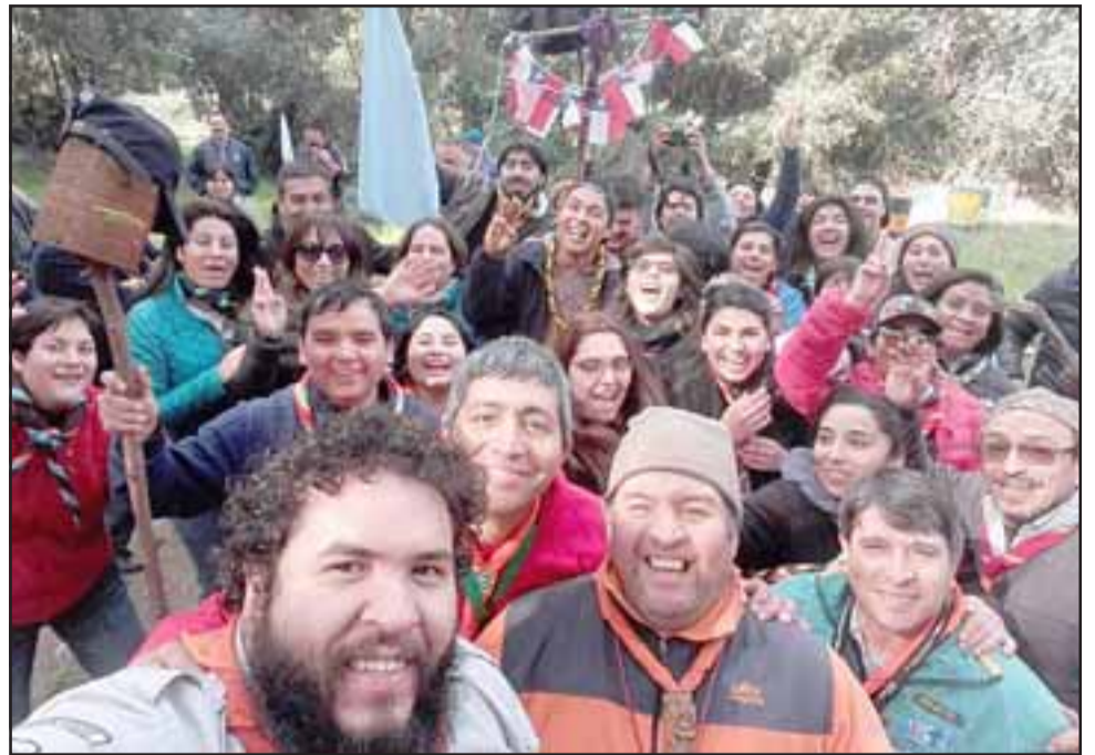
FELIZ CUMPLEAÑOS. - Ellos son parte de la gran familia Scouts de dirigentes en el Valle de Aconcagua.