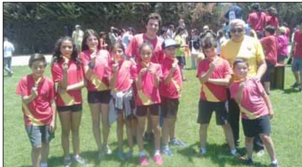
Los atletas más pequeños del Colegio Alemán también se encumbraron como los mejores de la región.