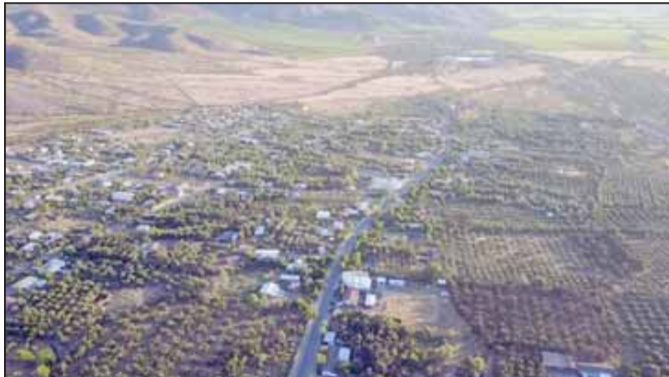
La localidad de Santa Filomena, vista desde el aire, da cuenta de una comunidad que crece día a día.

terminar una larga agonía que nos afligía hace más de 6 años, cuando una empresa que quebró dejó un proyecto inconcluso que ahora se retoma, y prontamente tendremos más de 100 familias adicionales con agua potable, lo cual nos pone muy contentos».