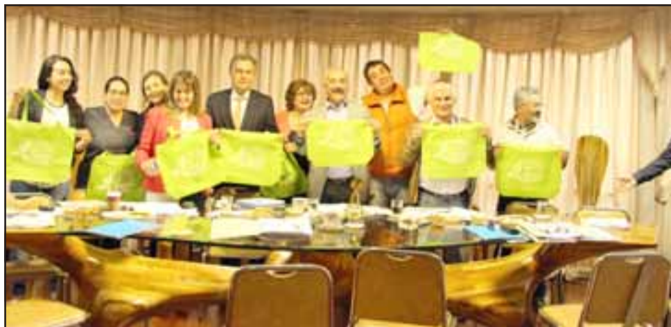
En forma unánime el Concejo Municipal resolvió aprobar la ordenanza que prohíbe la entrega de bolsas plásticas a aquellos comerciantes que voluntariamente adhieran a este compromiso.

Durante el último año, los profesionales se han reunido con el comercio mayorista y minorista, feriantes y retail, quienes reconocen la importancia de disminuir el uso de las bolsas plásticas para no contaminar, a lo que se suma