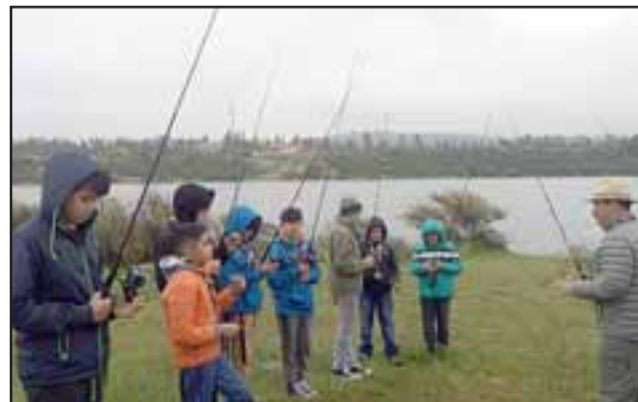
CLASES DE PESCA. - Ya en el campo, los Scouts desde muy chicos aprenden a valerse por sí mismos.