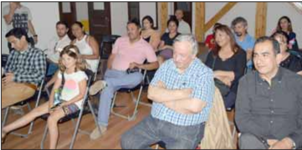
ACONCAGÜINOS MUY ATENTOS.- Muchos sanfelipeños asistieron con gran interés al lanzamiento de esta nueva obra literaria.

tro hermanos, aún es soltero y ya se perfila como una de las promesas en vías de