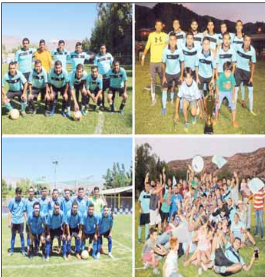
El club O'Higgins de Las Coimas fue el mejor de todos en el torneo de la Asociación de Fútbol Amateur de San Felipe.