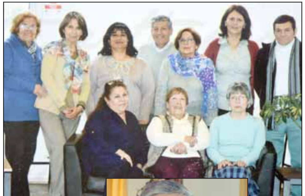
Aquí vemos a los miembros del Taller Literario Biblioteca Municipal Gabriela Mistral, de Santa María.