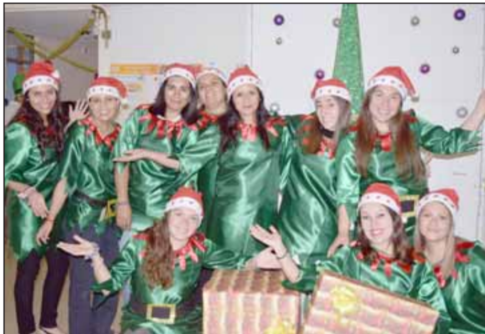
DUENDES A LA OBRA.- Estos funcionarios municipales están listos para la dura jornada navideña que hoy viernes se desarrollará para alegría de los niños de Santa María.