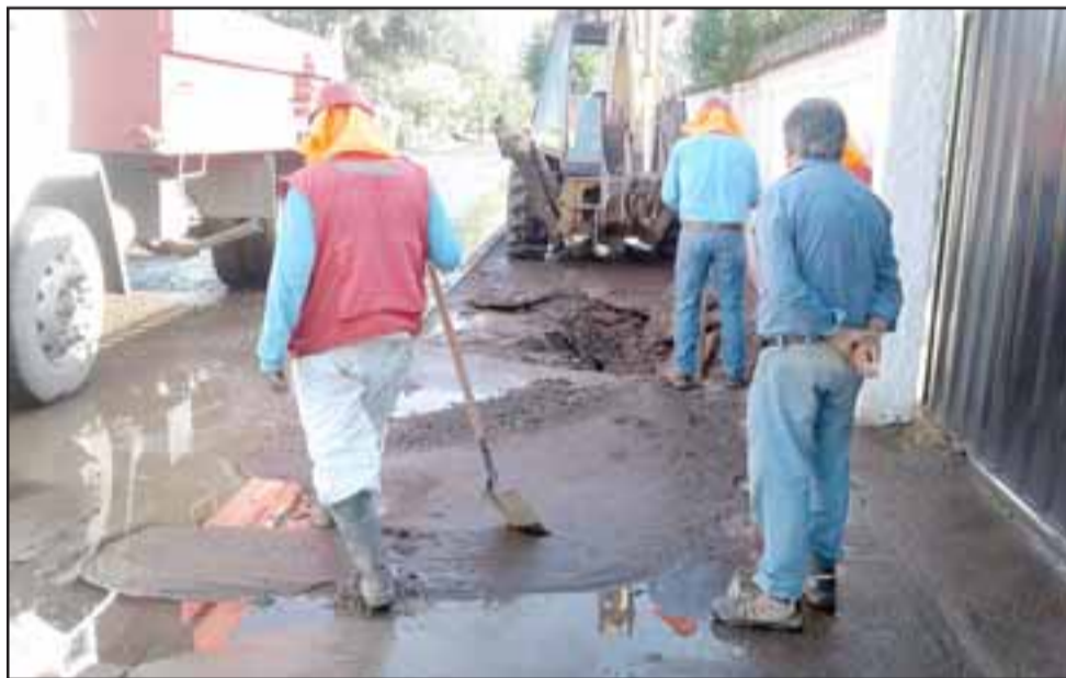
Personal de Esvall llegó al lugar y efectuó los trabajos de reparación.