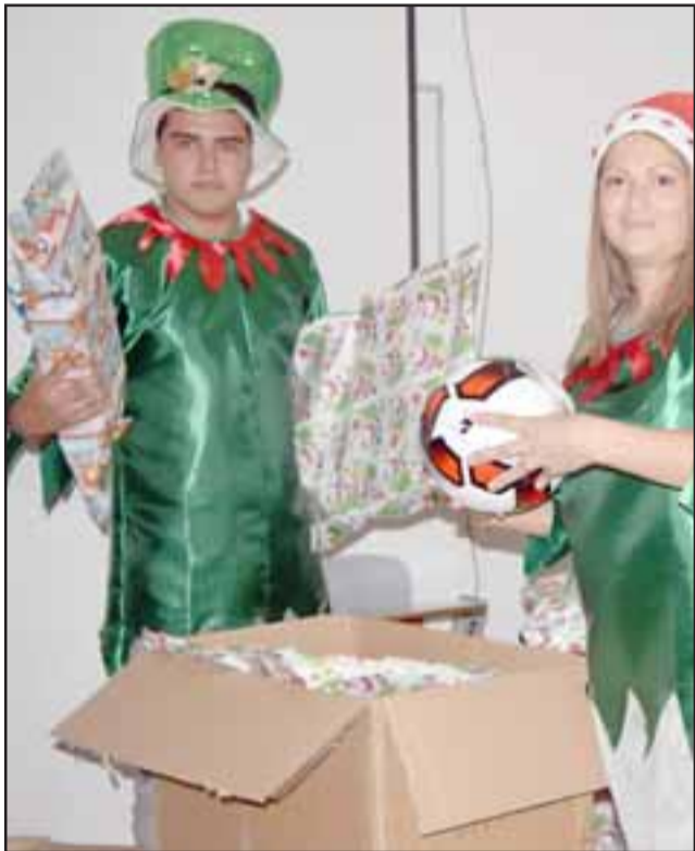
HOY EN LA PLAZA DE ARMAS.- Hoy viernes a partir de las 19:30 horas en la Plaza de Armas de Santa María, todos los niños de esa comuna tendrán la fiesta navideña más regalona de sus vidas.