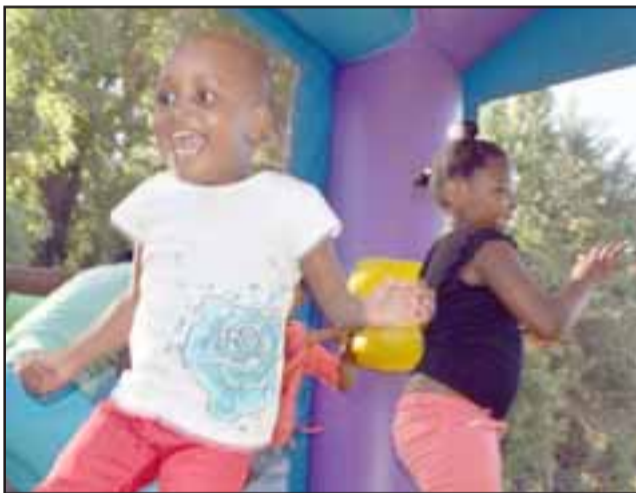
A JUGAR SE HA DICHO.- Esta sonrisa lo dice todo, como nunca antes estos pequeñitos vivieron un mágico día en los juegos inflables para ellos instalados.