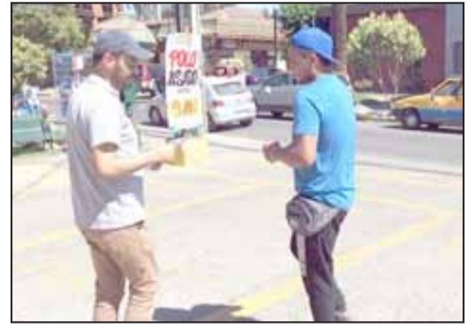
Intensa y creativa ha sido la promoción que está desarrollando la Escuela Carolina Ocampo para captar más alumnos.

«El próximo año contaremos con salas temáticas,