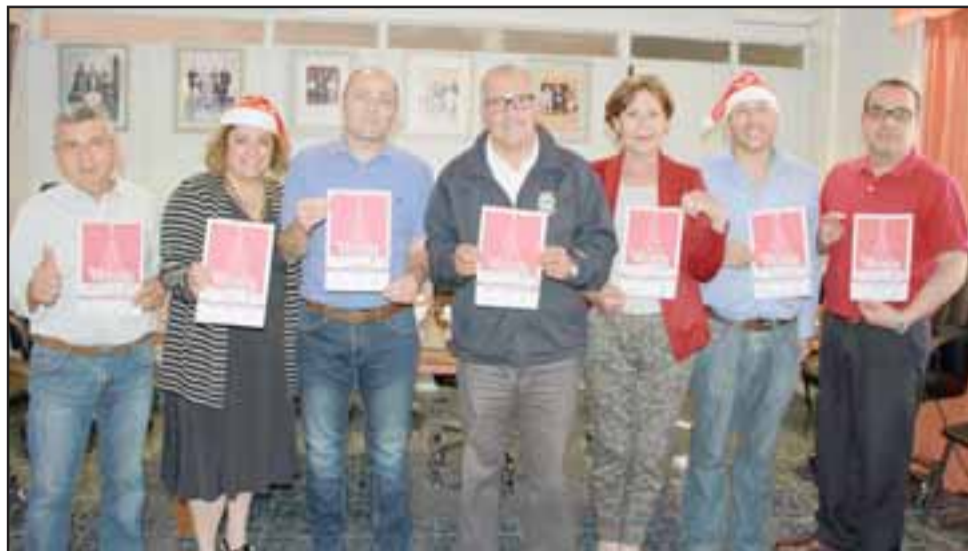
Una especial invitación formularon alcalde y concejales de Putaendo a celebrar la Navidad con un gran show infantil en la Plaza Prat junto a la banda del can más famoso de Chile: El Perro Chocolo, hoy desde de las 20 horas.

La celebración estará acompañada de una mágica ornamentación navideña, luces y el tradicional árbol de pascua ubicado a un costado de la pileta de la Plaza Prat.