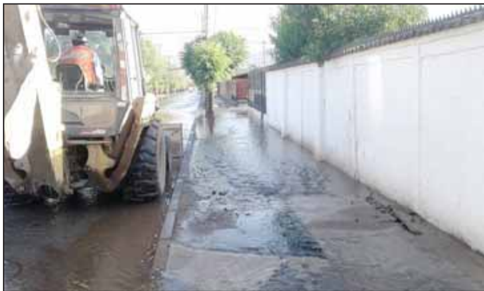
Este es lugar exacto donde se produjo la rotura de la matriz.

Debido a los trabajos, unos 120 clientes aledaños al lugar donde se produjo la rotura, sufrieron el corte del vital elemento durante la mañana de ayer e incluso en algunos domicilios baja de presión.