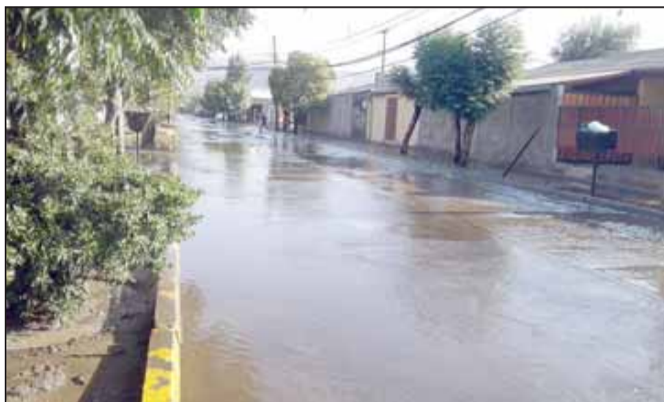
En la imagen se puede apreciar la calle completamente inundada.