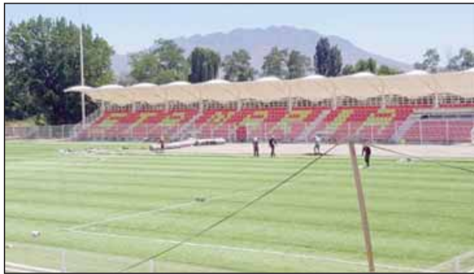
Es casi un hecho que Unión San Felipe jugará algunos partidos como local en el nuevo estadio Municipal de Santa María.