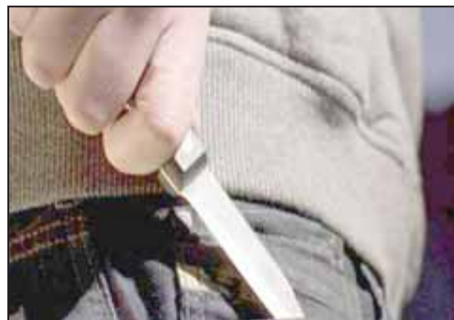
El condenado deberá cumplir un total de 602 días en la cárcel tras haber sido declarado culpable de las lesiones sufridas con arma blanca por ambas víctimas. (Foto Referencial).

Ambas condenas deberán ser cumplidas en forma