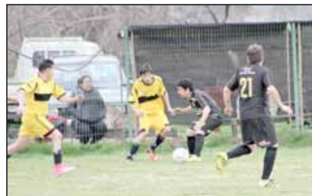
Escasa será la participación de los clubes sanfelipeños en los próximos torneos Afava y Amor a la Camiseta.