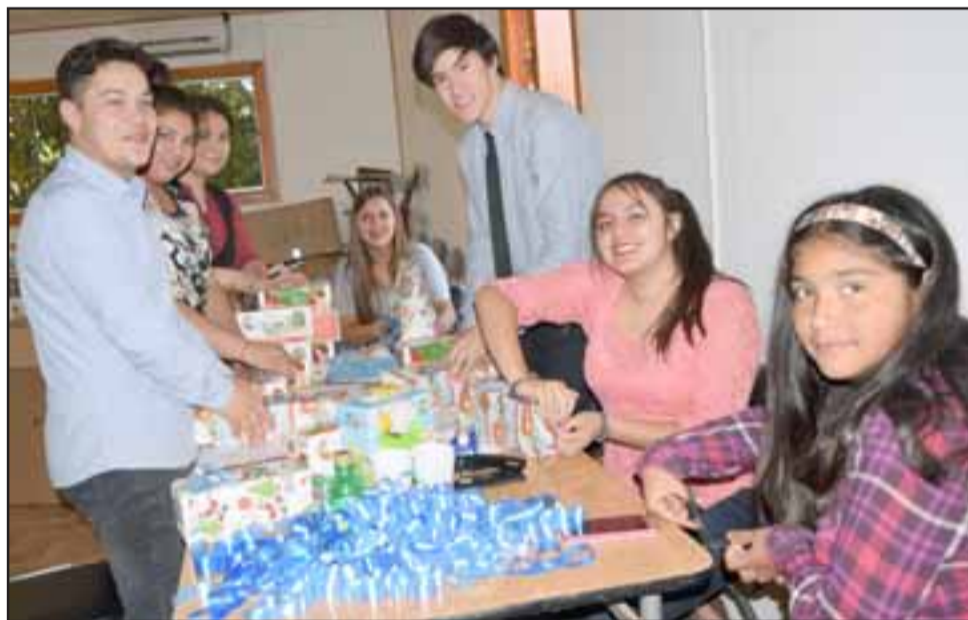
EXPERTOS EN JUGUETES.- En las dependencias del Dpto. Social encontramos a estos funcionarios haciendo su trabajo juguetero.