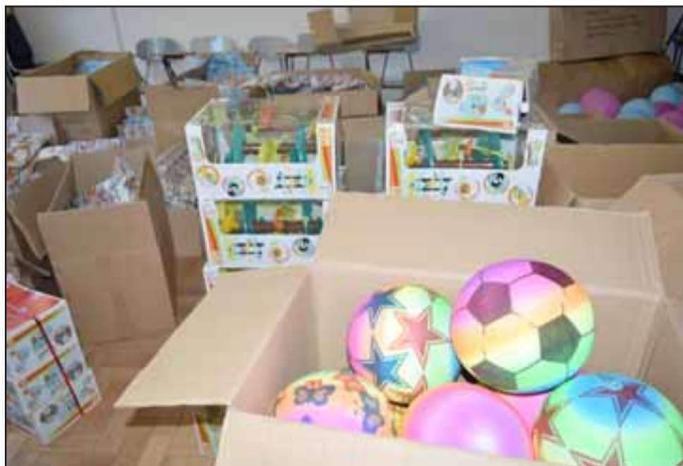
MUCHOS JUGUETES.- Vienen pelotas, juegos para niñas, disfraces, juegos de mesa, juguetes a pilas y electrónicos.