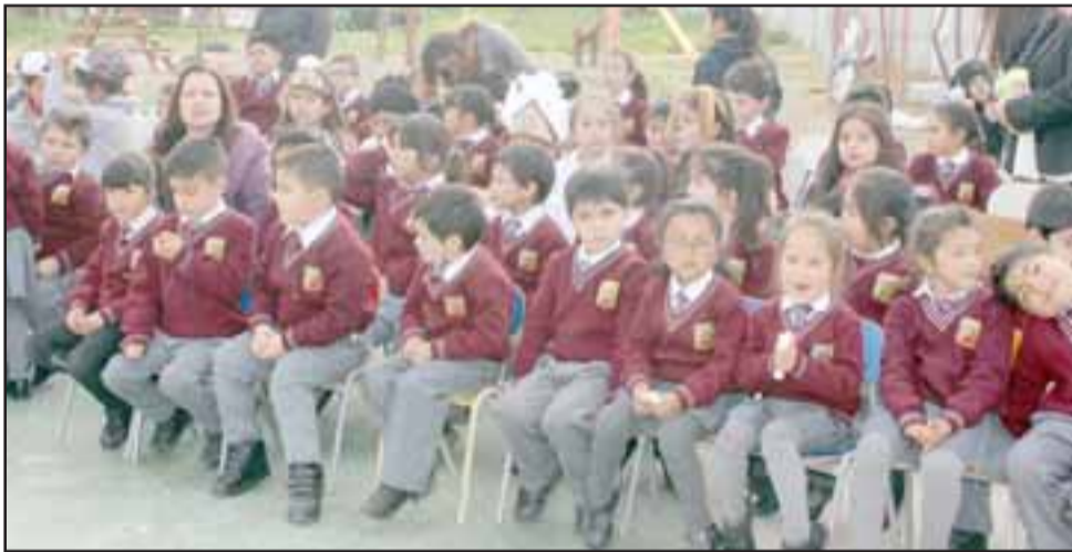
Los pequeños de la Carolina Ocampo tienen clases personalizadas, con menos de 20 alumnos por sala.

ción personalizada, la promoción del deporte y el arte, en una labor que tiene muy comprometidos a los profesores y asistentes de la educación, quienes se han encargado de salir y recorrer los distintos sectores de la comuna, no solo rurales del entorno inmediato, sino también en sectores urbanos de San Felipe.