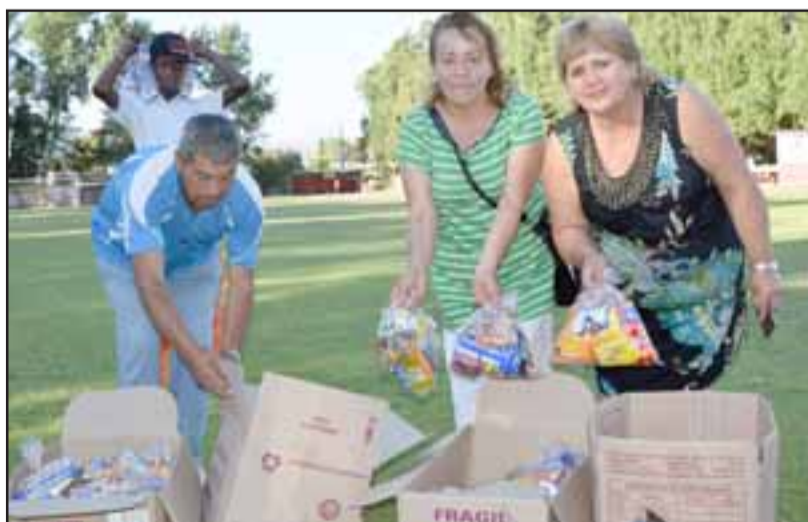
VECINAS REGALONAS.- Ellas son varias de las vecinas sanfelipeñas que ayudan bastante a coleccionar donativos para esta fiesta.