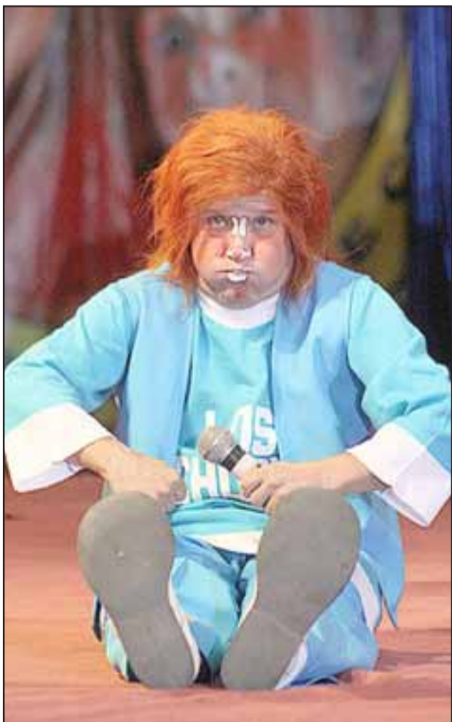
A REÍR TODOS.- Tachuela Chico también hará de las suyas hoy en la Plaza de Armas de Santa María.