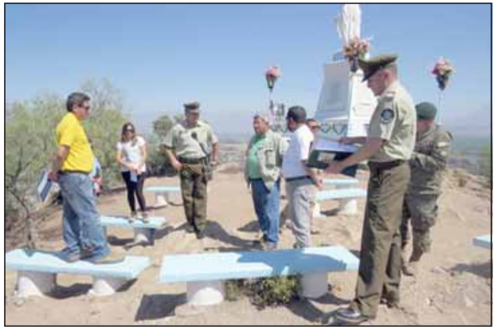
La autoridad fiscalizadora de control de armas, el municipio y profesionales de la empresa Pirotecnia Igual realizaron una visita inspectiva a la cima del cerro La Virgen, lugar donde el próximo 31 de diciembre se lanzarán los fuegos artificiales para recibir el 2018.

Sostuvo también que actualmente el lanzamiento de las bombas se hace vía electrónica y de manera remota, por lo que se disminuyen los riesgos para los operadores.