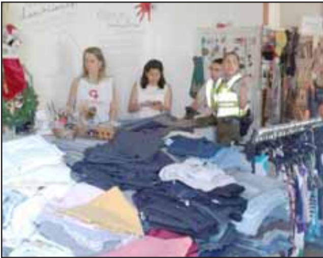
Carabineros en el interior de la tienda acogiendo la denuncia respectiva.

Un nuevo robo el segundo, afectó a la Tienda Coaniquem Store, ubicada en la intersección de las calles Carlos Condell con Salinas, en San Felipe. El hecho delictual quedó al descubierto este viernes en la mañana cuando una de las voluntarias que labora en el establecimiento se dio cuenta que la venta ubicada por Calle Salinas estaba abierta y había ropa tirada en el suelo.