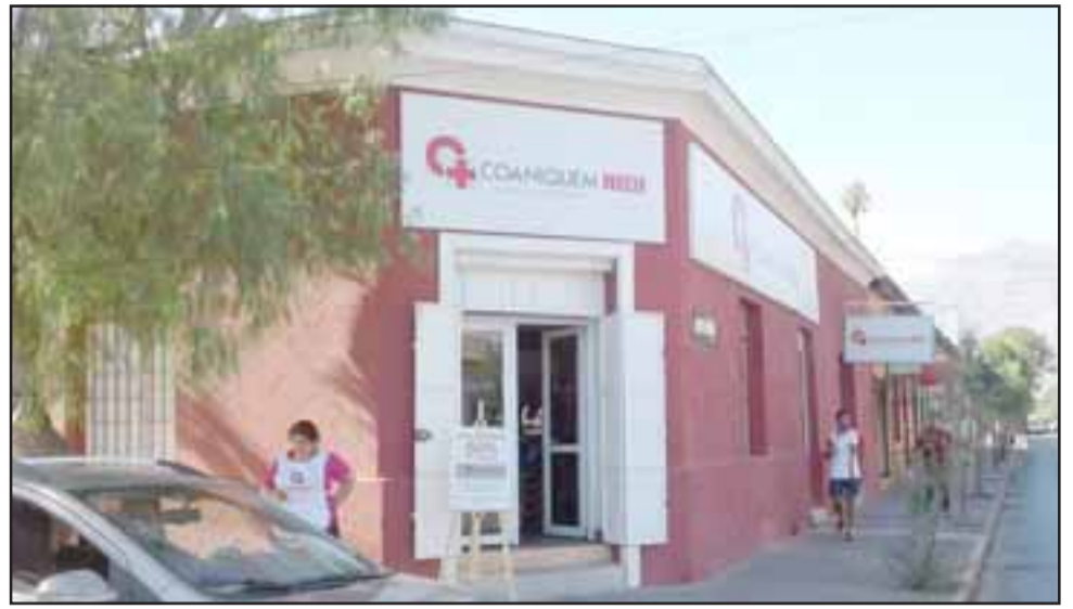
Frontis de Tienda Coaniquem Store, ubicada en la intersección de las calles Carlos Condell y Salinas, en San Felipe.

La encargada calificó este nuevo hecho delictual como penoso porque es una tienda que vende productos que van en beneficio de los niños que han sufrido quemaduras «en beneficio de sus tratamientos, es un ingreso mas para poder cubrir los tratamientos de los niños y resulta que la gente no tiene pudor, da rabia impotencia ver como la gente puede ser tan mala para que para vender, acá las cosas son baratas, lamentablemente nos tocó nuevamente», finalizó. Reiterar que este es el segundo robo del cual son víctimas como institución.