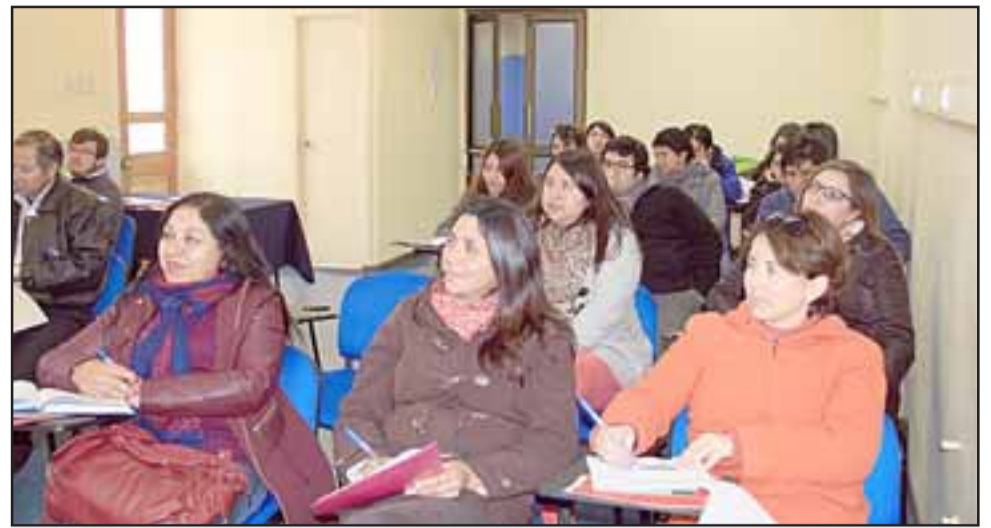
Profesionales de distintos departamentos y oficinas del municipio, se capacitaron en la metodología Triple P, Programa de Parentalidad Positiva de la Universidad de Queensland, Australia, que les permite brindar apoyo a los padres en temas de crianza. (Referencial)

El Programa de Parentalidad Positiva los certificó para brindar apoyo a los padres, madres y cuidadores de San Felipe –a través de talleres y seminarios– enseñándoles estrategias simples y prácticas para manejar, con confianza, la conducta de sus hijos e hijas, prevenir problemas en el desarrollo y construir relaciones fuertes y saludables.