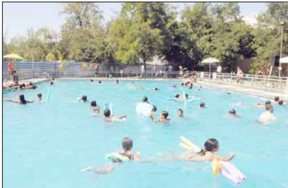
En la piscina del Liceo América se estarán desarrollando en este verano muchas de las actividades anunciadas.

Por último, la primera versión del Campeonato de