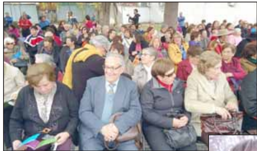
CENTRO AYECÁN.- Miles de adultos mayores de nuestra comuna han hallado abrigo y apoyo en el Centro de Mayores Ayecán,

- Lo más importante que marcó un antes y un después en el éxito del Centro,