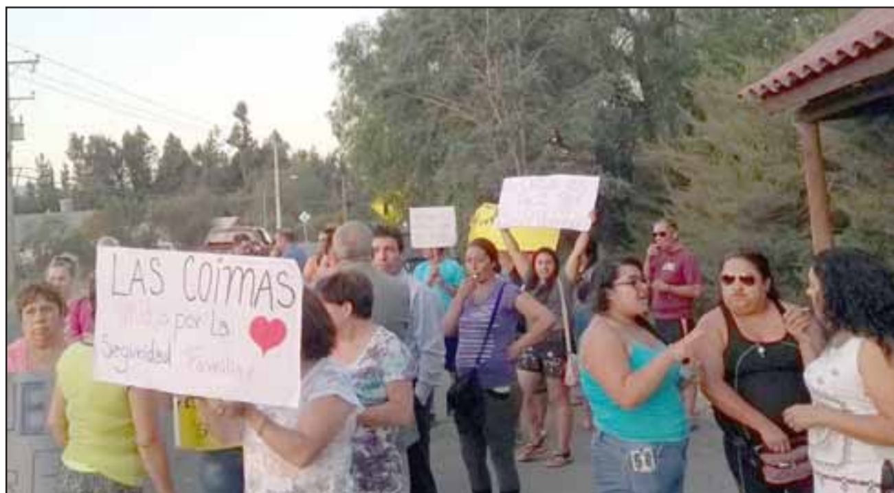
SEGUIRÁN PRESIONANDO.- Los vecinos de Las Coimas no descartan continuar desarrollando protestas en el sector, hasta que su problema les sea solucionado.

ante Carabineros y finalmente al joven lo dejaron libre (...) quiero aclarar a los vecinos de Putaendo y de Las Coimas, que nosotros refugiamos delincuentes, es verdad que recibimos a personas que han tenido problemas con la Justicia, pero siempre y cuando éstas estén buscando cambiar sus vidas, lo que pasa también es que a veces los residentes abandonan el Hogar, a los días de haberse ido cometen robos, y los vecinos obviamente que los relaciona con nuestro Hogar, en otros casos son delincuentes de Santiago y de otras comunidades los que cometen los delitos, lo cierto del caso es que vamos aún a estar más vigilantes, para que esto no se repita», respondió Orellana a Diario El Trabajo . Roberto González Short