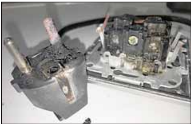
MORTAL.- La lavadora está energizada a 220 V, entonces esta persona al estar con los pies mojados hizo contacto y puente, falleciendo de un shock eléctrico en el mismo lugar. (Referencial)

Familiares hallaron el cuerpo sin vida en horas de la madrugada de este sábado, al interior de su domicilio en Fundo Las Tejas, en el sector Los Campos de Rinconada de Los Andes.