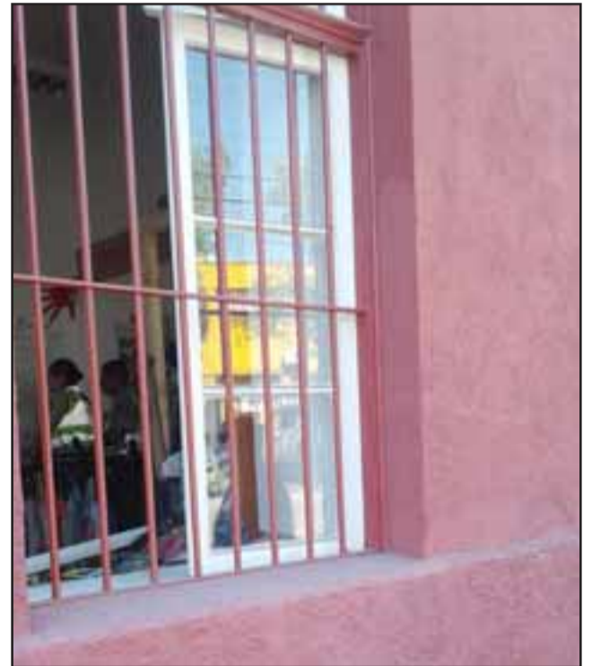
Por esta ventana ingresó él los delincuentes que robaron especies desde la tienda.

La Tienda Solidaria Coaniquem Store fue inaugurada en el mes de julio del año pasado y su especialidad es vender ropa usada donada por sus socios.