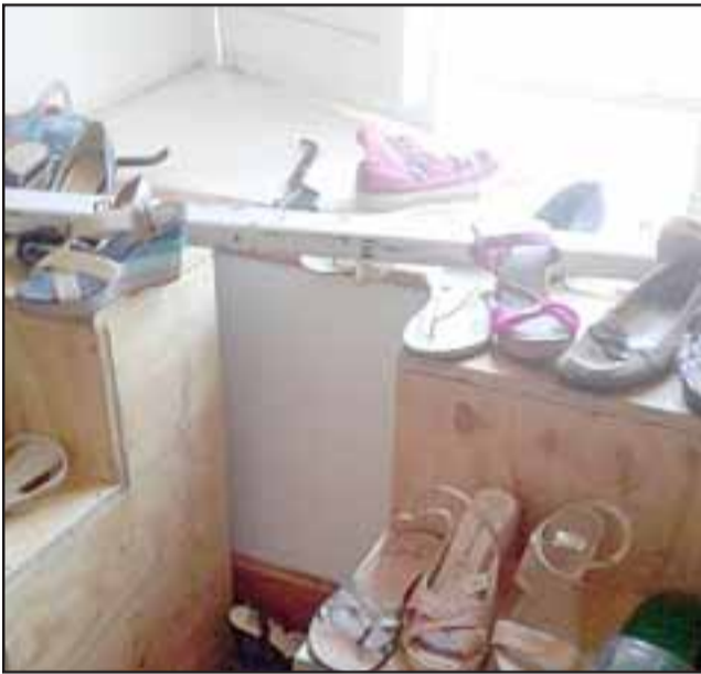
Desde acá robaron especies. Los ampones se llevaron los artículos de más valor.

El o los delincuentes robaron carteras, ropa, por el desorden visible en el lugar.