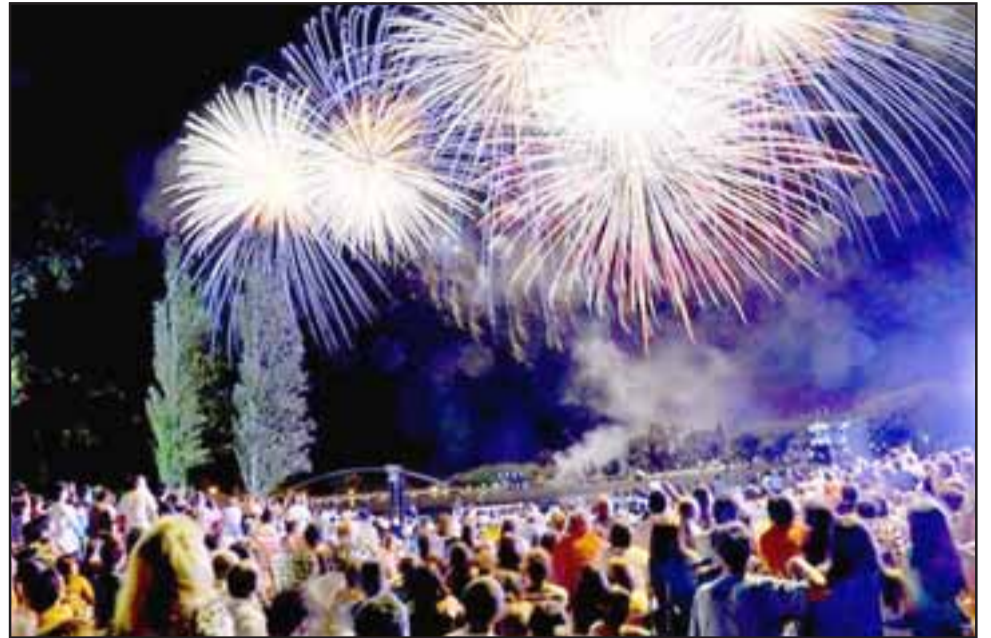
Miles de vecinos en varias comunas andinas celebraron a lo grande la despedida del Año Viejo y la llegada del 2018.

desde los patios o frontis de los propios domicilios, calles, avenidas y rutas; lugares donde se efectuaron eventos, fiestas, en restaurantes, centros de diversión nocturno y en los que se estaban cumpliendo los turnos de trabajo, las personas, familias, amigos de la provincia, visitas como también de quienes llegan des-