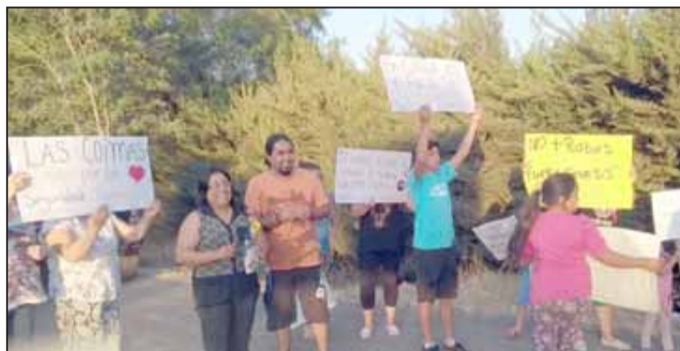
Niños, jóvenes y adultos también se unieron al movimiento vecinal que solicita una intervención en Hogar Génesis.

bobos, nosotros sentimos desconfianza de ese Ho-