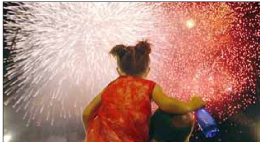
Familias enteras salieron de sus casas para disfrutar con los suyos del gran espectáculo.

gos de pequeña extensión de pastizales rápidamente extinguidos, los lanzamientos de fuegos artificiales finalizaron sin mayores novedades.