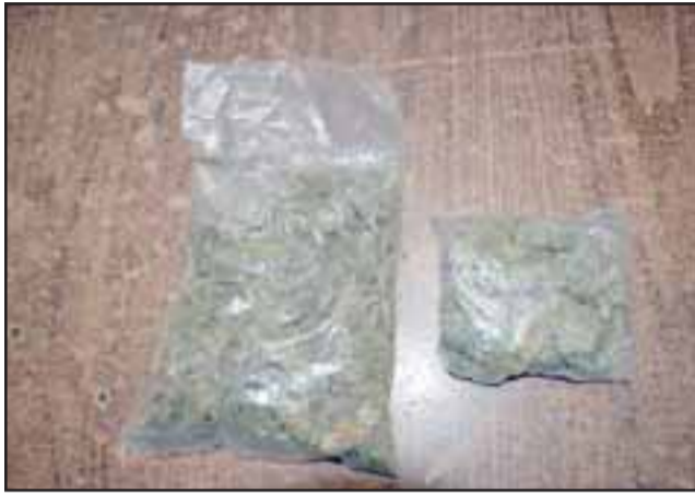
La imputada identificada como P.J.O.C. , de 44 años de edad, iba a entregar la droga a su pareja que se encuentra cum-

LOS ANDES.- Dos mujeres fueron detenidas el 31 de diciembre, luego de ser sorprendidas tratando de internar droga al Centro de cumplimiento penitenciario de Los Andes. El primero de estos hechos se registró pasadas las 11 de la mañana del último día de 2017, cuando en la revisión de las personas que ingresar a revisar internos condenados una funcionaria de Gendarmería descubrió que una mujer ocultaba entre sus glúteos un bolsa de nylon conteniendo 88,5 gramos de cannabis sativa y 69,75 gramos de pasta base dosificadas en papelin-