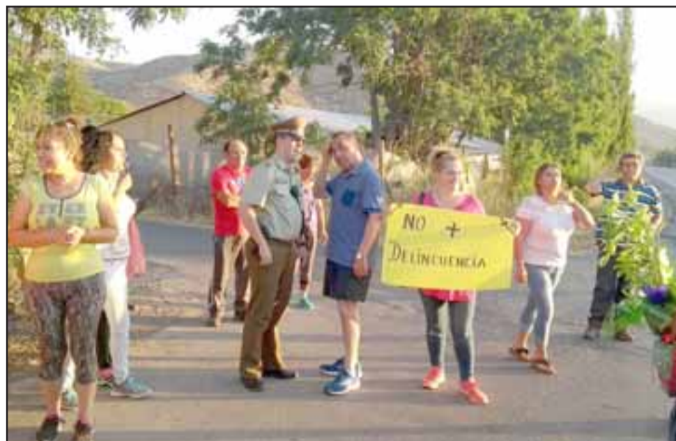
PACÍFICAMENTE.- Carabineros brindó seguridad a los vecinos durante el acto de protesta, el que se desarrolló sin violencia.