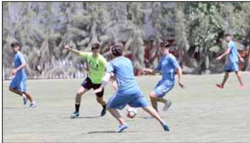
Esta mañana y con escasas novedades en cuanto a nuevos nombres el Uní Uní iniciará el trabajo de Pretemporada.

radas a cargo de la parte física de los sanfelipeños, que para este torneo se han puesto como meta ineludible dar la lucha por el ascenso a la serie premium del fútbol rentado chileno; tarea no menor ya que deberá luchar contra cuadros muy bien potenciados como por ejemplo serán Santiago Wanderers, Ñublense, Rangers, Coquimbo, Cobreloa o San Marcos de Arica.