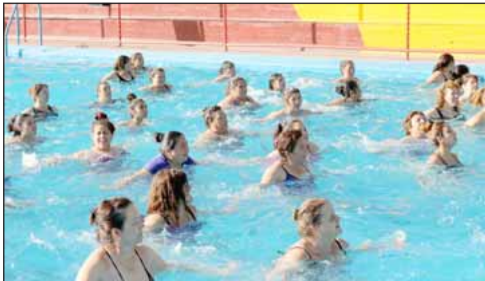
Uno de los talleres más refrescantes, el de aquaerobic adultos, cuenta con alrededor de 80 participantes.

dos en participar en este taller, asistir a los otros talleres como el tenis, escalada y fútbol que se están desarrollando de manera gratuita: «Yo creo que esto ya está copado, el mensaje es que esperen hasta los primeros días de febrero para el polideportivo y que participen en las otras actividades, pero aquí (polideportivo del Estadio Fiscal) ha sido tremenda la convocatoria, así que los invitamos a que se acerquen al Club de tenis Valle del Aconcagua, a que