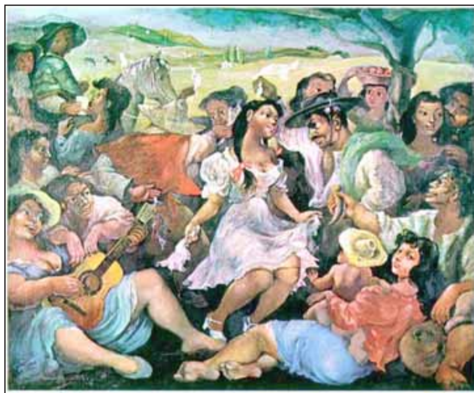
Una de las tantas obras del pintor Pedro Lobos, 'Fiesta Campesina'.

Cabe destacar que la mayoría de las obras de Lobos se encuentran en colecciones públicas y privadas de Chile, Argentina, Ecuador, Uruguay y Vene-