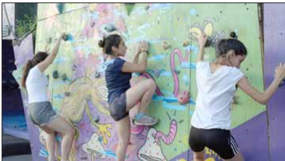
El taller de escalada es otra de las actividades en que los interesados aún pueden inscribirse.

que los chicos que ya están participando hoy día tengan una actividad acorde a la cantidad de profesores y al espacio que tenemos», concluyó Peña.