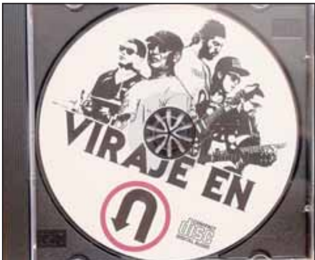
YA A LA VENTA.- Esta es la carátula del primer disco de la banda musical aconcaquina Viraje en U.