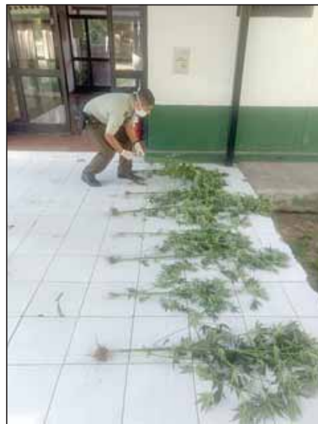
Carabineros de la Tenencia de Santa María incautó un total de ocho plantas de cannabis sativa en medio de una denuncia de violencia intrafamiliar ocurrida en esta localidad.