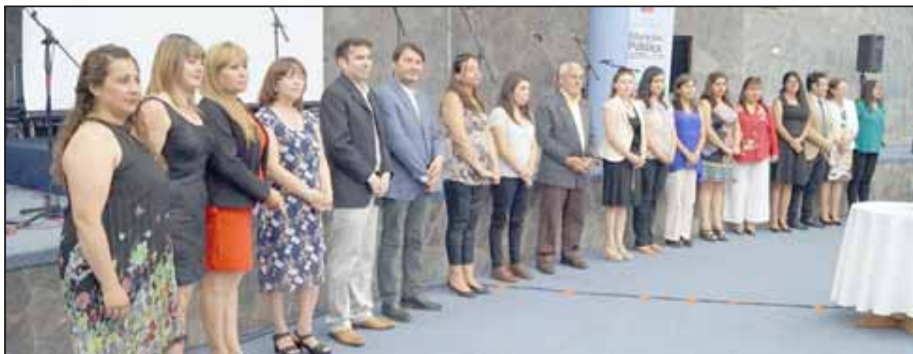
Un total de 19 profesores de distintos establecimientos municipalizados de San Felipe, fueron distinguidos en una ceremonia realizada por la Seremi de Educación.

«Tenemos representación de la mayoría de las escuelas y es una muestra de la gran familia que conforman la educación municipal de Aconcagua, donde destacamos a los mejores de los nuestros, que han sabido representar dignamente todos los valores de la educación pública chilena», señaló.