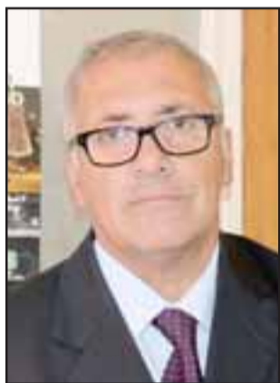
Alcalde Guillermo Reyes Cortez.

Nacido en Putaendo el año 1919, es considerado uno de los más importantes exponentes del muralismo y del grabado en la historia de la pintura chilena del siglo XX.