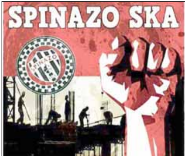
UNA ESCUELA MUSICAL. - Este es su CD homónimo que Spinazo Ska, ya ha colocado en las mejores radios de Aconcagua.

Trasnoche Ska, que se transmite en esa trinchera radial.