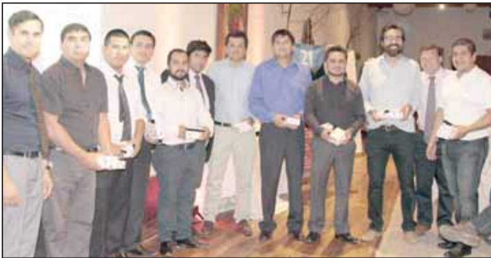
En la imagen, representantes de los cinco proyectos finalistas de Innova 2017 de la División Andina.

detención de la Planta, pero el sistema ya lleva un año con buenos resultados y eso nos gratifica».