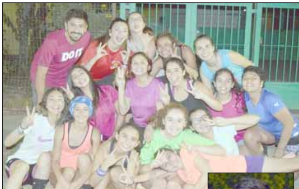
GUERRERAS DEL BÁSQUET.- Ellas son parte de las chicas del San Felipe Basker femenino de nuestra comuna, y ahora necesitan nuestro apoyo.

Es importante destacar que varios comerciantes como Panadería Victoria, Desarrollo