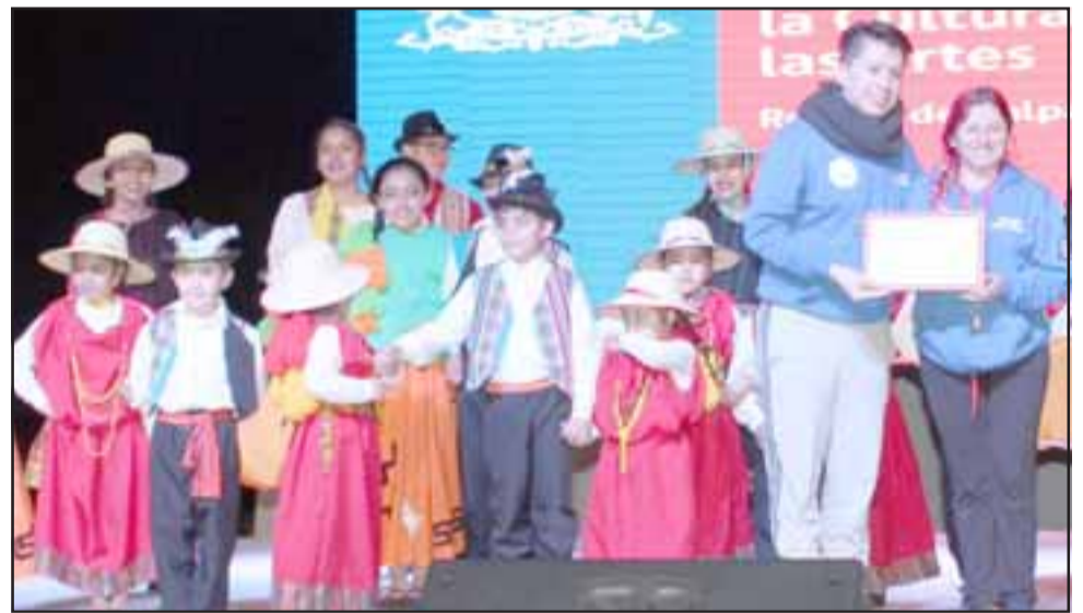
CALIDEZ Y CARIÑO. - En cada actividad hay premios y mucho cariño para los participantes, llegan folcloristas de toda la V Región.