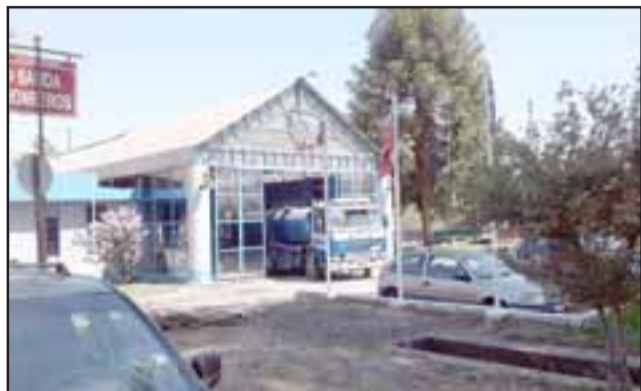
El frontis del cuartel de la Segunda Compañía de Bomberos La Internacional ubicada entre Tacna Sur y Norte.