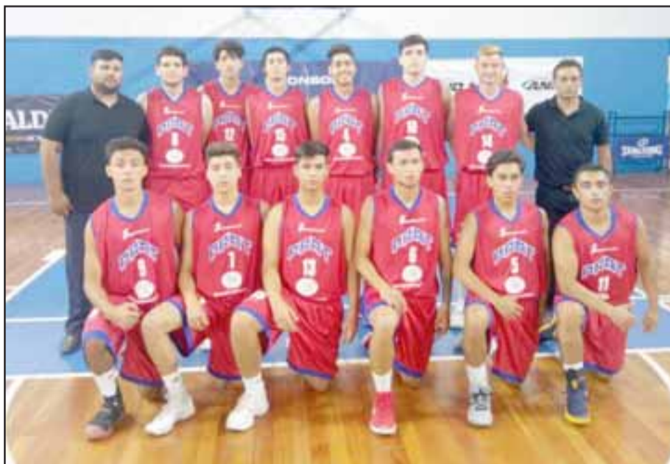
El Prat está obligado a vencer a Estudiantes San Pedro para aspirar a la siguiente fase del Campioni del Domani.

El 71 a 69 (13-17; 25-21; 17-19; 14-14) en contra del martes pasado ante Imba Santiago, condicionó seriamente las posibilidades del Prat para poder sortear con éxito la etapa de grupos del Campioni del Domani, porque hoy los pratinos están obligados a vencer a Estudiantes de San Pedro, si quieren seguir ‘vivos’ en el torneo.