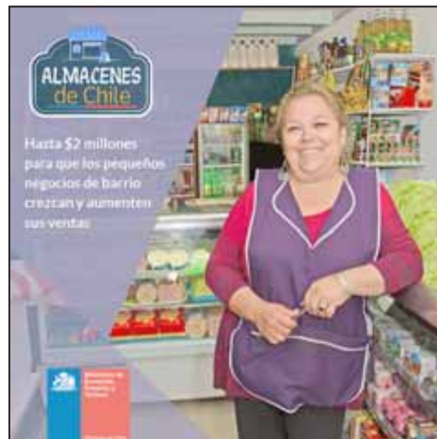
El programa está dirigido a los dueños de almacenes de barrio, quienes pueden recibir un aporte de hasta dos millones de pesos.

«Seguimos con la agenda económica apoyando a todos, la economía no la hacen solo las grandes empresas, eso el Gobierno de la Presidenta Bachelet lo tiene claro, así que invitamos a las pymes, a las empresas familiares a los emprendedores a postular a este Almacenes para Chile, ya el fondo de apoyo a ferias libres ha sido un éxito en nuestra zona, esperamos también que este fondo a los almaceneros también los sea. Información en Ser-