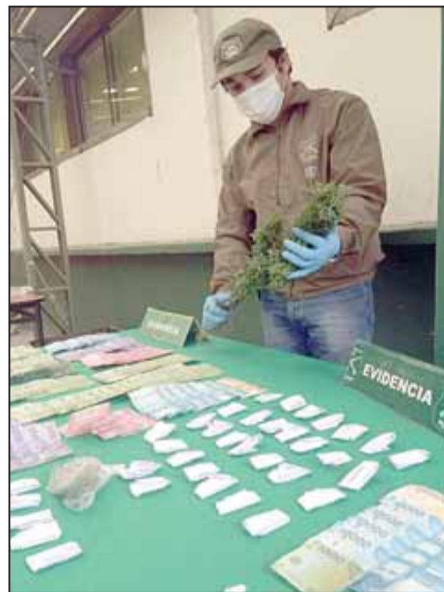
Tras un operativo antidrogas efectuado por el Os7 de Carabineros se incautaron 500 dosis de drogas y dinero en efectivo en inmuebles de la Villa Los Aromos de Santa María.

Sometidos a programas de reinserción social: