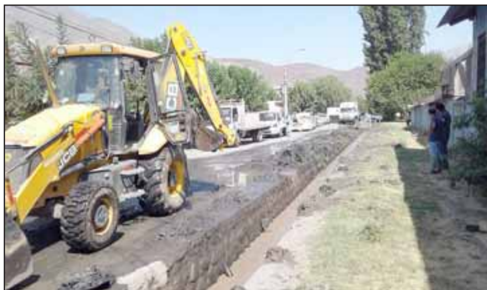
Personal de la Municipalidad de San Felipe con una retroexcavadora tuvo que limpiar el canal.

El oficial lamentó los daños sufridos porque no están dentro del presupuesto, "pero hay que seguir y poder habilitar lo antes posible esta compañía de bomberos, en estos momentos las dependencias van a ser desinfectadas porque ingresó agua por las cámaras lo que trajo consigo que salieran aguas servidas, afortunadamente ya comenzaron las labores de limpieza con