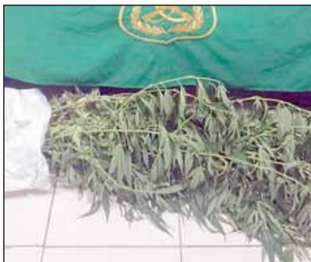
Los detenidos en aquella oportunidad mantenían plantas de cannabis sativa y marihuana a granel al interior de un vehículo en la comuna de Putaendo. (Foto Referencial).

Los hechos de la acusación de la Fiscalía determinaron que el día 7 de marzo del año pasado, alrededor de las 12:50 horas, Carabineros de Putaendo efectuaba patrullajes preventivos en la ruta E-524, observando un vehículo que estaba en panne, comprobando que en el interior sus ocupantes mantenían plantas de cannabis sativa y marihuana a granel siendo detenidos por este delito.