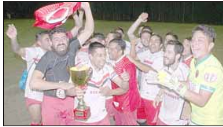
SAN ROQUE CAMPEÓN. - Ellos son los actuales monarcas de la Serie de Honor 2017. La acción será entonces este viernes en La Troya.

Tal como lo habíamos anunciado en Diario El Trabajo , este viernes arrancará para el deleite de los miles de hinchas del fútbol amateur, la 4ª Semana Troyana 2018, jornada deportiva que convoca desde hace cuatro años a los más calificados clubes de fútbol de la V Región en La Troya.