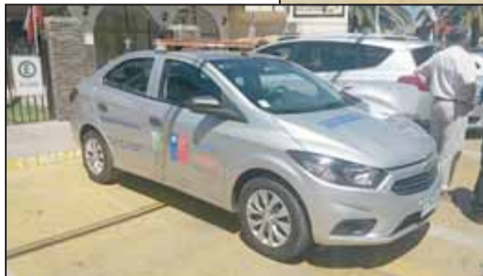
Dos automóviles que realizarán patrullaje preventivo, como también la implementación de una central de monitoreo de cámaras integradas, adquirió el municipio de Santa María a través del Fondo Nacional de Seguridad Pública.

con estos dos vehículos potenciamos nuestra red de seguridad, así es que esperamos que con la puesta en marcha de la sala de monitoreo de todas nuestras cámaras en línea, desarrollar una mejor gestión en materia de seguridad pública».