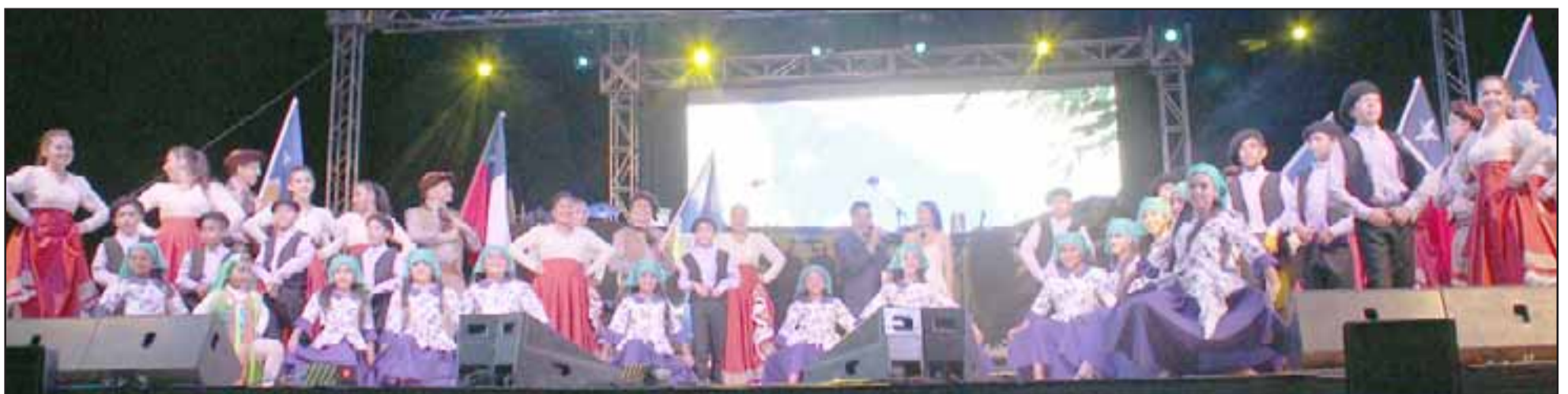
GRANDE PANGUE. - Ellos son los niños y chicos del Ballet Folclórico Pangué, de Panquehue, durante el pasado Encuentro Regional del Folklore.