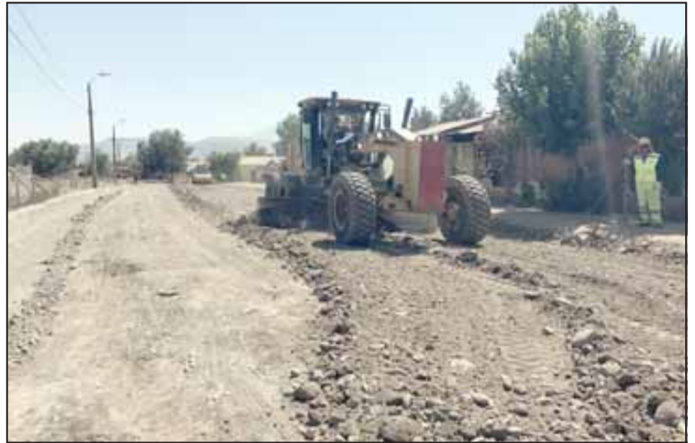
La carpeta asfáltica de 7 centímetros permitirá el tráfico de vehículos livianos, poniendo fin a más de 20 años de polvo, barro y cráteres que hacían intransitable el tramo de 151 metros que conecta Diego de Almagro Tacna Norte.