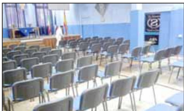
Personal de una empresa privada procede a limpiar y desinfectar una de las dependencias inundadas.

El desborde del canal ubicado en calle Tacna Sur provocó que ayer en la mañana se inundaran algunas dependencias del Cuartel del Bomberos de la Segunda Compañía 'La Internacional', ubicada en el lugar.