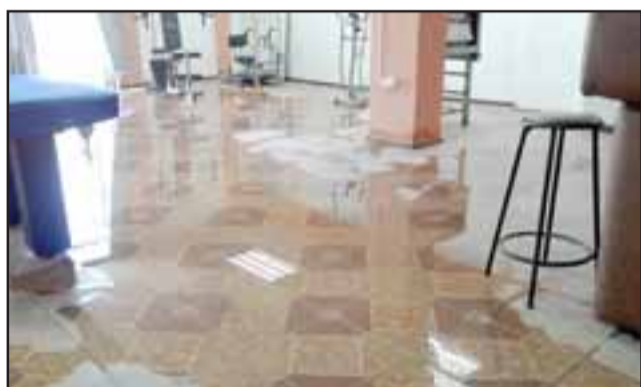
Acá se puede apreciar el agua que inundó algunas dependencias.