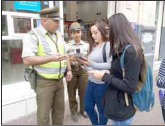
Personal de la Oficina de Postulaciones Aconcagua está realizando una campaña de difusión en los principales espacios públicos para dar a conocer los requisitos que se exigen al postulante.

Aquellos jóvenes que resulten seleccionados comenzarán su proceso académico en junio.