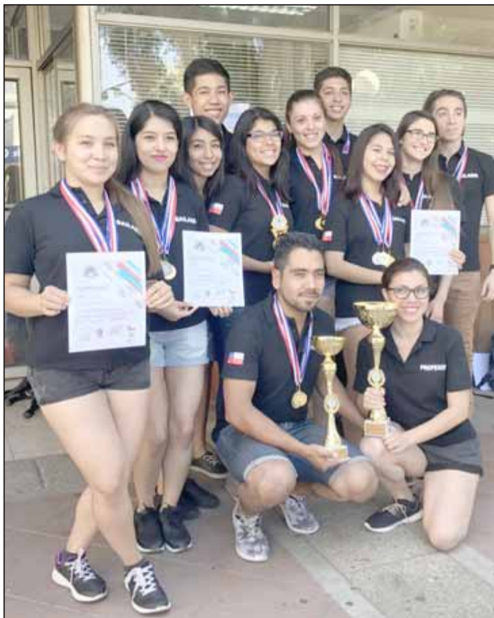
El taller municipal 'Ori Newen' es una compañía de danza que está integrada por niños y jóvenes de San Felipe y alrededores.

Cabe destacar que 'Ori Newen' se presentará en el Festival Palmenia Pizarro junto al Ballet Municipal, además la agrupación comenzará en marzo las audiciones para recibir a nuevos integrantes, las que se realizarán en el departamento de Cultura.