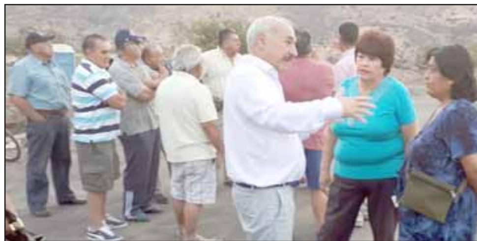
PIDEN MITIGACIONES. - Los vecinos de estas poblaciones se mostraron muy molestos durante la reunión que sostuvieron con el alcalde y algunos concejales de nuestra comuna.