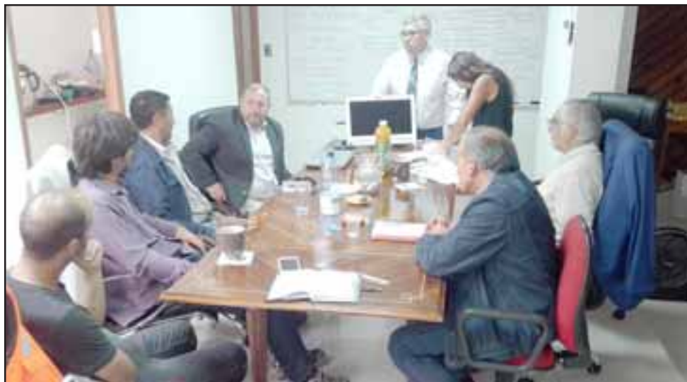
En la reunión participaron representantes de la Universidad de Viña del Mar, Fundación Mi Patrimonio y comuneros de El Asiento.

El lugar donde se pretende construir este parque abarca una longitud de 3,5 kilómetros y de ancho unos 2 kilómetros.