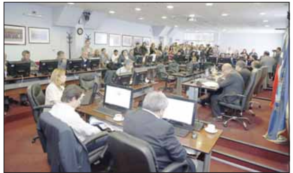
A través de la Comisión de Inversiones se priorizó una cartera de 23 proyectos postulados al Fondo Nacional de Desarrollo Regional (FNDR).

Asimismo, se aprobaron iniciativas de Conservación, por $1.471.585.000; el Estudio de Prioridad Regional denominado 'Plan de Mejoras en Atención de Público en el Complejo Fronterizo Cristo Redentor – Sector Chileno', por un monto de $30.000.000; y el Estudio de Prioridad Regional deno-