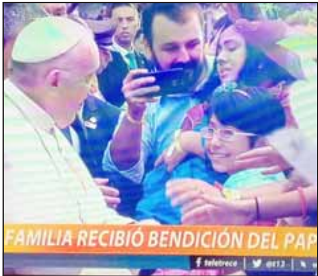
RECIBIERON SU MILAGRO DE FE.- Nunca más esta familia olvidará el momento en que la máxima autoridad de la Iglesia Católica entró personalmente en sus vidas.