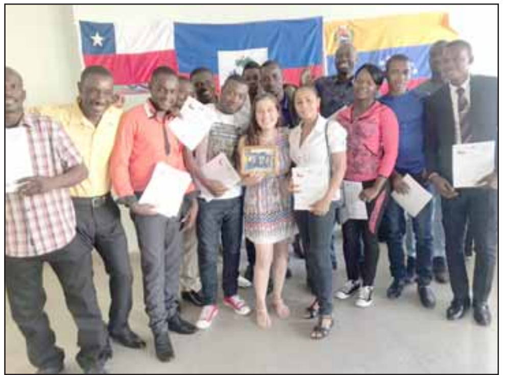
Los ciudadanos haitianos lucen felices tras obtener su graduación de los cursos de español.

clases de español entre la comunidad haitiana, que ya está confirmada la habilitación de dos módulos más a partir de marzo, luego que los voluntarios puedan tener un tiempo de descanso tras la finalización de los dos cursos que congregaron más extranjeros de los que pensaban.