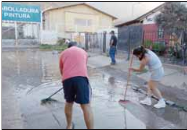
ESPERAN SOLUCIÓN.- El Municipio asegura que ya están diseñando una solución a este problema.

PROBLEMA LÍQUIDO.- Así de complicado es el problema, regularmente los vecinos de Villa Las Camelias tienen que limpiar entre todos los pasajes inundados de agua.