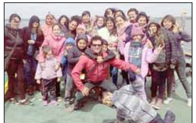
MUCHO CIRCO. - Este año los isleños tuvieron una grata visita: El Taller de Circo-Teatro y Diablada sobre Zancos, así como de la Estudiantina Escolar, de esta escuela sanfelipeña.