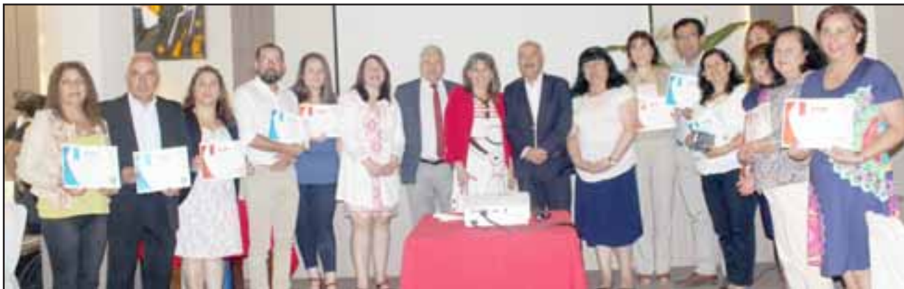
Profesores reconocidos por la ATE junto al alcalde, concejal Boffa y Director de la Daem.JPG

“Las escuelas hicieron un gran esfuerzo implementando cambios en sus actividades, con nuevas estrategias en el plan lector y matemático. Esto es el resultado del trabajo de los profesores, esto no es única responsabilidad nuestra. Acá vemos una gran movilidad en los aprendizajes.