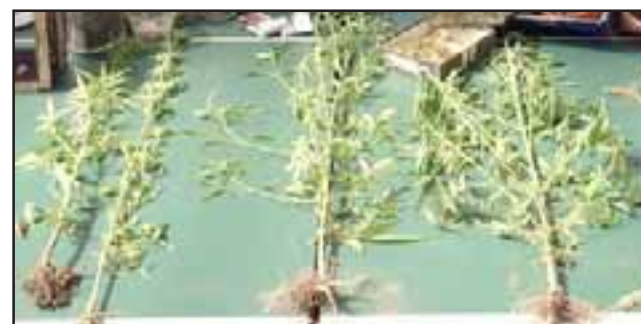
Las plantas de cannabis sativa fueron incautadas por personal de Carabineros en la localidad de Llay Llay en abril de 2015. (Foto Referencial).