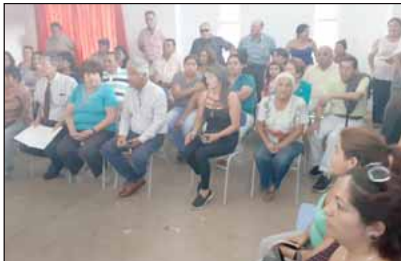
ESPERAN SOLUCIONES. - Muy ansiosos estaban la noche del lunes los vecinos de poblaciones como La Nacional, Sol del Inca, Yevide y Las Camelias.