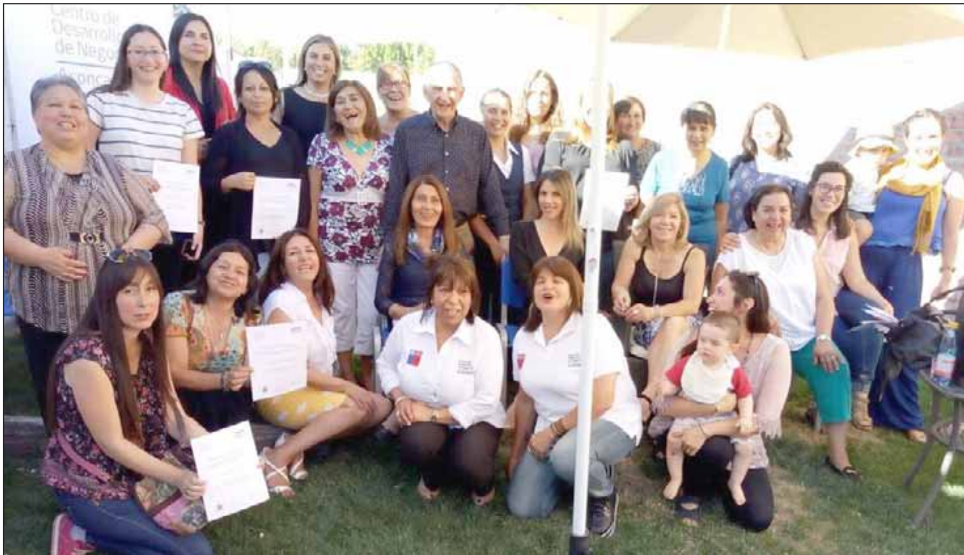
SIEMPRE MUJER.- Ellas son parte de las mujeres que asisten a la Escuela de Emprendimiento Femenino, y que tienen una historia de más de 100 años en la Fundación del Buen Pastor de San Felipe.