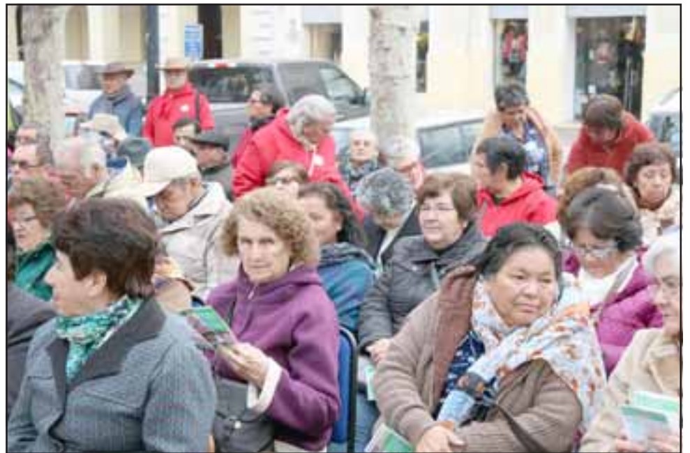
Los adultos mayores que serán censados, son personas inscritas en el Cesfam o en los clubes de adultos mayores y juntas de vecinos.

Los adultos mayores censados, son personas inscritas en el Cesfam, inscritos en los clubes de adultos mayores y juntas de vecinos, que entregaron un listado con aquellas personas ma-