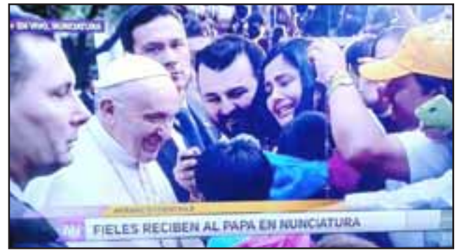
NOTICIA MUNDIAL.- Los noticiarios de todo el mundo transmitieron en vivo el encuentro del Papa con este sanfelipeño y su familia.

- Él mientras yo le conté la historia de mi hijo, lo abrazó, le dio un beso, luego abrazó a mi hija y después nos dio una bendición como familia. Esa mirada paternal, esa mirada carac-