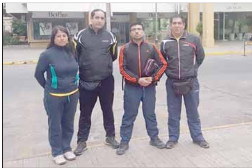
Este fue parte del grupo de tenimesistas que no pudo viajar a Cartagena debido a la falta de transporte.

- Mire, lamentablemente la gestión la debió realizar uno de nuestros jugadores que comunicó la situación que estábamos viviendo a un jugador de Quillota, y fue ese jugador el que le dio el número de teléfono de la productora; a mí