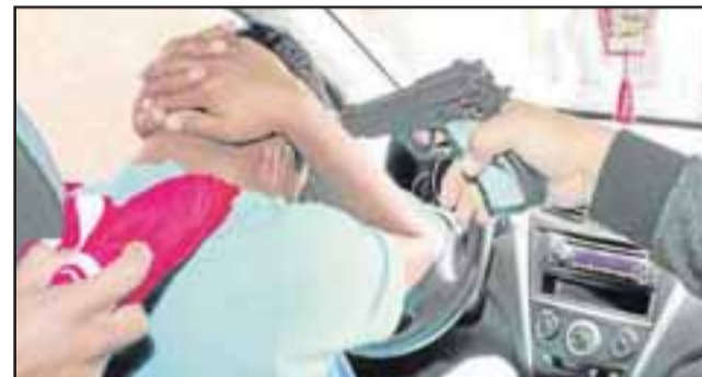
El violento asalto ocurrió la mañana de ayer jueves y fue ejecutado por cinco delincuentes armados, quienes se apoderaron del vehículo en que se movilizaban las víctimas y la suma de $5 millones. (Foto Referencial).