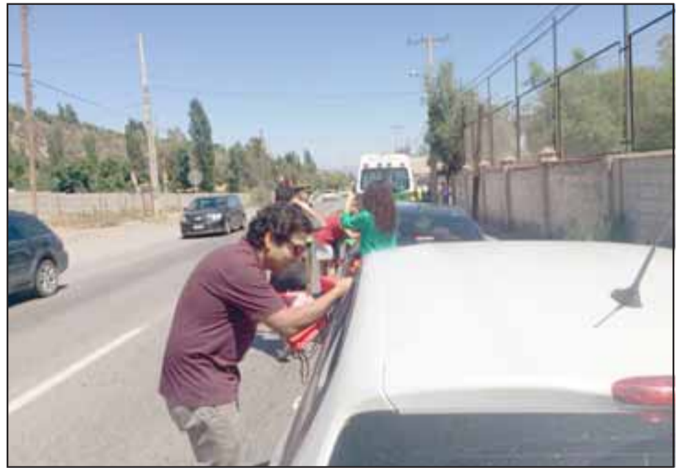
La campaña busca promover estilos de vida saludable, informando la normativa vigente respecto al consumo de alcohol en la vía pública y el uso de drogas a los turistas argentinos.

Cabe mencionar que la campaña sostiene que todo consumo de drogas y alcohol puede ser riesgoso. El foco de atención de Senda, desde una mirada de salud