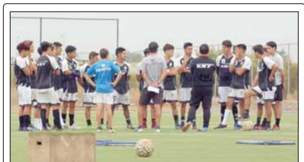
Esta semana comenzaron a laburar las series inferiores de Unión San Felipe.