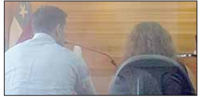
El Constructor Civil de 38 años no tenía antecedentes penales por lo que el procedimiento fue suspendido condicionalmente.

Como no tenía antecedentes penales accedió a una suspensión condicional del procedimiento por el plazo de un año con la condición de fijar domicilio e informar cualquier cambio del mismo.