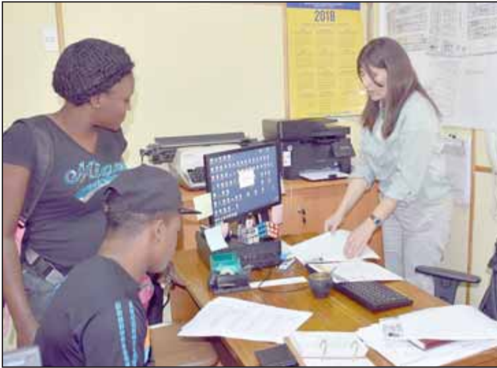
Los funcionarios municipales demostraron un alto compromiso con la comunidad, al atender público hasta la 21 horas de este miércoles.

nocturna, el municipio de Llay Llay continuará con este servicio en los meses siguientes, los cuales se realizarán los primeros miércoles de cada mes hasta el mes de diciembre del presente año.