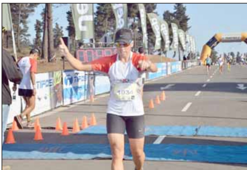
La atleta oriunda de Santa María competirá en una prueba de travesía que se extenderá por tres días.