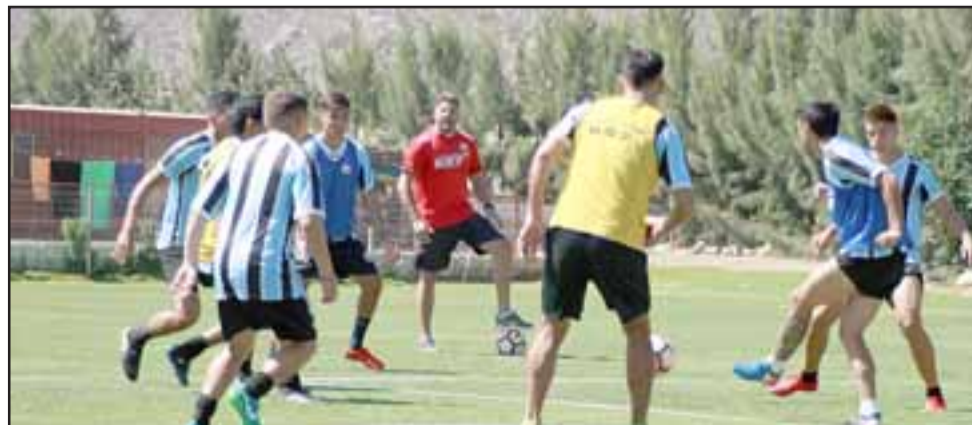
Unión San Felipe ya conoce el fixture del torneo 2018 de la Primera B.