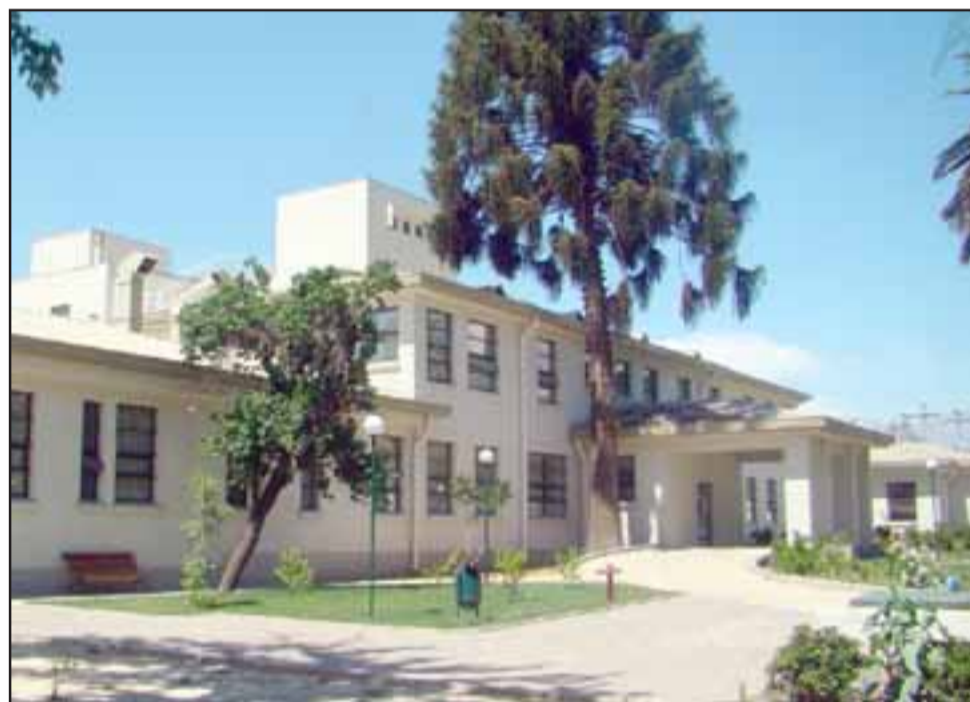
El Hospital San Juan de Dios de Los Andes se convirtió en el primer establecimiento en dar cumplimiento a la ley que despenaliza el aborto en tres causales.

que tiene la madre y la familia en general que son propios de esta situación y que deben ser acompañados por profesionales, porque así lo dice la ley y es también un tema médico y sanitario” .