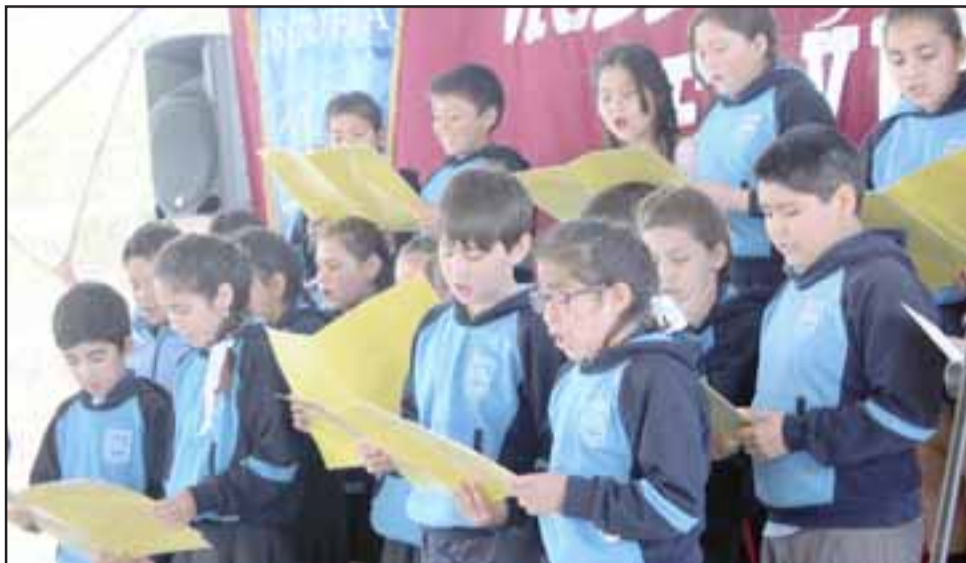
Uno de los énfasis del trabajo para 2018, será el artístico, donde a través de instancias corales, por ejemplo, los profesores han potenciado el talento de los alumnos y alumnas.

«Seguiremos en la Liga, donde con mucho entusiasmo los niños dieron