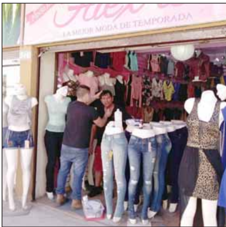
La tienda de ropa juvenil Alex'is, ubicada en Traslaviña a un costado del ex cine Aconcagua, fue el escenario del violento robo.

- La verdad muy decepcionado porque pues siendo jóvenes no puedan optar a un trabajo y se dedican a la cosa fácil y roban.