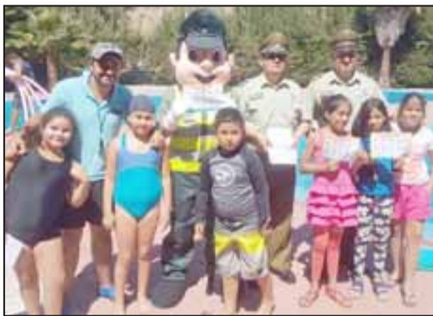
Funcionarios de Carabineros se trasladaron hasta las dependencias de la Piscina Municipal la mañana de ayer.

La iniciativa recalca el cuidado que deben tener los adultos con los niños en playas y piscinas para prevenir