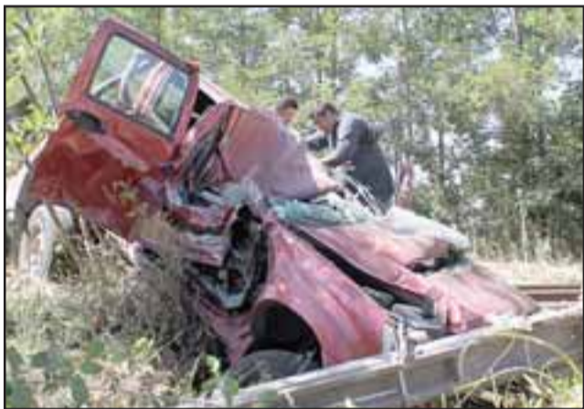
Aunque resulte un enigma, con lesiones menores pero increíblemente con vida resultó el conductor de la camioneta que resultó totalmente destruida tras ser impactada por el tren metalero.