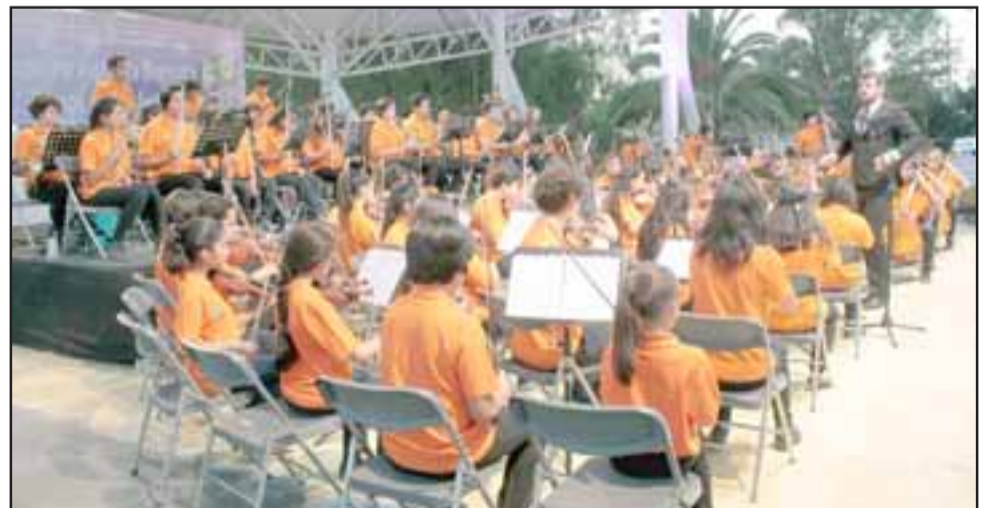
En Los Andes finalizó el ciclo de presentaciones de verano del Fosila, con el debut de una nueva generación de talentos del Valle de Aconcagua.

Con esta actividad, la Orquesta Sinfónica Infantil culminó sus presentaciones de verano que se realizaron también en las comunas de San Felipe y Calle Larga. Así también, un show musical liderado por su proyecto hermano, Fositol, en la localidad de Huertos Familiares.