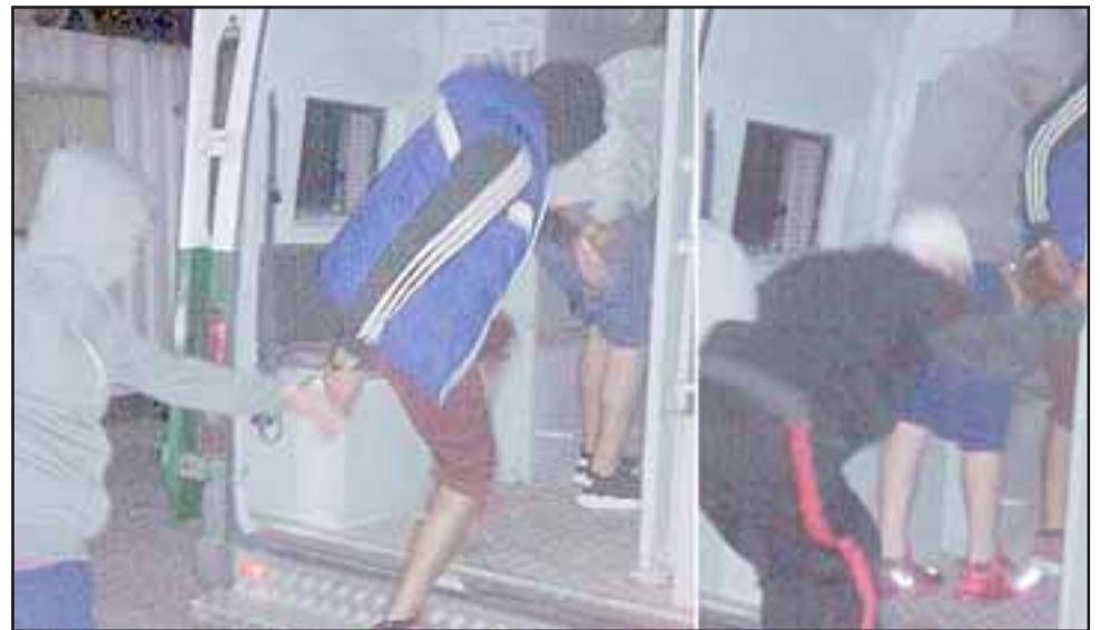
Carabineros detuvo a los cinco antisociales tras una persecución que culminó en el peaje Las Vegas de Llay Llay, incautando más de dos kilos de marihuana.

Las diligencias policiales establecieron que los ocupantes mantenían al interior del vehículo marca Mazda de color rojo, la cantidad de dos kilos de mari-