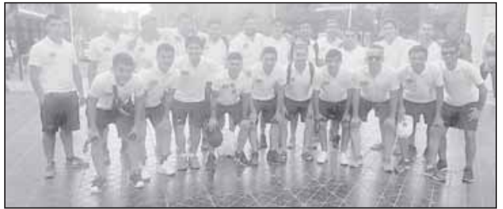
Pese a mostrar un espíritu de lucha a prueba de todo, Almendral Alto cayó en su estreno en el Nacional de clubes de Antofagasta.

A los 20 minutos del primer tiempo Almendral Alto caía 4 a 0, y aunque ese marcador ya era abultado, muchos temían una catástrofe mayor; cosa que no sucedió porque si hay algo que tiene el campeón regio-