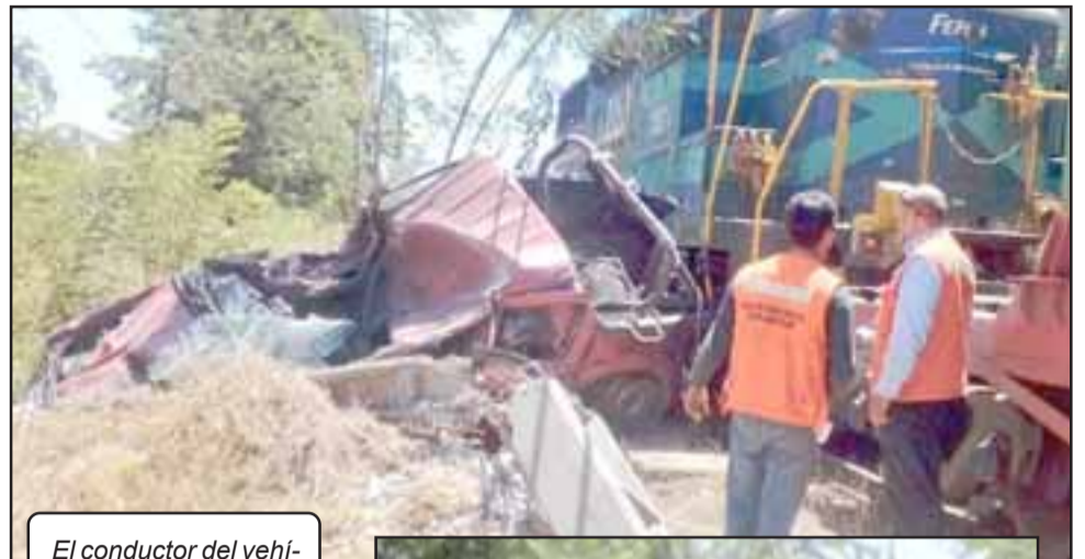
El conductor del vehículo no se percató de la presencia del convoy minero al cruzar la vía en el sector del callejón La Tordilla.