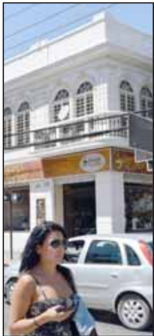
APENAS EMPIEZA.- Esta ordenanza, si se trabaja bien en ella, podría estar lista durante este año.

Por una nueva ordenanza municipal dirigida a poner en cintura a los propietarios de edificaciones nue-