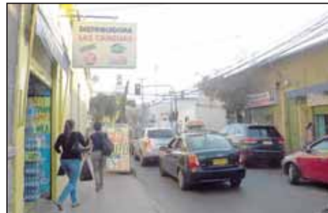
Malestar ha generado el “cobro excesivo” de impuesto por letreros luminosos en el comercio.

Añadió que de los años que lleva con su local jamás le habían cobrado este impuesto, “ y como comerciante puedo indicar que este cobro no es bueno, podría ser un cobro más moderado y no en el exceso en que lo están aplicando, yo pago de patente $ 42.000 y por el impuesto de la