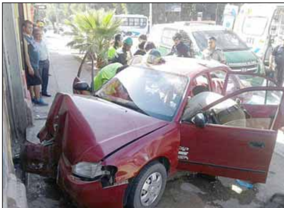
El accidente ocurrió la mañana de ayer miércoles en calle Tacna Sur en San Felipe.

Carabineros informó que dentro del automóvil no se encontraban otros ocupantes, mientras el paciente fue derivado por la am-