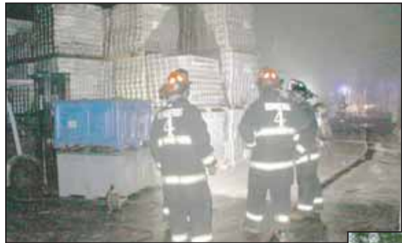
MÁS SEGURIDAD.- Bomberos tendría ahora más trabajo que hacer, pero habría más seguridad en empresas y edificios públicos.