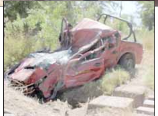
Desde cualquier ángulo, por dónde se mire, el estado de la camioneta hace difícil entender que no hubo víctima fatal.

adoptó el procedimiento correspondiente, aun cuando claramente la responsabilidad recae en el conductor del vehículo menor al no haberse detenido en el cruce.