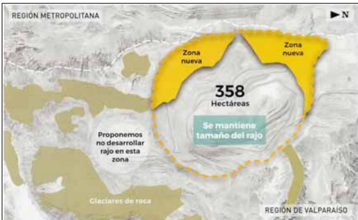
MINERÍA SEGURA.- Estas son las nuevas zonas que Andina pretende habilitar, para no hacer minería cerca de los glaciares de roca existentes en zona autorizada.

La compensación considera el resguardo del área, mediante la exclusión de actividades con el fin de proteger y conservar elementos singulares asociados a los ecosistemas terrestres. Las principales acciones a implementar en el área de compensación corresponden a la elaboración de un Plan de Manejo, la realización de un estudio de línea base, la implementación de una estación meteorológica y una estación de material