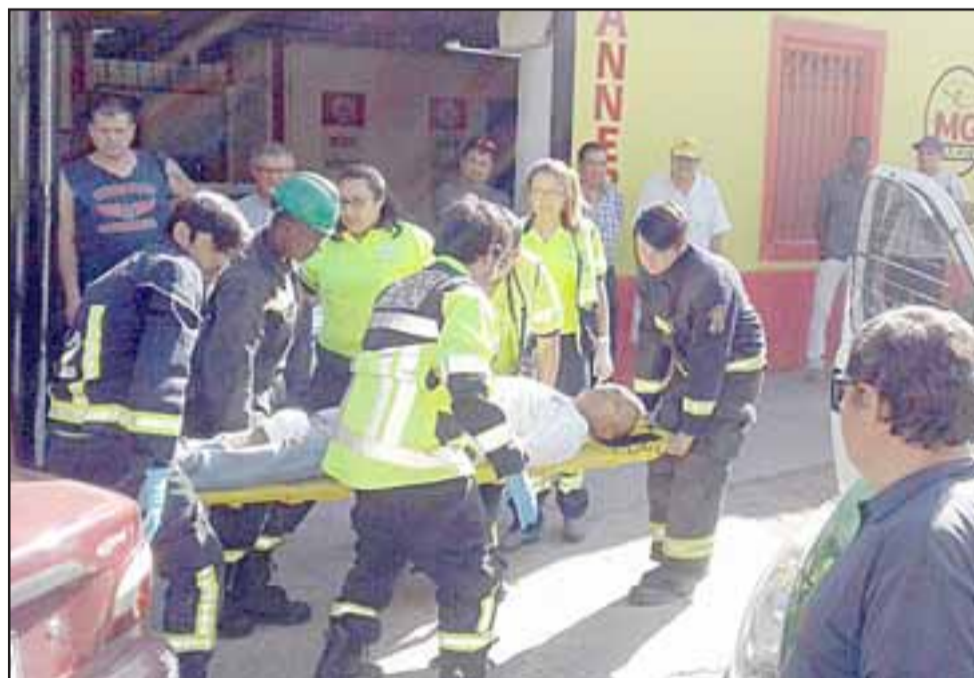
El automovilista de 50 años de edad resultó con una fractura en una de sus rodillas, siendo asistido por personal del Samu.