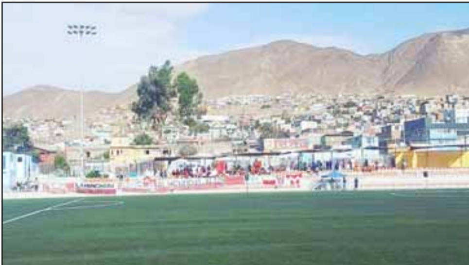
El conjunto sanfelipeño llegó hasta la segunda región acompañado de su fiel barra.