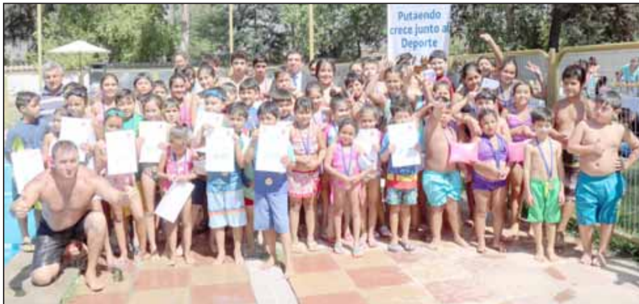
En total son alrededor de 80 menores los que participan de los talleres de natación.

tigar el bajo nivel de actividad física en las niñas y niños.