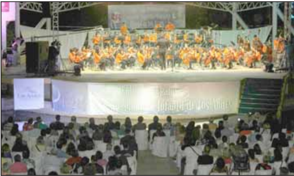
Junto a los vecinos de la ciudad, la Orquesta Sinfónica Infantil dio vida a una presentación de piezas clásicas y otras de la cultura popular que emocionaron al público.

Junto a los jóvenes, también se presentaron los ex estudiantes de Fosila, algunos de los cuales han podido continuar sus estudios de arte y música en el extran-