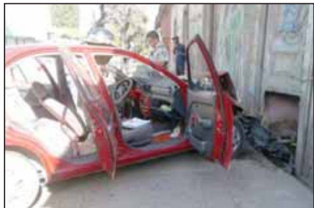
El conductor del móvil impactó contra una propiedad abandonada.

bulancia del Samu hasta la Unidad de Traumatología del Hospital San Juan de Dios de Los Andes, luego