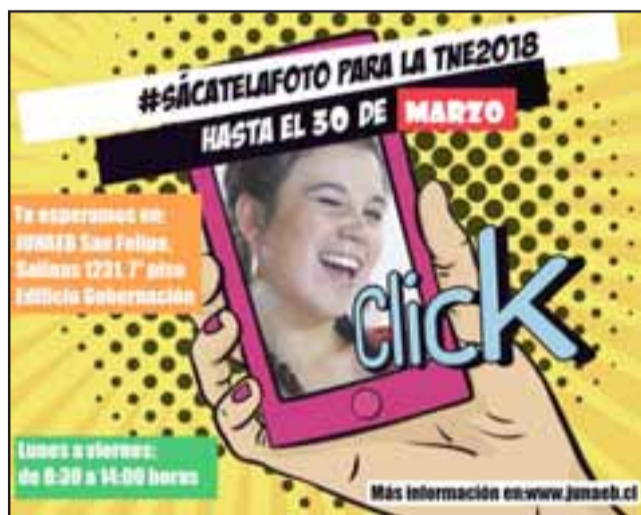
El afiche de la campaña para que los jóvenes participen de este importante beneficio que significa contar con la TNE.

gratuitamente o con tarifa rebajada, los 365 días del año.