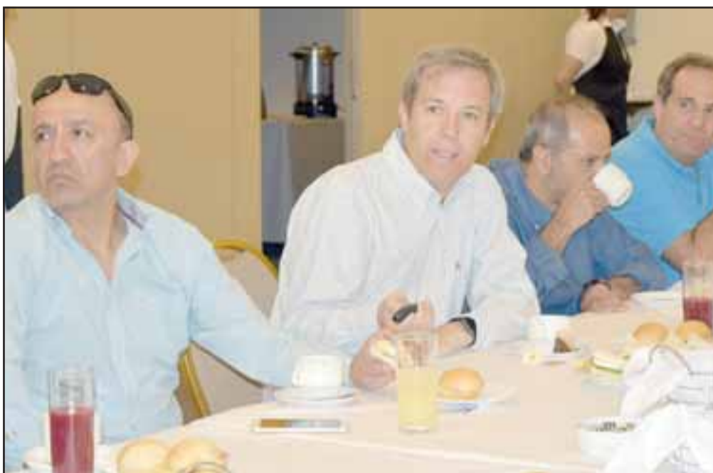
PRENSA REGIONAL.- Decenas de periodistas del Valle de Aconcagua hicieron sus preguntas y cuestionamientos al directivo de Andina.