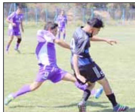
Este domingo comienzan los torneos de fútbol aficionado Selim Amar Pozo y Amor a la Camiseta.

gual - Lo Vicuña; Alborada - Lautaro Atlético