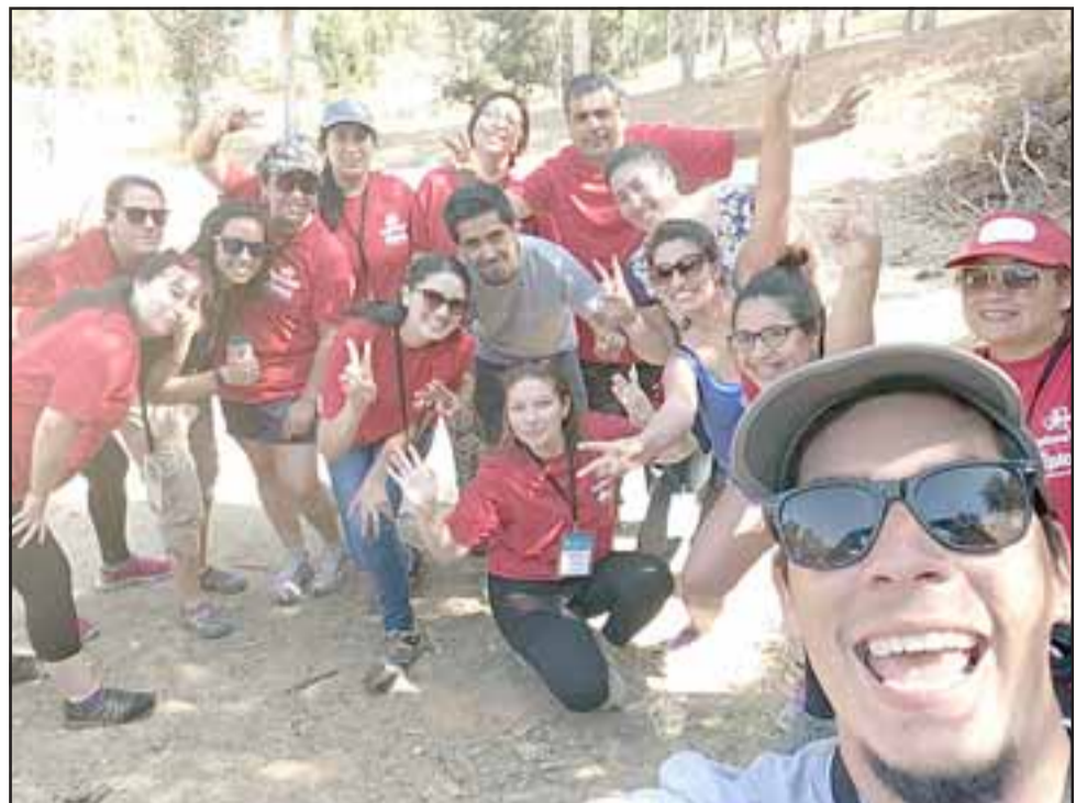
TREMENDA EXPERIENCIA. - Aquí vemos a la profesora de la Escuela José Manso de Velasco, disfrutando con sus colegas del Campamento de Educación en Ciencias Explora Va 2018, en Quilpué.