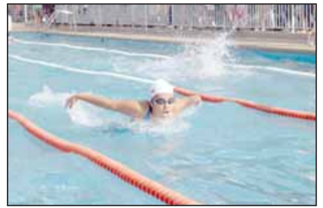
En la mañana participarán los niños y jóvenes provenientes de distintas ciudades del país.

Finalmente el coordinador se refirió a las actividades deportivas que se llevarán a cabo durante el mes de febrero. El sábado 10, entre las 10 y las 21 horas se desarrollará un torneo de rugby en el Estadio Municipal de San Felipe denominado