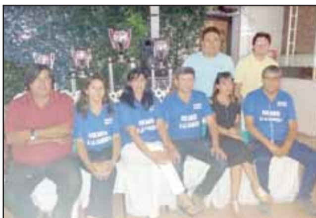
El comité organizador del torneo posó para el lente de El Trabajo Deportivo.

Cuando caía la noche del miércoles recién pasado, en un centro de eventos ubicado en el sector El Almendral de San Felipe, se realizó el sorteo de grupos para la próxima edición del torneo 'Selim Amar Pozo'.