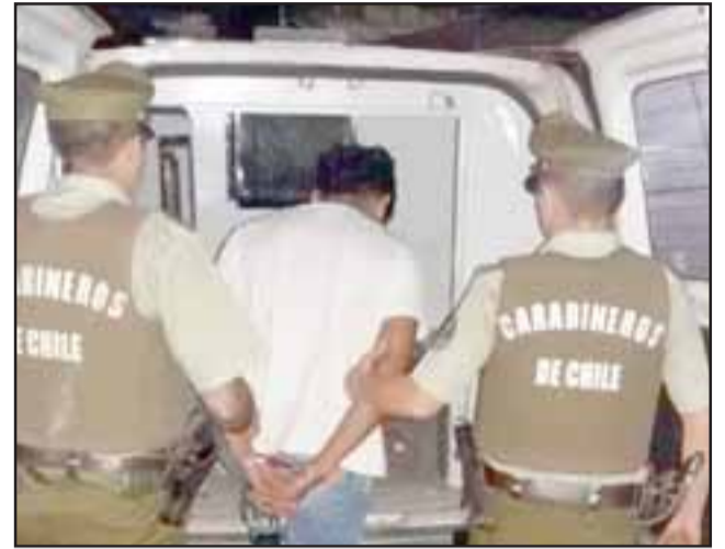
El imputado de 18 años de edad fue formalizado en tribunales, quedando en prisión preventiva por robo con violencia. (Foto Referencial).

El sujeto, luego de apoderarse de la especie, huyó en dirección desconocida, iniciándose un seguimiento por parte de Carabineros motorizados, quienes tras patrullajes por distintas arterias de la ciudad, observaron al antisocial circulando por avenida Diego de Almagro frente al N°1368, quien fue detenido manteniendo en su poder el celular de propiedad de la víctima, re-