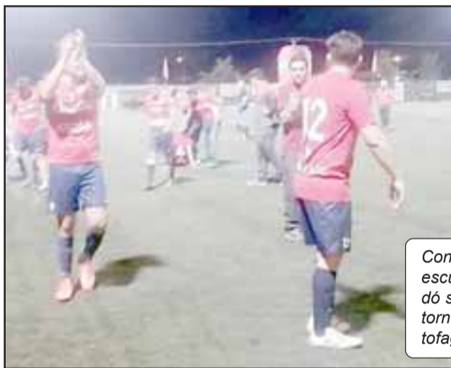
Con su igualdad del miércoles la escuadra de Almendral Alto quedó sin chances de avanzar en el torneo Nacional de clubes de Antofagasta.