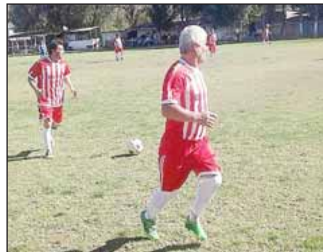
El domingo volverá a rodar el balón en la competencia central de la Liga Vecinal.