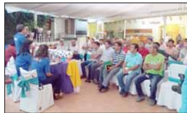
La noche del miércoles se realizó el sorteo para la conformación de grupos del Amor a la Camiseta 2018.

Grupo 3: Mirador de Panquehue, Independiente de Almendral, José Obrero, Juventud Antoniana