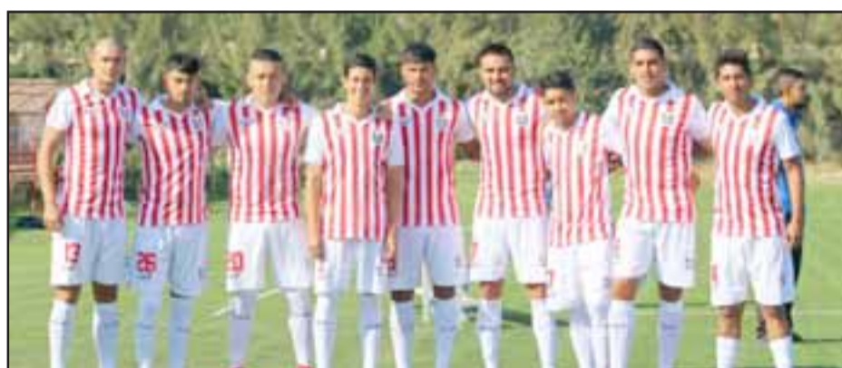
La nueva camiseta del Uní Uní se inspiró en su equipo de los años 60 apodado como 'El Ballet Blanco'.