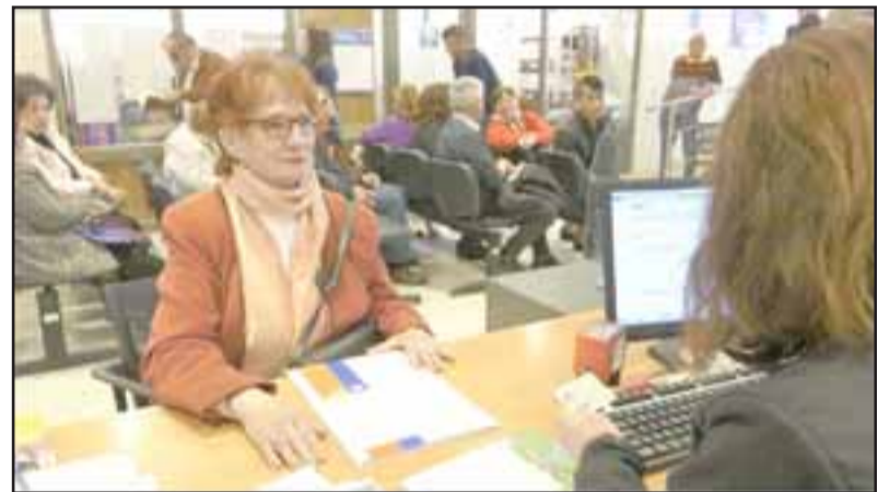
Uno de los requisitos es tener más de 60 años al momento de postular, o cumplirlos durante este año. Además, acreditar un ingreso mínimo de 3,8 U.F.