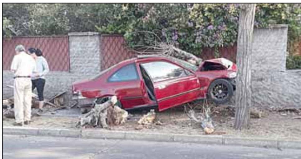
El vehículo chocó contra el muro de una vivienda en Calle Miraflores, mientras que su conductor salvó milagrosamente.