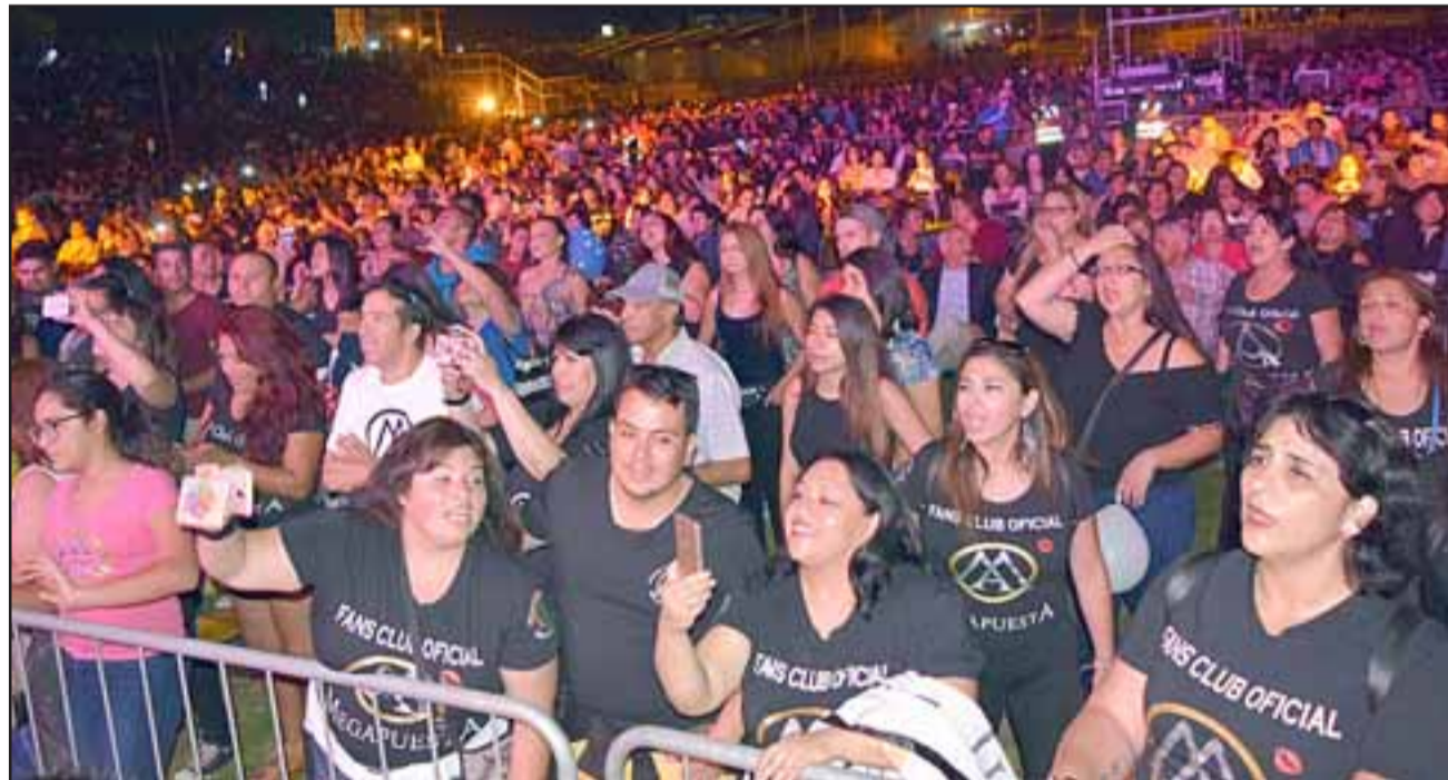
FESTIVAL CON NOTA 7.- Unas 20.000 personas participaron en el cierre del Festival Palmenia Pizarro la noche del sábado, mientras que el viernes hubo cerca de 15.000 sanfelipeños en el Municipal.

do en nuestra comuna, muy feliz también de este año haber podido contar con la compañía de Palmenia Pizarro en persona, es también una dicha ver este estadio a lleno total, más de 20.000 personas según reportó Carabineros, tuvimos Hip Hop, buen humor, Mega Apuesta y este cierre tan emocionante, ver a nuestra querida Laura Gallardo ganar el festival, una muy buena forma de empezar el año, felicitó por lo tanto a todos quienes hicieron posible este festival», dijo el edil.