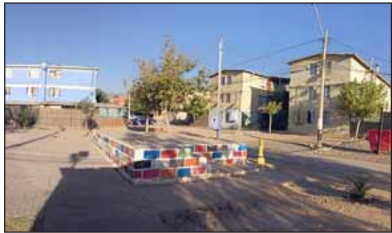
Así lucen algunas viviendas de estos condominios, con nueva pintura y techumbre.

«Para que podamos postular a este programa, el subsidio base es de 80 UF por cada uno de los beneficiarios y el ahorro es de 1 UF», explicó la profesional, agregando que existen dos modalidades de aspirar a estos recursos, «la primera, las personas que residen en el condominio –pueden ser propietarios o arrendatarios mayores de 18 años y el único requisito es que no hayan postulado a uno de estos programas anteriormente, la segunda es cuando los condominios ya se encuentran formalizados, cuentan con un comité de administración y un reglamento de copropiedad inscrito en el Conservador de Bienes Raíces y tienen el Rut del Servicio de Impuestos Internos».