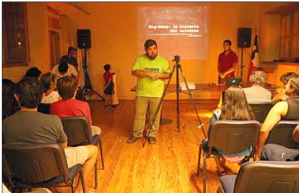
Estas charlas son realizadas por magisters y doctores de la Facultad de Ciencias Físicas y Matemáticas de la Universidad de Chile.