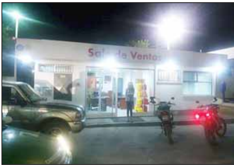
El delincuente ingresó pasada la medianoche de este domingo en la Sala de Ventas del Servicentro Shell, ubicada en Avenida Manso de Velasco en San Felipe.