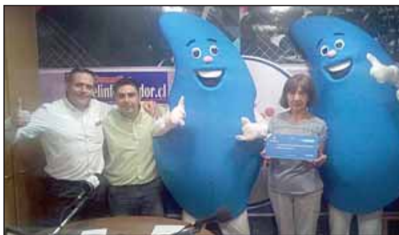
Fondo Concursable de Esvál destinó recursos para la renovación de los equipos de transmisión de la emisora, que lleva más de 18 años al aire.

«El haber participado en esta tercera versión de los fondos de Esvál, fue fundamental, ya que logramos un financiamiento de $1.600.000 para renovar varios de nuestros equipos, principalmente un transmisor, un equipo UPS para seguir funcionando ante cortes de energía, y un nuevo monitor, lo que hoy nos permite estar al aire. Funcionábamos con un transmisor prestado que tenía 18 años, lo que nos traía bastantes problemas, por eso fue una tremenda ayuda haber obtenido estos recur-