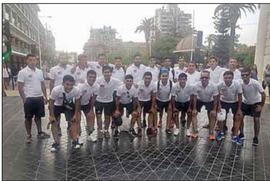
Almendral Alto representó al fútbol aficionado de la Quinta Región en el reciente Nacional de Antofagasta.

En su último partido Almendral Alto, que regresó ayer al valle de Aconcagua, cayó por 3 goles a 2 frente Iquique, con lo que dejó como saldo en la cita máxima de clubes a nivel amateur: un empate y dos derrotas. El Deportivo Población Los Nogales de Estación Central, se convirtió en el nuevo campeón chileno amateur al vencer en la gran final a los dueños de casa de Asotel.