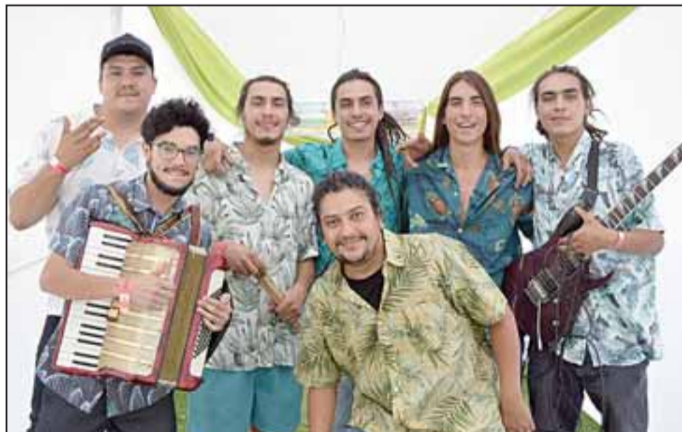
ACONCÁÑAMO.- La gran sorpresa del Palmenia, los chicos de la Banda Aconcáñamo, le dispararon a todo y anunciaron su lucha por el agua para el valle.