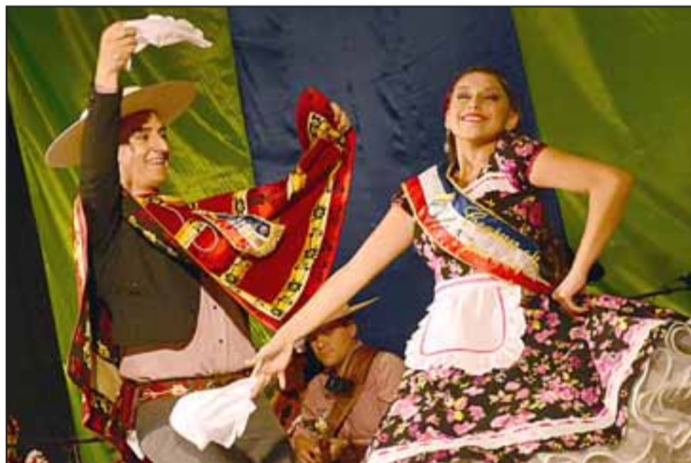
Las chinitas con sus huasos ofrecieron el mejor baile y la mejor sonrisa a los presentes.