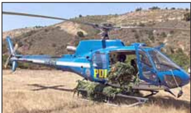
Las plantaciones se encontraban en sectores de difícil acceso, debiendo contar con apoyo aéreo.

De acuerdo a antecedentes aportados por la PDI, las plantaciones se encontraban en sectores de difícil acceso, ya que el propósito de los traficantes es ocultarlas para eludir la acción policial y posteriormente comercializarla. Las especies incautadas corresponden a 1.344.250 dosis, las que están avaluadas en más de $1.344 millones, las plantaciones se encontraban en sectores de difícil acceso, debiendo contar con apoyo aéreo.