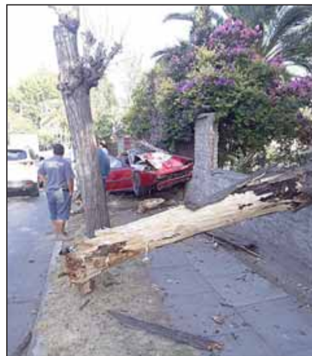
El árbol fue arrancado prácticamente de raíz tras el violento impacto vehicular.