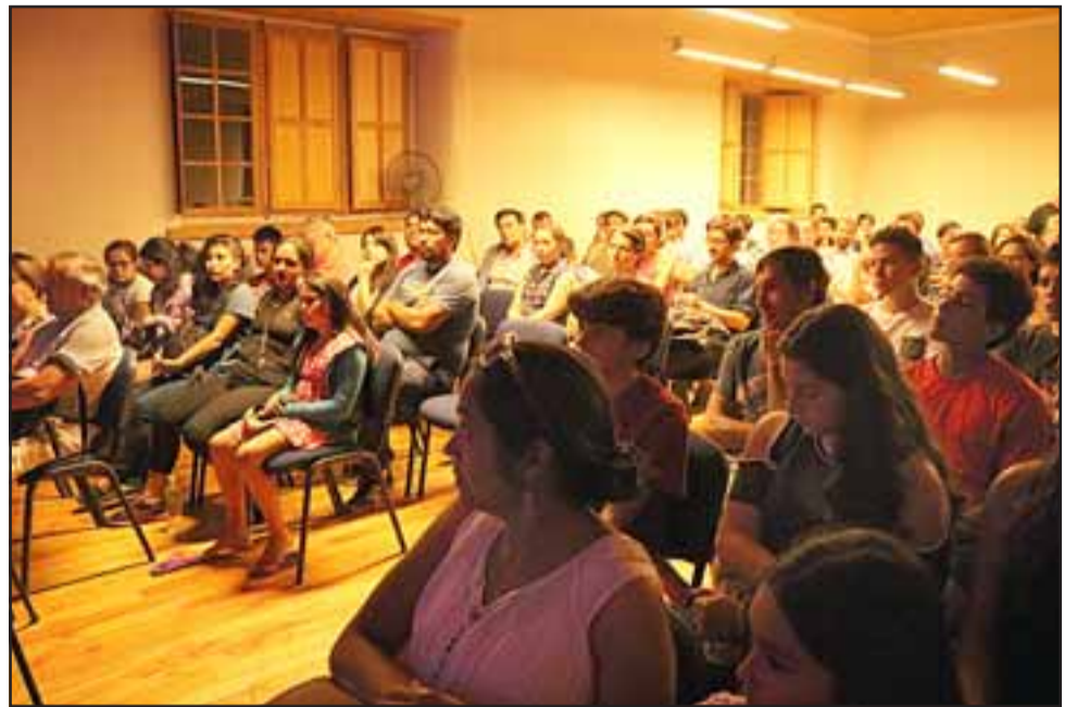
Esta iniciativa que se inició en enero, continuará todos los jueves de febrero y de manera gratuita.

«He encontrado muy bonitas estas charlas, he aprendido que hay diferentes tipos de estrellas y que las estrellas azules son las más calientes y las rojas son las más frías, me gusta