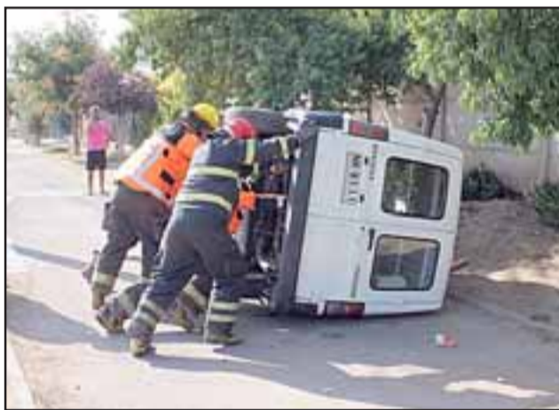
El conductor de este autor perdió el control al efectuar un viraje y chocar contra el tensor de un poste del alumbrado público.

Posteriormente arribó la Unidad de Rescate de la Primera Compañía y la Unidad Hazmat de la Segunda Compañía quienes trabajaron en sacar la batería del móvil, controlar una fuga de combustible y volver a la furgoneta a su posición normal. Producto de este accidente una parte de esa villa quedó sin energía eléctrica y el poste sufrió el desprendimiento de uno de sus focos que quedó peligrosamente colgando.