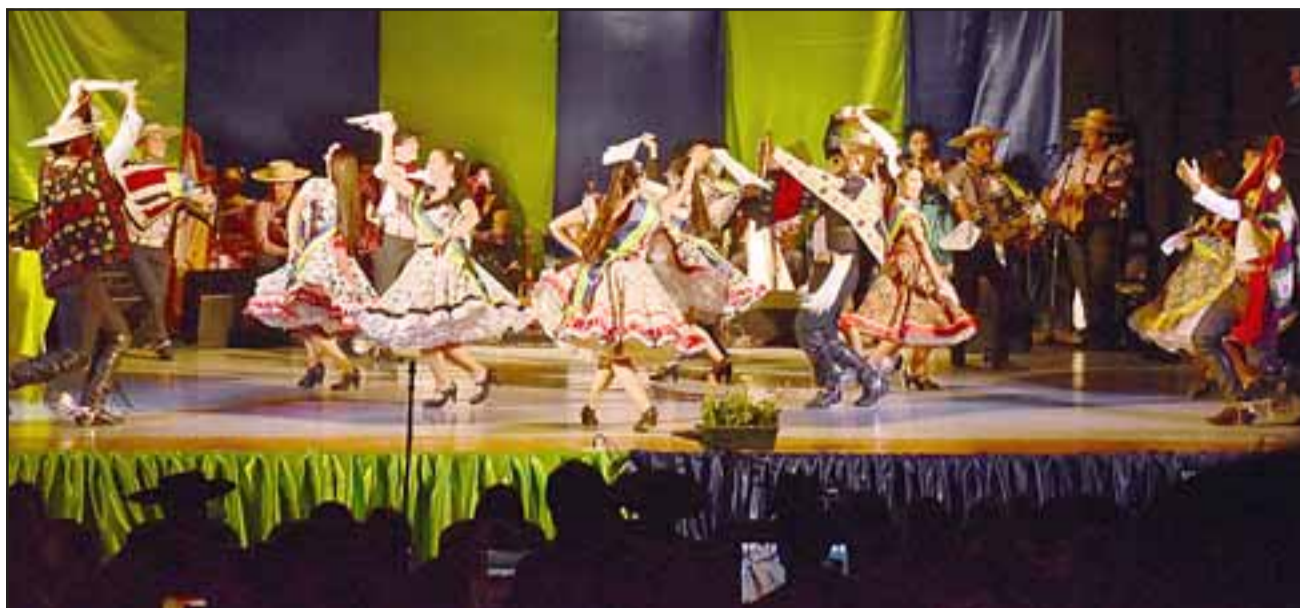
El martes 30 de enero hicieron arribo a Llay Llay las más de 15 parejas competidoras de cada región de Chile.

Los grupos folclóricos elegidos para musicalizar las tres jornadas de competencia en esta segunda versión del campeonato fueron “Las Colchagüinas de Santa Cruz”; “Grupo Antología Chilena”, de Santiago, y la agrupación “Silvanita y los del Quincho”, de la comuna de Quilpué, todas agrupaciones con trayectoria en este tipo de eventos folclóricos.