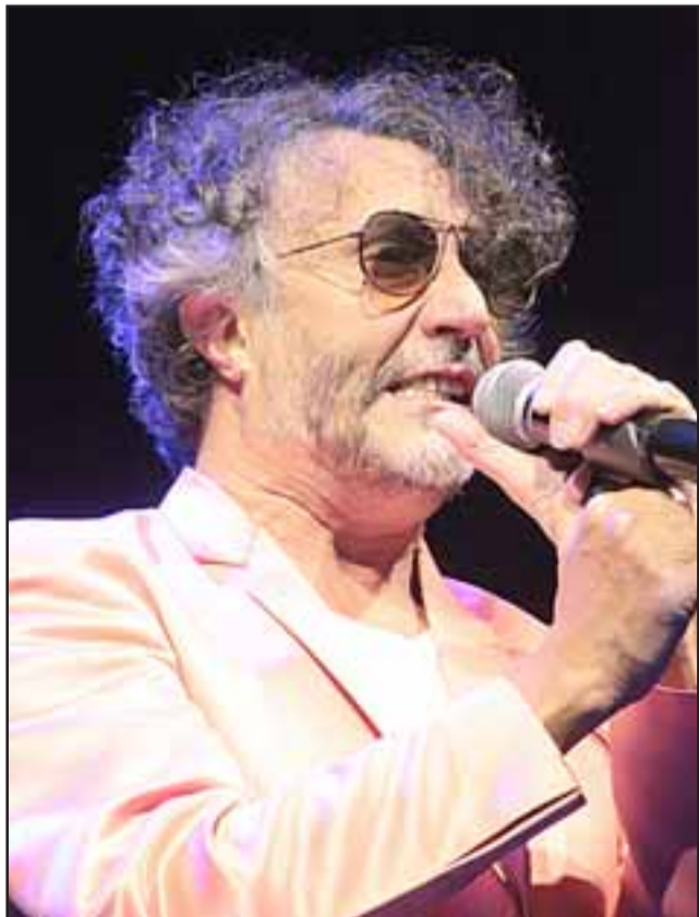
COMO UN COMETA. - Fito Páez también hizo de las suyas durante la más de media hora que duró su presentación.