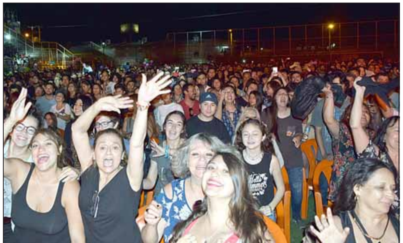
TRAS MUCHO ESPERAR. - Miles de personas corearon los temas de Palmenia y de Fito durante el concierto del viernes en el estadio municipal.