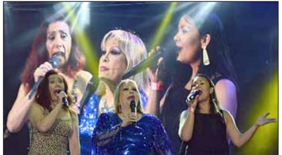
PALMENIA FOREVER. - Como lo hacen las grandes artistas, Palmenia Pizarro y sus coristas hicieron llorar a muchos en el Municipal la noche del viernes.