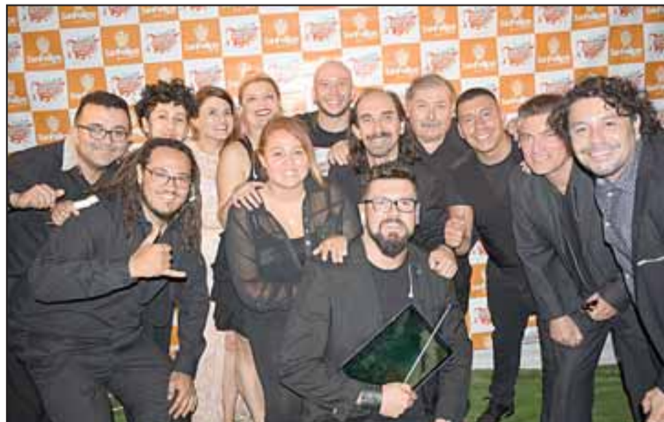
ORQUESTA IMPECABLE.- Ellos son los integrantes de la flamante orquesta del Festival Palmenia Pizarro, expertos músicos andinos y sanfelipeños.