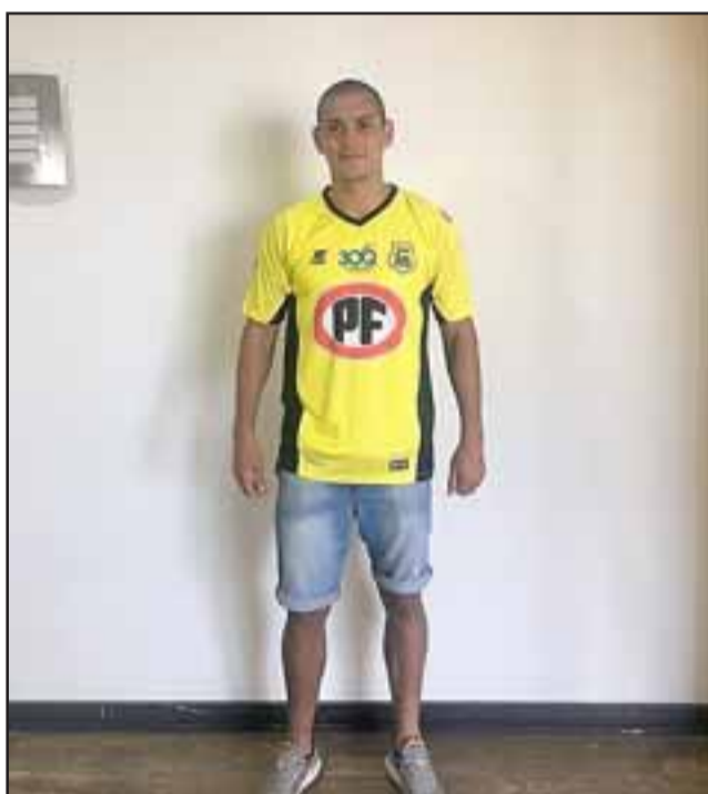
El mismo viernes en la tarde el espigado zaguero central se puso la divisa de San Luis.

a primera del viernes y durante la tarde fue presentado por San Luis como su nuevo refuerzo para este 2018.