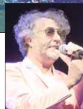
Fito Páez, el artista de peso internacional que abrió este vigésimo novena versión del festival.