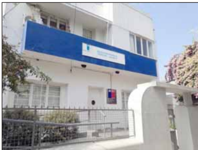
La oficina del Servicio de Vivienda y Urbanismo Serviu se ubica en avenida O'Higgins 961 (Ex 155) en San Felipe.

Por instrucción del Fiscal de turno, las diligencias del caso quedaron en manos de la Sección de Investigación Policial SIP de Carabineros de San Felipe, para