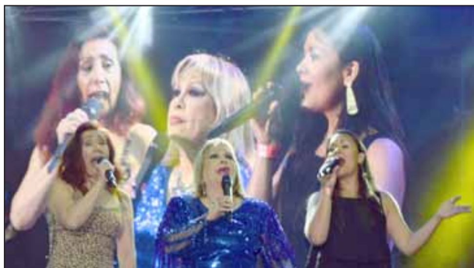
Un balance bastante positivo tuvo esta nueva versión del Festival Palmenia Pizarro.

con nosotros y nosotros accedimos dada la importancia y la magnitud del artista».