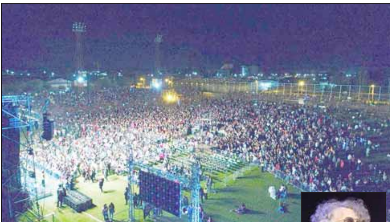
un poquito más tarde. Su representante conversó

Respecto a las presentaciones, la autoridad valoró la calidad de cada una de ellas, donde sin duda resaltó la presencia del argentino Fito Páez, quien en una primera instancia debía salir al escenario a eso de las 22.30 hora: «Estaba estipulado poder tener a Fito Páez un poco más tarde, tipo 10.30, pero como el cantante anda en una gira, anda con algunos problemas de garganta, era complicado para él, podía afectarse más su salud si salía