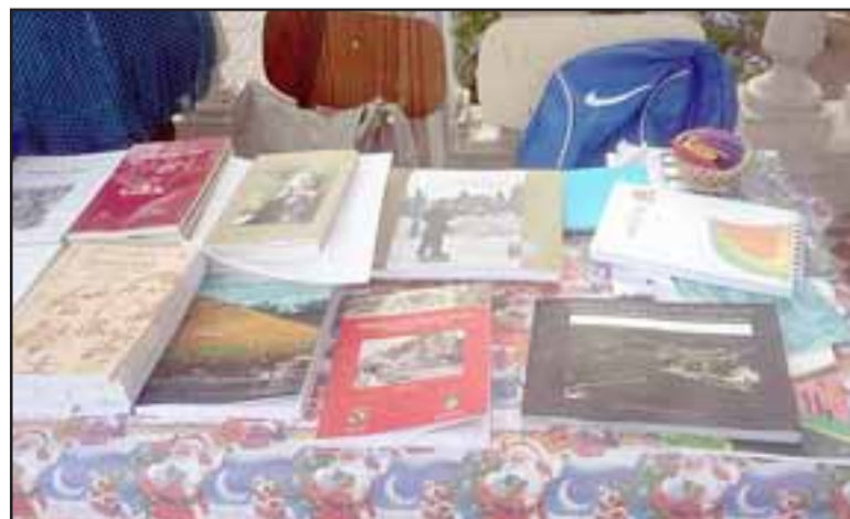
MUCHOS LIBROS.- Cientos de libros escritos por literatos aconcagüinos también estarán a la venta durante esta importante feria.