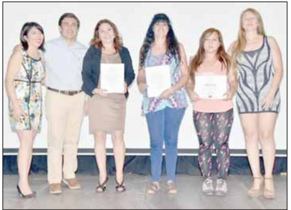
Dentro de la oferta programática existen talleres de formación para el trabajo, escuelas de emprendimiento, capacitación en oficios, nivelación de estudios, alfabetización digital y atención en salud odontológica en ambos Cefsam de la comuna.

Algunos de los requisitos para ser parte del PMJH son los deseos de ingresar al mundo laboral en forma dependiente o como emprendedora, tener entre 18 y 65 años de edad, vivir o trabajar en la comuna y pertenecer al tramo del 60% de mayor vulnerabilidad según el Registro Social de Hogares. Para inscribirse, es necesario dirigirse a las dependencias de Dideco en Yervas Buenas 330 de lunes a viernes entre 8:30 y 13:30 horas, presentando la fotocopia de la cédula de identidad y la cartola de Registro Social de Hogares.