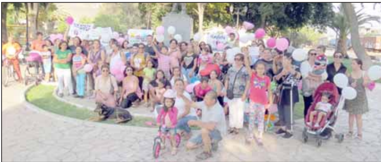
Numerosos vecinos de Llay Llay entregaron su respaldo al llamado nacional de creación de una ley más dura para quienes violen y asesinen a niños y niñas.

El ancla fue el inicio de la marcha hacia la plaza de Armas, recorriendo Balmaceda a paso firme, mientras en el parlante móvil sonaba 'Que canten los niños' de José Luis Perales. Canción emotiva que hizo llorar a varios de los presentes. Sin duda, nadie que se encontraba a esa hora en el lugar, quedó indiferente ante la actividad.