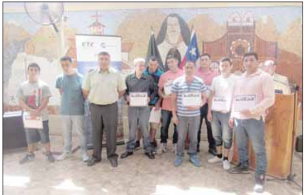
Durante aproximadamente tres meses los privados de libertad fueron capacitados, recibiendo un total de 120 horas de clases, la mayoría de ellas prácticas.

horas de clases, las que en su mayoría fueron prácticas. Esto permitió que los internos realizaran diversos trabajos de reparación de las instalaciones de la unidad, especialmente de aquellas que ellos ocupan, como los baños de algunos dormitorios y el patio Sor Teresa»,