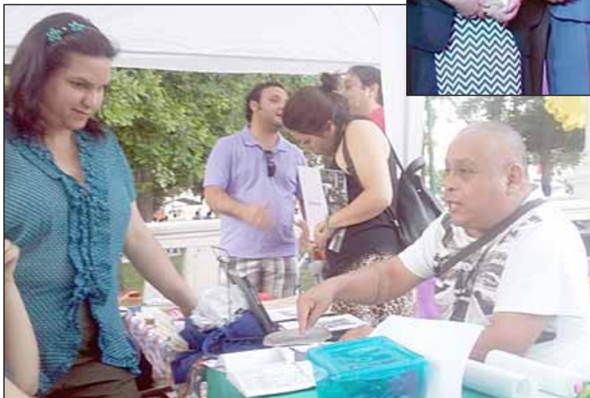
CUENTOS Y POEMAS.- Cada uno de los literatos estará presentando sus obras en la terraza de nuestra Plaza de Armas, en San Felipe.