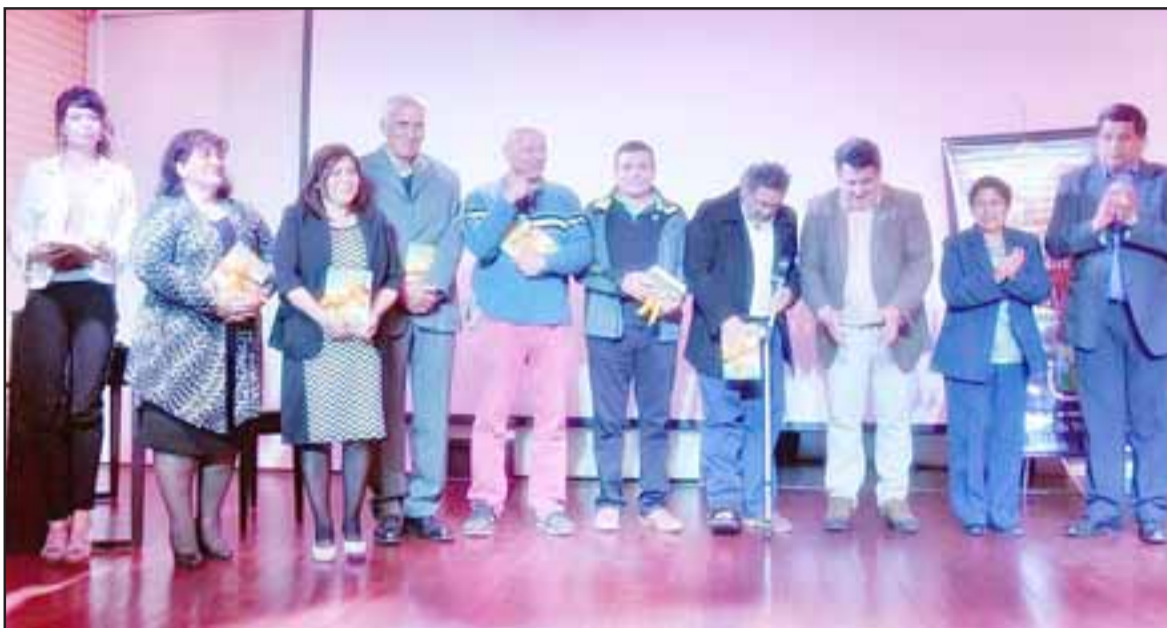
Muchos escritores y público en general podrán participar en este Concurso literario organizado por Putaendo Histórico.