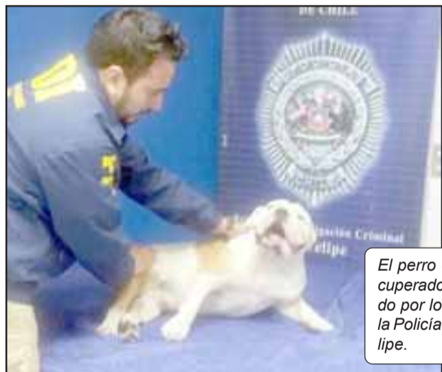
El perro de raza bulldog inglés fue recuperado tras el procedimiento efectuado por los funcionarios de la Bicrim de la Policía de Investigaciones de San Felipe.

La Brigada Criminalística de la Policía de Investigaciones de San Felipe concretó la detención de un joven de iniciales F.A.R.C. por el delito de receptación de un perro de raza Bulldog Inglés valuado en $900.000, sustraído desde un departamento de calle Sargento Aldea en San Felipe.