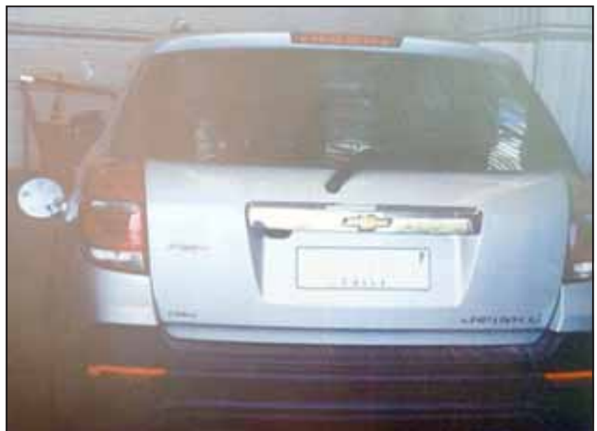
NUEVO DE PAQUETE. - Este es el vehículo afectado por este cambio erróneo de combustible, un vehículo nuevo de fábrica.