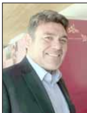
Nelson Venegas, alcalde de Calle Larga.