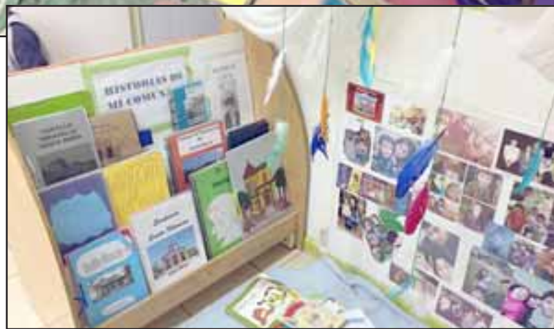
Niños y niñas, junto a sus familias, se reunieron para crear textos incentivados por el rescate histórico cultural del sector.