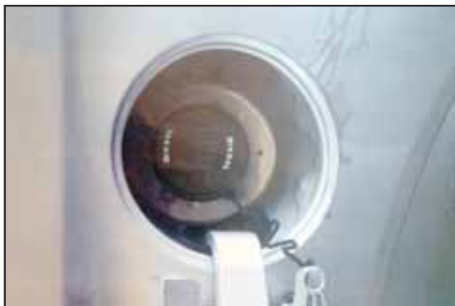
ERROR HUMANO. - Claramente se lee en la tapa del estanco la palabra DIESEL, detalle importantísimo que el empleado no advirtió.