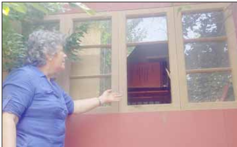
OJO VIGILANTE.- Por esta ventana ingresó el delincuente o ladrones al centro cultural, a partir de hoy jueves las cámaras de seguridad estarán de nuevo activadas.