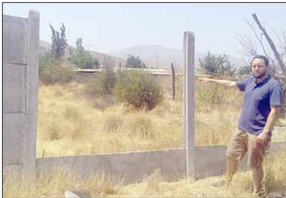
MÁS SEGURIDAD.- Por esta pandereta dañada ingresaron los antisociales al centro cultural, ¿qué sigue ahora?