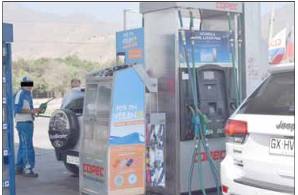
ERROR FATAL. - El error de un bombero al cargar bencina a un vehículo petrolero, tiene ahora enfrentados a la dueña del móvil con la empresa Copec, cuyo concesionario no obstante accedió responsablemente a reparar los daños.