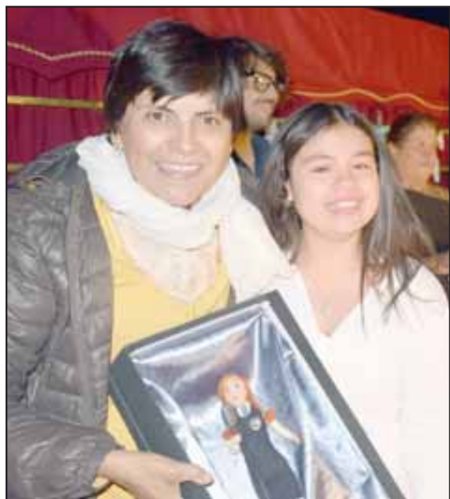
UNA GANADORA.- Aquí vemos a nuestra amiguita recibiendo el premio al Primer Lugar del Sanfest 2017, en la Escuela José de San Martín, en San Felipe.

miedos, recibí el primer lugar según decidió el Jurado», dijo la joven artista sanfelipeña.