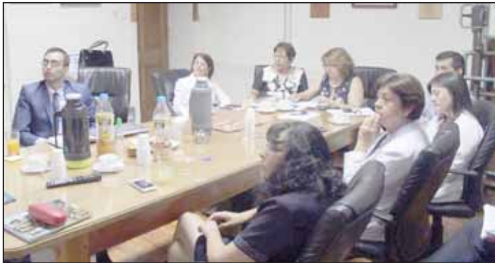
Personal de los centros de salud familiar de la provincia en una reunión que se realizó el pasado lunes, donde el director de Fedes presentó el modelo de trabajo de la institución.

la calidad que los profesionales de la salud solicitaron.