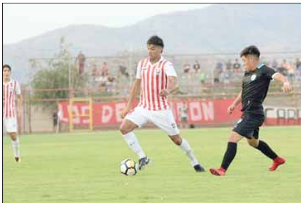
Con gusto a poco fue el debut del Uní Uní en el torneo 2018 de la Primera B al igualar con Magallanes.

Tras el empate la hinchada alcanzó a ilusionarse con el triunfo a raíz que los dueños de casa se veían bien y firmes, pero en el minuto 73 hubo una acción determinante en el encuentro