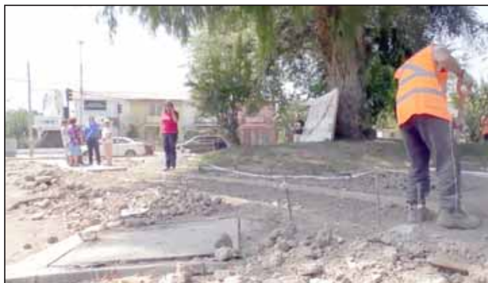
El alcalde Patricio Freire se había comprometido con la comunidad a mejorar el sector desde el punto de la infraestructura y de la seguridad.