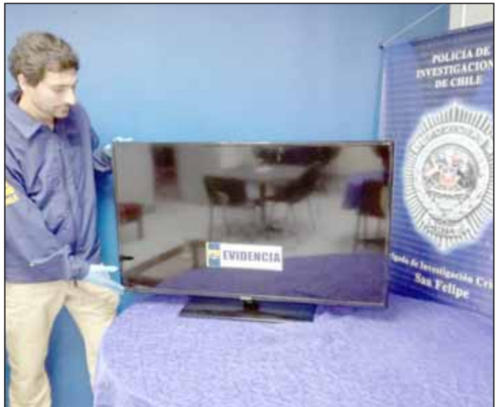
Tras las diligencias efectuadas por la Bicrim de la Policía Civil se logró la recuperación de este televisor led marca Samsung que fue sustraído la mañana de ayer miércoles desde una vivienda en San Felipe.