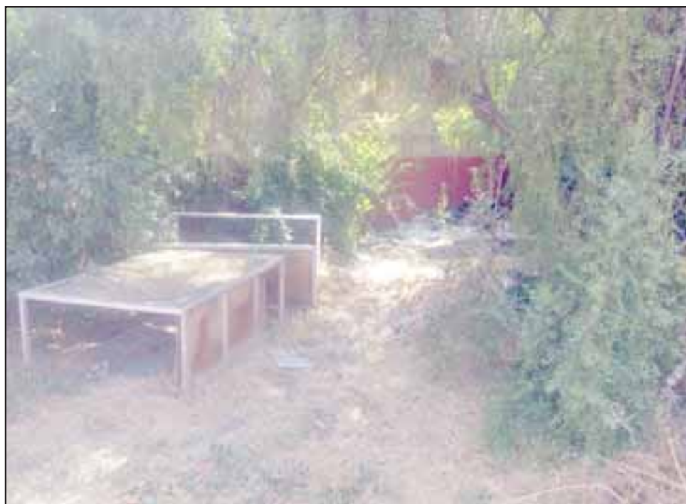
EN INVESTIGACIÓN.- Tal cual lo muestran las cámaras de Diario El Trabajo, muy cerca de este centro cultural pernoctan adictos, lo cual ya está siendo investigado por Carabineros.