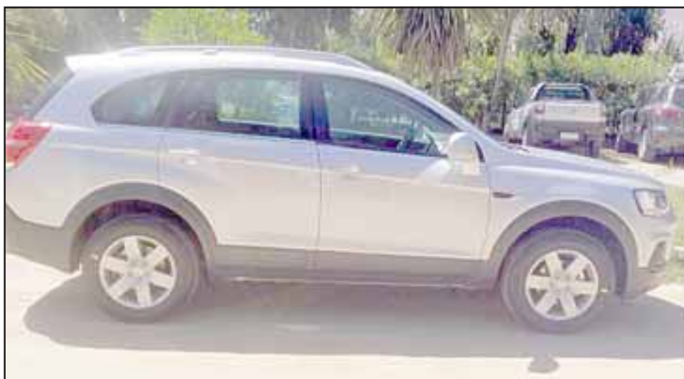
EN ESPERA. - Esta es el vehículo afectado por este fatal accidente, el cual Copec responsablemente ha intentado reparar.

- ¿Interpuso usted alguna denuncia en Sernac?