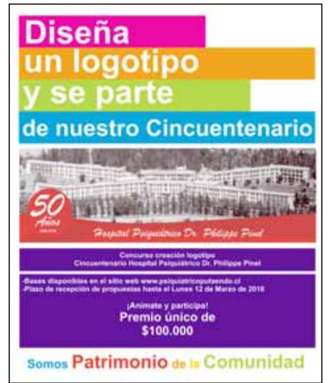
Este es el afiche con que se está invitando a participar del concurso.

El principal objetivo de esta convocatoria es realizar los elementos identitarios del establecimiento, basándose en su historia, arquitectura y patrimonio. Una forma de fomentar el senti-