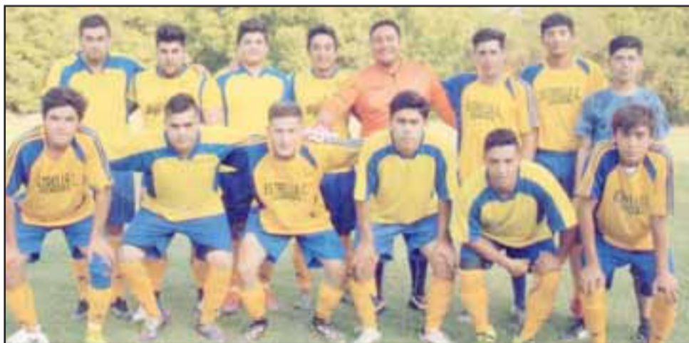
Serie de honor del club Estrella Central.

esta sección hoy presentaremos a las dos series de honor del club Estrella Central, a través de estas imágenes que fueron capturadas por el lente de nuestro gran colaborador Roberto Valdivia.