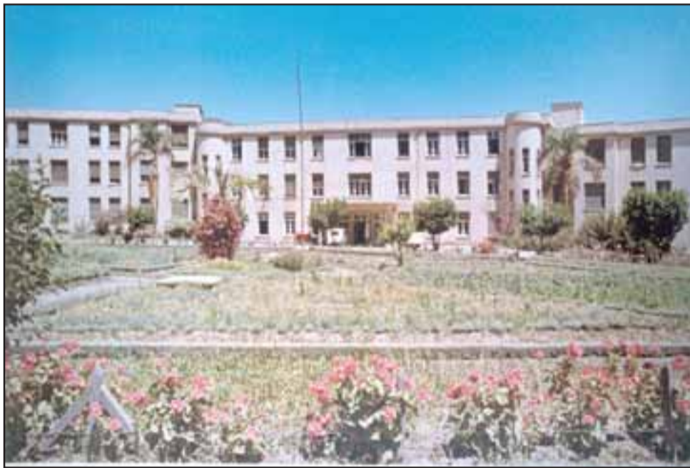
El imponente y majestuoso edificio del Hospital Psiquiátrico de Putaendo, otrora Sanatorio Broncopulmonar.

Las bases del concurso están disponibles en la página web www.psiquiatricoputaendo.cl y el plazo de entrega de los trabajos se extenderá hasta el mediodía del lunes 12 de marzo. Hay un premio en efectivo de $100.000 que serán entregados durante la Cuenta Pública del Hospital.