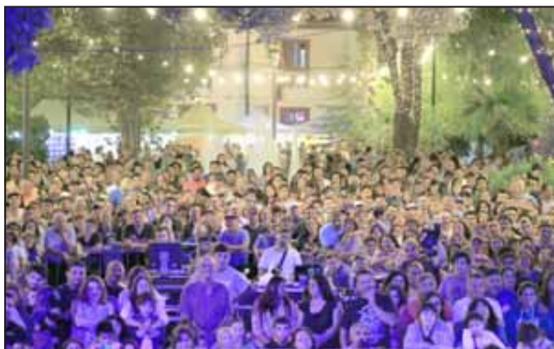
Como todos los años, el Carnaval de la Chaya de Putaendo se convierte en el evento más masivo de este tipo en el valle de Aconcagua.

"Queremos que putaendinos, putaendinas y visitantes del país estén seguros. De verdad que esa espuma en spray es bastante molesta para muchos vecinos, tóxica, peligrosa y muy inflamable. A nombre de toda la ciudad, quisiera dar las gracias a todos los comerciantes del centro de nuestra comuna, quienes han entendido y colaborado con esta intención de tener una fiesta segura para todos", destacó el alcalde Guillermo Reyes.