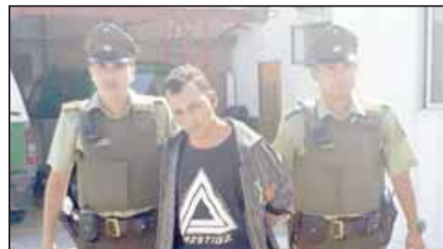
El santiaguino detenido fue derivado hasta el Tribunal de San Felipe para ser formalizado por la Fiscalía por receptación de vehículo motorizado, en tanto su cómplice fue formalizado en el Tribunal de Santiago por robo con intimidación.

Con esta importante información, Carabineros de la Prefectura Aconcagua iniciaron un amplio operativo coordinando el seguimiento del automóvil hasta lograr darle alcance en el sector La Estancilla de Llay Llay, momento en que los delincuentes abandonaron el móvil tras estrellarse contra la barrera de contención en la ruta producto de alta velocidad, escapando a pie.