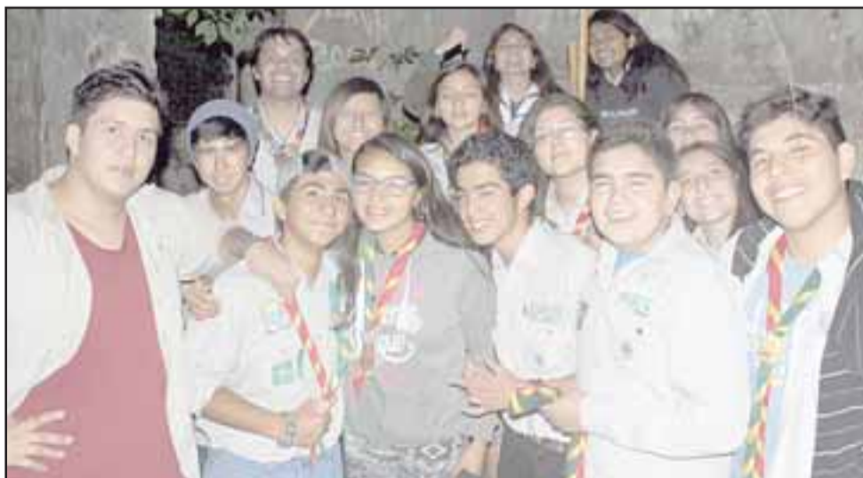
DESCUBRIENDO EL MUNDO. - Hasta penetraron en misteriosas cavernas en Codegua, hicieron fogatas y mil travesuras.