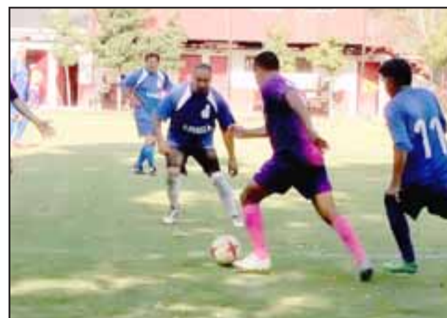
Equipos que son serios candidatos a dar la vuelta olímpica son los que chocarán este domingo en la competencia de la Liga Vecinal.