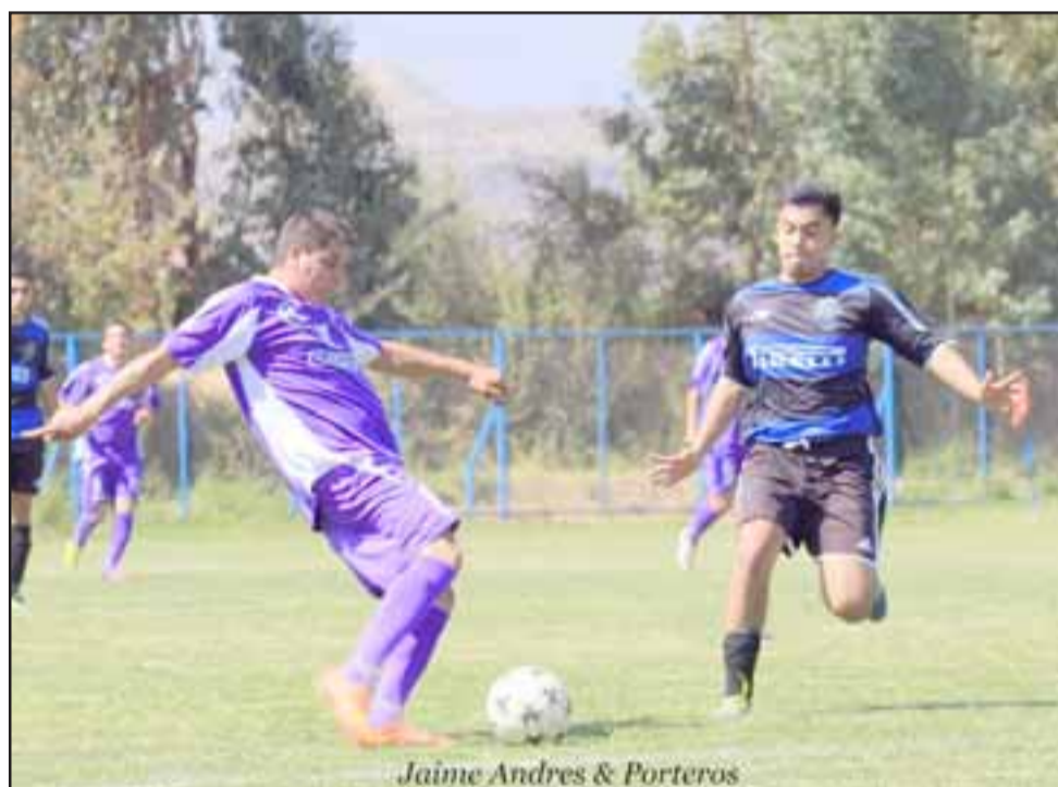
El domingo se desarrollará la fecha dos de los torneos Afava y Amor a la Camiseta.