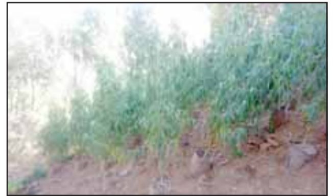
Un total de 633 plantas de cannabis sativa fueron incautadas por la policía civil durante la jornada de este miércoles en el sector rural de Cerrillos en Catemu.

La Fiscalía ordenó la incautación del cultivo para su destrucción.