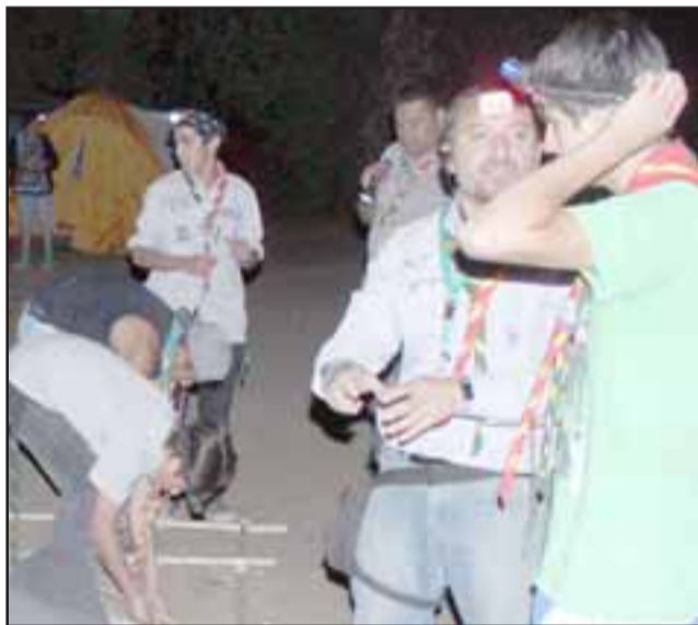
SIEMPRE LISTOS. - Ellos son autosuficientes, saben crear el ambiente para trabajar, sin alterar su entorno.