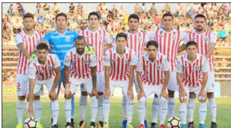
Unión San Felipe enfrentará mañana a un Deportes La Serena que todavía no ve acción en el torneo.