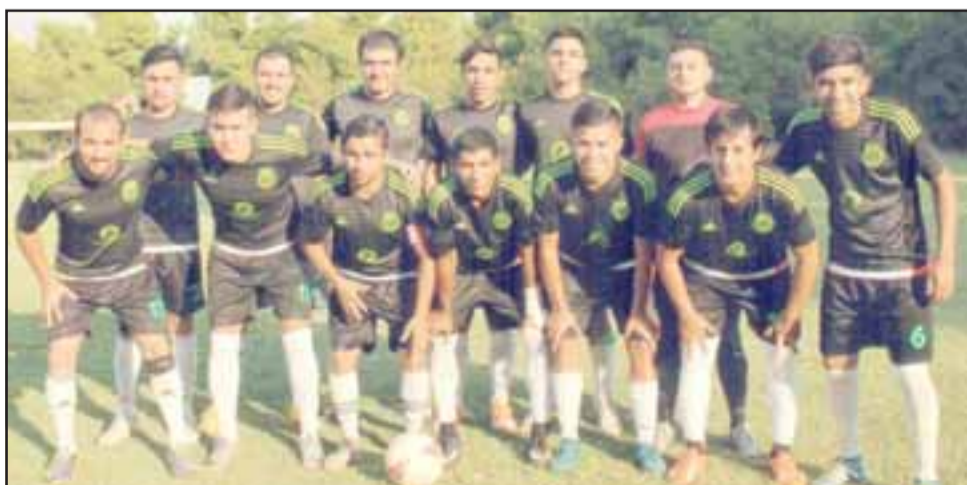
Primera serie de Dos Amigos.