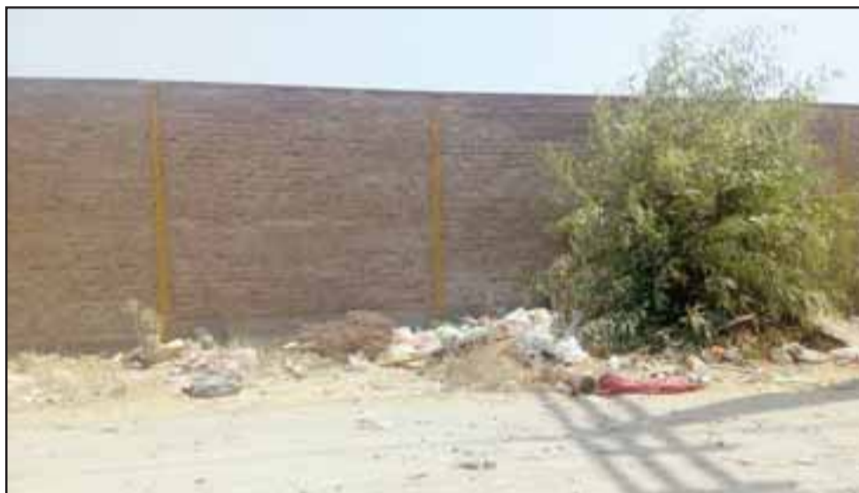
Micro basural en avenida 12 de Febrero.