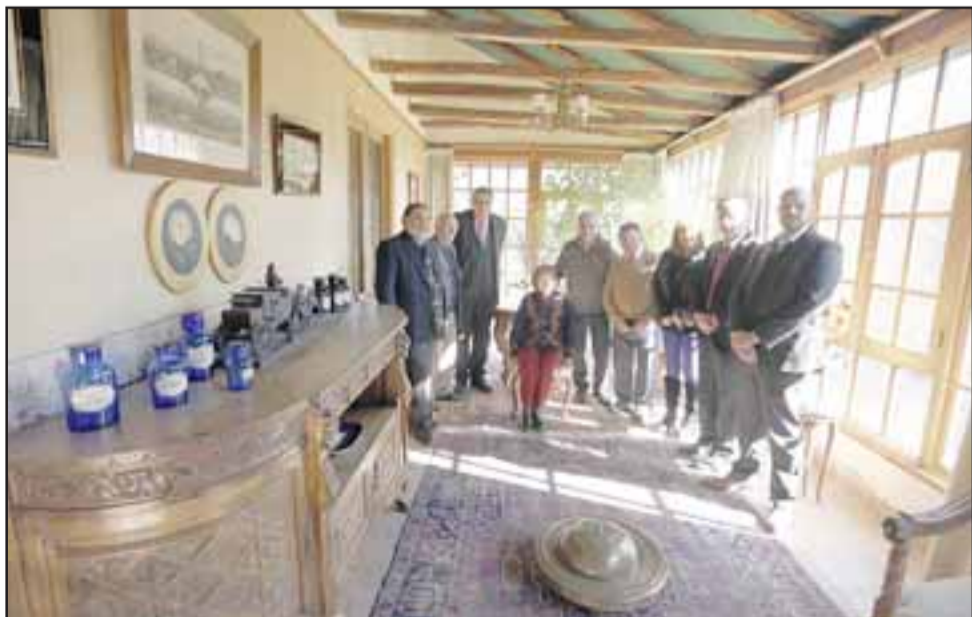
DE LUJO.- Un tesoro arquitectónico que podría ser ahora para el disfrute de los rinconadinos y visitantes.