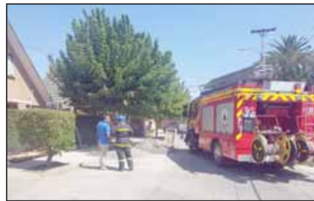
Personal de Bomberos logró controlar la emergencia registrada la tarde de ayer jueves en el Condominio Dalcahue en San Felipe.

El oficial relató que el suceso causó bastante conmoción en la vecindad debido a que se desconocía el corte del suministro de gas desde la bomba instalada en