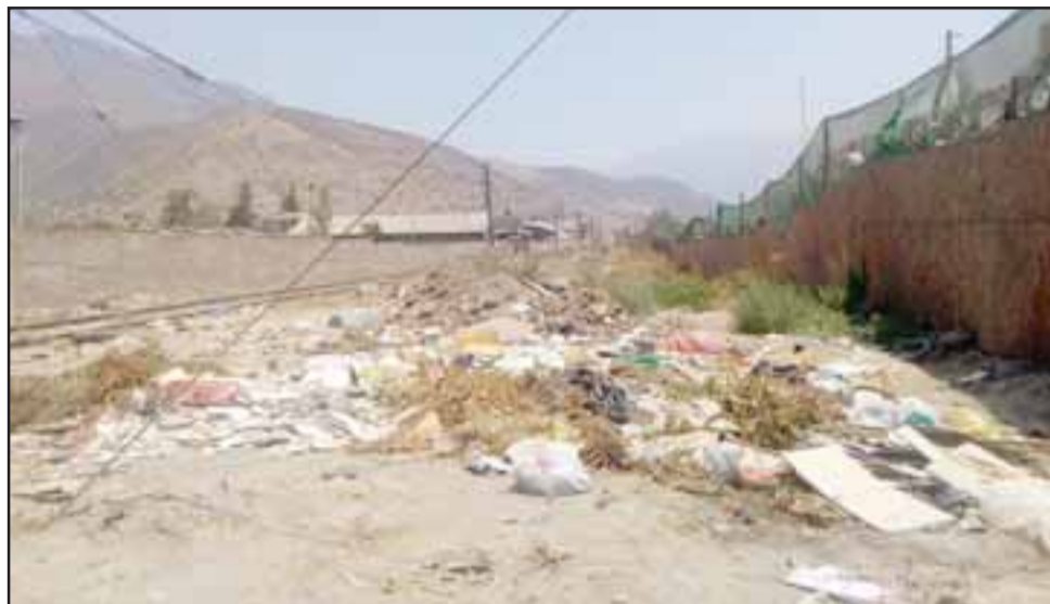
Micro basural costado de línea férrea.

Además indicó que para solicitar las bateas donde depositar cachureos, se debe hacer por intermedio de las juntas de vecinos, “con quienes lo estamos haciendo súper bien, las juntas de vecinos constantemente están pidiendo las bateas que deben ir donde no moleste el tránsito, donde no moleste al vecino, en