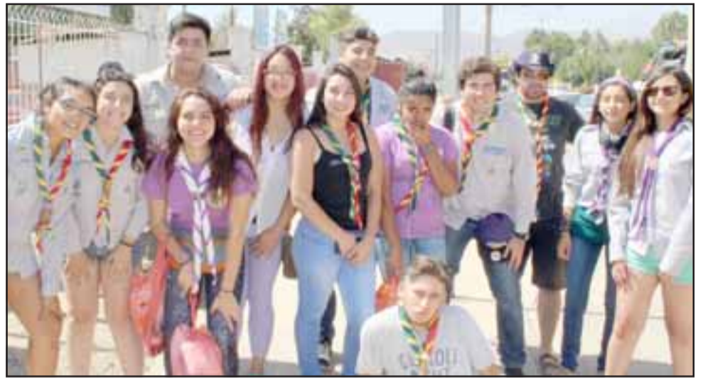
JÓVENES AVENTUREROS. - Aquí tenemos a los scouts del Grupo Sagrada Familia de Nazaret, del Movimiento Scout San Felipe, disfrutando en grande de este campamento en el Campo Escuela Callejones, en la comuna de Codegua, VI Región.

«En esos días de campamento (desde el 30 de enero al 4 de febrero), se realizaron diversas actividades, como lo fueron talleres, juegos, competencias, excursiones por el sector, juegos nocturnos, una pequeña fiesta para las unidades mayores, actividades en la piscina y para finalizar nuestro fogón que da fin a nuestro campamento (el cual se realiza en la última noche). Los niños y jóvenes se educan a través de estas actividades, nuestro Método Scout se caracteriza por ser una educación no formal, donde a través del juego, el servicio y la vida al aire libre, van adquiriendo valores que apoyan el desarrollo de cada persona, puesto que la finalidad del movimiento guía y Scout es entregar a la sociedad personas de bien, amables, serviciales y desempeñando una carrera profesional», comentó Silva a Diario El Trabajo .