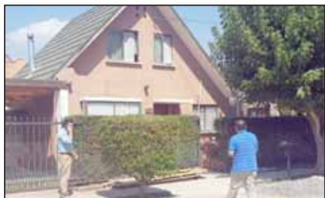
El hecho causó bastante conmoción entre los vecinos tras la explosión por fuga de gas que ocasionó que dos trabajadores resultaran con quemaduras en su cuerpo.

el condominio. No obstante tras la oportuna llegada de los voluntarios de bomberos, se logró controlar la emergencia.