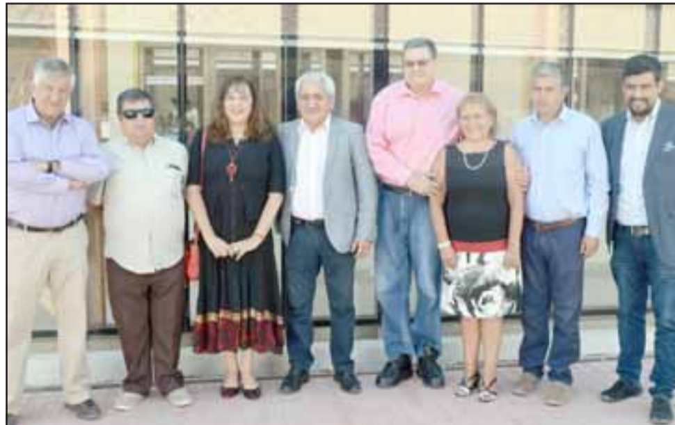
Autoridades locales y regionales se encontraron nuevamente para atender este apremiante reto: Comprar una propiedad para la Casa de la Cultura, en Rinconada.