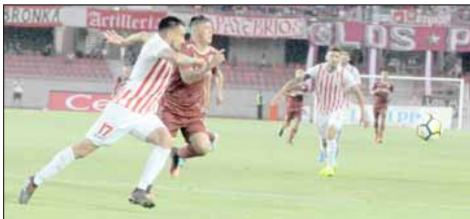
Mostrando los mismos ripios que en el debut, Unión San Felipe fue superado 1 a 0 por Deportes La Serena.

San Felipe sintió la estocada papayera porque cayó