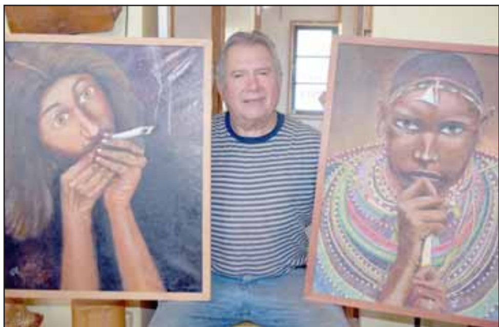
SOLIDEZ Y BELLEZA.- Aquí vemos a la izquierda a un personaje que ya falleció, parte de una colección de la temática de los fumadores, a la derecha tenemos a una bellísima africana.