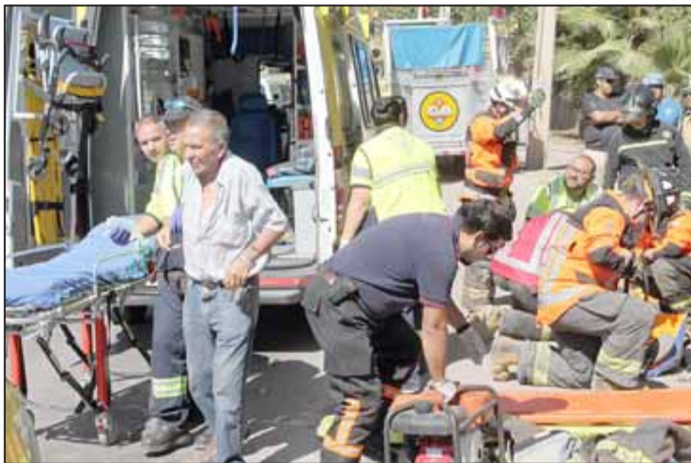
Una vez liberados los heridos, estos fueron entregados a Samu y derivados en ambulancia hasta el Servicio de Urgencia del Hospital San Juan de Dios.

Una vez liberados los heridos, estos fueron entregados a Samu y derivados en ambulancia hasta el Servicio de Ur-