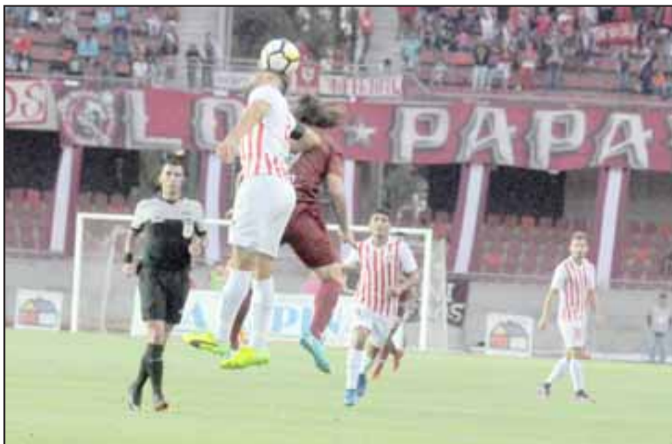
En el estadio La Portada la escuadra albirroja no tuvo argumentos para superar o al menos empatar con La Serena.