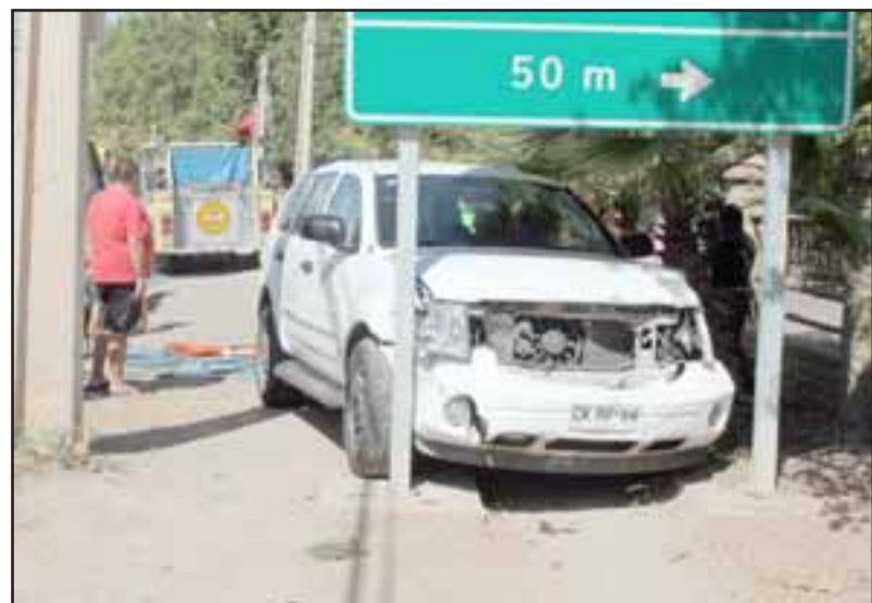
Tres lesionados de diversa consideración dejó un accidente de tránsito ocurrido la tarde de este sábado en Calle General del Canto.

Tanto el conductor como uno de los pasajeros del colectivo quedaron atrapados en el interior, razón por la cual se hizo necesaria la presencia de las Unidades de Rescate de la Primera y Tercera Compañía, así como también la unidad Hazmat de la Segunda Compañía.