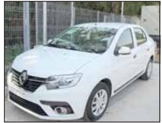
Estos vehículos fueron adquiridos gracias al reconocimiento de las buenas prácticas de salud.

Para este 2018 se continuará con esta buena práctica, que reúne a Oficina de la Mujer, Registro Social de Hogares, Omil, Oficina de la Vivienda, Departamento de Obras, médico, dentista, terapias alternativas y Dideco.