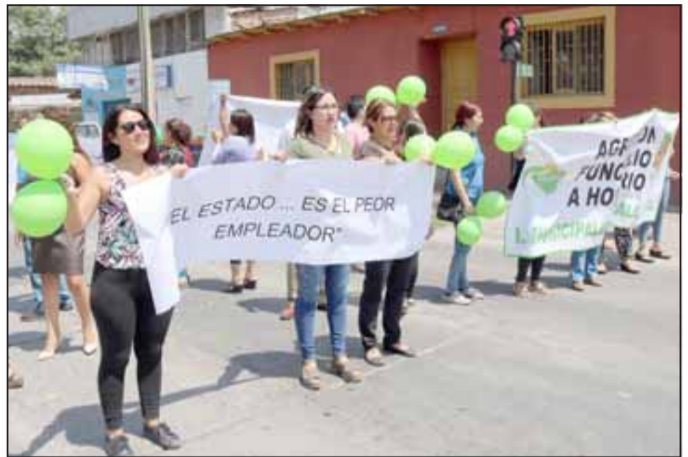
A PROTESTAR.- Con esta manifestación se busca además hacer un gran llamado a los funcionarios a honorarios de las instituciones públicas a unirse y rechazar esta obligatoriedad de pagar imposiciones mientras no se entregue derechos igualitarios.

2. Si bien es cierto el artículo 10 del Estatuto administrativo de funcionarios públicos, permite la contratación sobre la base de honorarios, éstos deben ser contratados para realizar labores accidentales y no habituales o también para prestación de servicios cometidos específicos. Sin embargo, los funcionarios a honorarios pertenecientes al servicio público a nivel nacional, generalmente estamos sujetos a labores permanentes y No Habituales , donde cumplen horario