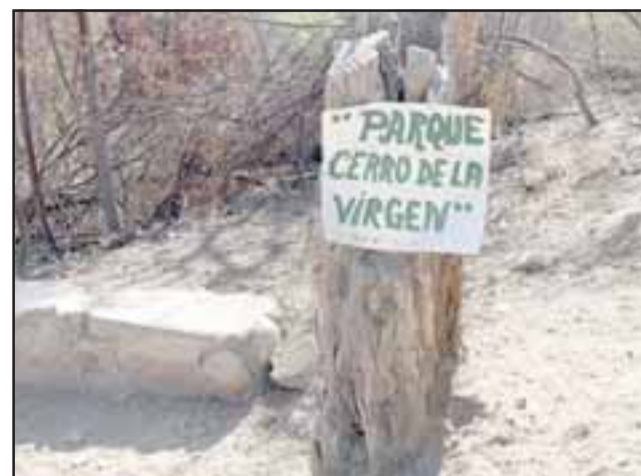
La idea de este Plan Ambiental de Emergencia es propiciar iniciativas para paliar los efectos del cambio climático.

Arellano subrayó la comuna cuenta con un Consejo Ambiental Comunal formado por diversos actores sociales, el cual debería ser el gran agente socializador del Plan. En este sentido, el concejal dijo que este plan debería contemplar la replantación anual de 5.000 especies nativas debidamente aclimatadas, duran-