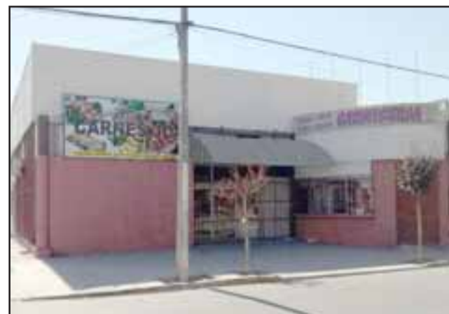
Carabineros capturó al antisocial de 19 años de edad luego de haber sustraído dinero desde la Carnicería JO ubicada en Calle Traslaviña esquina Santo Domingo, en San Felipe.