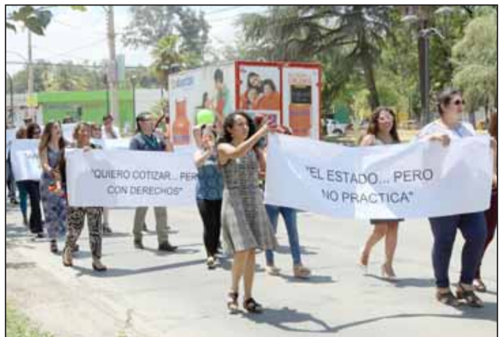
Esta protesta en la Plaza de Armas de la comuna fue para exigir los mismos derechos de los funcionarios públicos contratados y mostrar el rechazo de las cotizaciones obligatorias, proceso que comenzó a regir desde enero de este año.

5. Desde este momento nos declaramos en estado de movilización e invitamos a todos los colegas honorarios a organizarse y estar alerta a las convocatorias para futuras movilizaciones.