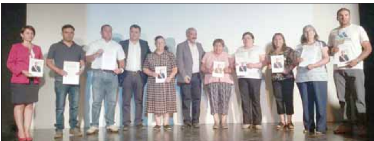
Un total de 46 organizaciones que se adjudicaron este fondo durante el 2017, superando así los 44 millones de pesos.

“Esto le ayudará sobre todo a las personas que están postradas, adultos mayores y personas con cáncer, muchas de las cuales son de mi sector. Esto les