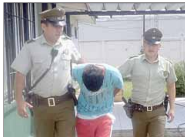
El sentenciado deberá cumplir una pena de 5 años y un día de cárcel tras ser condenado por el delito de Robo en lugar habitado. (Foto Referencial).