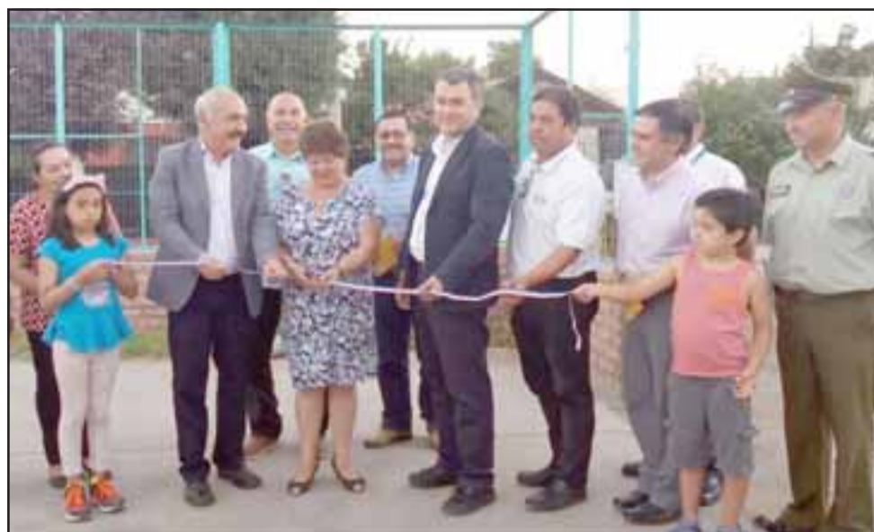
Esto es gracias al fondo concursable del 6% del FNDR del Gobierno Regional, sistema solidario de participación comunitaria para la prevención de delitos.

AVISO: Por extravío quedan nullos cheques N° 9514677, 9514678, Cta. Cte. N° 22300014457 del Banco del Estado, Suc. San Felipe. 8/3