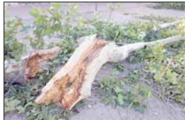
Las medidas a desarrollar buscan también mantener nuestro entorno libre de obstáculos como éste.