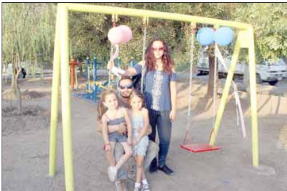
Ahora los más de 150 vecinos cuentan con un espacio para disfrutar en familia.