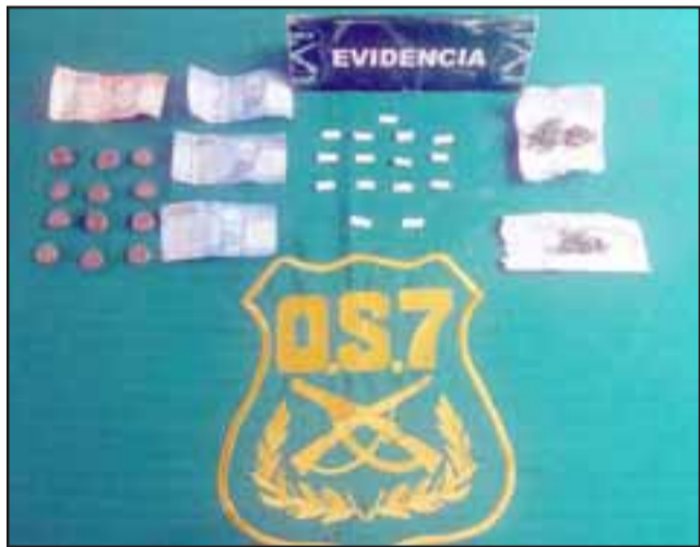
Personal del OS7 de Carabineros Aconcagua efectuó el allanamiento a la vivienda del enjuiciado en la Villa Los Aromos de Santa María.

La Fiscalía llevó a juicio al acusado tras las diligencias efectuadas por personal del OS7 de Carabineros en un departamento de la Villa Los Aromos de Santa María, incautando drogas y dinero en efectivo.