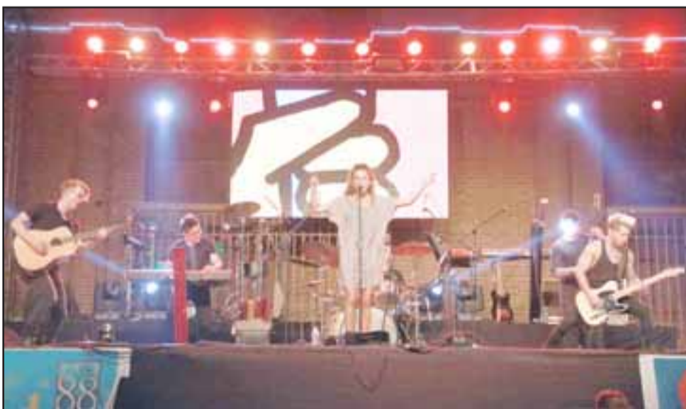
Camila Gallardo, la cantante juvenil con mayor proyección del país, reveló en el escenario que tiene familiares en Putaendo, dedicando su presentación a su abuelita fallecida hace poco tiempo.