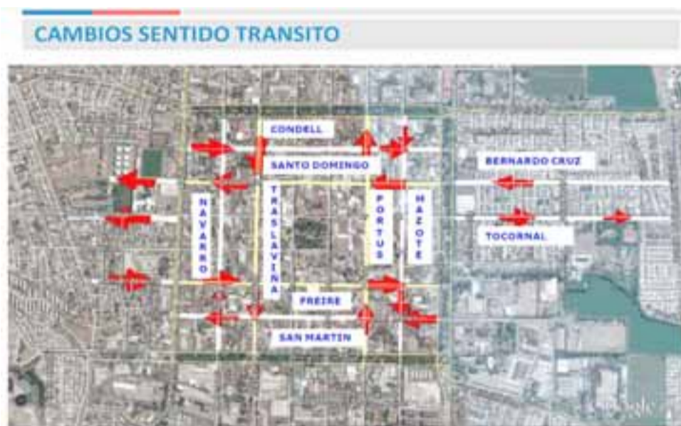
Este es plano con las calles que cambiarán su actual sentido de tránsito en San Felipe.

- No, cambia de sentido desde Yungay hacia el oriente, o sea solamente sería de subida como hablamos los sanfelipeños, en ese minuto cuando esté implementada esa subida se va a terminar o entregar a uso las ciclovías. Cambia de sentido Santo Domingo, Carlos Condell, es decir se invierten los sentidos actuales, en el sector sur calles Freire y San Martín también cambian de sentido en el lado oriente calle Portus y Toromazote también cambian de sentido y en el lado poniente calle Traslaviña y Navarro cam-