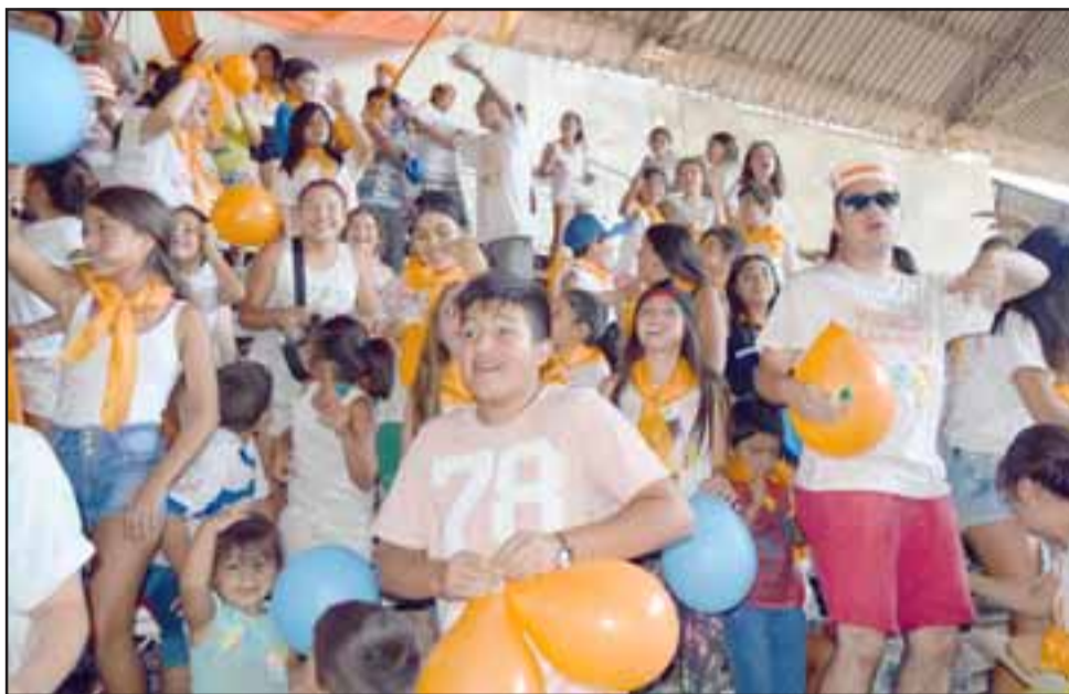
CEVAS INTENSO.- Cientos de niños de nuestra provincia culminaron con alegría la 26ª jornada de los Cevas 2018 en el Fortín Prat la tarde de este viernes.