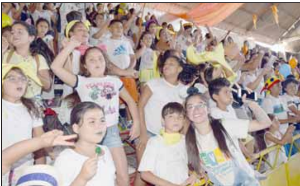
ÉXITO ROTUNDO.- Este año los Cevas San Felipe fueron otro éxito en nuestra provincia, anhelando desde ya volver a recibir a los niños en 2019.