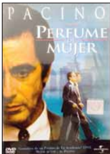
PERFUME DE MUJER. - Una película famosa de Al Pacino, su nombre al menos fue replicado en Aconcagua en la forma de un trío musical. (Referencial).