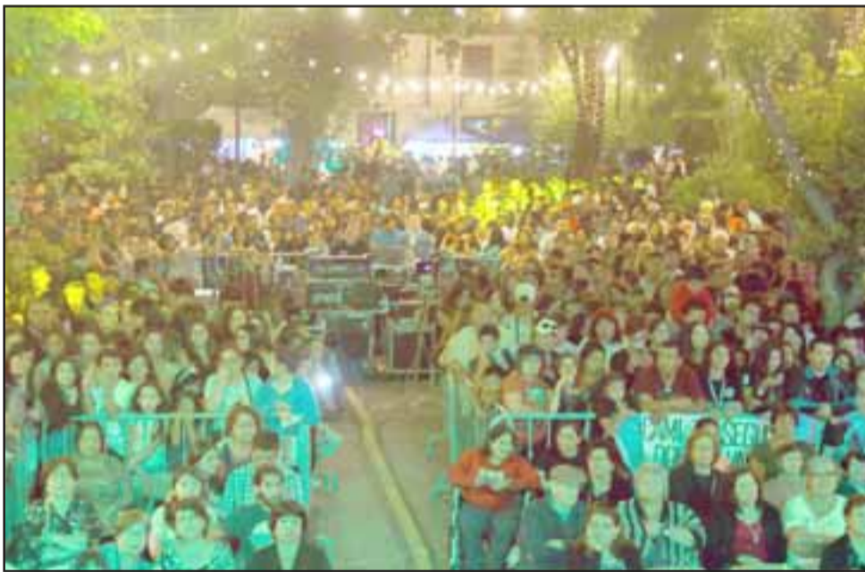
Como ya es tradición, la Plaza Prat de Putaendo se ha visto atiborrada de público durante la realización de ‘El Carnaval Más Largo de Chile’

Al final de esa noche, el grupo argentino de ‘La Cumbia’ hizo bailar a todos con sus éxitos. “Muy feliz de ver a la gente bailando nuestra música. No solamente aquellos que nos seguían en los años noventa. También vimos a los más chiquitos. En Chile todos son muy alegres y todos se saben nuestras canciones.