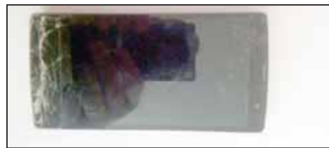
Efectivos de Carabineros recuperaron el teléfono celular de propiedad de la víctima, quien fue asaltada al mediodía de ayer lunes en San Felipe.

timentas un teléfono celular de propiedad de la afectada, quien posteriormente reconoció al individuo como el autor del hecho. No obstante Carabineros informó que no se logró encontrar algún armamento de fuego que habría sido utilizado para