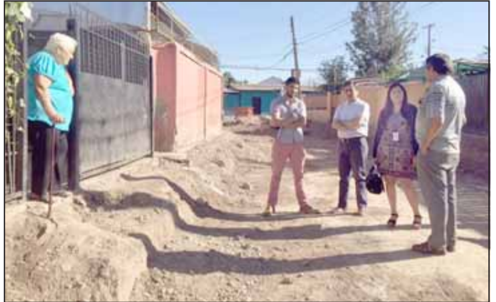
Para las personas de la tercera edad, principalmente, el estado actual de las obras constituye un verdadero calvario.

La profesional detalló que el contrato para estos trabajos está vigente hasta los primeros días de junio, «pero lo que si