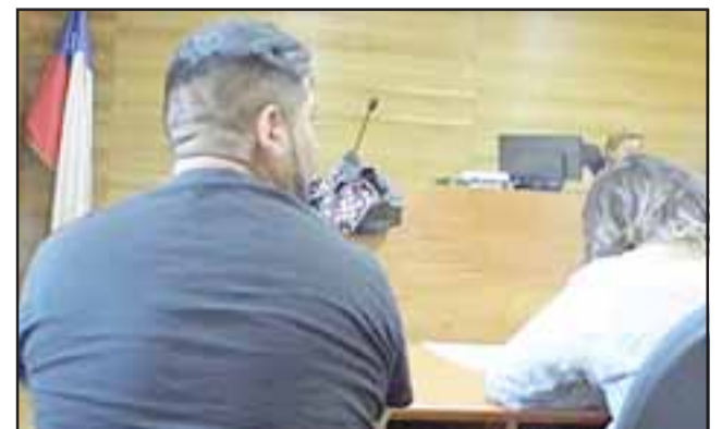
El detenido, sin antecedentes policiales, fue formalizado y quedó en libertad provisoria.

Si bien el persecutorio pidió la medida cautelar de