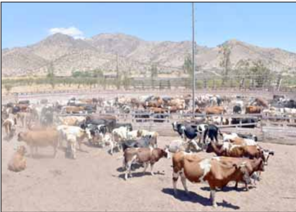
La alta tasa de mortalidad del ganado vacuno a causa de la bacteria movilizó a las autoridades a realizar el operativo.

profesionales, los que realizaron una revisión del ganado, colocaron vacunas y dispositivos de identificación al ganado, cumpliendo con el programa de trazabilidad animal del go-