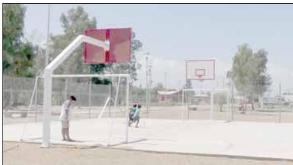
La multicancha permite que los niños puedan practicar deporte en un sector que hasta hace poco era un sitio totalmente inseguro.

«Lo que existía aquí era un sitio eriazó, un sector marginal de la población, que hoy día se ha transformado en un espacio, con una inversión que se constituye de la siguiente forma: con espacios para jóvenes, para niños, por una parte; y con un recorrido de veredas en hormigón, para que las personas puedan pasar por el sector, con iluminación para buscar la