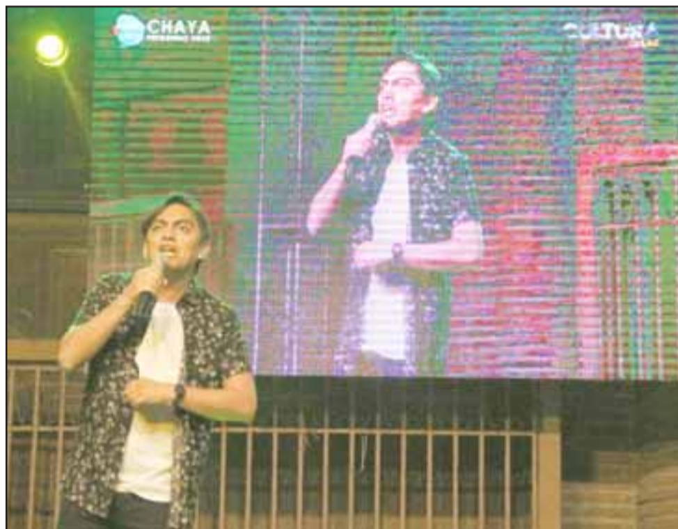
El irreverente humorista Sergio Freire quedó encantado con el público: " Súper bien la gente, muy amorosa y muy educada" .