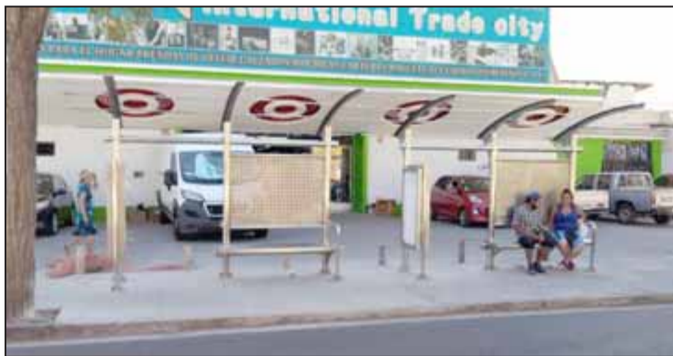
En calle Traslaviña frente al ex cine Aconcagua se instaló un nuevo paradero como se aprecia en la imagen.

En total debieran instalarse unos 23 nuevos paraderos en la ciudad de San Felipe.