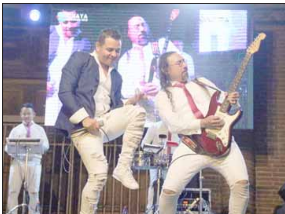
El grupo argentino 'La Cumbia' hizo bailar a todos con sus éxitos en el cierre de la noche del viernes.

Es así como el 'Carnaval Más Largo de Chile' demuestra ser un espectáculo familiar, lleno de identidad y tradiciones que es valorado no solo por los artistas, sino por la masividad de sus noches.