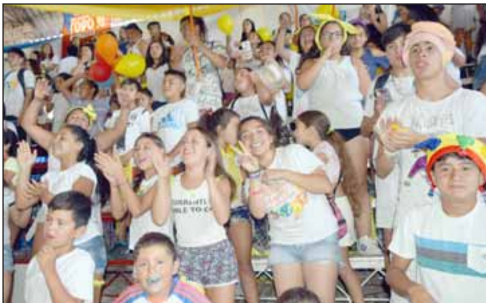
ALIANZAS EN DISPUTA.- Cada uno de los participantes apoyó a sus alianzas favoritas durante toda la jornada.