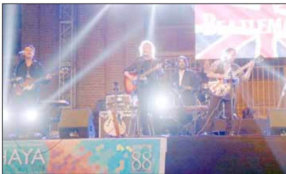
'Beatlemania' revivió toda la fuerza y calidad del cuarteto de Liverpool en el cierre de la jornada del domingo.