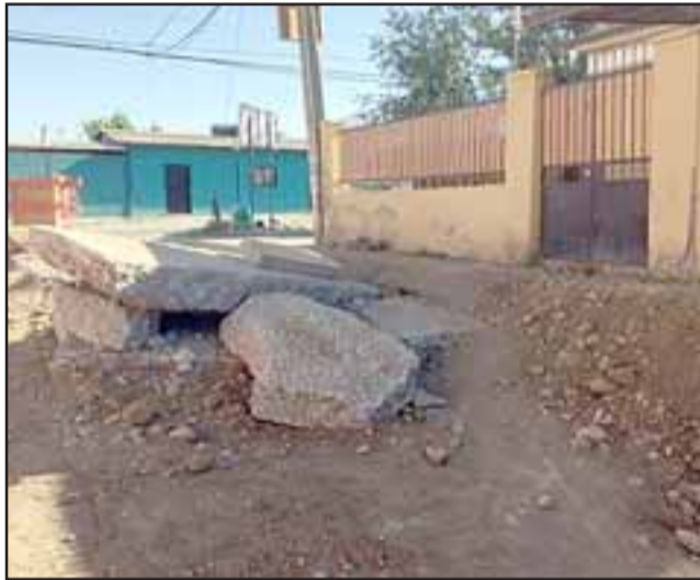
Los trabajos son parte del Programa de Pavimentos Participativos 26° llamado del Minvu.

vamos a mejorar, y que es un compromiso del Serviu y del alcalde con los vecinos, es poder mejorar y hacer menos dañino el trabajo de la empresa en este sector, y poder mejorar tanto los accesos peatonales como vehiculares mientras el contrato se está llevando a cabo», agregó Ríos.