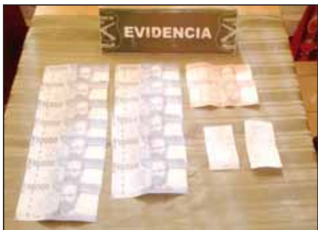
Carabineros incautó los billetes de $10.000 y $20.000 falsificados.

do la autenticidad de los billetes al momento de recibir pagos.