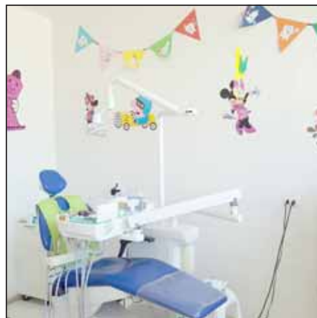
En una de las salas de la escuela Agustín Edwards se encuentra el box dental que atiende además a estudiantes de las escuelas básicas Herminia Ortega de Croxatto, Elisa Lattapiat, Héroes de Iquique, El Porvenir, Naciones Unidas, Las Palmas, Jorge Prieto Letelier.

Educación y promoción de la salud oral: enseñanza del cepillado, unidades educativas que incluyen, dieta cariogénica, hábitos de hi-