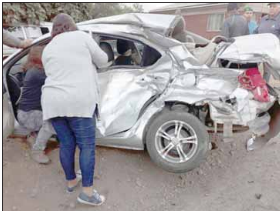
La conductora del móvil resultó milagrosamente a salvo mientras que el vehículo terminó con daños de consideración en su carrocería, tras el violento accidente ocurrido la mañana de ayer en la ruta E-71 en Putaendo.