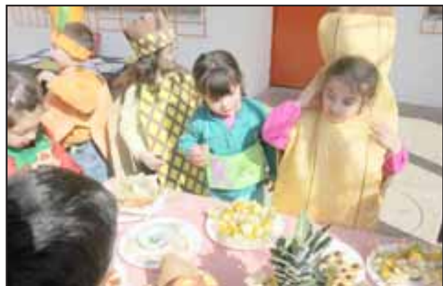
El consumo de agua, verduras y frutas de la estación, resulta fundamental para mantenerse hidratado durante estos días de calor intenso.