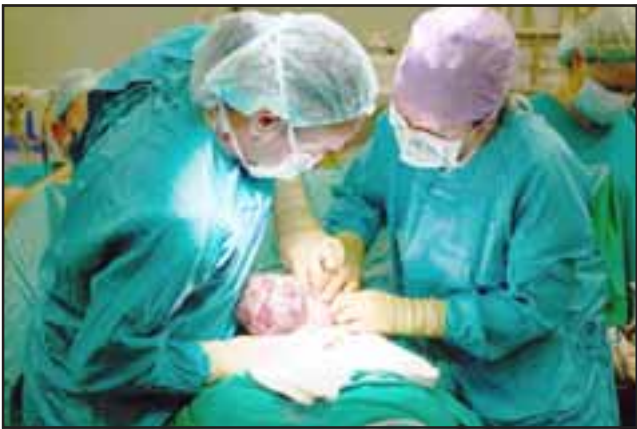
La joven mujer sufrió un paro cardiorrespiratorio durante la operación cesárea, falleciendo en pabellón, mientras su bebé se encuentra internado en el Servicio de Neonatología con pronóstico reservado.

produciéndose el fallecimiento. Gracias a los esfuerzos del equipo de salud se logra rescatar al recién nacido, quien se encuentra internado en el Servicio de Neonatología con pronóstico reservado. De acuerdo a la normativa vigente, el establecimiento se encuentra realizando el análisis de caso a través de una auditoría clínica por equipo del Hospital San Camilo y del Servi-