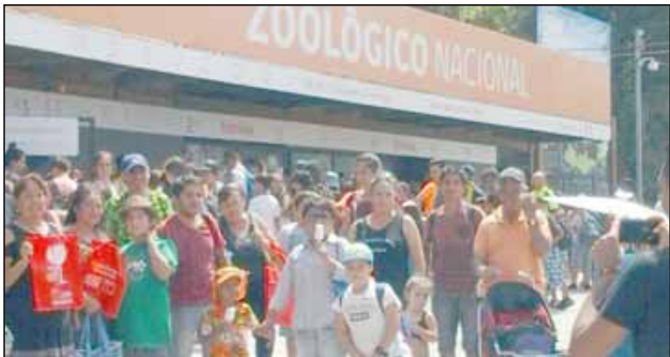
MÁS AVENTURAS.- Aquí los vemos minutos antes de ingresar al Zoológico Nacional, en Santiago.