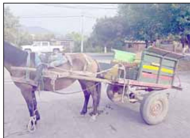
A bordo de esta carretela los detenidos escaparon luego de sustraer varias cajas de uva desde un predio agrícola en San Esteban.

Los antisociales quedaron sujetos a la medida cautelar de firma quincenal en el Ministerio Público durante los dos meses fijados de plazo para el cierre de la investigación.