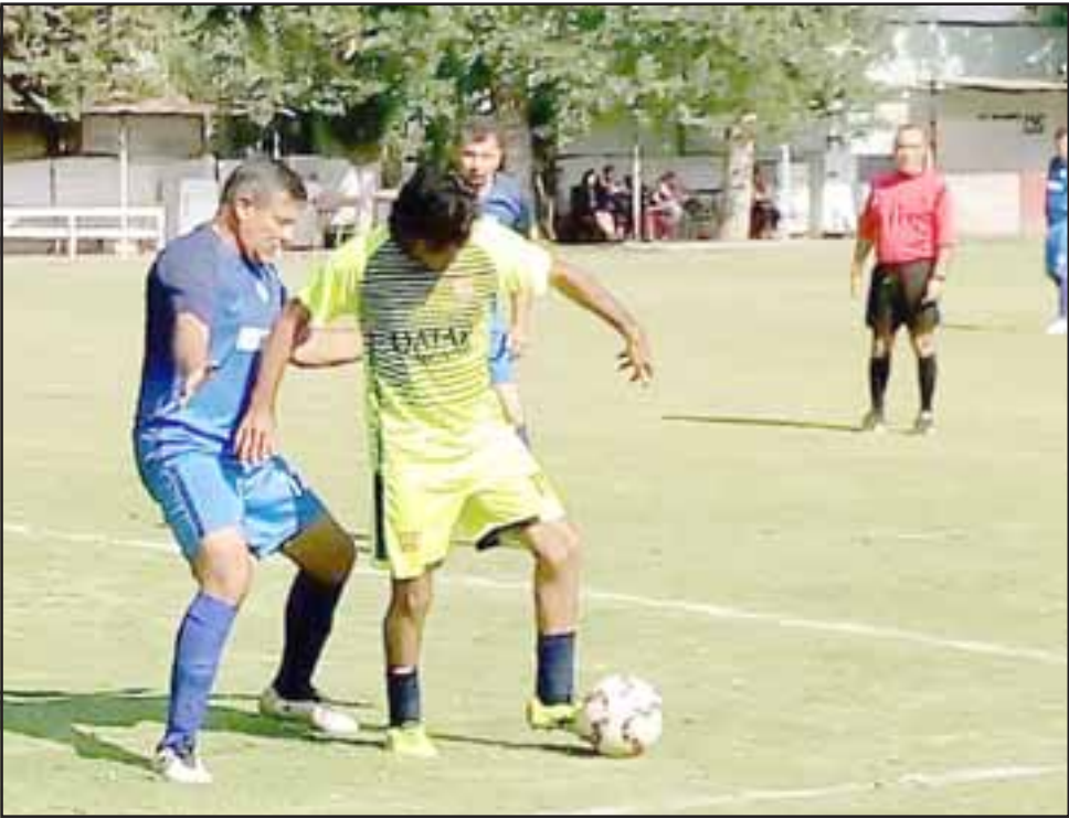
La competencia Súper Sénior de la Liga Vecinal ya tiene un dominador muy claro que parece ir directo al título.

abierta con el pleito entre Villa Argelia y un Tsunami que parece no resignarse a dejar la batalla por llegar a lo más alto de la tabla de posiciones. Programación 3ª fecha 2ª rueda Miércoles 14 de febrero 19:45 horas: Villa Argelia – Tsunami 20:45 horas: Villa Los Amigos – Carlos Barrera Viernes 16 de febrero 19:15 horas: Los del Valle – Santos 20:45 horas: Liga Vecinal – Barcelona 21:50 horas: Hernán Pérez Quijanes – Unión Esfuerzo Tabla de posiciones