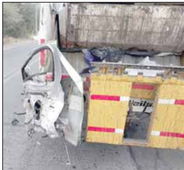
El vehículo menor impactó contra un camión recolector de basura detenido en la ruta.

A raíz de este violento impacto y por causas que se investigan, la conductora habría colisionado a un segundo camión que circulaba en sentido contrario, salvando milagrosamente con vida de este accidente, debiendo ser asistida por personal del Samu y Bomberos quienes concurrieron al lu-