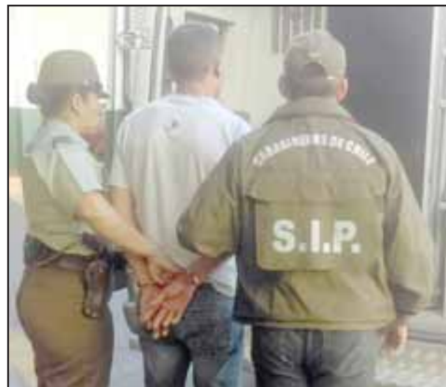
El imputado de 34 años de edad fue detenido por la SIP de Carabineros por falsificación de dinero y ocultación de identidad en pleno centro de San Felipe.

En este entendido, la policía uniformada efectuó un llamado a los locatarios a mantener las medidas de seguridad ante la ocurrencia de este hecho verifican-