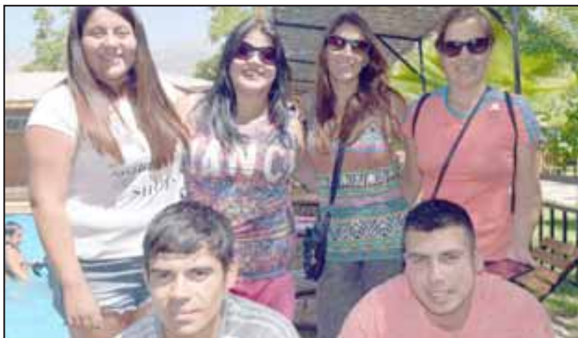
EQUIPO BACAN.- Ellos son parte del equipo adulto que durante todas estas semanas estuvieron dedicados a tiempo completo a estos niños.