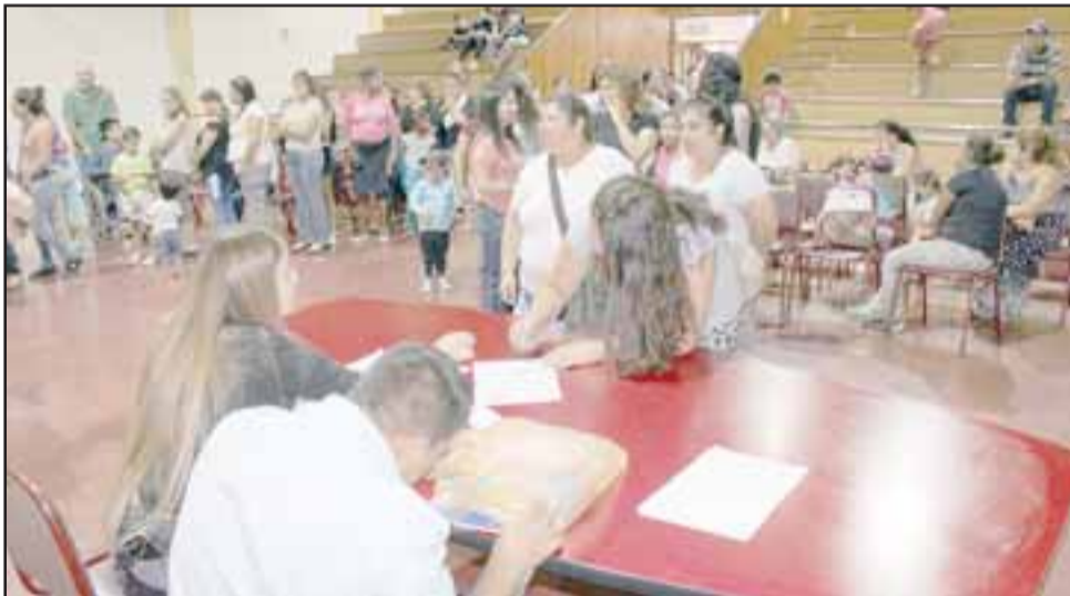
En esta oportunidad resultaron favorecidos 250 alumnos de la comuna, 100 de ellos de enseñanza media y el resto en escuelas básicas.

dimiento académico de cada una de las escuelas de la comuna de Panquehue.