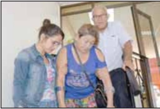
Una familia afectada por el rechazo de licencias