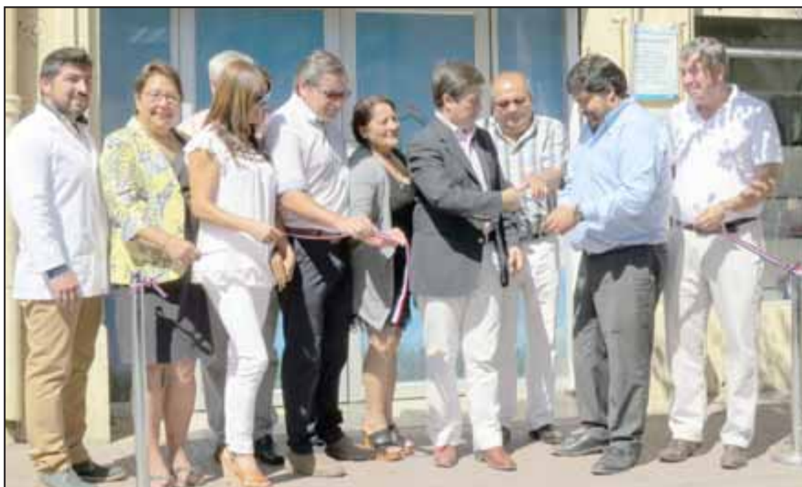
A partir de ayer comenzó a operar la farmacia comunitaria de Los Andes, la que se encuentra ubicada en Esmeralda 562.

Remarcó que los grandes beneficiados con esta farmacia popular serán los adultos mayores, ya que son ellos quienes más requieren de medicamentos y cuyos ingresos siempre son exi-