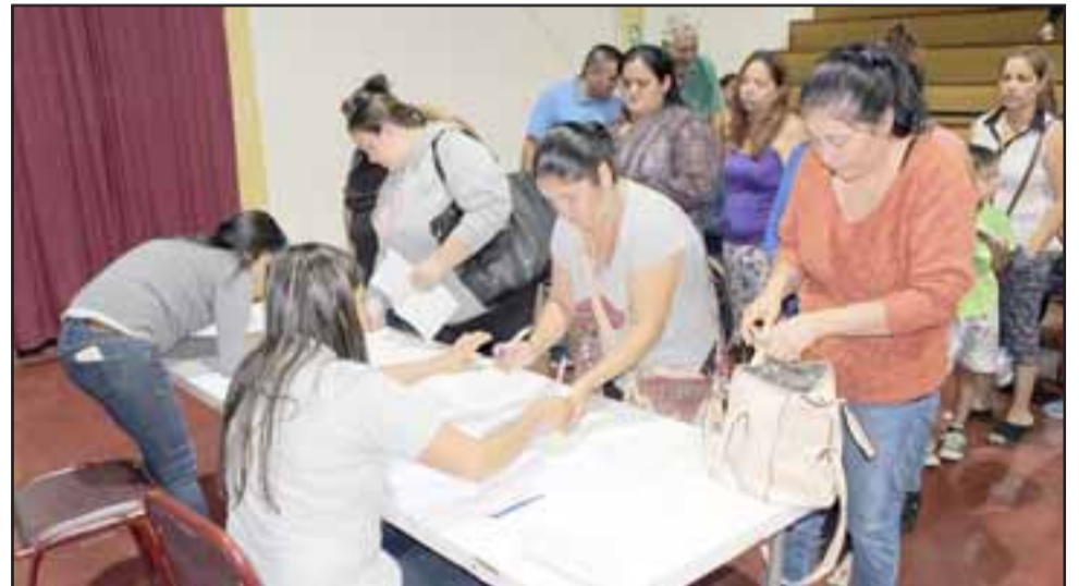
Las personas se acercan a la municipalidad a pedir ayuda donde son inscritos para ser considerados al momento de entregar estos set de útiles escolares.