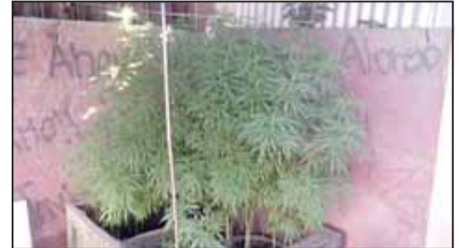
Carabineros efectuó la incautación de las plantas de marihuana desde el domicilio del sentenciado, siendo condenado a la pena de 541 días de cárcel por cultivo de cannabis sativa.

El entonces imputado fue enjuiciado en el Tribunal Oral en Lo Penal de San Felipe, siendo considerado culpable del delito de cultivo y cosecha de cannabis sativa sancionada en la Ley 20.000 de drogas.