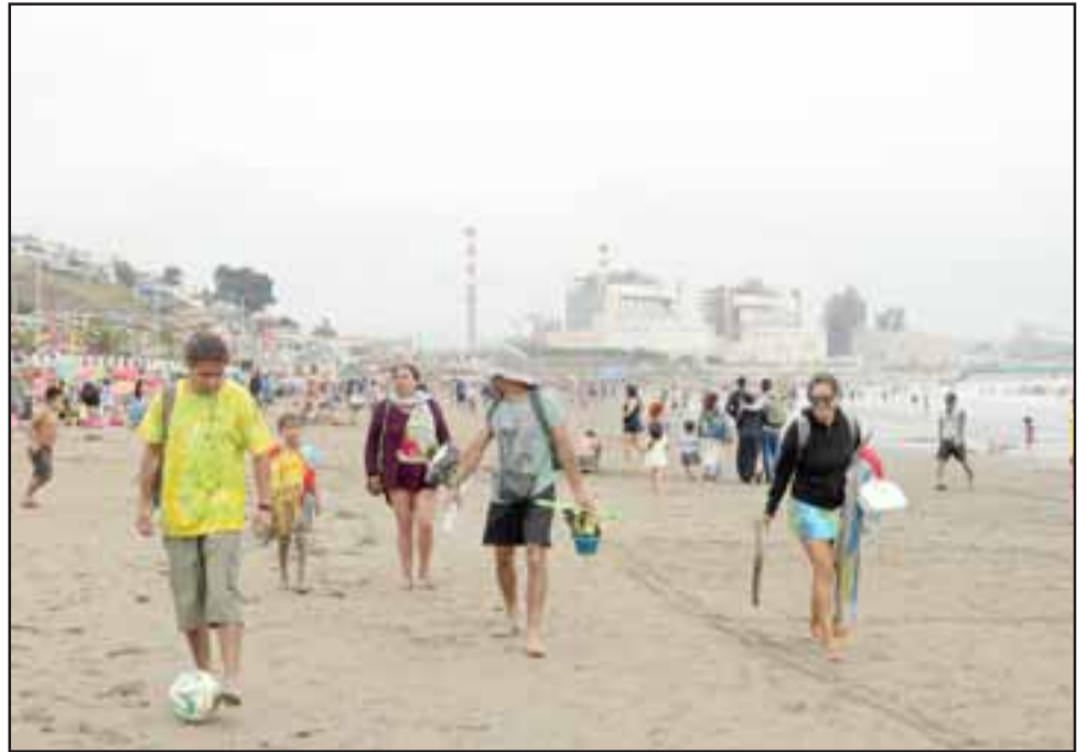
Los vecinos de Calle Larga pudieron disfrutar en forma gratuita de las bondades del clima costero en los balnearios de Los Vilos y Ventanas.

Además de los vecinos que disfrutaron del balneario de Ventanas, las agrupaciones de la comuna como Scout, Futa Repu y clubes de adultos mayores, entre otros, viajaron a Los Vilos, donde también disfrutaron de estas pequeñas vacaciones que entrega el municipio a sus habitantes.