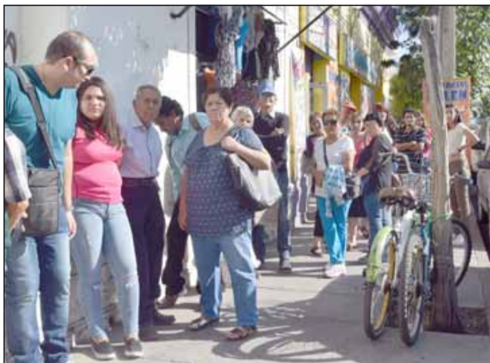
UNA LARGA ESPERA. - Cientos de pensionados de Caja Los Andes, en San Felipe, debieron esperar varias horas para poder cobrar sus pensiones en esa sucursal, luego que el camión de Valores no llegara a tiempo con el efectivo.

Diario El Trabajo habló con Asuntos Corporativos de Caja Los Andes, Santiago, desde donde se nos dio como respuesta lo