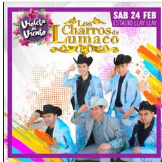
Todo el ritmo ranchero de 'Los Charros de Lumaco' cerraría la noche inaugural.