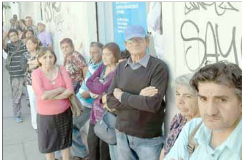
PROBLEMA CONOCIDO. - Hace algunos meses el problema se presentaba en Servipag, ahora pareciera que en esta sucursal de Caja Los Andes tendrán que mejorar la atención.