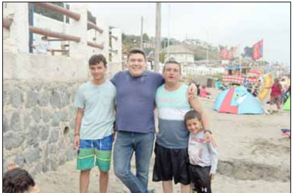
El alcalde Nelson Venegas compartió con los veraneantes quienes se han mostrado sumamente agradecidos con la iniciativa.