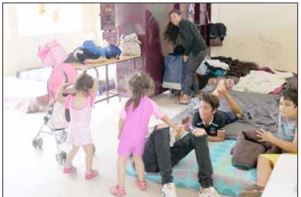
Más de mil 500 habitantes de la comuna fueron beneficiados este año con este programa, que les permitió disfrutar de un entretenido verano junto a sus familias y amigos, pagando la módica suma de 4 mil pesos por persona.