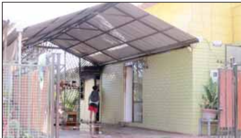
La emergencia se originó pasadas las 15 horas en una casa ubicada en el pasaje Pedro Corail, afectando inicialmente una ampliación del inmueble.

de Investigación de Incendios quienes deberán determinar el origen del fuego.