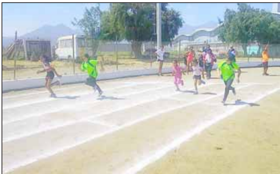
Competidores de todas las edades y categorías se reunieron en el torneo atlético realizado en Llay Llay.

"Se está entrenando mucho porque en los Nacionales habrá que demostrar el nivel que estamos alcanzando", expresó el directivo.