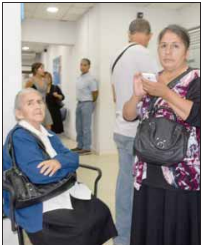
¿DIGNA VEJEZ? -Esta señora de la tercera edad pudo al menos disponer de una silla, mientras que los demás debieron estar al sol por mucho rato.

siguiente: «Informamos que el día martes 20 de febrero de 2018, producto de una situación de fuerza mayor ajena a nuestra institución, se produjo un retraso en el pago de pensiones de nuestros afiliados, debido a la demora en la llegada del camión de valores de un proveedor externo (Prosegur). Lamentamos los inconvenientes que este hecho provocado en nuestros afiliados pensionados, quienes acudieron a nuestra sucursal de la ciudad de San Felipe y pudieron cobrar su pensión de forma expedita, una vez solucionada la contingencia».