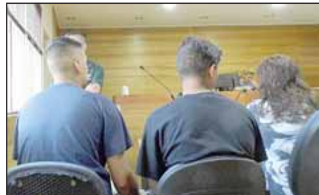
Ambos jóvenes detenidos no tenían antecedentes penales por lo cual accedieron a una suspensión condicional del procedimiento por el plazo de un año.

Además jóvenes causaron daños de consideración a la máquina de pasajeros.