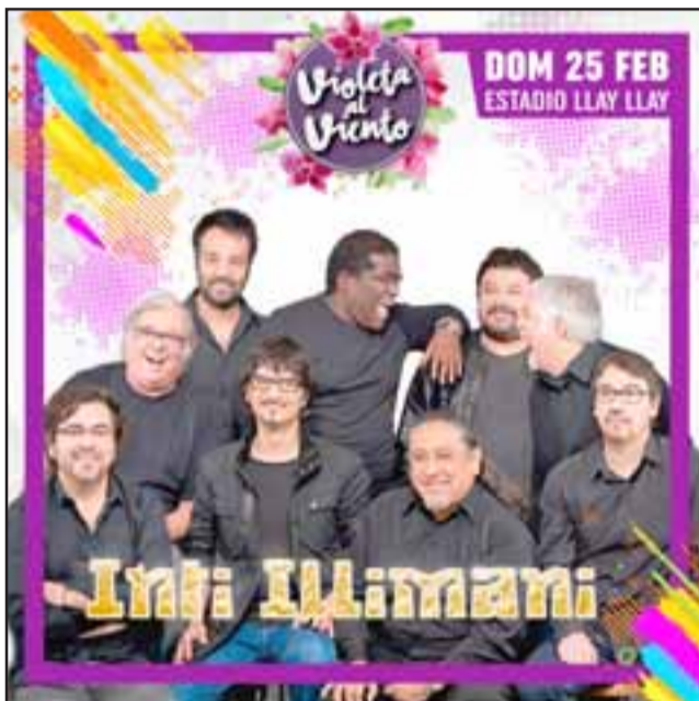
El folclor de 'Inti Illimani' se hará presente en la segunda noche, este domingo 25 de febrero.

Ambos días de fiesta las puertas del Estadio Municipal de Llay Llay abrirán a las 14:00 horas para recibir al público asistente, que desde temprano podrá disfrutar de una feria gastronómica y artesanal, además de entretenimientos y juegos para los más pequeños.