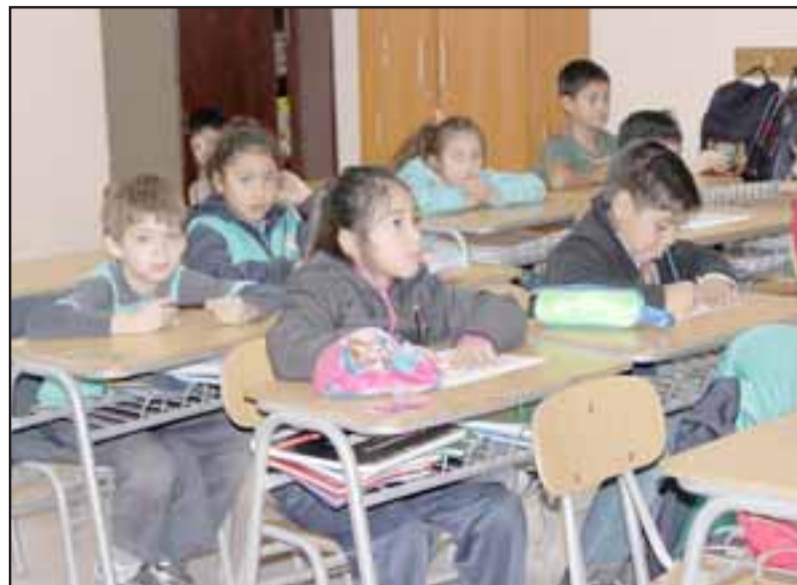
La ansiedad ante el inicio de un nuevo año escolar y la recuperación de hábitos y horarios complican el regreso a clases. (Foto archivo)

En el caso de haber algún cambio en la rutina diaria es muy importante anti-