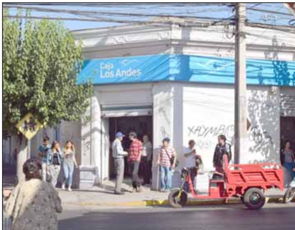
IMPUNTUALIDAD. - Caja Los Andes indicó que los responsables de este problema es la empresa que transporta el efectivo hacia esta sucursal.