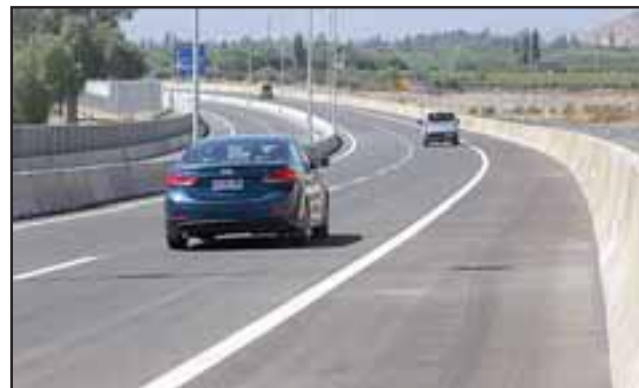
El tramo final de la nueva ruta 60 CH ya está operativo, aunque el valor del peaje, de $1.200 normal y $1.800 en horario punta en Panquehue, viene a elevar considerablemente el viaje a la costa para los aconcaguinos.

Algunas de las medidas de mitigación que se tomaron mientras se ejecutaban las faenas, incluyó la instalación de paneles acústicos y la humectación con agua