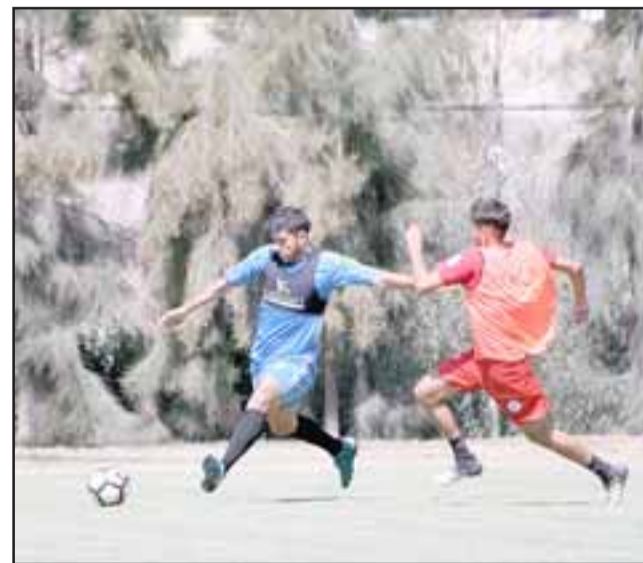
Unión San Felipe enfrentará el próximo domingo a Cobresal en El Salvador.