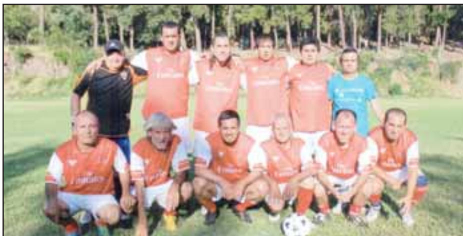
El conjunto Sénior del Aéreo entrega pinceladas de buen fútbol.

En sus continuas andanzas por las distintas canchas del todo el valle de Aconcagua, nuestro amigo y colaborador, Roberto 'Fotógrafo Vacuna' Valdivia llegó con su equipo fotográfico para dejar para la posteridad dos impecables imágenes de los equipos de Honor y Sénior del Aéreo, que ahora compartimos con nuestros lectores.