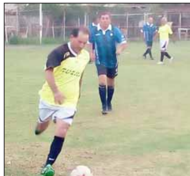
Muy atractiva es la fecha que se viene este domingo en la Liga Vecinal.