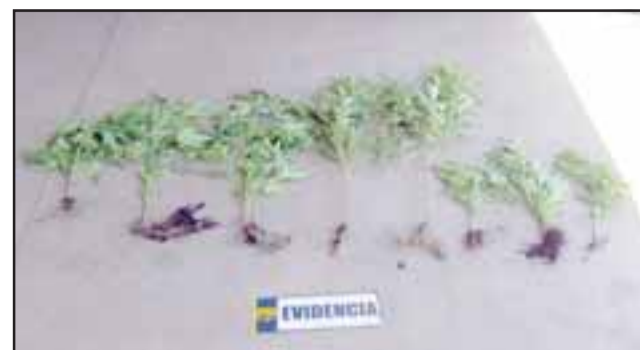
Personal de la Bicrim de la PDI de San Felipe incautó ocho plantas de cannabis sativa en maceteros desde el interior de una camioneta conducida por una mujer de 32 años de edad.

No obstante por disposición del Fiscal de turno, la detenida identificada con las iniciales F.V.S.P. de 31 años de edad, sin antecedentes policiales, fue dejada en libertad quedando a la espera de ser citada por