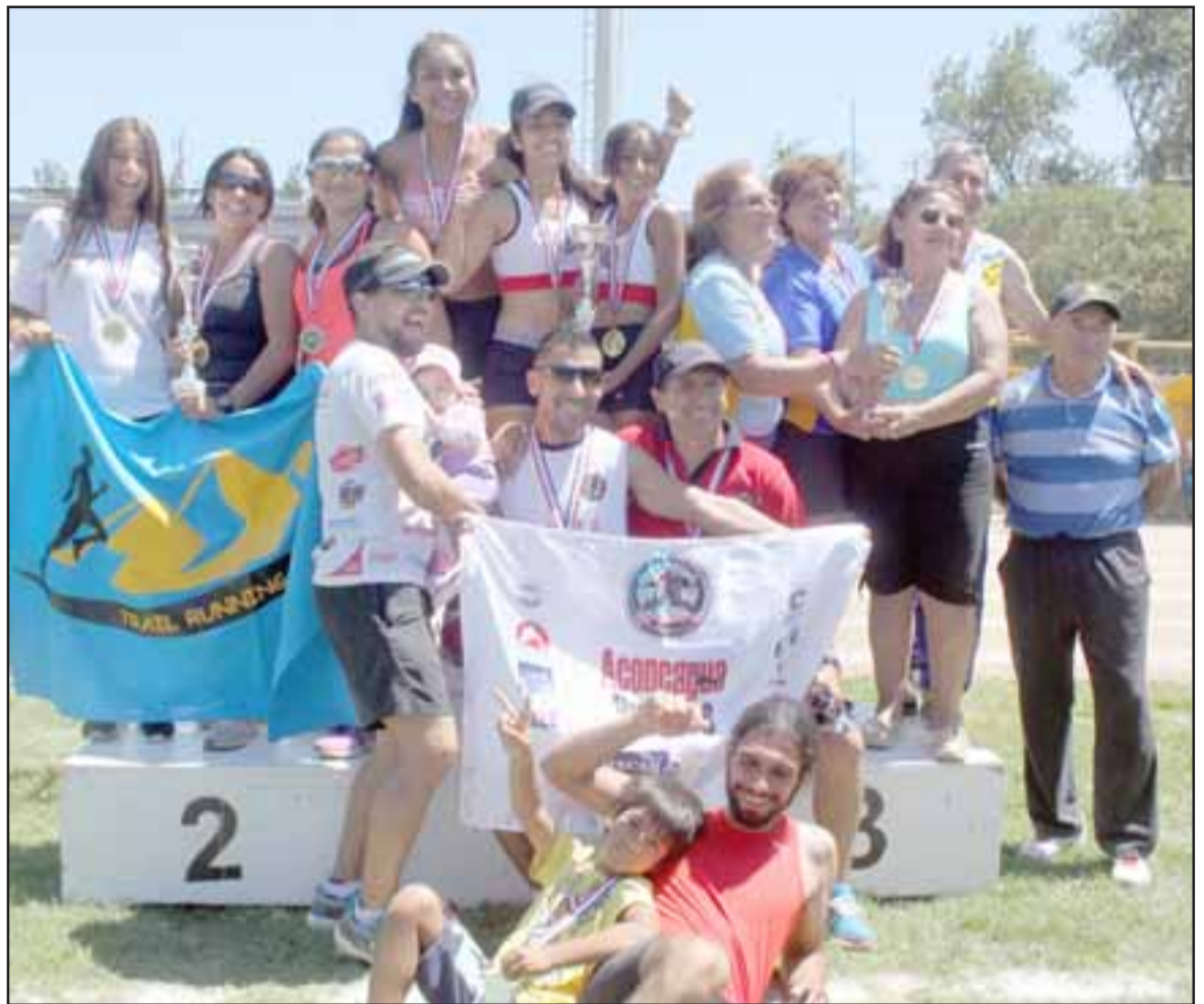
IMPARABLES.- Ellos son sólo parte del gran conglomerado de atletas de nuestro valle, quienes dan fuerza y vigor al atletismo de Aconcagua Runners.