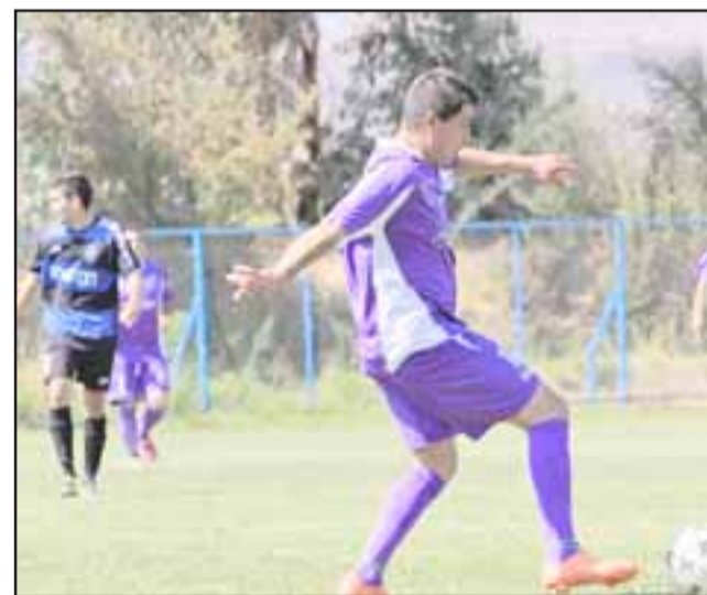
El domingo comenzarán las ruedas de revanchas en los torneos Amor a la Camiseta y Afava.

Alcides Vargas – Valle Alegre; Cordillera – Boca Juniors; Lautaro – Alborada; Lo Vicuña – Patagual; Brille el Nombre – René Schneider; Estrella – Húsares; Dos Amigos – El Higueral; Pentzke – Las Cadenas; San Carlos – Los Acacios; El Sauce – Comercio; Santa Isabel – Santa Clara; Ambrosio O'Higgins – Victoria Morande; Cordillera de San Esteban – Torino; La Capilla – América; Alto Aconcagua – Santa Rosa; Foncea – Alianza; Juventud Pobladores – Arturo Prat; Juventud