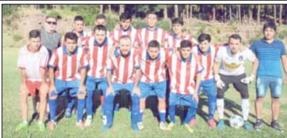
Este es el equipo estelar del club Aéreo de San Rafael.