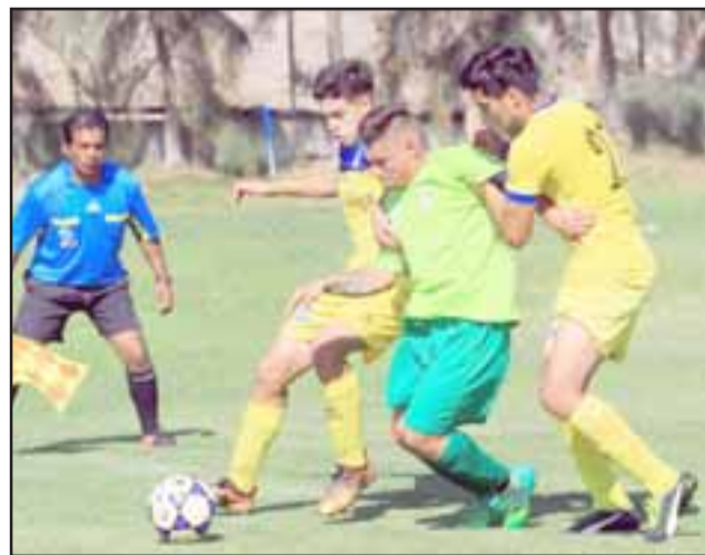
A mitad de semana los equipos cadetes de Unión San Felipe sostuvieron sendos encuentros amistosos con sus similares de San Luis.