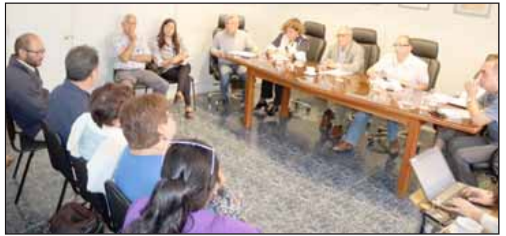
Pese a los retrasos y a las observaciones técnicas realizadas a la nueva empresa contratista por el Serviu y la Dirección de Obras Municipales, existiría una alta probabilidad que las casas sean entregadas antes que termine el mes de marzo.

“Como Municipio y Concejo Municipal hemos trabajado con mucho ímpetu por esta población. Recordemos que, junto a nues-