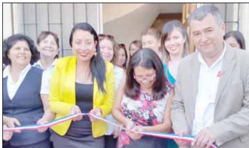
Las nuevas dependencias permitirán descentralizar el trabajo de asesoría y atención de los usuarios de las provincias de San Felipe y Los Andes.

dos para recibir a las comunidades educativas que se desplazan desde diversas comunas. Hasta el mes pasado, la oficina territorial estaba ubicada en la Gobernación y pese a que había muy buena recepción de parte de las autoridades provinciales, los espacios se hicieron muy