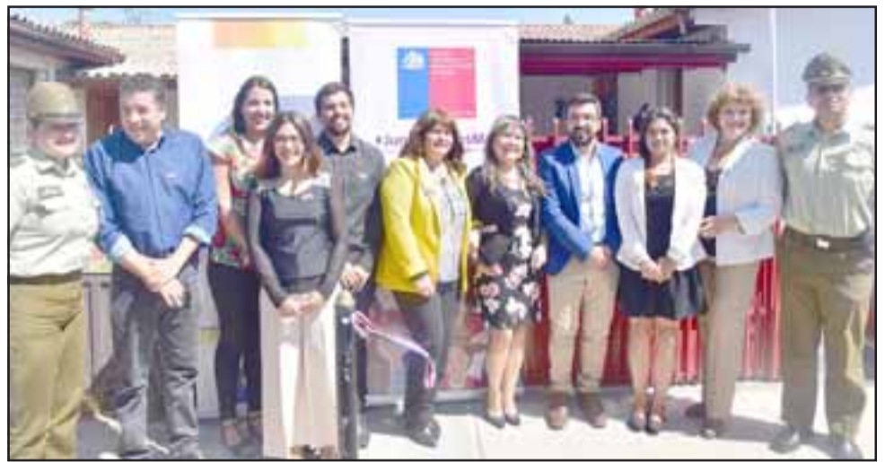
Ubicado en Calle Tehualda N°55, el centro ofrecerá atención gratuita y será atendido por profesionales de las áreas Social, Salud mental y Legal. En la foto, las autoridades al momento de la inauguración.

El Centro de la Mujer de Llay Llay se encuentra ubicado en Calle Tegualda N°55,