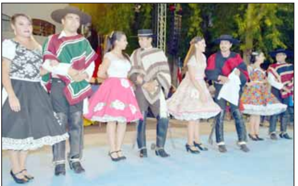
LOS PROTAGONISTAS.- Aquí tenemos a las cuatro parejas participantes en este campeonato, de las que tres van al Regional que se realizará en nuestra comuna el próximo 5 de mayo.