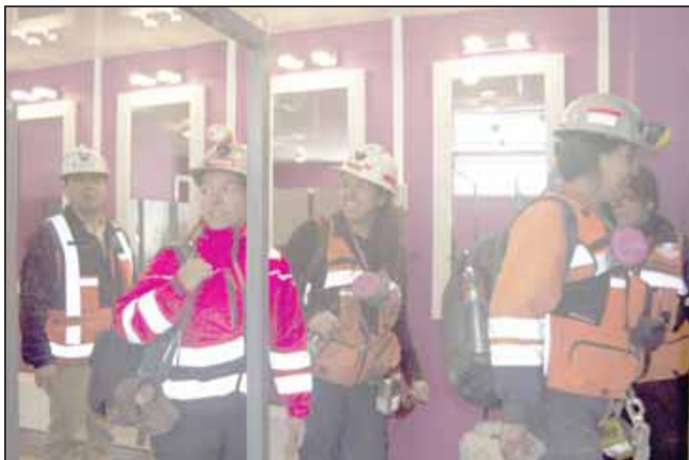
El espacio de 170 m2 entregará mejores condiciones de habitabilidad para las trabajadoras durante los encierros.

agradecemos, porque podremos trabajar mucho más cómodas. Es una muestra de integración, un avance donde estamos presente”.