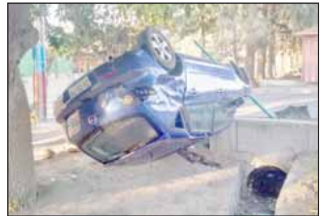
El conductor de 36 años de edad protagonizó el volcamiento de su vehículo en el sector La Pirca de Panquehue ayer domingo, tras encontrarse en estado de ebriedad.