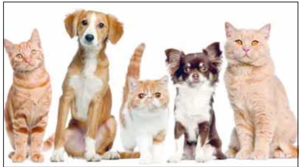
Desde este viernes 9 de marzo comenzó a regir el Registro de mascotas, de acuerdo a lo estipulado en la Ley Cholito.

Ningún animal se podrá registrar si no tiene instalado su microchip, porque es el sistema permanente de identificación. Las municipalidades, Autoridad Sanitaria y Carabineros, serán los encargados de fiscalizar el cumplimiento de la pre-