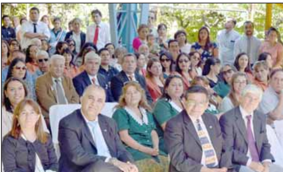
Autoridades aconcgüinas dieron su respaldo a la Daem con su presencia, apoyando el proceso lectivo en esa comuna.

Un grupo musical del Liceo Darío Salas y un pie de cueca dieron por finalizado la inauguración del año escolar.