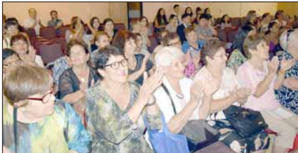
SIEMPRE BELLAS.- Mujeres aconcagüinas de todas las edades aceptaron con alegría el homenaje que en su honor desarrolló el Municipio en el teatro municipal.