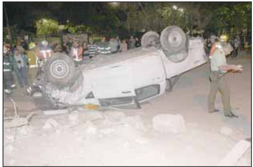
Conductor del móvil resultó con lesiones leves y Carabineros confirmó que estaba al menos bajo los efectos del alcohol.

Según informó Carabineros, el chofer de la camioneta se encontraba a lo menos bajo los efectos del alcohol, no obstante, ello deberá ser determinado por el examen de alcoholemia. Por disposición del Fiscal de Turno el chofer quedó en libertad a la espera de ser citado a declarar. Este accidente pudo haber tenido peores consecuencias, ya que a esa hora había mucha gente circulando en el parque.