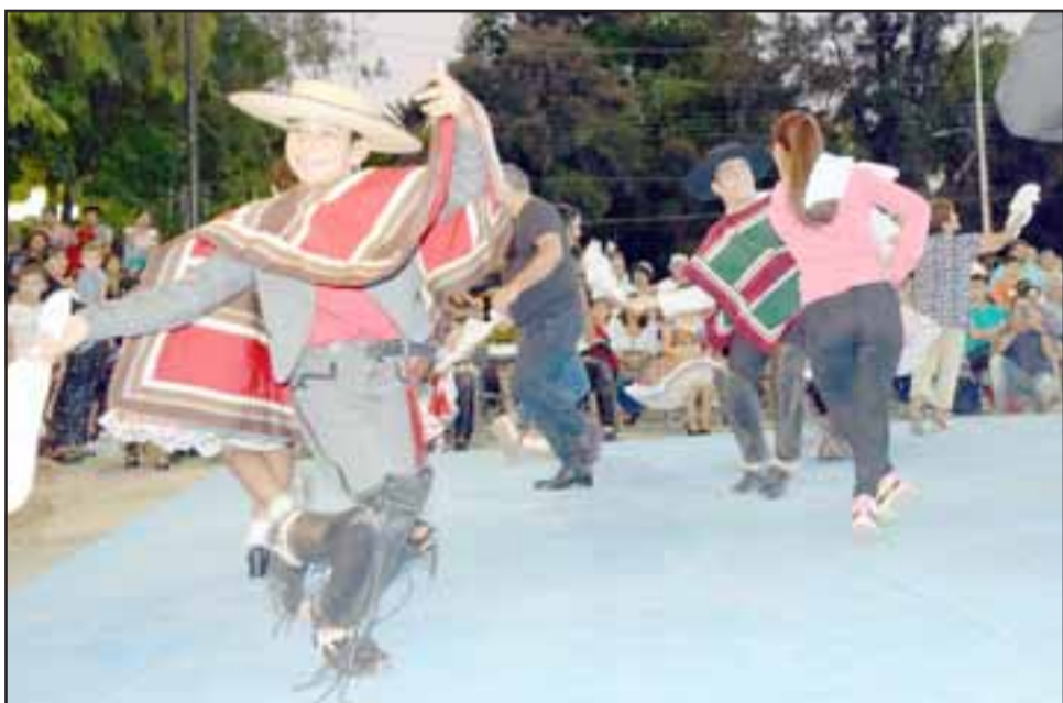
CUECA PARA TODOS.- El público también tuvo la oportunidad de disfrutar de nuestro Baile Nacional.