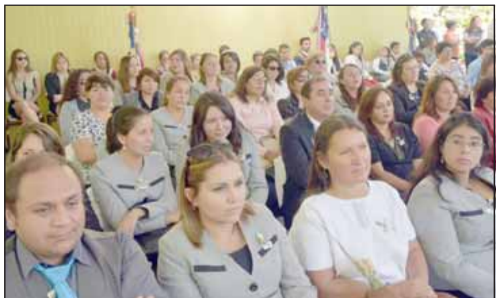
Profesores de la comuna asistieron al acto de inauguración, pues ellos son quienes llevan la responsabilidad en este proceso.