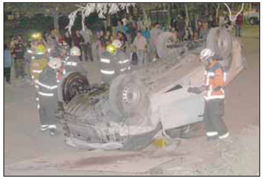
El chofer de la camioneta se encontraba a lo menos bajo los efectos del alcohol, no obstante, ello deberá ser determinado por el examen de alcoholemia.