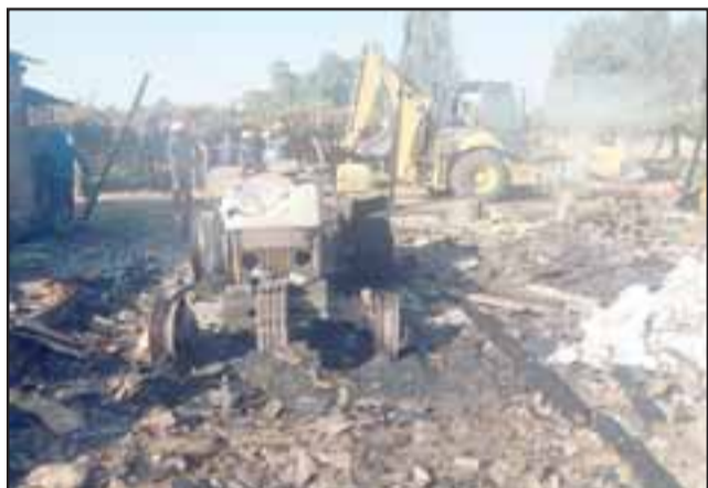
Las labores de Bomberos se extendieron hasta el mediodía del viernes.

Personal de Bomberos de tres unidades de Santa María, Los Andes y San Esteban, extendieron sus labores por cerca de seis horas para evitar la propagación y rebrote del fuego durante la madrugada de este viernes en el sector El Pino.