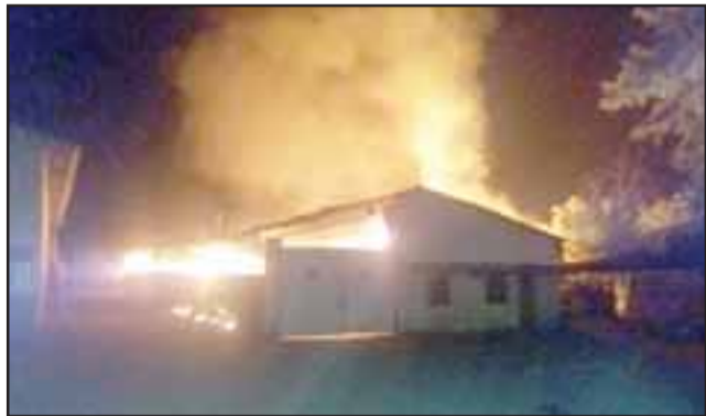
El fuego se desató cerca de las 05:45 horas de este viernes, afectado a una empresa de cartones en el sector El Pino de Santa María.