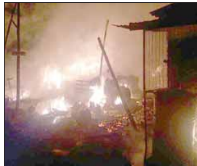
Alrededor de 40 voluntarios de Bomberos trabajaron para el lograr reducir en su totalidad las llamas.

“Las pérdidas totales, maquinarias, estructuras, el Departamento Técnico de Bomberos, ellos son los que determinan las causas del