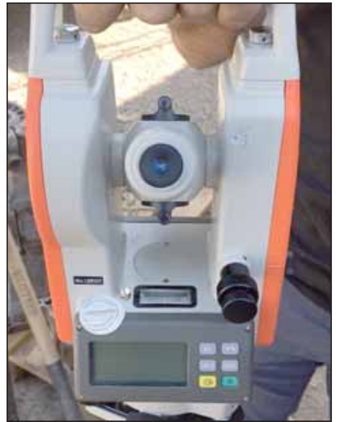
En una bodega de Calle Larga estaban guardados 14 medidores topográficos que serían comercializados a un precio mucho más bajo que en el mercado.

El representante se mostró agradecido del trabajo desarrollado por la PDI y espera que pueda concretarse la recuperación del resto de los equipos, subrayando que el monto total de lo robado supera los 100 millones de pesos.