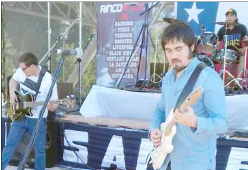
COCODRILO.- Agrupación musical de afilados dientes, ellos son la banda reptiliana que se las trae para este sábado en Avenida Chacabuco.

AGRESIÓN SÓNICA.- Aquí tenemos a los referentes locales del Rock más conocidos de Aconcagua.