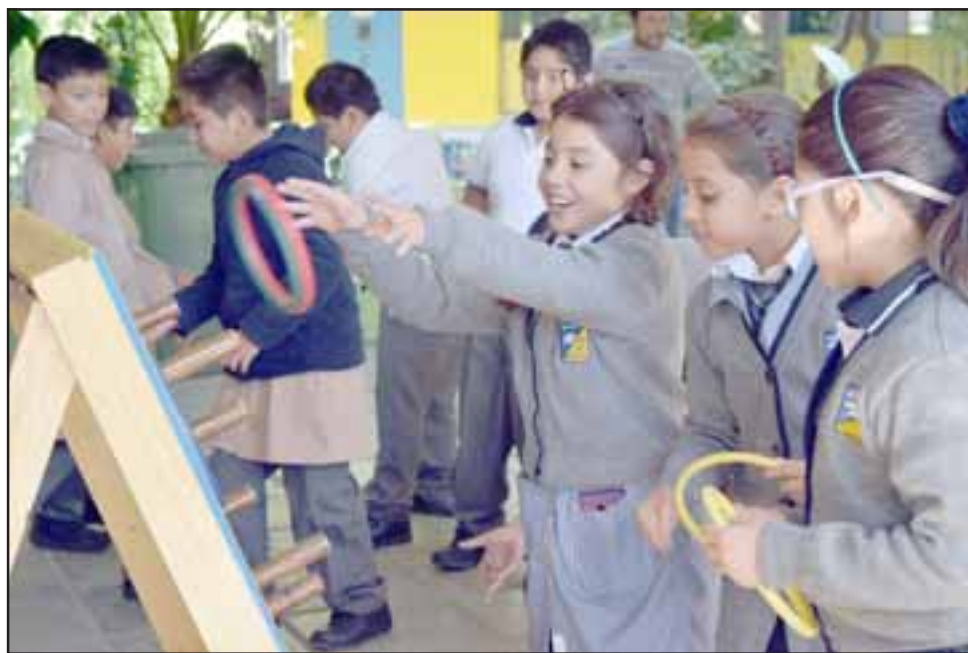
JUEGOS MENTALES. - En cada recreo escolar cientos de alumnos de la Escuela José de San Martín prefieren jugar a desarrollar su destreza mental y sensorial con la nueva ludoteca.

Diario El Trabajo también habló con varios estudiantes, quienes ya están enganchados con estos positivos juegos de madera.