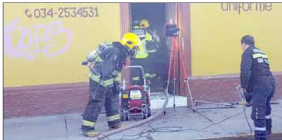
Personal de Bomberos controló el amago de incendio en el local 'Casa Rossy' en calle Merced N° 701 en San Felipe.