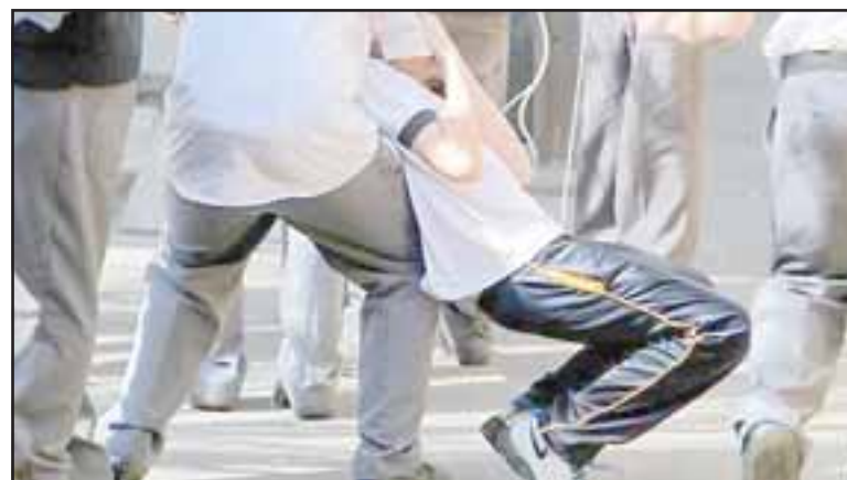
El violento enfrentamiento ocurrió al interior del liceo Darío Salas de Santa María durante la mañana de ayer lunes. (Foto Referencial).

El afectado debió ser trasladado hasta el Instituto de Seguridad del Trabajo de San Felipe, siendo diagnosticado con doble fractura en su brazo de carácter grave. Asimismo la Subdirectora del esta-