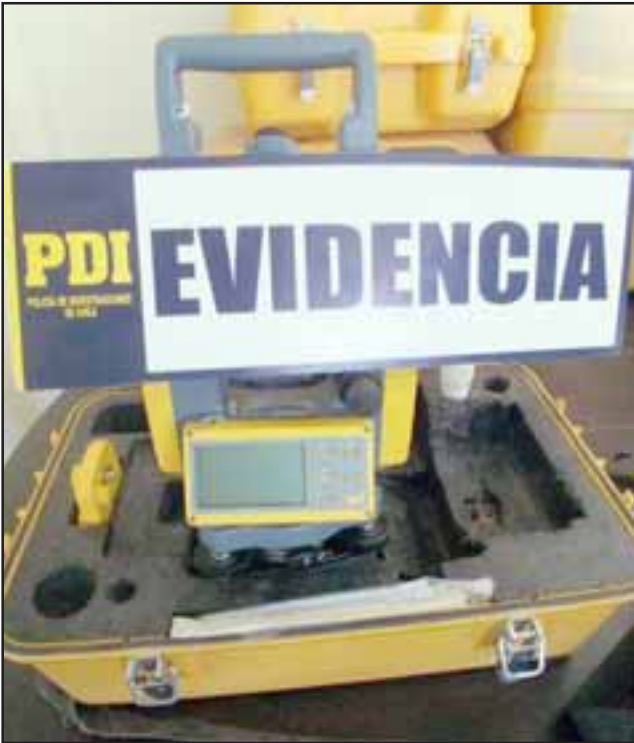
Cotejados los números de serie de los equipos se pudo determinar que pertenecían a una empresa del rubro ubicada en la comuna de Ñuñoa y que habían sido denunciados por robo el año pasado.