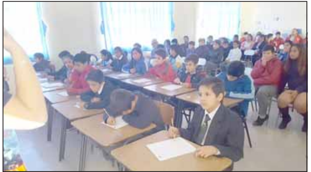
Las escuelas John Kennedy, El Sauce, Gabriela Mistral, Río Blanco, Ignacio Carrera Pinto y España de Los Andes recibieron la Subvención Nacional por Desempeño de Excelencia (SNED) para el período 2018 – 2019.

No serán pocos los retos que traerá este año escolar 2018, pero no debe haber duda que elementos como la determinación y el empuje lograrán el cumplimiento de las distintas metas que la excelencia académica exige de los docentes y estudiantes de la red de establecimientos Daem de Los Andes.