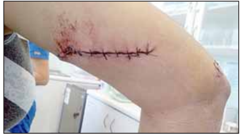
Este es el corte que le provocó el sujeto a la joven profesional que caminaba tranquilamente por la vía pública a las 9,30 de la mañana.

pondiente en Carabineros, "pero no sabemos más allá porque Carabineros puede buscarlo y después lo sueltan, eso es lo más terrible y nadie le va a recuperar su momento de pánico que tuvo ella, además que no creo que alguien aporte algún dato o información sobre el agresor, nosotros estamos aportando para las malas cosas, no para las buenas, para que se pare esto y San Felipe sea una ciudad tranquila", fi-