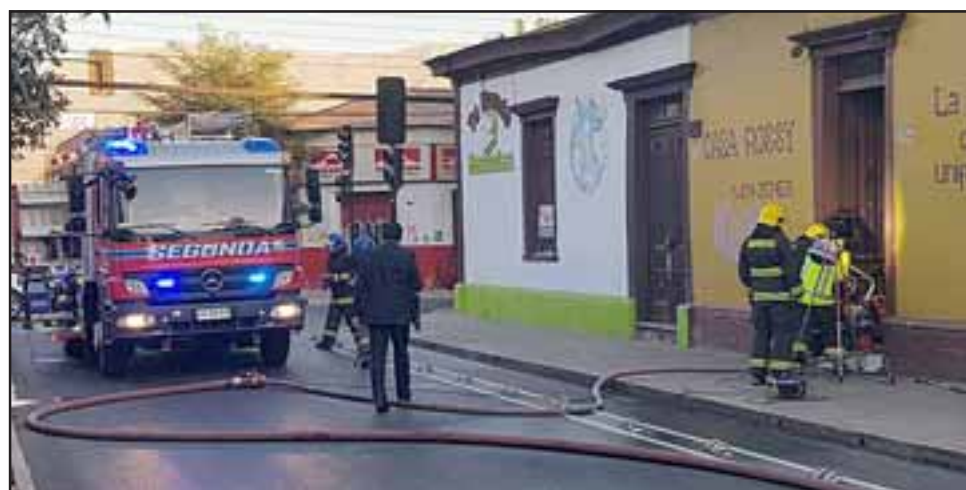
La emergencia ocurrió a primera horas de ayer lunes, provocando un gran taco vehicular por la hora en que ocurrió.