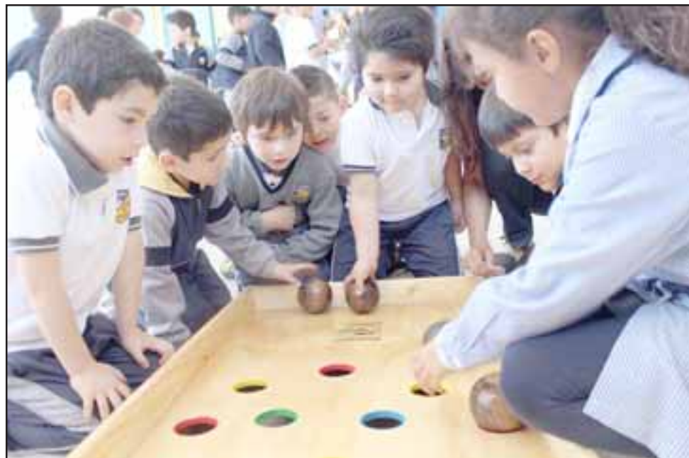
NUEVOS PARADIGMAS. - Aquí están estos niños, abriéndose paso en su mundo escolar, pues aprender no tiene por qué ser aburrido.