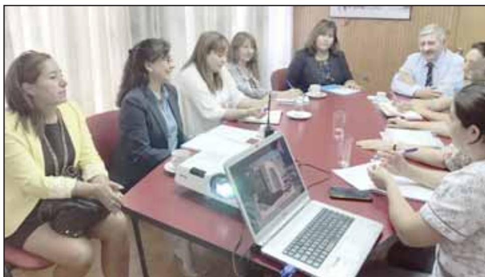
Durante los últimos meses, los equipos de las direcciones de Educación y Salud Municipal han sostenido varias reuniones de trabajo, con el objetivo de poner en marcha la iniciativa.

La ejecución de este tipo de iniciativas nace del trabajo en conjunto realizado por estas direcciones con el alcalde Patricio Freire, en beneficio de los vecinos de la comuna de San Felipe, y en este caso se comenzará a ejecutar desde el mes de abril.