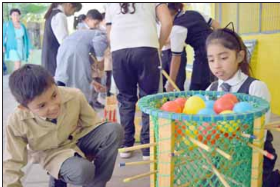
NO MÁS CORRER. - Mientras ellos se divierten, también aprenden, esos son parte de los objetivos de cada juego de madera disponible para estos pequeñines.