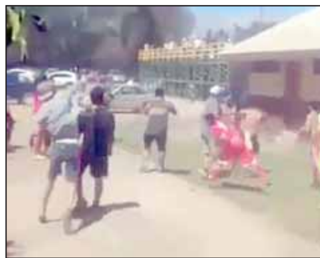
En la secuencia gráfica se puede apreciar los incidentes muy graves se produjeron en el partido por la Copa de Campeones entre los clubes Las Bandurrias y 28 de Marzo.