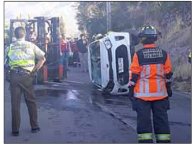
Personal de Carabineros que llegó en primera instancia al lugar, ayudó a salir al chofer, quien resultó ileso.

Una vez llevado a comparecer al tribunal, el fiscal lo requirió en procedimiento simplificado por el delito de Manejo en estado de ebriedad con resultado de daños, y negarse a realizarse el examen de alcoholemia. En caso de aceptar responsabilidad, el sujeto arriesga una multa de dos Unidades Tributarias Mensuales y la suspensión de la licencia de conducir por dos años. Es por ello que el tribunal fijó una nueva fecha para la realización del procedimiento.