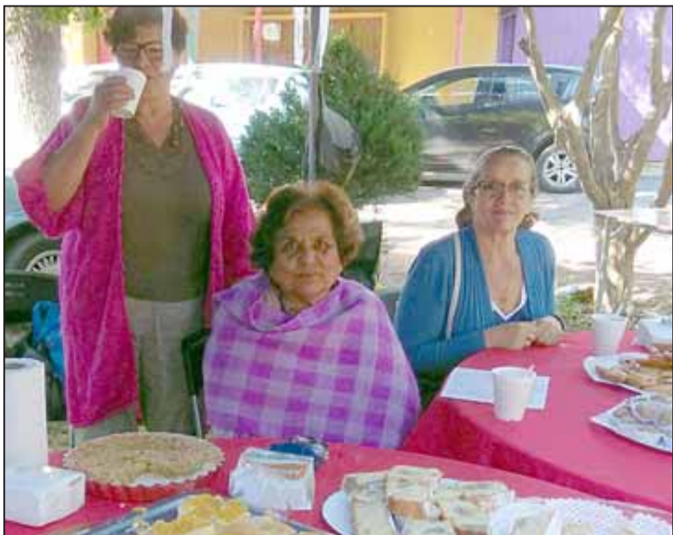
DELICIOSOS BOCADILLOS.- El buen sabor es lo que más atrajo a los visitantes y participantes de los mismos talleres, una estupenda oportunidad para inscribirse en Ayecán.

Durante todo el año estaremos compartiendo con nuestros lectores el acontecer más importantes sobre los protagonistas de esta importante travesía que emprenderán en pocos días. Roberto González Short