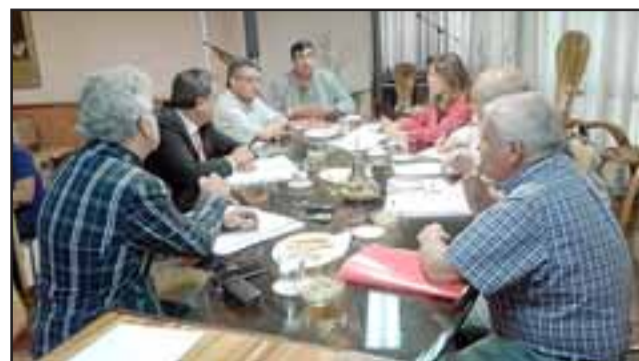
En la última sesión del concejo municipal de San Felipe se sostuvo derechamente que el comercio ilegal en la Feria Diego de Almagro está desbordado.

registro social de hogares, porque hoy en día tenemos una feria completamente desbordada, tenemos a los vecinos sumamente preocupados que se sienten invadidos, que no pueden salir