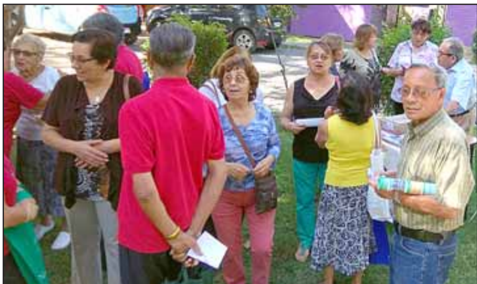
LA FIESTA MAYOR.- Hubo charlas, exposición de las dinámicas de trabajo que en Ayecán se desarrollan y muchas muestras de comida y telares, entre otras llamativas propuestas.

ciudad, y eso significa que nuestros adultos mayores puedan participar en estos talleres, convivir entre ellos y así apoyarse mutuamente, porque eso es lo que estamos haciendo, atendiendo a la comunidad, ha sido un éxito extraordinario. En ellos están aprendiendo oficios y nuevas maneras de aprovechar su tiempo libre de manera saludable e integral», dijo Silva a Diario El Trabajo .