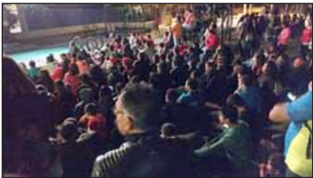
HIPNOTIZADOS.- Cientos asistieron a la Plaza Cívica para deleitarse con el capítulo 130 de Dragon Ball Súper.

puesta y el sábado 24 las sabrán los lectores de Diario El Trabajo», dijo a nuestro medio el organizador.