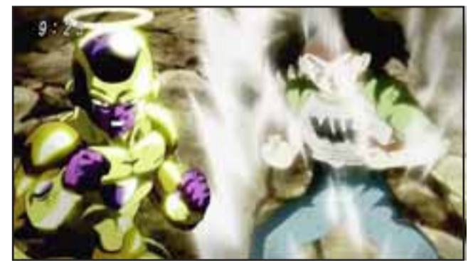
EN ESPERA.- Esta es una de las escenas finales: Golden Freezer y C17 reaparecen para enfrentar a Jiren.