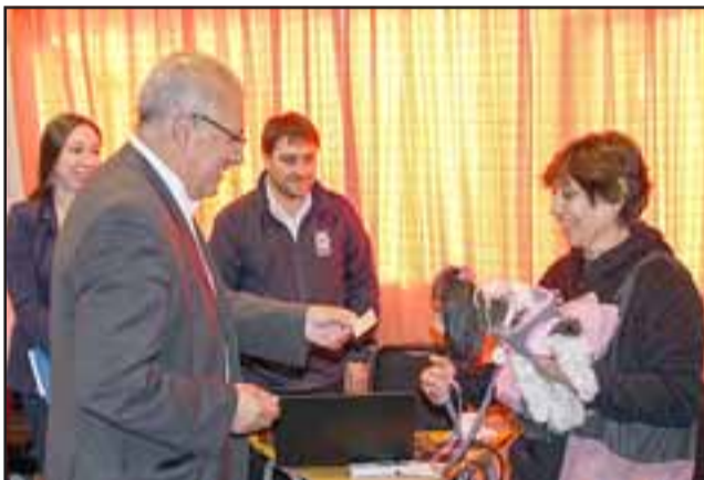
'Luna', perrita Shih Tzu de un año y 9 meses de vida, se convirtió en la primera mascota inscrita en el Registro Nacional de Animales de Compañía en Putaendo.

y animales de compañía. Con esta medida se pretende aumentar las probabilidades de encontrar a animales perdidos y/o a sus amos responsables. He aquí el llamado del Municipio de Putaendo a informarse y realizar todas las consultas en las dependencias de la Dideco, ubicada en Calle San Martín 733, o al teléfono 34-2431562.