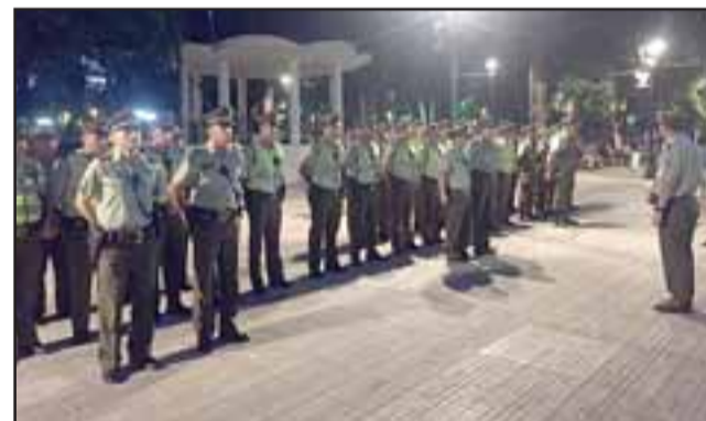
En la plaza de Armas de San Felipe, Carabineros inició la ronda nocturna extraordinaria para aumentar la sensación de seguridad en la ciudadanía.

Asimismo Carabineros efectuó fiscalizaciones a 17 locales comerciales y 17