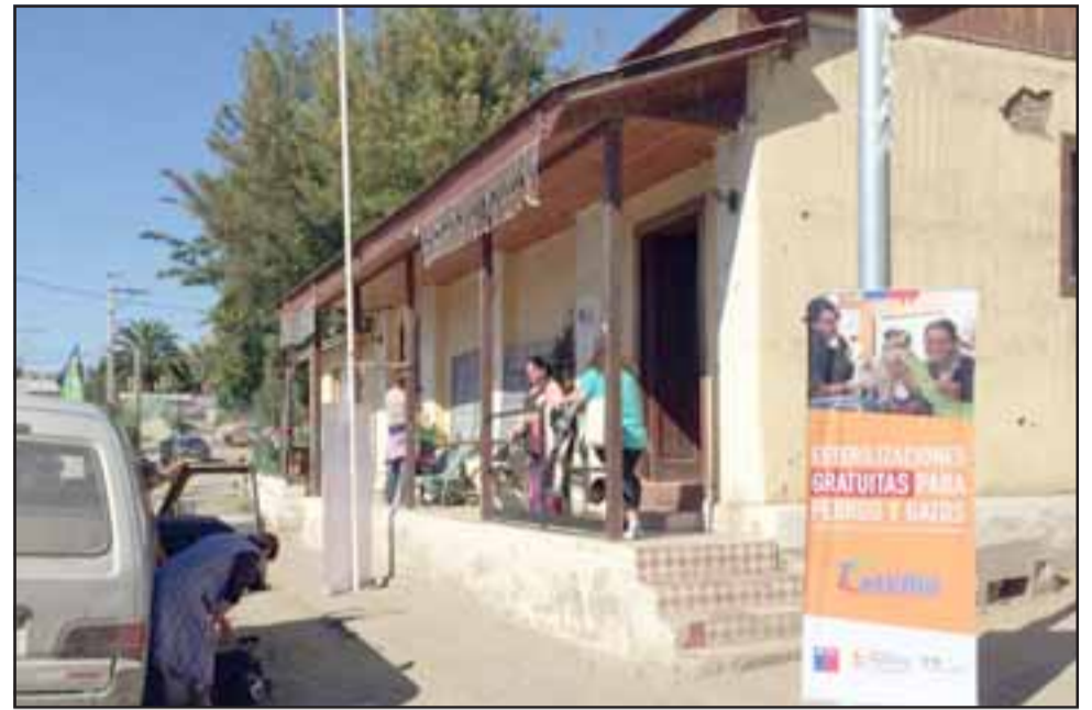
Este año la Municipalidad continuará con los operativos de esterilización, durante el mes de abril se realizarán 500 esterilizaciones con instalación de microchip, totalmente gratis, en el centro de la comuna.

Para las personas que operaron durante 2016 y 2017 a sus mascotas a través de los operativos municipales, pueden acercarse a consultar a la Oficina de Medio Ambiente por el número de chip instalado a su