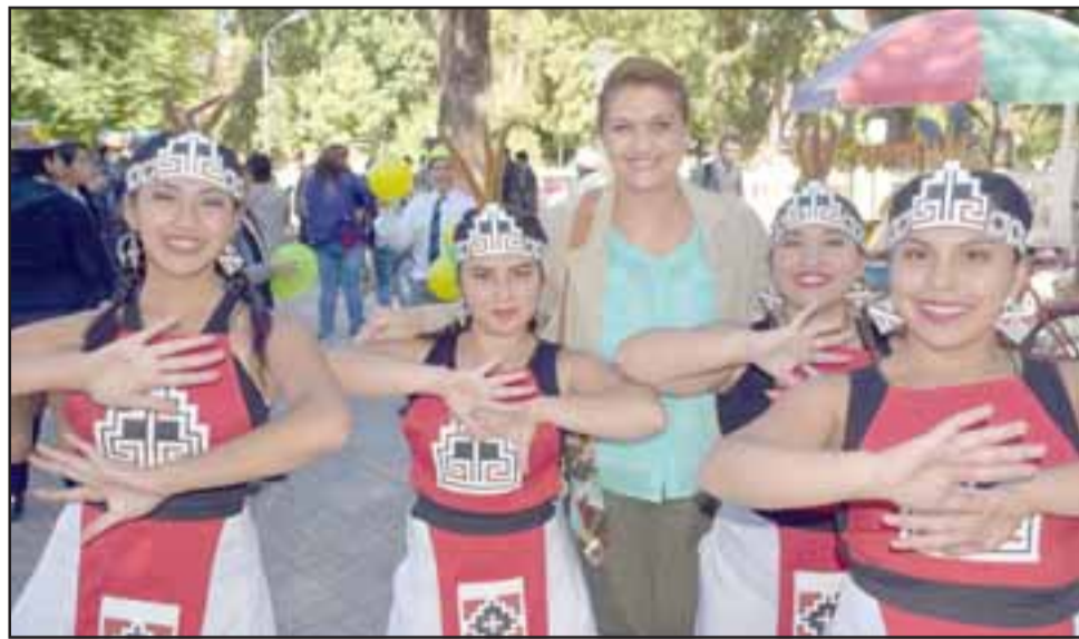
FOLKLORE Y BELLEZA.- Las Diaguitas, estas chicas pertenecen a Pasión Industrialina, de la Escuela Industrial de San Felipe.