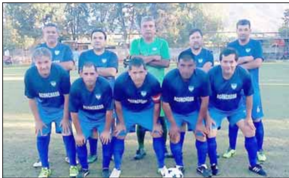
Aconcagua está librando la pelea grande en el torneo estelar de la Liga Vecinal.