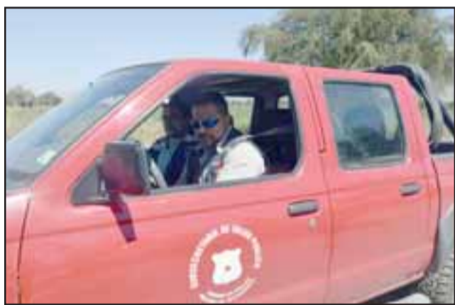
SIN AVISAR.- Funcionarios de la Seremi de Salud están investigando este caso, pues el químico fue aplicado sin dar aviso al director de la escuela.