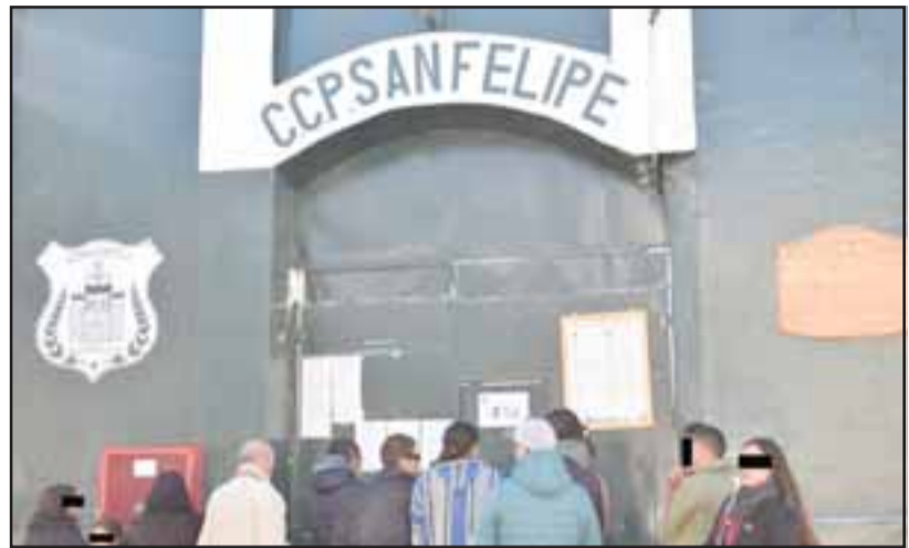
El Gendarme fue detenido por Carabineros en el Centro de Cumplimiento Penitenciario de San Felipe tras la denuncia de microtráfico de drogas.

Tras el hecho, Gendarmería requirió la presencia del personal de OS7 de Carabineros a la unidad penal, verificándose que la droga incautada, más la que mantenía en su poder el unifor-