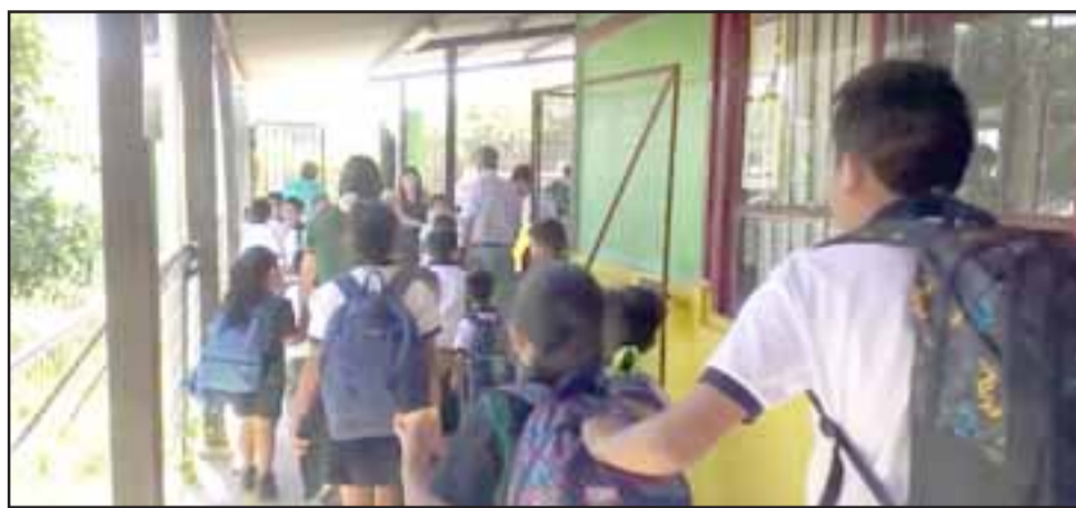
EVACUADOS.- Todos los estudiantes fueron evacuados de manera preventiva ante el fuerte olor a plaguicida al interior de la Escuela Almendral.

«A las diez de la mañana aproximadamente se activó un protocolo de seguridad porque había un fuerte olor a plaguicida, los alumnos fueron trasladados hasta la iglesia del sector y con otros funcionarios volvimos al establecimiento para revisar si el olor continuaba. Revisamos todas las dependencias, no había ya más olor, al menos no olor fuerte ni suave tampoco, revisamos también el terreno atrás de la escuela, ahí sí había todavía olor. Se había detenido la fumigación luego que una funcionaria fue a hablar con la gente que fumigaba, llamamos a la prevencionista de la Daem para que nos informaran sobre qué protocolo seguir, y como ya había pasado una hora después de la evacuación, los niños regresaron a la escuela, pues necesitábamos despacharlos desde acá y así lo hicimos. Luego fuimos con la prevencionista a revisar el