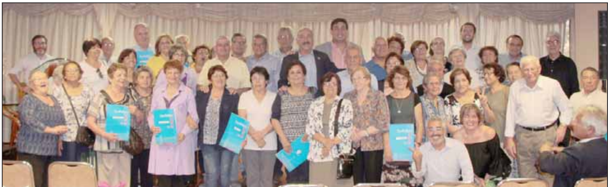
En total fueron 25 instituciones vinculadas al adulto mayor y de voluntariado de la comuna, las que recibieron alrededor de 40 millones de pesos para desarrollar su labor social.