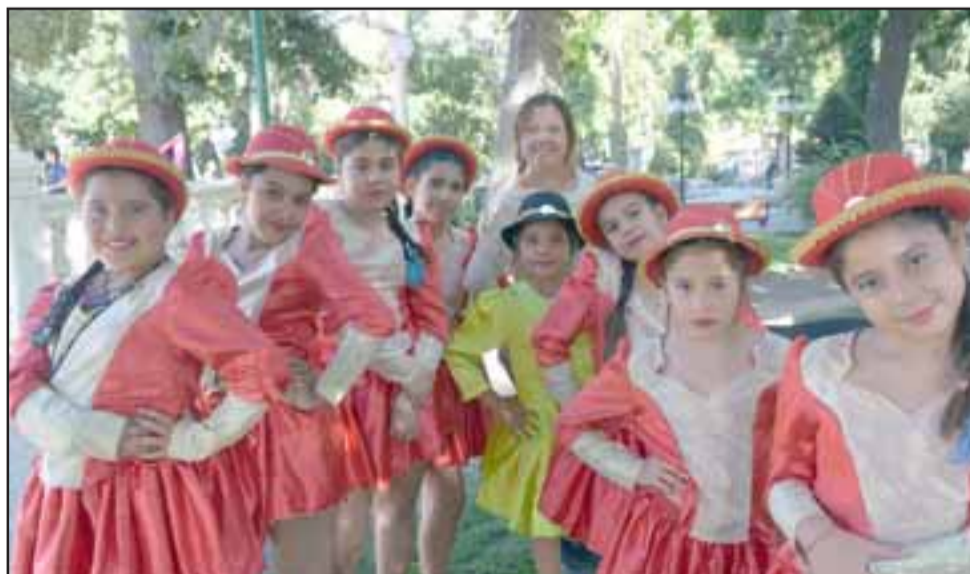
BAILE CAPORAL.- Estos pequeñitos son el Baile Caporal, de la escuela de Tierras Blancas, estos niños también son sanos y con muchas ganas de triunfar sin drogas.