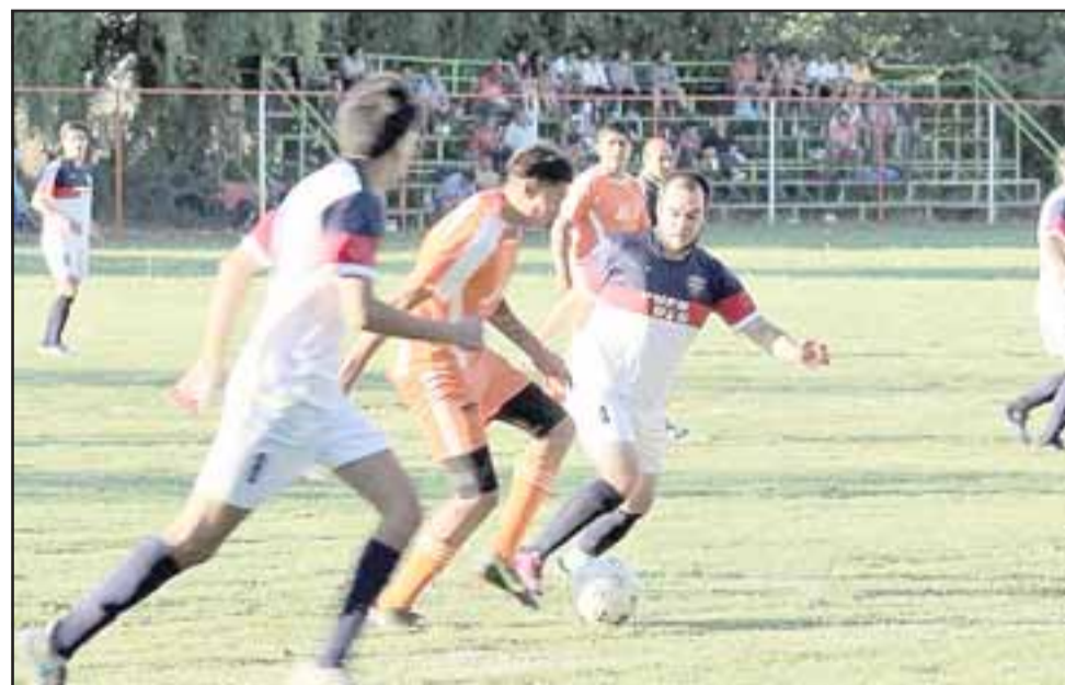
Ningún club pudo capturar la totalidad de los puntos en el comienzo de la segunda fase de Afava.

Alcides Vargas 11 – Brille el Nombre 3; El Tártaro 5 – El Sauce 7; Cordillera de Putaendo 9 – Dos Amigos 4; Ambrosio O'Higgins 3 – Alberto Pentzke 11; El Higueral 6 – Victoria Morandé 6; La Capilla 6 – Valle Alegre 8; Comercio 6 – Alborada 8; René Schneider 4 – Lo Vi- cuña 4.