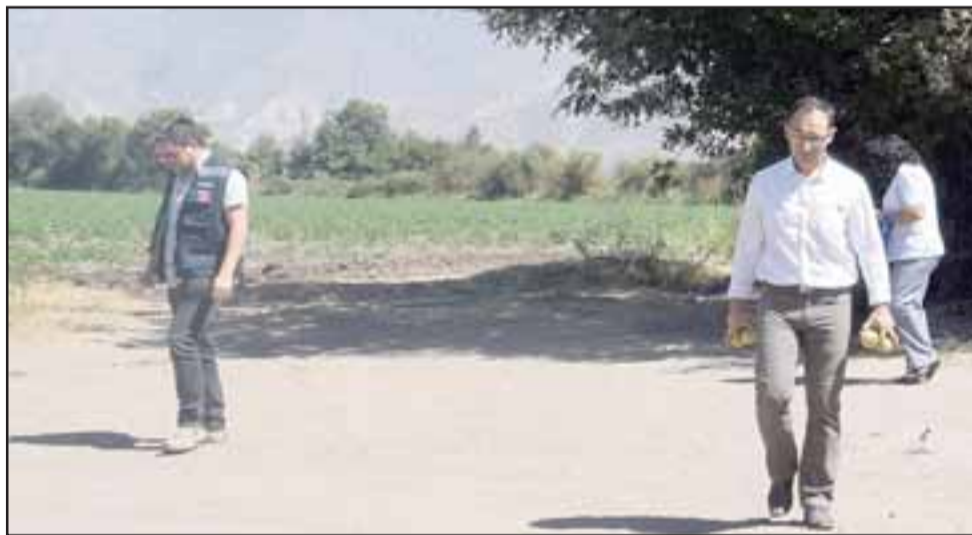
HUBO PREOCUPACIÓN.- Personal de la escuela y de la Seremi de Salud revisaban ayer el fundo en donde se aplicó el químico.

SILENCIO TOTAL.- Así lucía en horas de la tarde este centro educativo, vacío y a la espera de que vuelvan hoy quienes le dan vida, los 220 niños que en ella estudian.