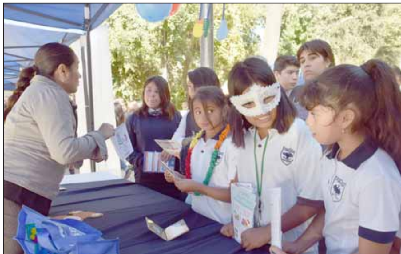
BIEN INFORMADOS.- Miles de niños sanfelipeños crecen conscientes del peligro que representan las drogas y su consumo, gracias a Senda Previene.