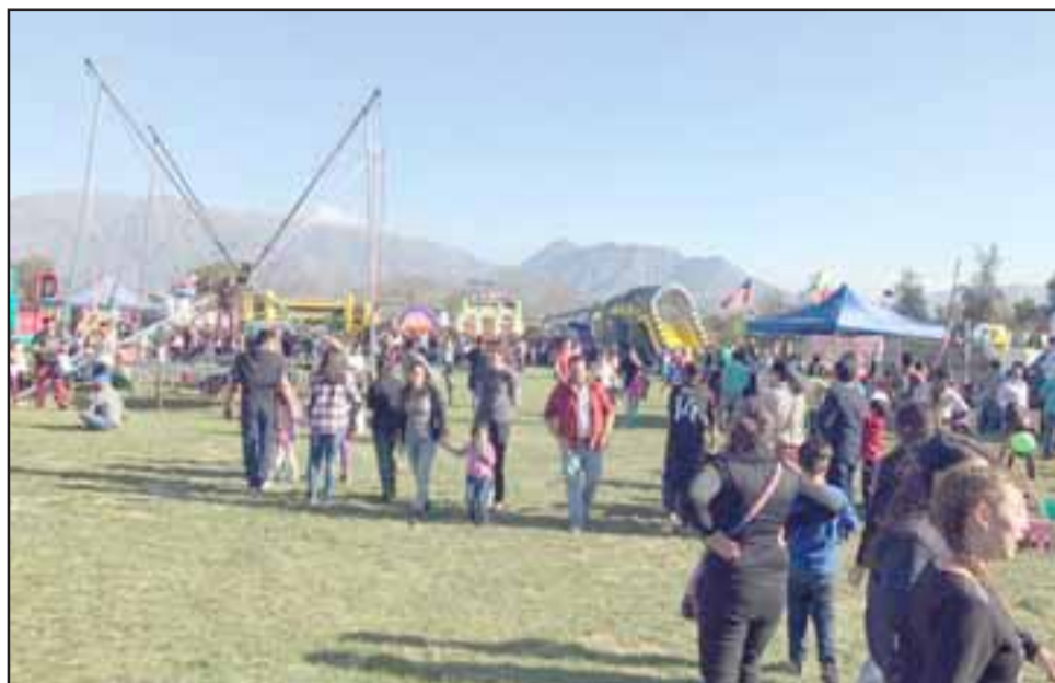
La Filan es una de las ferias más antiguas del país y cuenta con el patrocinio del Gobierno Regional de Valparaíso, la Municipalidad de Los Andes, siendo organizada por la Junta de Adelanto de Los Andes y la colaboración de Codelco División Andina y la Ecogranja, entre otros protagonistas.

En paralelo a este panorama deportivo, la Filan ofrecerá otros atractivos, como cine, juegos infantiles, música en vivo, demo-