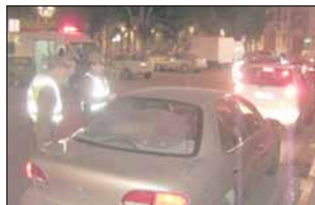
Servicios extraordinarios de Carabineros se ejecutaron durante la jornada de este jueves en las provincias de San Felipe, Los Andes y Petorca.