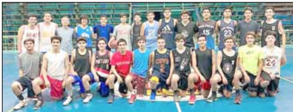
Estos muchachos entrenan sin pausas porque tienen grandes objetivos para el 2018.