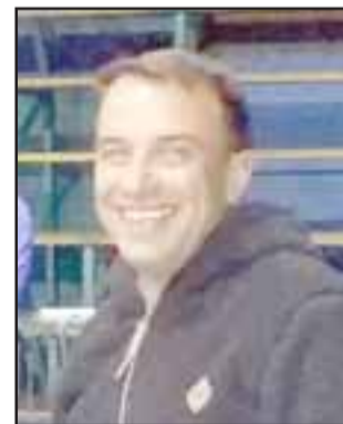
El entrenador está a cargo de ambiciosos proyectos formativos del básquetbol local.

- Tengo grandes camadas en el José Agustín Gómez (2004) y el Vedruna (2005), por