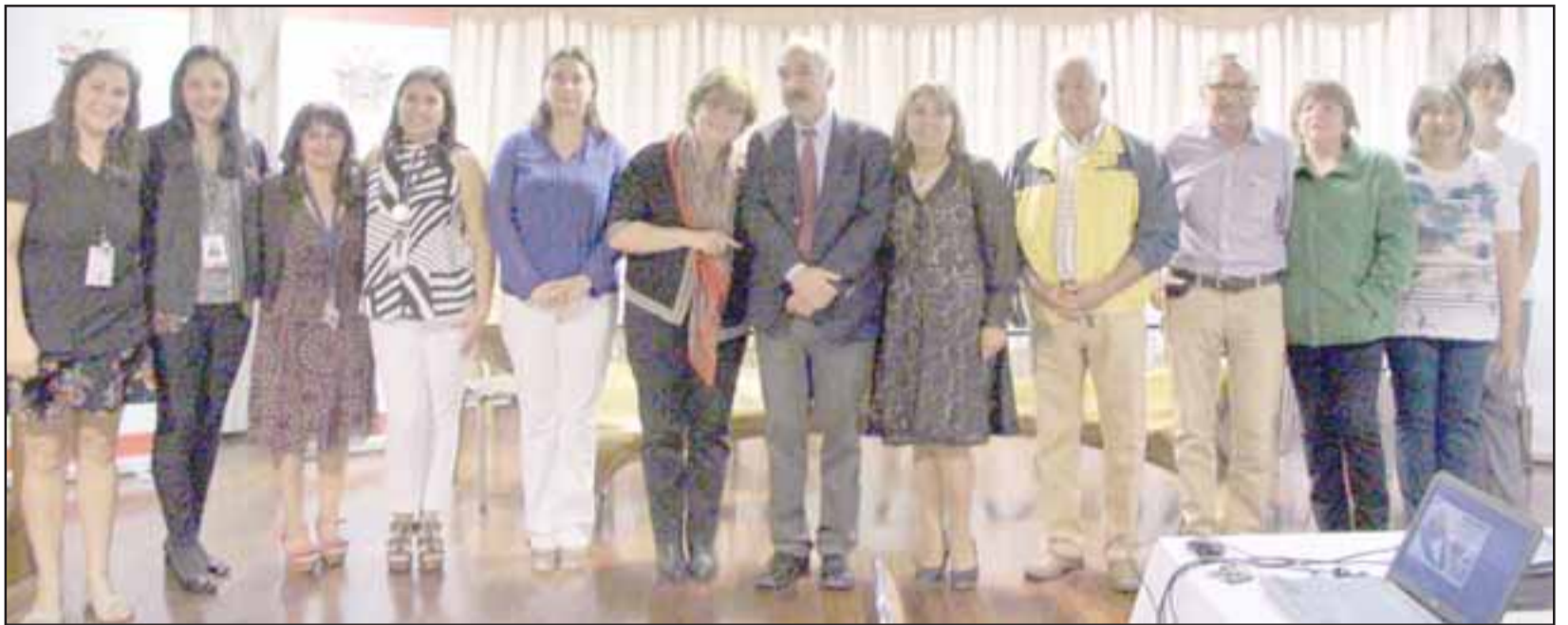
Esta iniciativa busca dar una respuesta más eficiente a las necesidades de los adultos mayores desde una mirada más territorial, equitativa e intersectorial.

Dentro de sus objetivos, la Mesa del Adulto Mayor buscará generar instancias de encuentro, reflexión, análisis y sensibilización que permitan generar estrategias de inclusión social, laboral, educativa, rehabilitación y mejoramiento de la calidad de vida de los adultos mayores; como también desarrollar continuamente planes operativos que permitan fortalecer el bienestar