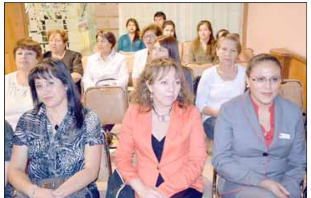
CURSO INTENSIVO.- Este curso se impartió en diciembre de 2017, y este viernes fue la certificación del mismo.