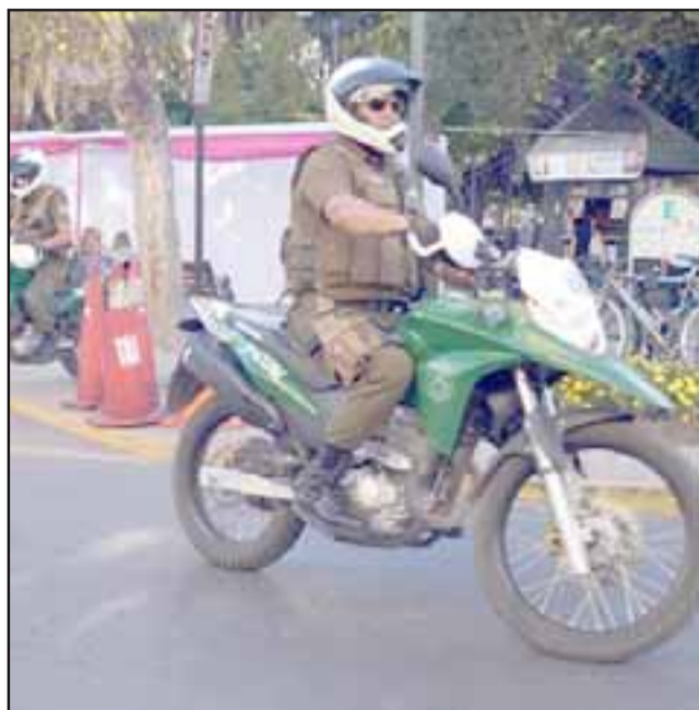
Entre los detenidos destaca un peligroso delincuente habitual que mantenía una orden de arresto por Robo en lugar habitado.