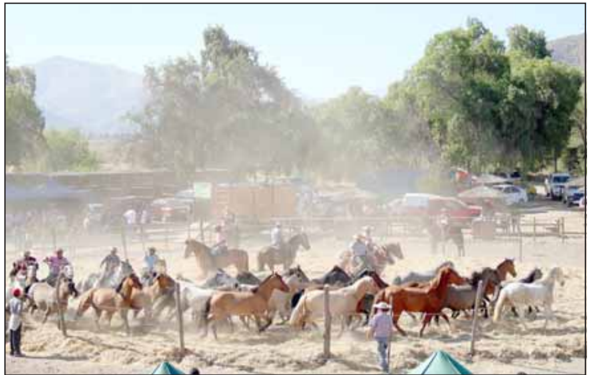
En su mes aniversario, la Capital Patrimonial de Aconcagua ha preparado variadas actividades para celebrar un año más de historia. Este sábado 24 y domingo 25 de marzo se desarrollará una gran fiesta costumbrista, trilla a yegua suelta y cuecazo en la medialuna comunal.

Putaendo fue fundada el 20 de marzo de 1831 como Villa San Antonio de la Unión de Putaendo. Actualmente, la comuna se destaca en la región por ser un pueblo histórico, patrimonial y con un gran potencial turístico. Es ampliamente reconocido por sus tradiciones, valiosos atractivos naturales y grandes parques comunales.