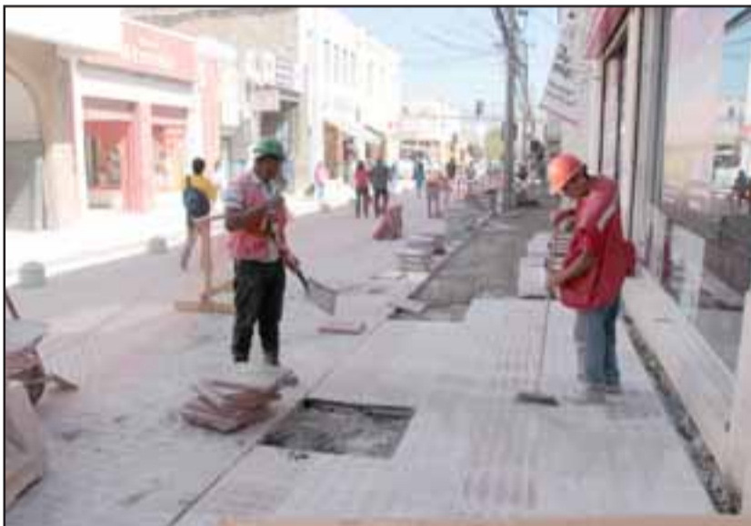
La construcción de los paseos semipeatonales continuará este lunes, cuando inicien los trabajos en calle Salinas, entre Santo Domingo y Prat.

una calle cerrada por trabajos, es porque estamos progresando como ciudad», concluyó.