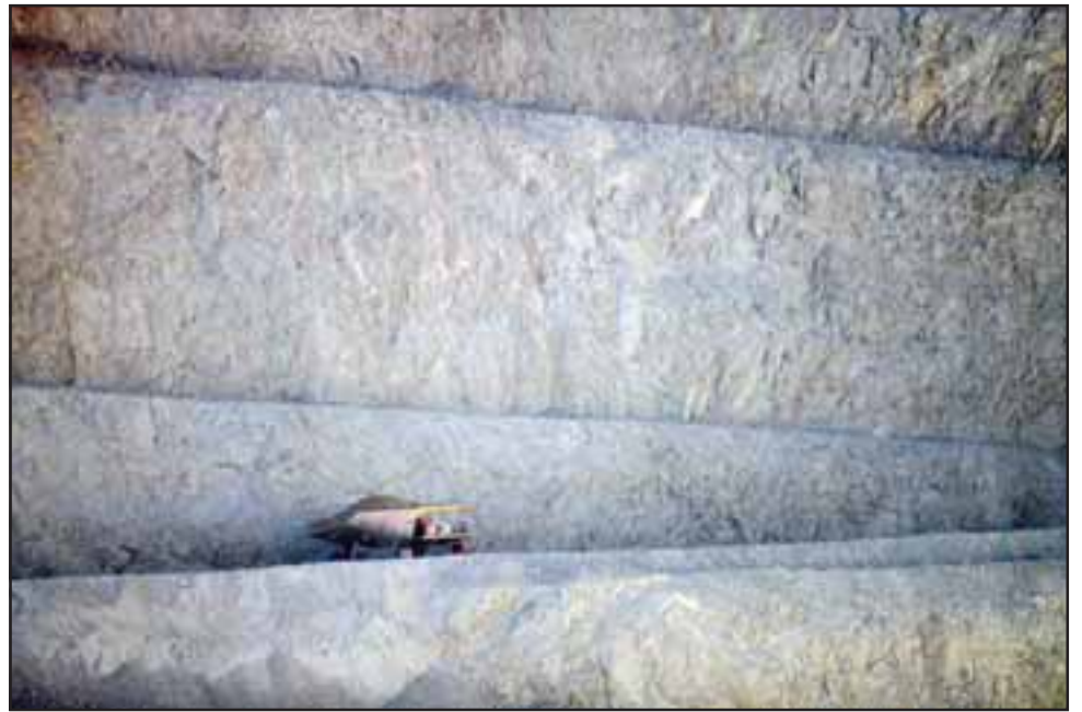
La producción de Andina, sumada a las restantes divisiones de Codelco, suman 1.734.000 toneladas de cobre fino de producción propia, lo que representa el segundo mejor resultado operacional en la historia de la corporación.

- Más de 1.734.000 mil toneladas de cobre fino fue la producción propia de