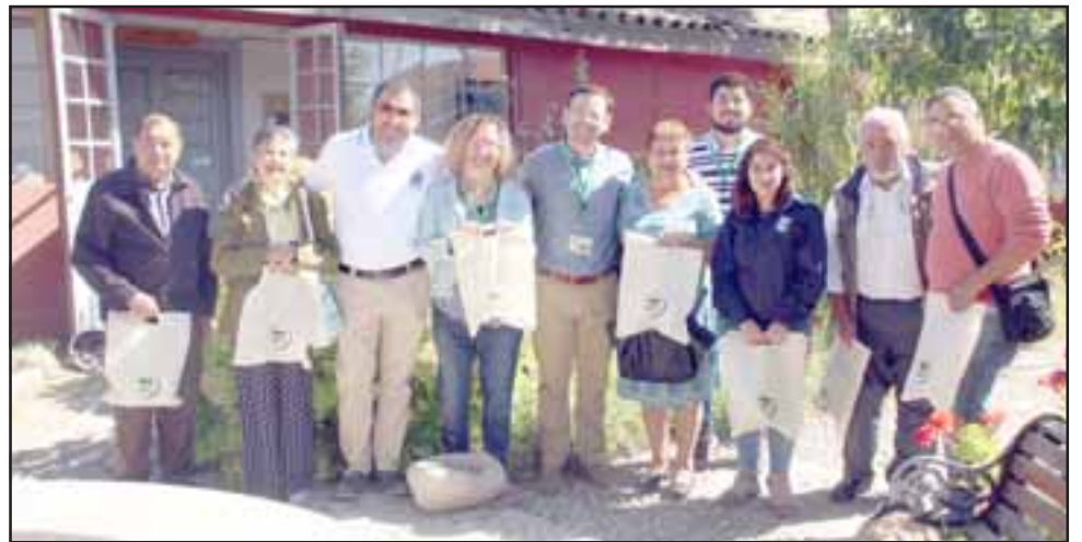
Representantes de distintas organizaciones sociales de Putaendo que integran el Codelo, concordaron en definir este 2018 como un año de transición para el Philippe Pinel, donde se conjugarán elementos como la conmemoración de su cincuentenario, la acreditación de calidad y las obras de normalización del edificio.