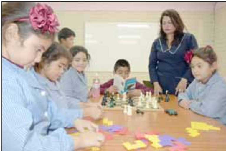
NADA LOS DETIENE.- Aquí tenemos a los más pequeñitos de la escuela, aprovechando su recreo en el CRA de su establecimiento.