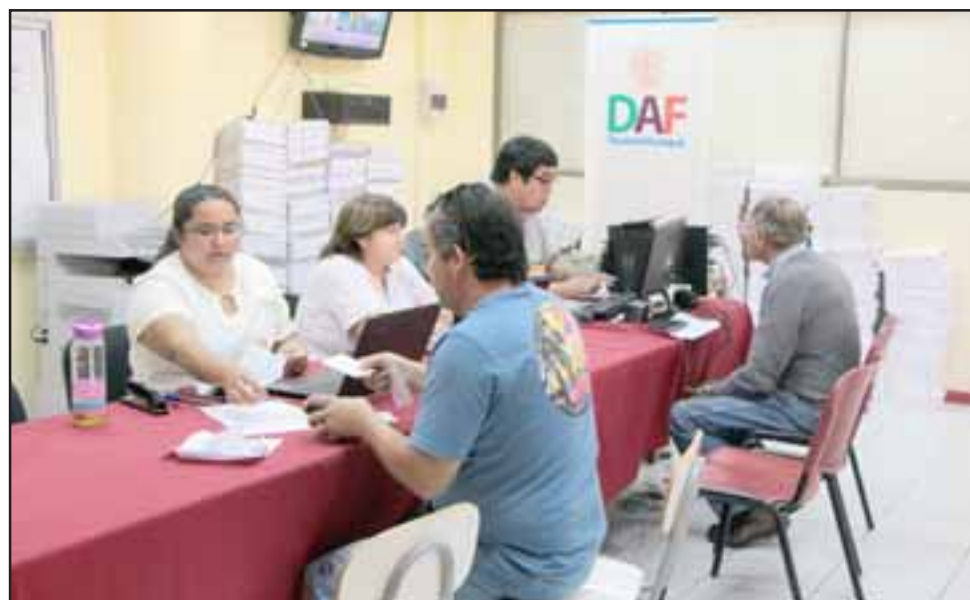
Un aumento de 600 permisos en comparación al 2017 registró el proceso desarrollado este año, totalizando unos 13.400 vehículos, lo que representa una recaudación cercana a los $900 millones.