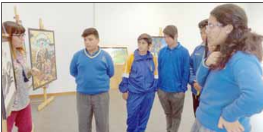
La actividad será inaugurada mañana jueves a las 12:00 horas en la galería de Buen Pastor. (Referencial).