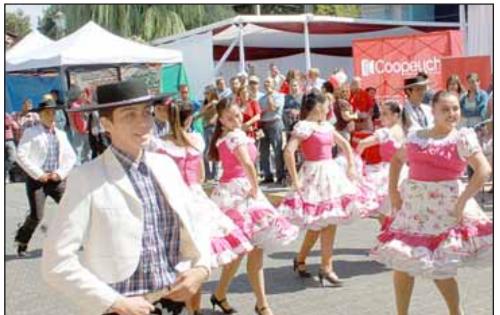
IMPERDIBLE.- Folcloristas, bandas musicales, humor, artesanos y stands de productos estarán listos para este fin de semana en la Fiesta de la Vendimia 2018.

- Sabemos que generamos bastantes problemas a los vecinos con esta actividad con el tema del tránsito en varias arterias de nuestra comuna, particularmente en el sector de El Almendral, pero también creemos