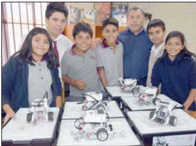
UN EQUIPO GENIAL.- Seis son los Robots EV3 con los que cuentan estos chicos de Las Cadenas, y esperan este año tener más.