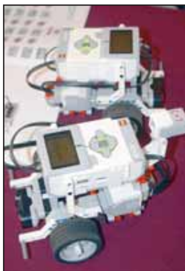
DESARMABLES Y PROGRAMABLES.- Estos son los Robots EV3, los que fueron programados por los hábiles estudiantes.