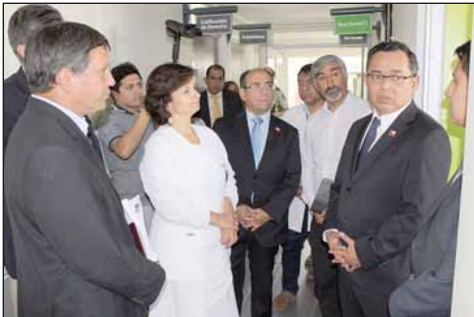
Las diversas autoridades encabezadas por el intendente Jorge Martínez, en visita al Cesfam, donde el Intendente se comprometió a terminar las obras restantes del nuevo Cesfam de Panquehue en el menor tiempo posible.

AVISO: Por extravío queda nulo cheque N° 0684625, Cta. Cte. N° 22300111452 del Banco Estado, Suc. San Felipe.