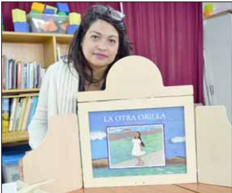
NUEVAS TÉCNICAS.- El Camuchi bay es una técnica de lectura con láminas ilustradas relacionadas al relato mismo, el relator pasa una a una las imágenes en una pantalla de madera, conforme se desarrolla la historia, a los niños les encanta.