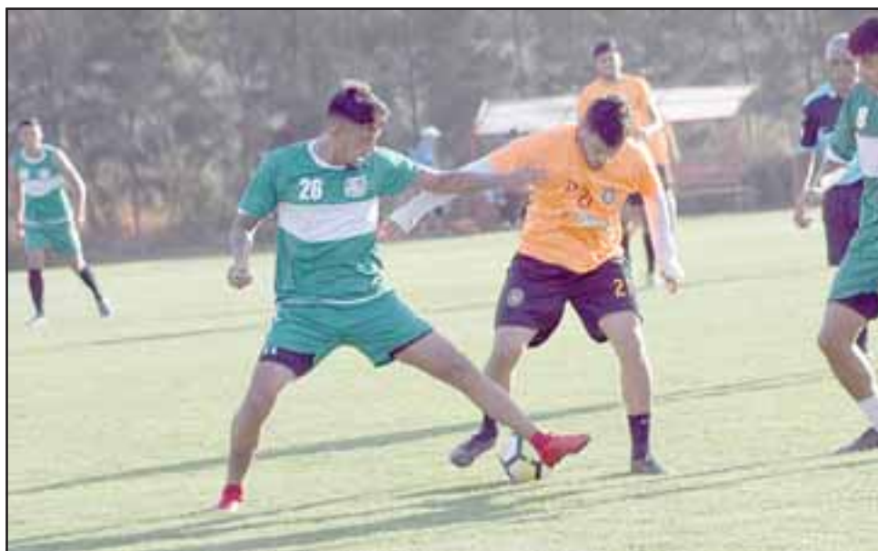
Unión San Felipe de manera inmediata comenzó su preparación para el juego del próximo sábado frente a San Marcos. La imagen corresponde al amistoso con Deportes Limache.