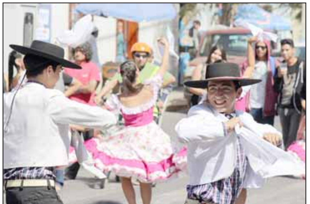
La actividad será inaugurada este sábado al mediodía, y terminará el domingo a las 22:00 horas.