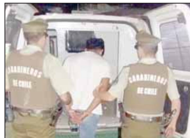
El sujeto de 28 años de edad fue detenido por Carabineros en calle Dardignac esquina Las Heras en San Felipe. (Foto Referencial).