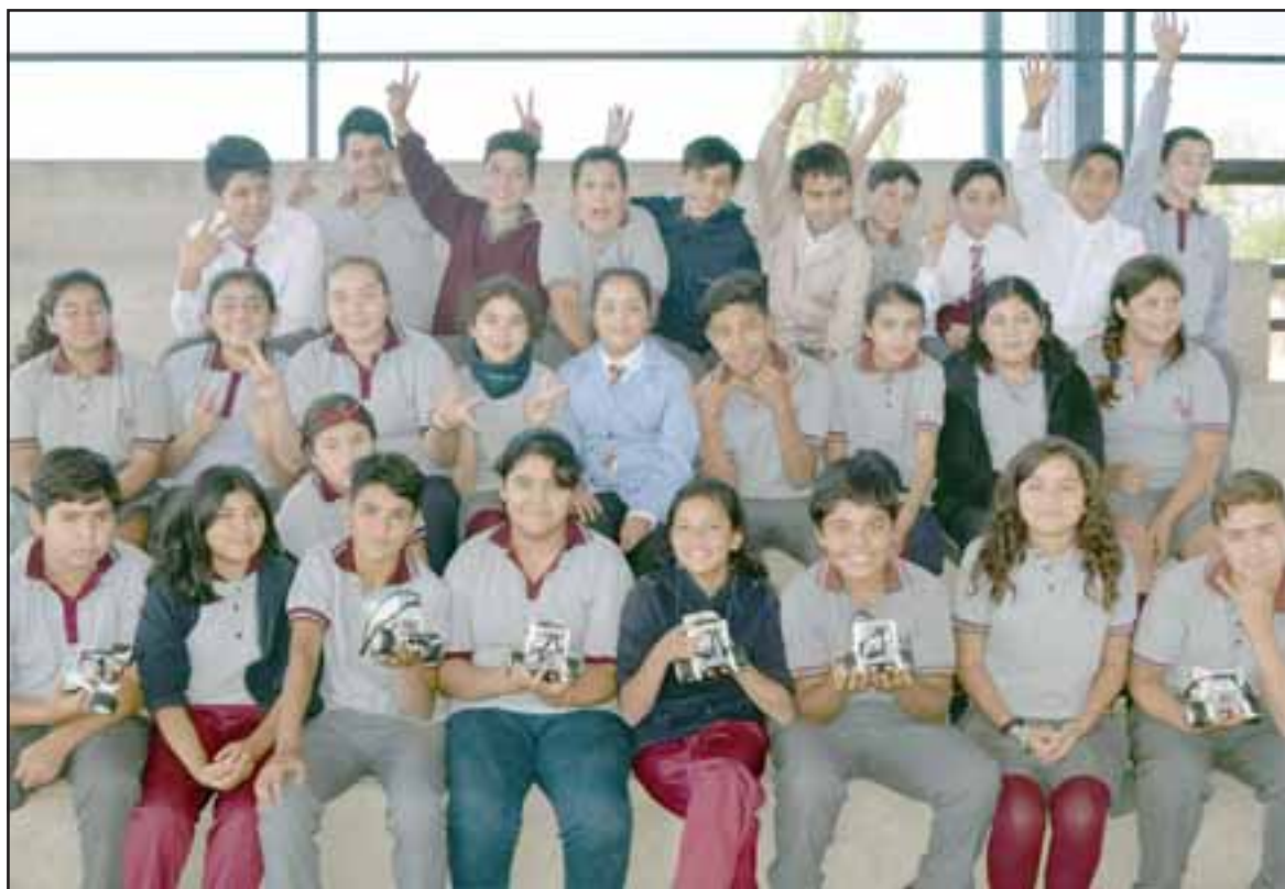
NIÑOS DEL FUTURO.- Ellos son sólo parte de los 70 estudiantes del Taller de Robótica que con gran entusiasmo arman y programan robots en la Escuela Guillermo Bañados Honorato, de Las Cadenas.

Pero no se crea que sólo el tema de la Robótica sea lo que mueve a los escolares, los más pe-