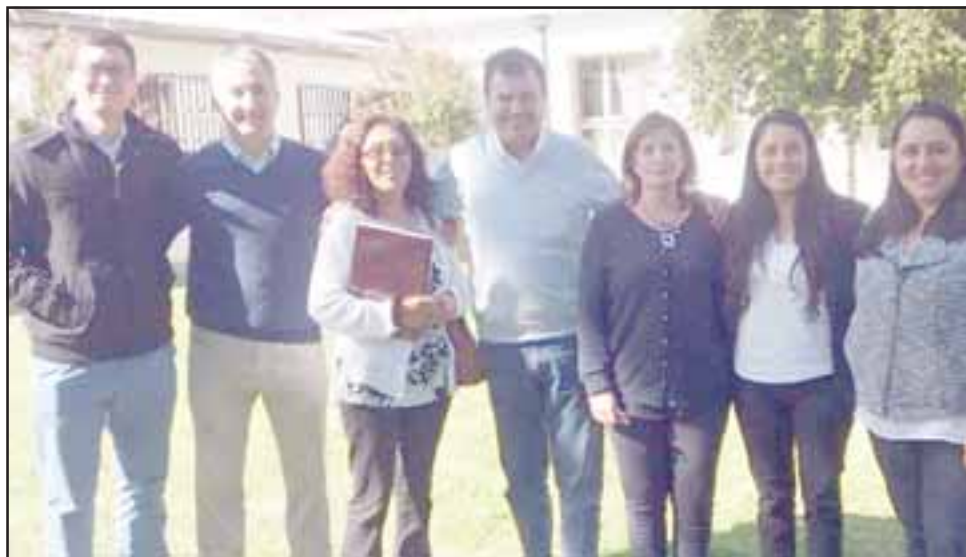
Ellos son parte de los profesionales que impartirán estas clases a los estudiantes sanfelipeños en la Agrícola.