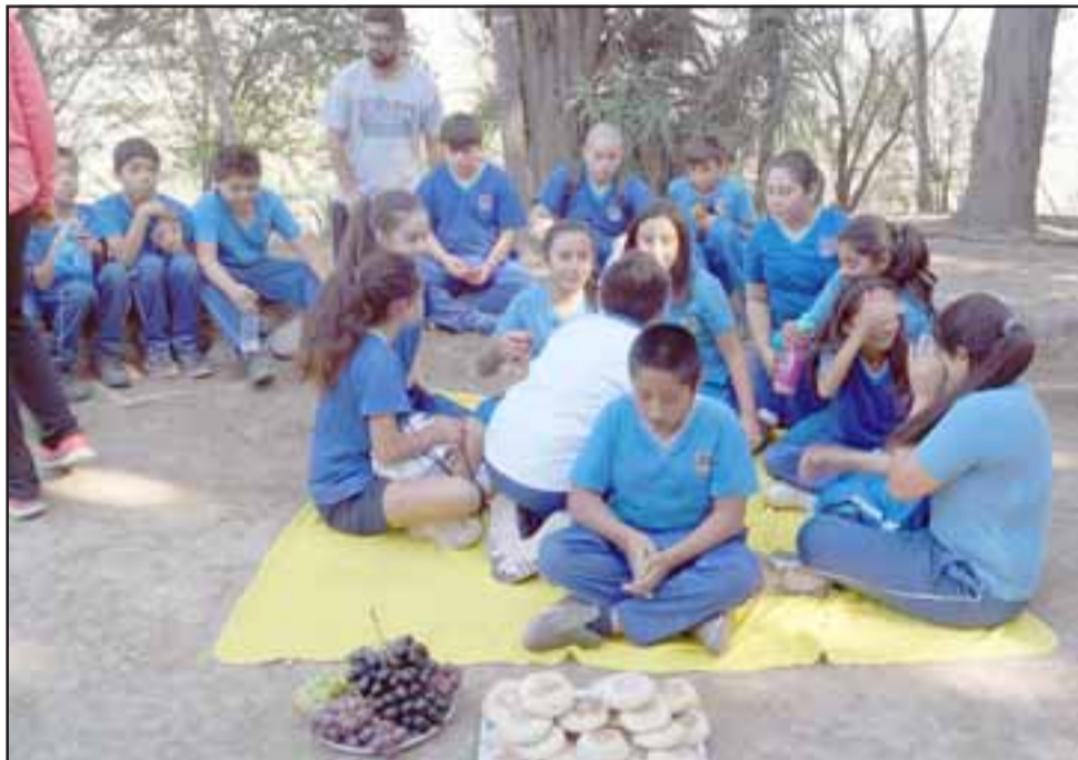
Los niños se mostraron respetuosos, oraron y presentaron su respeto en esta actividad religiosa.

Pan. «Todos los niños desde 5° a 8° Básico, participaron en esta actividad, una vez llegando al cerro, disfrutaron su colación, hicimos algunos cánticos y se rezó, también se desarrolló el ritual de la última Cena, los niños se mostraron res-