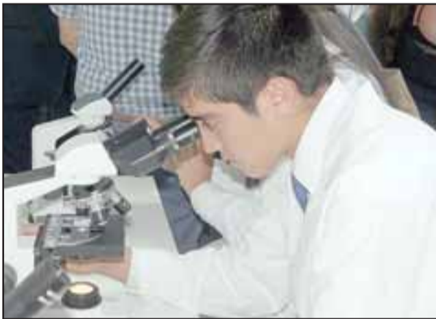
DE PRIMERA.- Los jóvenes estudiantes cuentan ahora con microscopios digitales de Última Generación, con cámara y proyección de imágenes.

pero en otra sala. Con la inauguración de este nuevo laboratorio se están favoreciendo unos 600 estudiantes, especialmente 1º y 2º Medio. Esta nueva unidad cuenta con instrumentos como lupas, instrumental de vidrio para trabajar Química; maquetas para generar moléculas, adaptantes, químicos para experimentos; en Biología tenemos microscopios con una gran resolución, estos tienen una cámara para poder proyectar en monitor o proyector las imágenes que registre, tenemos los Labdis, que son laboratorios digitales para hacer mediciones ambientales, voltaje y luminosidad, o sea, la parte más analítica de las matemáticas y estadística, pantallas y cámaras digitales, proyectores, kit didácticos de ciencias naturales, kit de destilación, extracción y leyes de gases, tratamiento físico de óptica, magnetismo y conversión de energías, entre otros. Todo un orgullo que queda