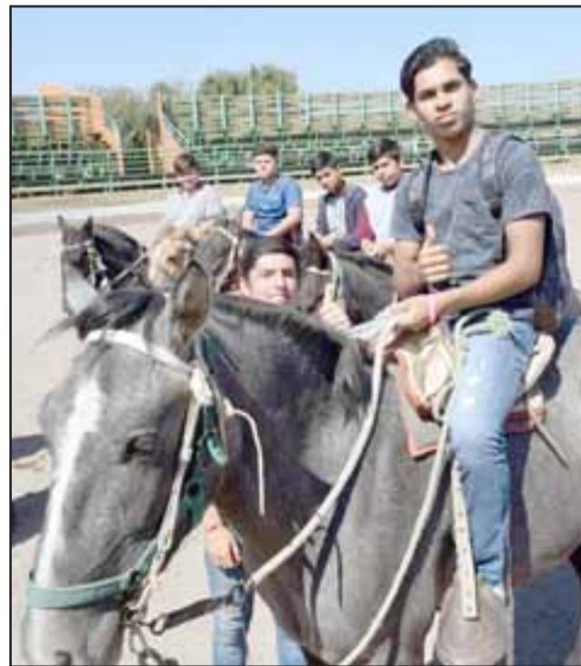
SABER APRENDER.- También los más grandes debieron aprender a ser pacientes con sus potros, pues es la experticia la que vale, no la edad.