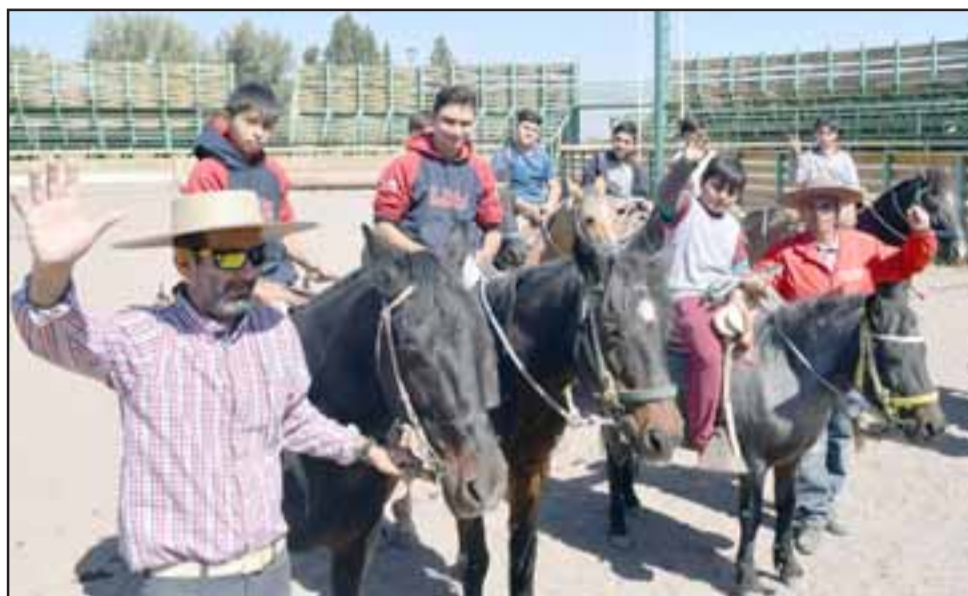
BIEN SUPERVISADOS.- En todo momento los experimentados huasos del Club de Rodeo Santa María estuvieron al cuidado de los niños y sus potros.

que este tradicional deporte se realiza en nuestro país desde la época colonial, por lo que está entre las más típicas fiestas campesinas chilenas. Todos los años, en la Medialuna Monumental de Rancagua por ejemplo, se realiza el Campeonato Nacional de Rodeo, el torneo más importante de este deporte, con representantes de diversos lugares del país. La popularidad de este deporte es elevada, tal punto que se contabilizaron más espectadores en rodeos que en partidos de fútbol profesional en 2004, según se lee en Wikipedia.