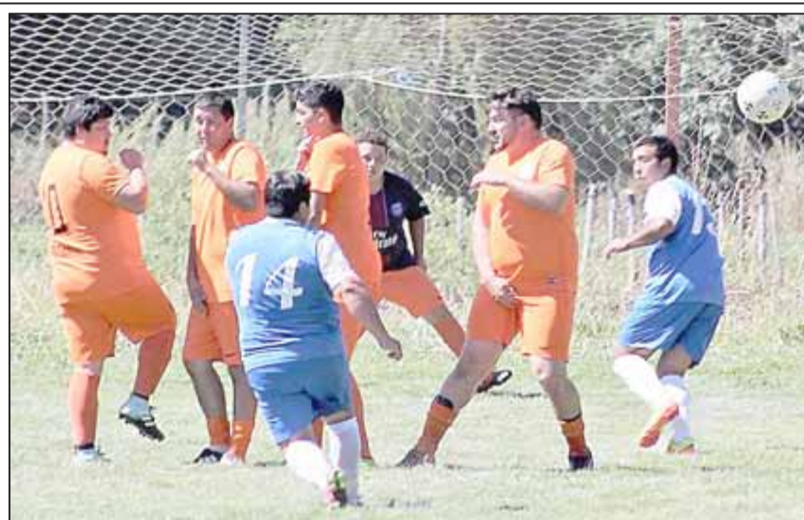
En el torneo Cordillera se jugaron los partidos de ida correspondientes a la segunda fase.