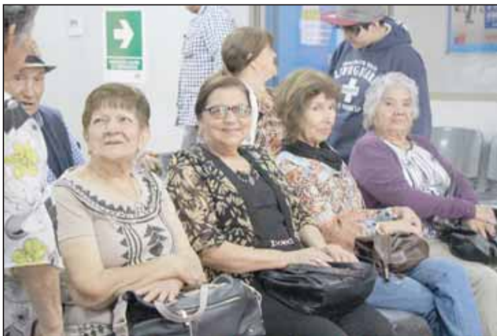
Hasta el momento la campaña lleva un 54% de la población objetivo vacunada, donde figuran en la primera etapa los niños/as de 6 meses a 5 años 11 meses, adultos mayores, mujeres embarazadas sobre las 13 semanas y los enfermos crónicos (hipertensos, diabéticos, asmáticos).

me dijeron que me iba a dar una tos muy fuerte, pero estuve muy mal, me querían trasladar al hospital porque me dio neumonía... eso me pasó cuando no me vacuné. Así que les digo a mis vecinas que vengan a vacunarse, toma sólo un minuto», concluyó.