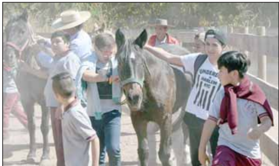
NACE UNA AMISTAD.- Poco a poco los niños fueron perdiendo el temor a los caballos, algunos al final de la jornada no querían bajarse.