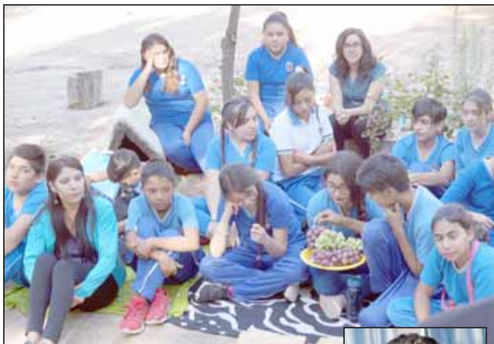
Todos los niños desde 5° a 8° Básico, participaron en esta actividad, una vez llegando al cerro, disfrutaron su colación.