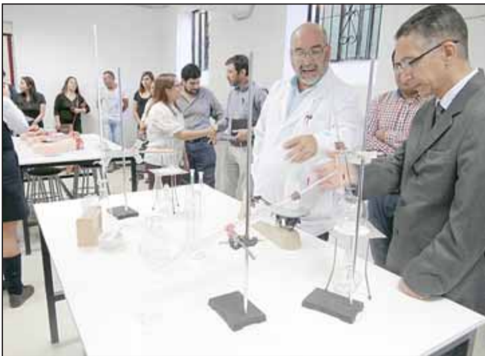
MILLONARIA INVERSIÓN.- Profesores, apoderados y estudiantes recibieron con alegría esta millonaria inversión, en total fueron $47 millones.