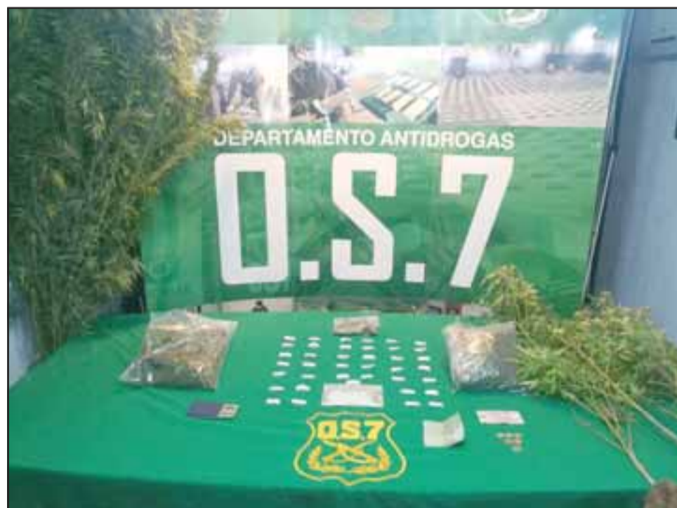
Personal de OS7 de Carabineros incautó pasta base, marihuana en cogollos y plantas de cannabis sativa desde el domicilio del detenido en calle Comercio de Putaendo.