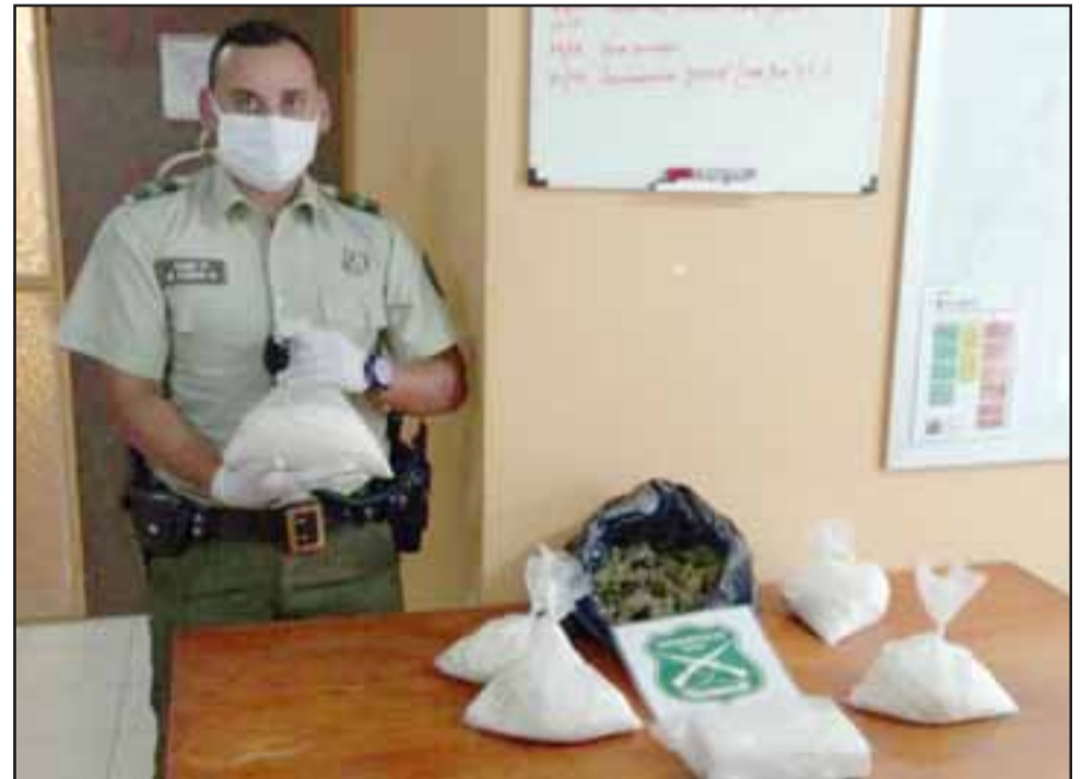
Personal de Carabineros logró incautar más de 28 mil dosis de droga que serían comercializadas en la ciudad de Los Andes.