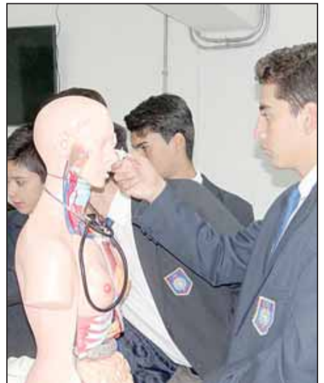
También en Biología los estudiantes podrán avanzar de mejor manera, pues ahora están actualizadas sus demandas de recursos didácticos.