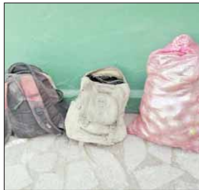
Carabineros recuperó un total de 65 kilos de paltas sustraídas por el actual sentenciado desde un domicilio de la comuna de Santa María.