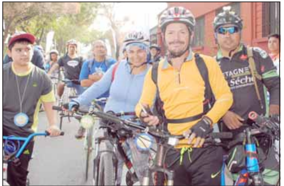
Esta sábado será la oportunidad para compartir en familia de una gran cicletada a partir de las 9:00 horas en las afueras del Cesfam Centenario.

La cicletada, organizada por el Cesfam Centenario en