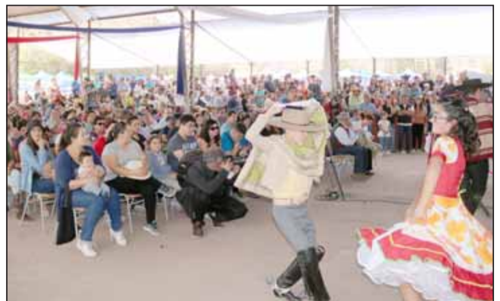
Por la tarde se vivió un gran 'cuecazo' con la participación de la agrupación local 'Herencia de Familia' y el reconocido grupo 'A los Cuatro Vientos'.