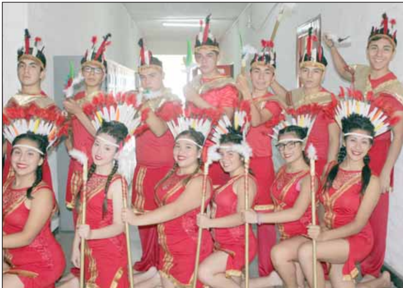
IMPONENTES DEL FOLKLORE. - Ellos son nuestros folcloristas sanfelipeños de la Escuela Industrial, quienes viajan mañana miércoles hasta la VII Región de Chile, a representarnos en el 10° Campeonato nacional de Rodeo y Folklore SNA Educa.