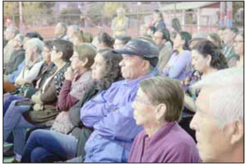
Los vecinos de El Señorial resultaron ampliamente favorecidos con esta nueva sede, la más grande construida durante la gestión del alcalde Patricio Freire.

Por su parte el alcalde Patricio Freire indicó que «desde que empezamos nuestra gestión, hace 5 años, hemos estado trabajando junto a los vecinos y esto es un sueño, un anhelo de muchos vecinos. Todo esto hace que se viva mejor en comunidad y estamos contentos de estar progresando en una ciudad que avanza a pasos agigantados»; palabras a las que se sumó el concejal Dante Rodríguez quien agregó: