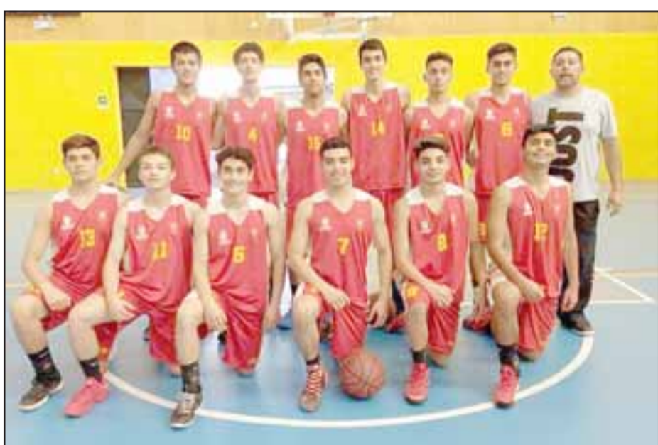
La selección de San Felipe será la representante del básquetbol masculino de la región en los próximos Juegos Binacionales.

rrí en una distancia a la cual no estoy acostumbrado, pero igual pude sostener un ritmo constante y explosivo durante todo el recorrido, así que ya en la próxima carrera (Santiago) espero estar dentro de los tres primeros", analizó el experimentado deportista.