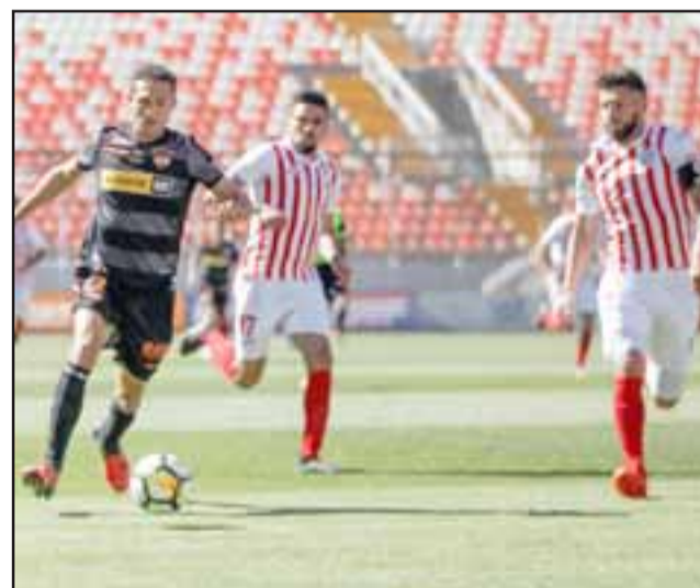
Después del histórico triunfo sobre Cobreloa, el próximo domingo Unión San Felipe regresará al estadio Municipal para enfrentar a Valdivia.