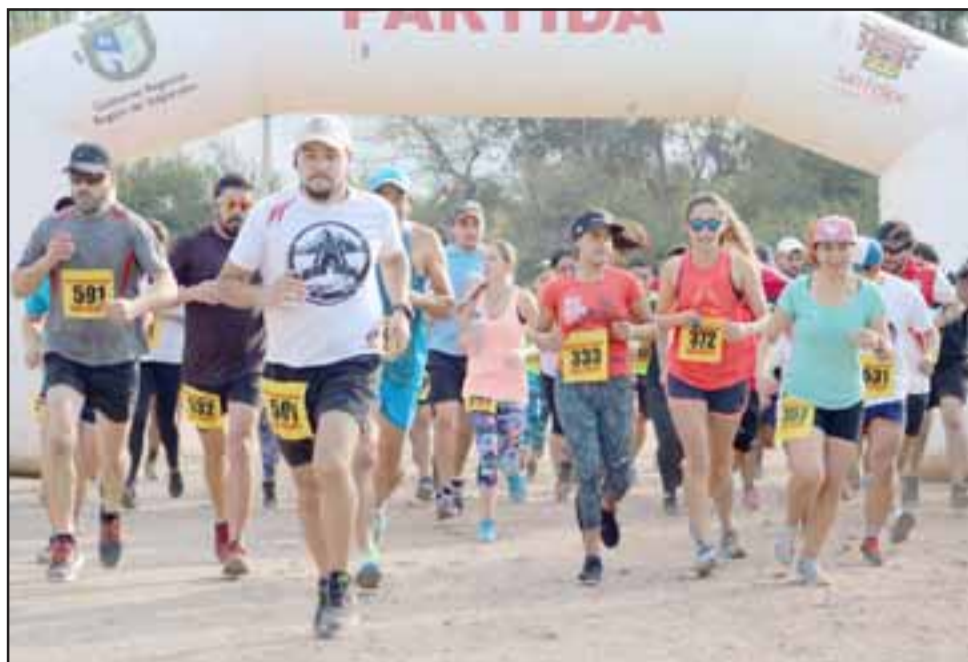
Unas cien personas se congregaron en la Primera Corrida Familiar 2018.