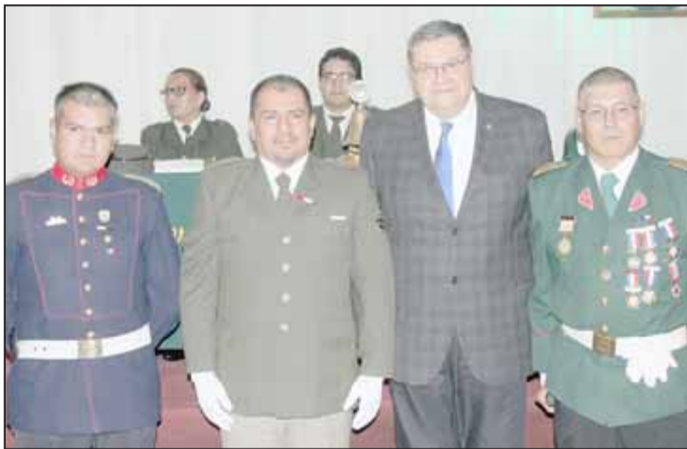
TRAYECTORIA.- Autoridades regionales y bomberiles destacaron a los más esmerados voluntarios en esta oportunidad.