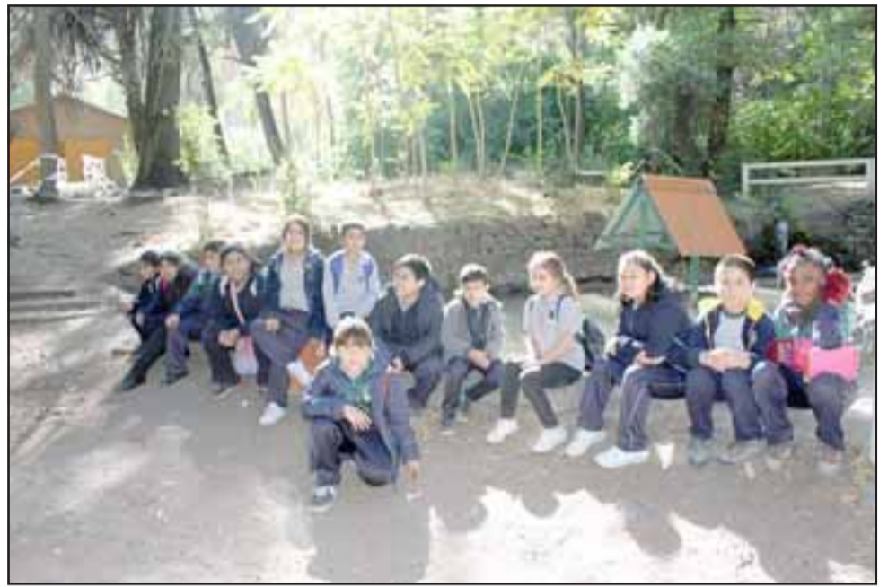
Los alumnos de la escuela José Miguel Carrera disfrutaron de una mañana de naturaleza, historia y ciencia en la piscicultura de Río Blanco.

La piscicultura está abierta de martes a domingo desde las 9:00 hasta las 17:30 horas y las visitas se pueden coordinar llamando al +569 86462096.