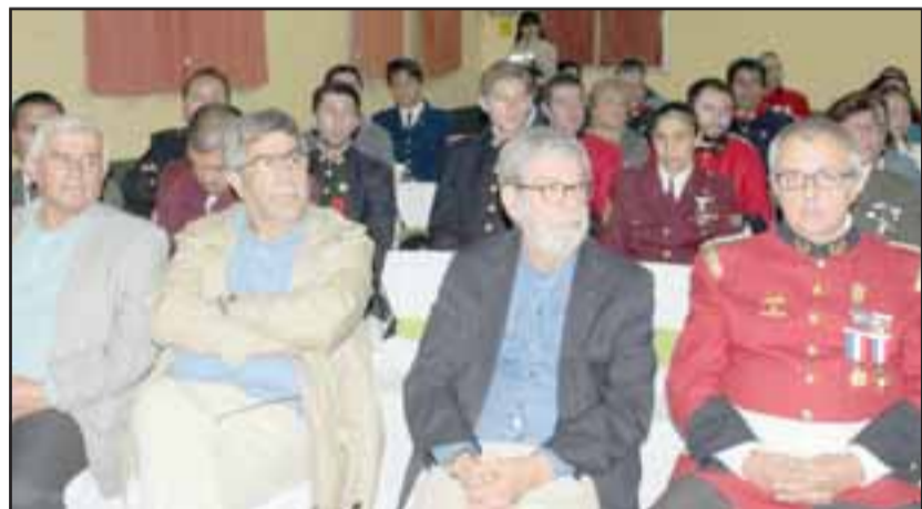
RESPALDO.- Autoridades políticas y bomberiles asistieron a la gala del 113° aniversario de este cuerpo bomberil sanfelipeño.