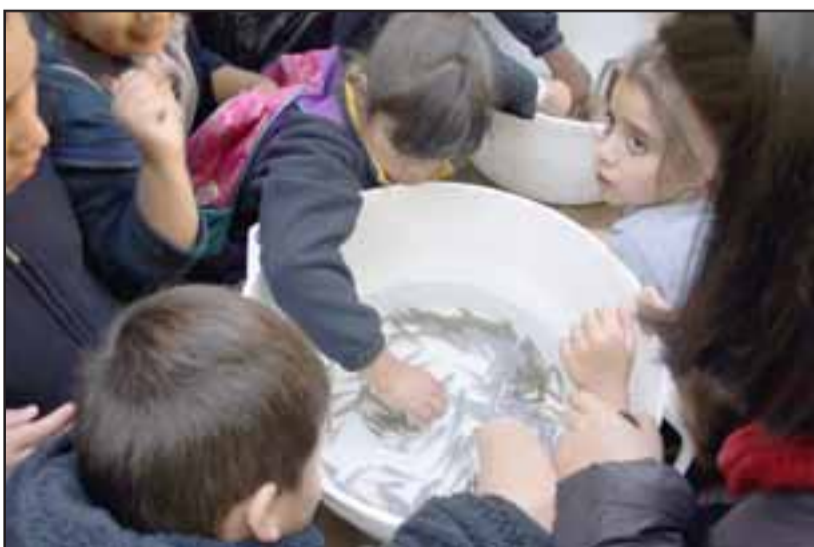
Los estudiantes disfrutaron del espacio y conocieron el desarrollo científico de la PUCV.