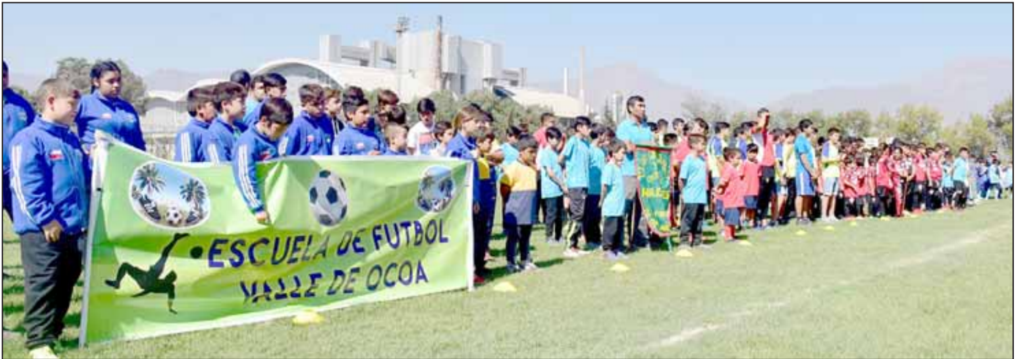
En total son 15 equipos provenientes de distintas comunas de la Quinta Región los que estarán dando vida al torneo.