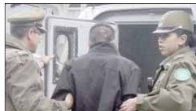
Los detenidos por Carabineros quedaron a disposición de la Fiscalía correspondiente a cada comuna de las provincias de San Felipe, Los Andes y Petorca. (Foto Archivo).