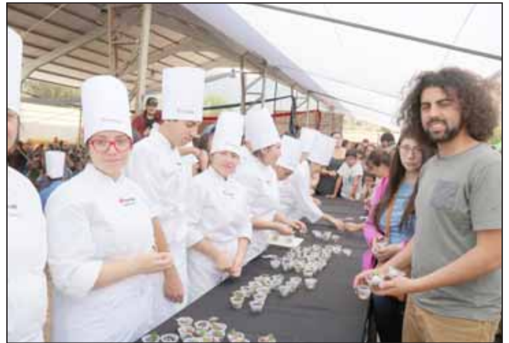
Todos los asistentes pudieron degustar y repetir pequeñas porciones de la Picá de Charqui, preparada en vivo por miembros de la Agrupación de Arrieros de Putaendo y profesores y alumnos de la carrera de Hotelería, Turismo y Gastronomía de Inacap Valparaíso.

«La verdad es que hay una acogida importante, una cantidad significativa de gente que vino desde diferentes partes de la región y creo que esto se va a transformar en una actividad permanente todos los años. Tiene un sentido y nos planteaban que la Picá de Charqui debiera ser un plato típico y que tuviera denominación de origen. Creo que es importante y vamos a trabajarlo. Para nosotros esto tie-