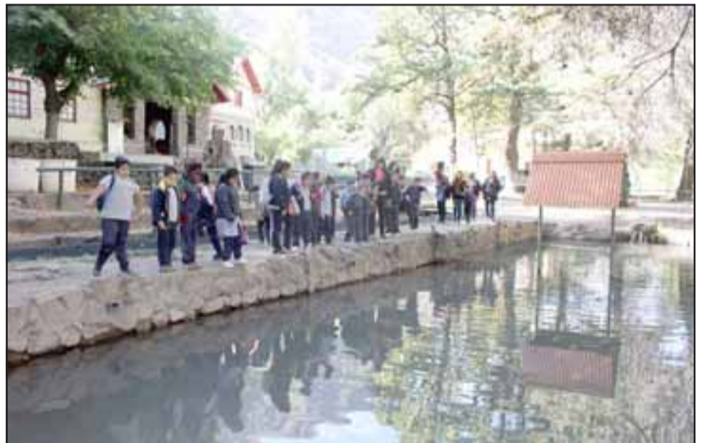
Durante el primer semestre alumnos de las escuelas municipales de Los Andes visitarán el recinto.