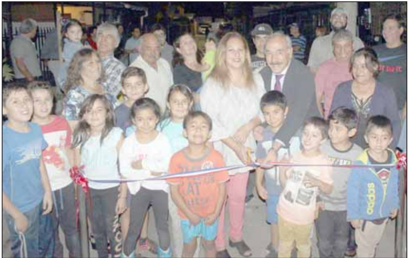
VECINOS CONTENTOS.- Niños y adultos celebraron con alegría el contar con nueva pavimentación en su pasaje, tras años de esperar esta obra.