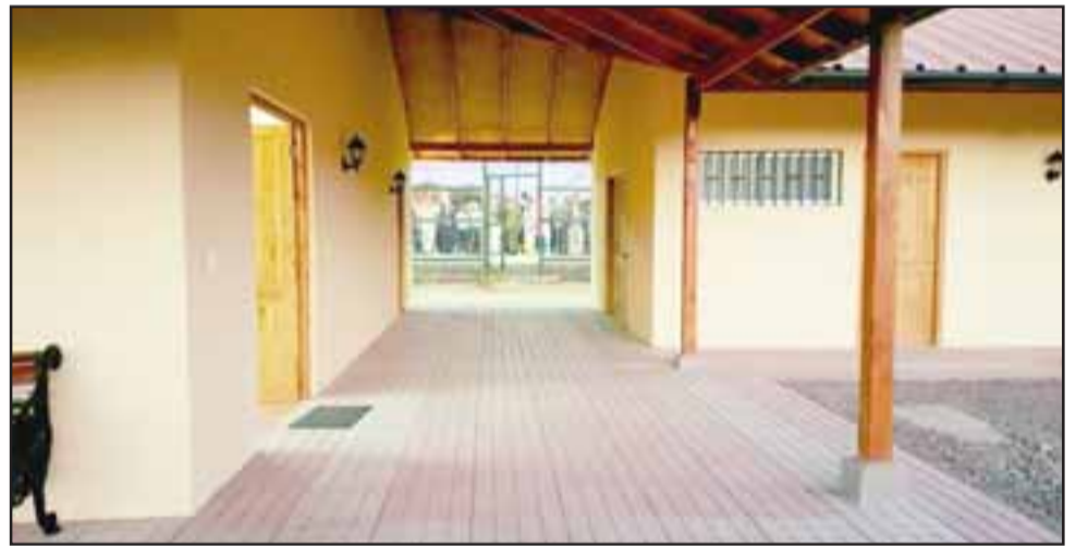
Una flamante y espaciosa sede vecinal de nada menos que 176 metros cuadrados fue inaugurada el viernes pasado en la Villa El Señorial.

proyecto viene con una inversión de $85.400.000 y entre sus características más destacadas está la cantidad de metros cuadrados, pues es una de las sedes más grandes que se han construido durante esta gestión, son 176 mts 2 », concluyó.