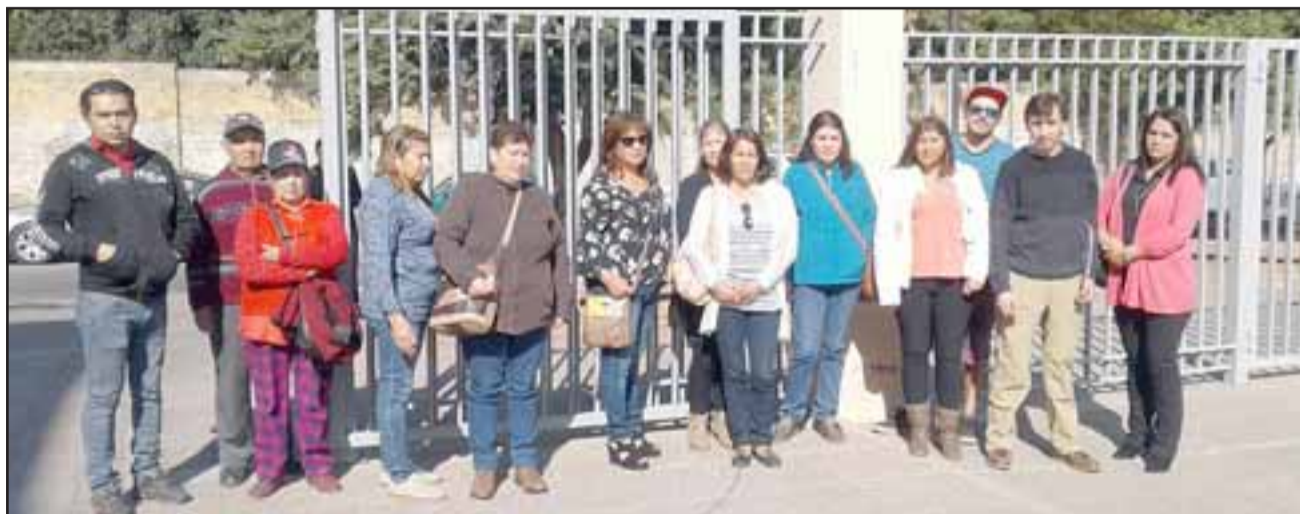
Parte de los vecinos integrantes del Comité Valle Verde, saliendo desde el Tribunal de Garantía en San Felipe donde se enteraron que deberán seguir esperando por justicia.

Abogados de la empresa denunciada renunciaron a defender a los empresarios acusados de estafa al no recibir pago por sus servicios y por diferencias en la política de defensa.