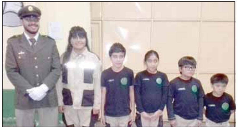
BOMBERITOS.- Ellos Son la nueva generación de Cadetes de la Tercera Compañía de Bomberos de nuestra comuna.