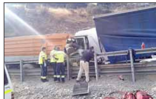
Dos personas perdieron la vida en la tragedia registrada ayer en Las Chilcas.

En cuanto a las condiciones de la ruta, se mantiene una pista cortada hacia el norte y solo dos habilitadas hacia el sur.