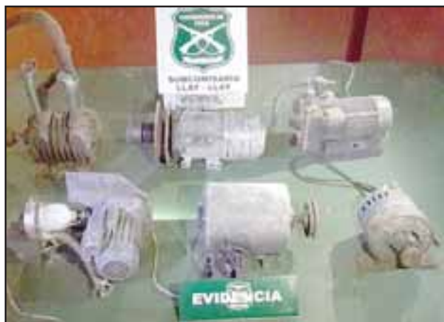
Carabineros recuperó los motores sustraídos por los imputados en horas de la tarde de este lunes en Llay Llay.