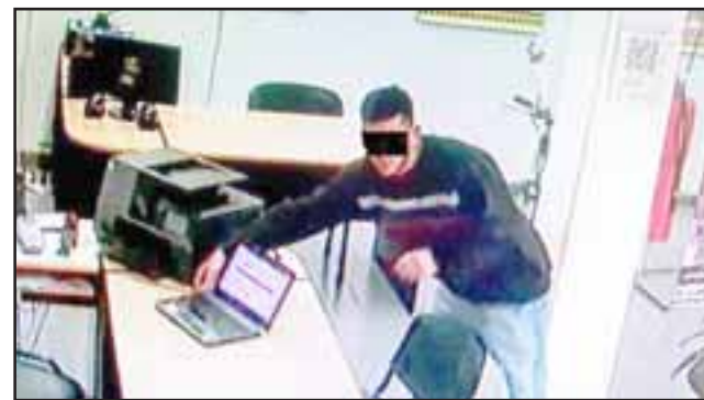
El registro de las cámaras permitieron la individualización del imputado para ser procesado ante la justicia. (Imagen Referencial).

Finalmente el Tribunal Oral resolvió condenar al imputado a una pena de 819 días de presidio menor en su grado medio y una mul-