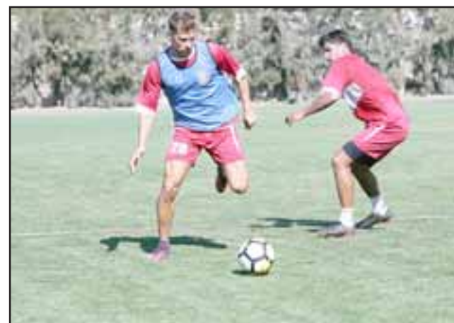
Colchagua será el rival del Uní Uní en la primera fase de la Copa Chile 2018.

Ida: 25, 28 ó 29 de abril Vuelta: 2, 5 ó 6 de mayo