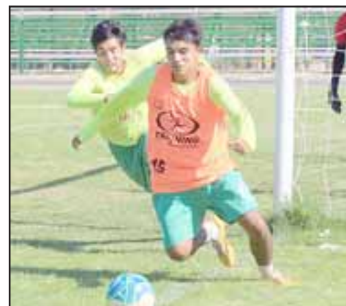
Para este sábado fue programado el primer partido como local de Trasandino en la Tercera A.