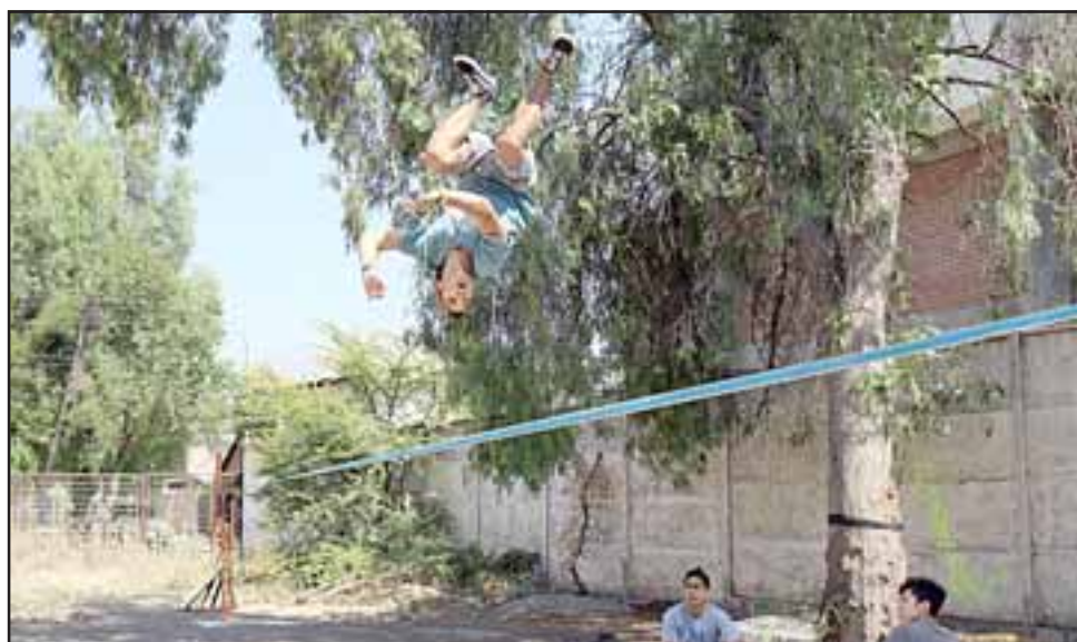
El Taller de Slackline estará en el Gimnasio Municipal Samuel Tapia, los viernes de 16:00 a 18:00 hrs. y dirigido a mayores de 12 años.

no significa que es para esa junta de vecinos en particular, es para toda la comunidad; y si hay un taller en un colegio, escuela o liceo, tampoco es solamente para los niños de ese establecimiento educacional, es para todos, las puertas están abiertas y la inscripción es totalmente gratuita y se hace directamente en el lugar donde se realiza el taller», concluyó el coordinador, quien hizo un llamado a informarse sobre todos los talleres directamente en el departamento de Deportes y Actividad Física municipal, ubicado en el Edificio Prat, 4º piso, oficina 401.