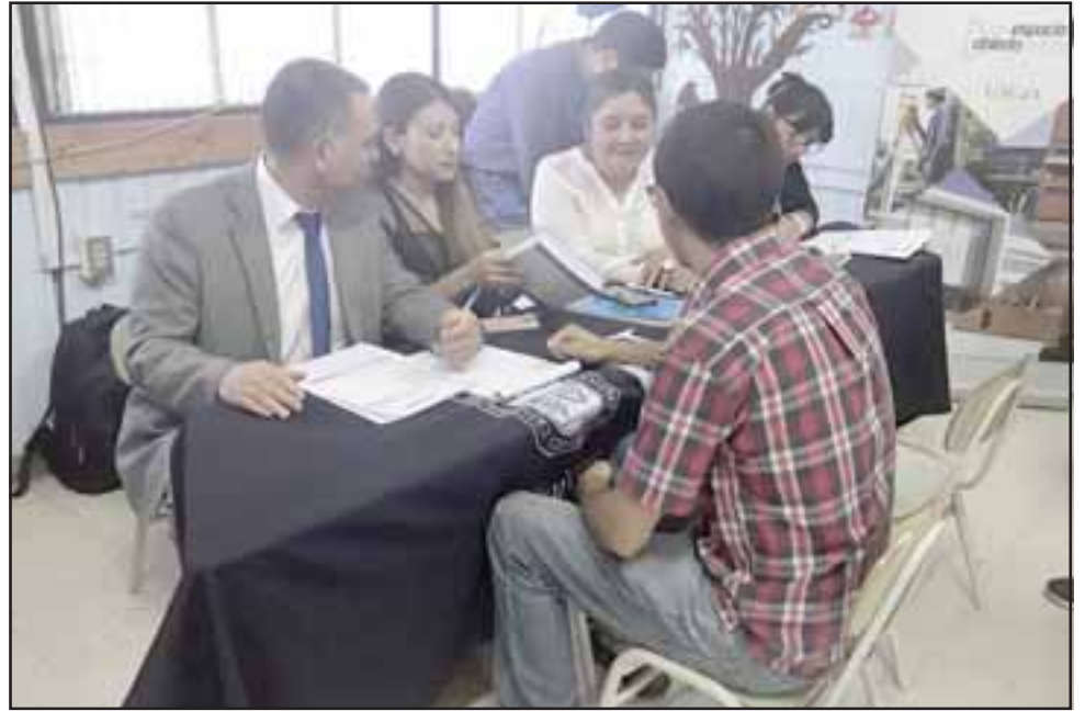
La tarde de este martes los vecinos comenzaron a llegar al establecimiento educacional a realizar distintas consultas, especialmente enfocadas en el área de causas de familia.

“La idea es que nos reconozca como parte del sector. Hubo una directora que estuvo mucho tiempo, que hizo una muy buena gestión y uno tiene que estar a la altura y de ahí para arriba, por eso se planificó este trabajo con la comunidad”, dijo el director.