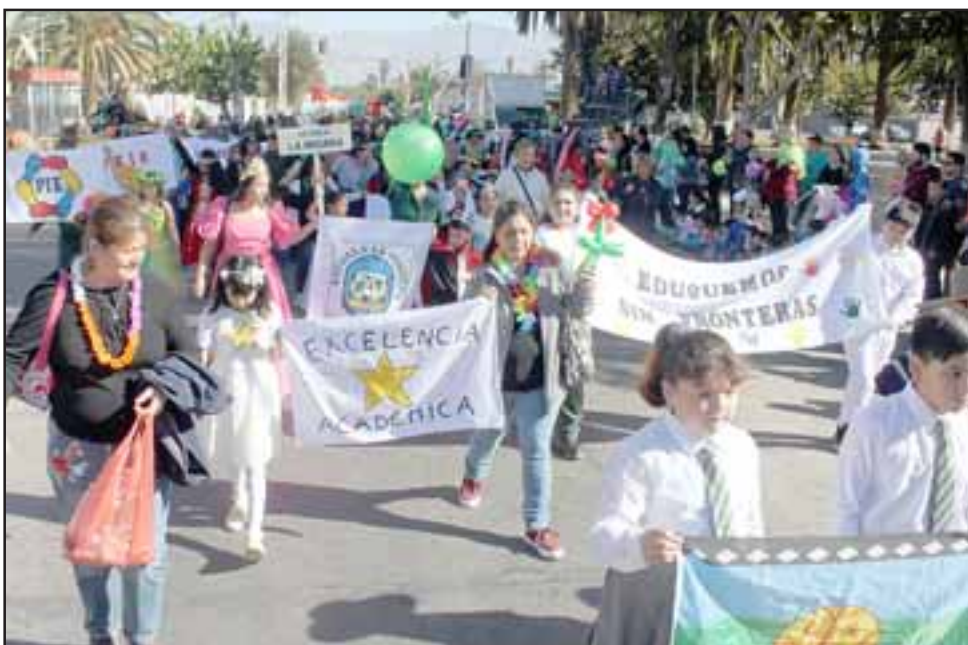
El mundo estudiantil santamariano se volcó íntegramente en este festival del Saber para celebrar el Día de la Educación Rural 2018.