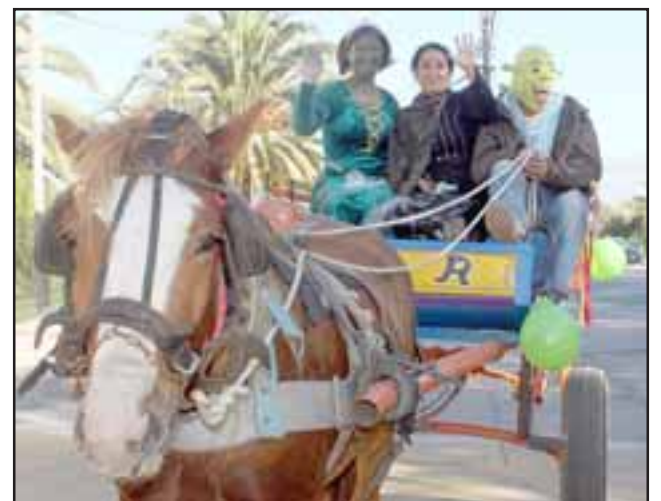
Shrek fue uno de los personajes más aplaudidos en esta fiesta educativa en pleno centro de la Plaza de Armas de Santa María.

Previene; Sin drogas la vida es mucho mejor y Cesfam Jorge Ahumada Lemus, en la prevención para una mejor salud y calidad de vida.