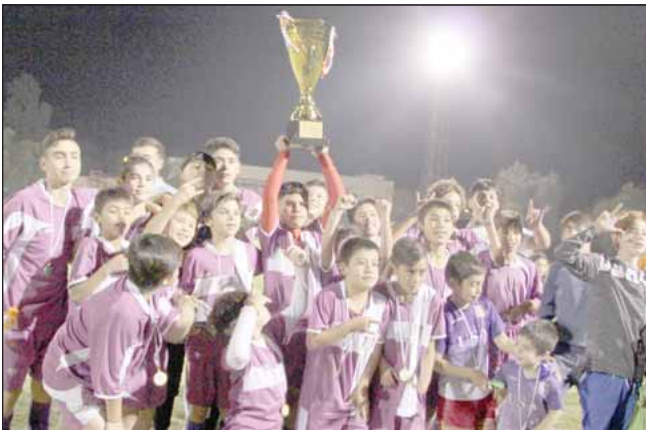
NUESTROS CAMPEONES. - Aquí tenemos a los Bicampeones del Campeonato de los Barrios 2018, quienes rompiendo todos los esquemas y sin recursos económicos para presumir, a puro coraje lograron quedarse con la copa este año.

En este electrizante desenlace no hubo misericordia, pues aunque ambos clubes empataron a cero goles en el Estadio Regional de Los Andes el viernes, finalmente el duelo fue decidido por lanzamiento de penales, ganando la copa por segundo año consecutivo los niños de la 2ª Infantil del Sargento Aldea.