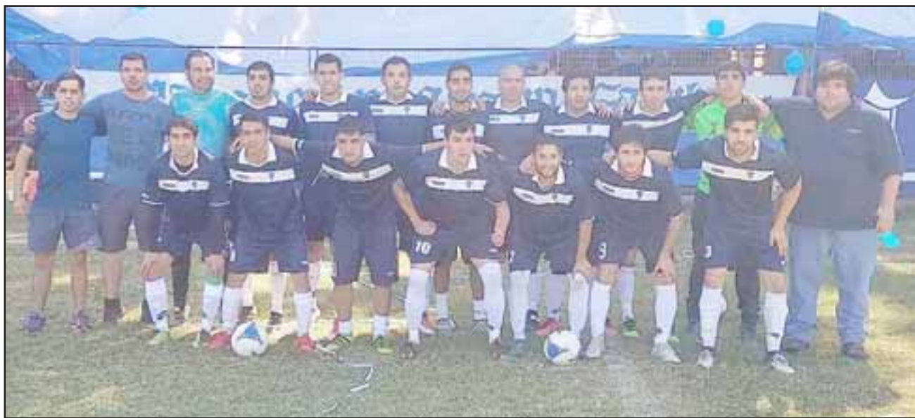
La Higuera de Santa María tiene muchas posibilidades de seguir avanzando en la Copa de Campeones.

Juventud El Bajío (Quillota) 3 – Unión San Pedro (Rinconada) 3; La Higuera (Santa María) 1 – Unión Santo Domingo (Pta. del Pacífico) 0; Bandera de Chile (Viña del Mar) 3 – Unión Tocornal (Santa María) 2; La Higuera (La Ligua) 1 – El Sauce (El Belloto) 3.