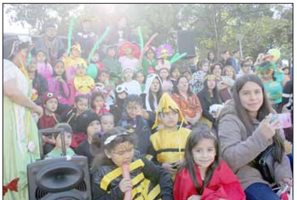
Ellos constituyen el Rostro de la Educación Rural: Niños y apoderados llenos de un gran interés por crecer e incorporarse al mundo de acción a nivel nacional.

Entre las temáticas presentadas en esta actividad nos encontramos con las escuelas La Higuera, Santa Filomena, Julio Tejedor y Aurora Velasco, del sector rural de Santa María, las que celebraron su día en honor al natalicio de la poetisa chilena, Premio Nobel de Literatura y maestra rural, Gabriela Mistral; para