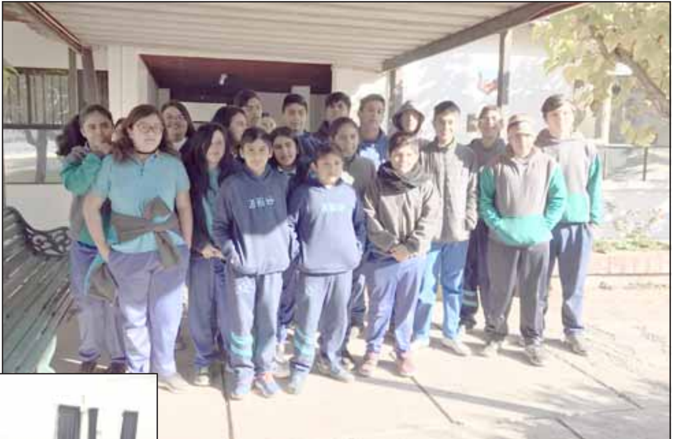
Estudiantes de séptimo y octavo básico conocieron in situ el lugar donde se realiza la lombricultura y el compostaje.

Sin embargo, desde el nivel de pre básica los alumnos ya comienzan a familiarizarse con este tema, contando con el huerto escolar, y la idea ahora es comenzar a trabajar el compostaje al interior de la Escuela José Bernardo Suárez.