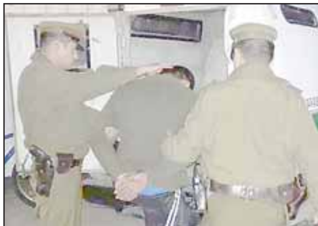
Los detenidos quedaron a disposición de la Fiscalía por el delito de robo en lugar no habitado.

Un adolescente de 17 años de edad y dos adultos fueron detenidos por Carabineros luego que la víctima reconociera las especies de su propiedad. Los imputados fueron formalizados por el delito de robo en lugar no habitado por la Fiscalía.