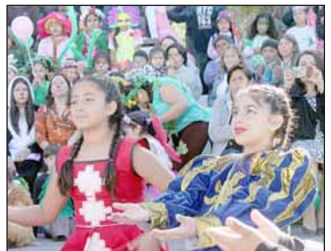
Intensamente cada estudiante interpretó su mejor Papel artístico en esta jornada pública, para representar a sus escuelas.

La presentación de stands y degustación, estuvo a cargo de los cuatro colegios, participantes; de la Oficina Protección de Derechos (OPD); Habilidades para la vida; Hablando se entiende la gente; Senda-