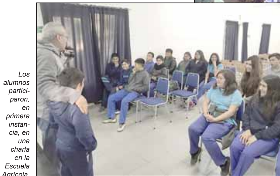
Los alumnos participaron, en primera instancia, en una charla en la Escuela Agrícola.