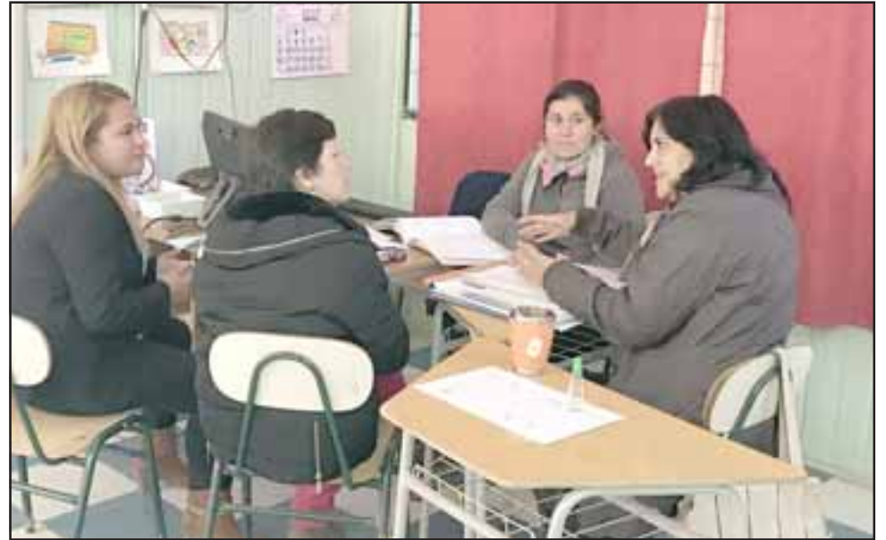
En el microcentro realizado el jueves pasado, participaron profesionales docentes de las Escuelas Carolina Ocampo, Heriberto Bermúdez y San Rafael.

En el microcentro realizado el jueves pasado parti-