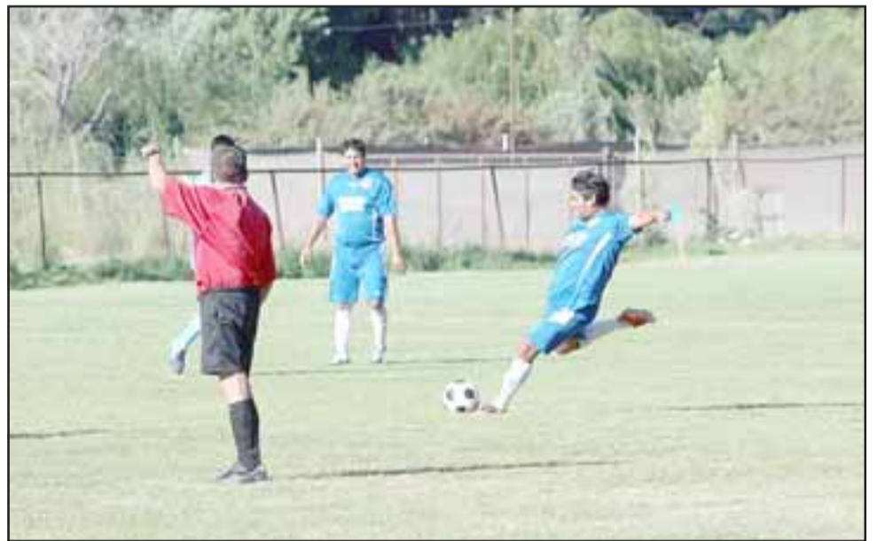
El torneo Cordillera ya conoce a tres semifinalistas en la zona alta y a los dos clubes que irán por el título en la zona B.

En la zona B las cosas están muy claras, ya que Valle Alegre de Calle Larga y el América de Putaendo accedieron al partido mayor de esta serie al imponerse respectivamente a Alberto Pentzke de San Felipe y Brille el Nombre de Calle Larga, los que el domingo dirimirán cuál es el mejor de esa categoría.