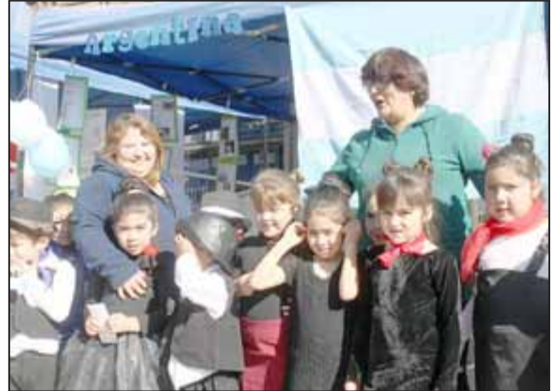
GRANDE COLOMBIA.- Ellos son los pequeñitos que representaron el stand de Colombia, sus bailes y comidas típicas.