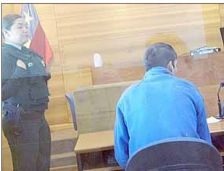
La víctima fue seguida desde el banco por los antisociales, uno de los cuales fue detenido por Carabineros (foto) gracias a que pudo ser identificado por las cámaras de seguridad municipales.

Este ilícito llegó a juicio oral donde finalmente los extranjeros fueron absueltos, pues no solo no se pudo acreditar la participación