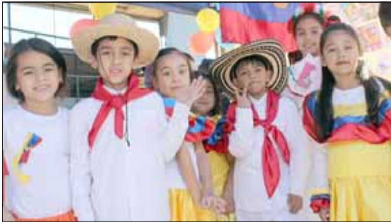
VIVE ARGENTINA.- Aquí están los reyes del Tango, los del stand argentino también se lucieron ayer en la escuela.