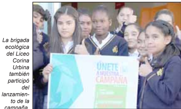
La brigada ecológica del Liceo Corina Urbina también participó del lanzamiento de la campaña.

tiva e hizo un llamado para que la comunidad sanfelipeña se sume al uso de bolsas reutilizables. «Me parece muy bien por el medio ambiente, todos tenemos que colaborar y ojalá después ni siquiera dieran bolsitas adentro para echar la fruta o la verdura, porque llega a dar pena de repente ver en las calles solamente bolsas. Yo vivo cerca de donde se hace la feria en Diego de Almagro y es horrible ver cómo queda la calle cuando termina la feria. Así que felicito a Unimarc y a la Municipalidad», concluyó la entusiasta vecina.