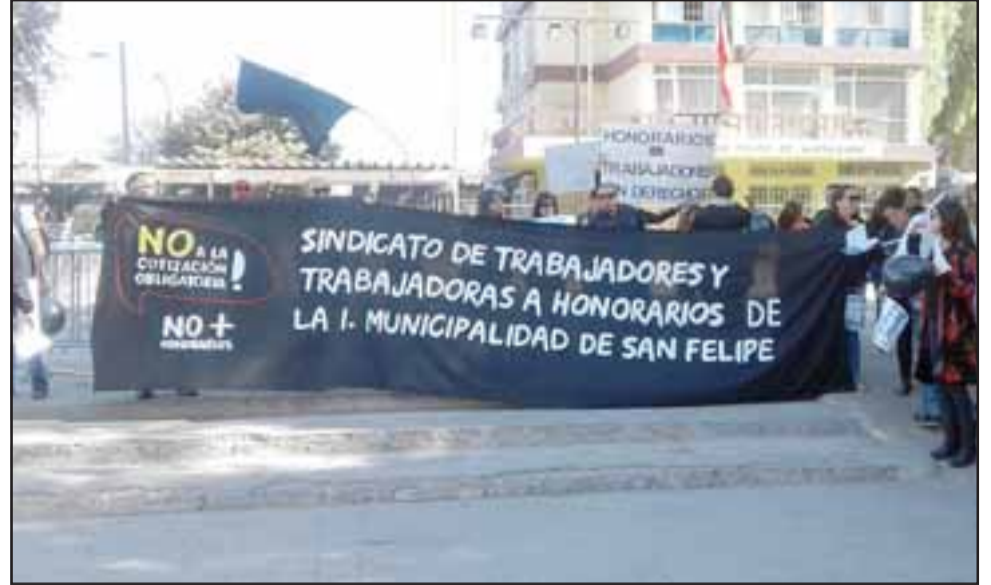
Los funcionarios movilizándose en plaza cívica de San Felipe.