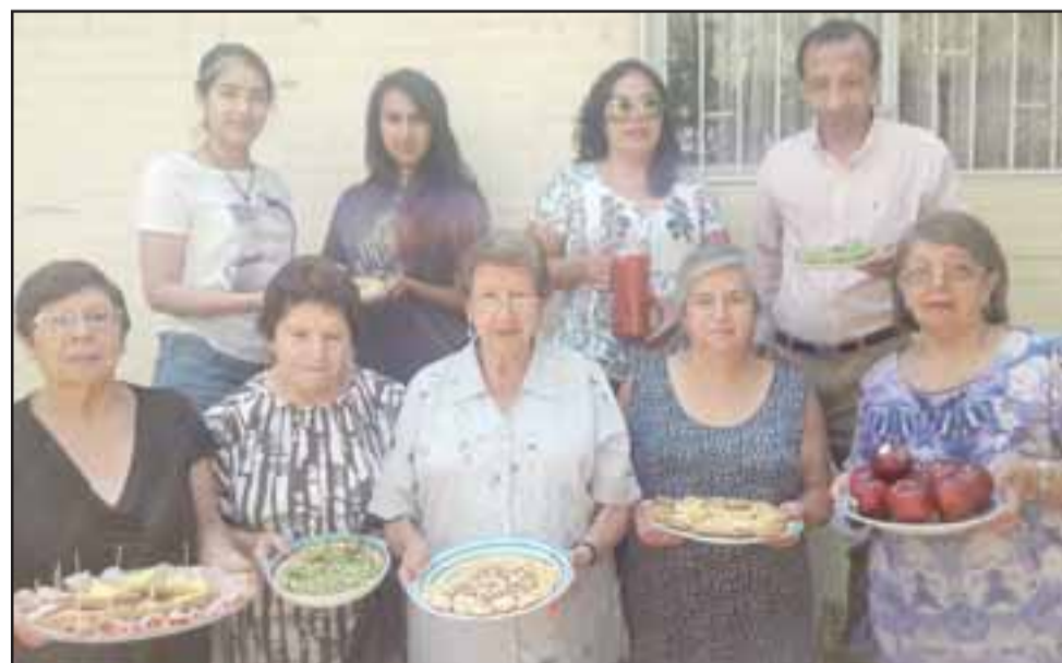
SABOR Y SALUD. - Estos son los ricos preparados naturales con los que estas vecinas trabajaron todos estos meses en el Taller.