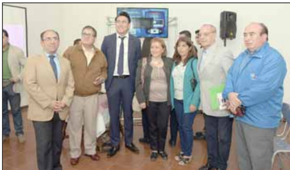
El lanzamiento de la plataforma para teléfonos se realizó en el Club San Felipe en conjunto con el Ministerio de Transportes y Telecomunicaciones y su división de Transporte Público Regional.

La plataforma creada en Chile se encuentra disponible vía web, en el sitio www.mimicro.cl , y también como aplicación para smartphones que posean el sistema operativo Android. La versión para el sistema IOS, se habilitará a partir de ju-