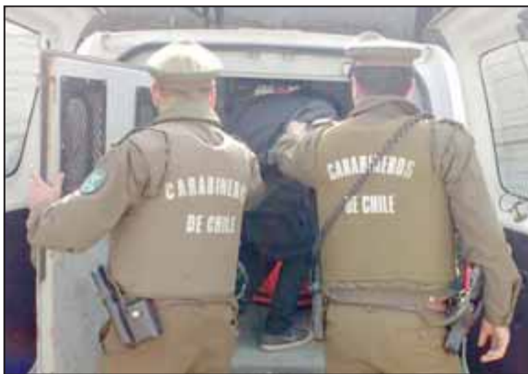
El imputado de 34 años de edad, fue detenido por Carabineros pasadas las 13:30 horas de este martes, sindicado como autor del hurto de prendas de vestir desde la tienda Tricot en San Felipe. (Foto Archivo).