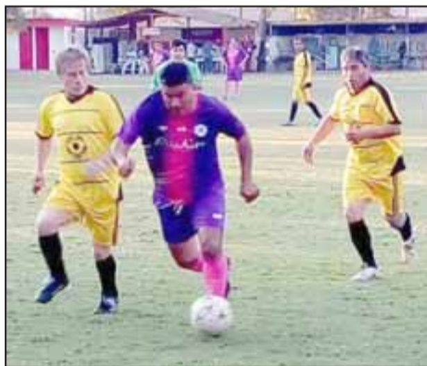
La fecha dos de la rueda de revanchas permitió que la parte alta de la tabla quedara muy estrecha.

El lance entre estos conjuntos dominantes en la cancha Parrasía terminó siendo favorable para Carlos Barrera al imponerse por 2 goles a 0. En otro enfrentamiento que asomaba como interesante en la jornada dominical, era el que animarían Aconcagua con Hernán Pérez Quijanes, a raíz que los aconcagüinos tenían una buena chance de acortar ventajas respecto a los líderes, pero no contaban que su ocasional rival cre-