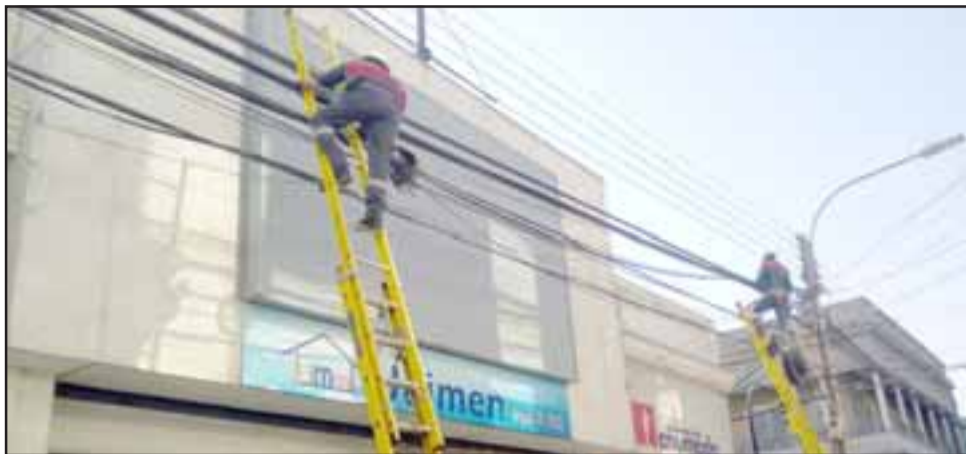
Aprovechando el cierre de calle Prat por la finalización de las obras del Boulevard, se ha continuado el proceso de amarre y retiro de cables en desuso en el centro de San Felipe.

Cabe recordar que la iniciativa nace a partir de la necesidad de generar una limpieza visual del tendido eléctrico, evitar accidentes, evitar molestias para muchos vecinos por los cables de baja altura y contribuir a que San Felipe sea una comuna más limpia y sustentable. En ese contexto, Achú aseguró que «lo que buscamos es despejar lo que más podamos, para dejar limpio al menos en el centro y dentro de las cuatro alamedas, donde existe mayor afluencia de público», aclaró el profesional, quien agregó que estas intervenciones se extenderán durante todo el 2018.