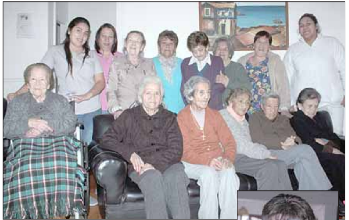
DÍA DE LA MADRE.- Ellas son las madres que celebrarán su día en el Eleam Andacollo hoy jueves al lado de sus familiares y cuidadores.

Nuestro medio habló con varias señoras del Hogar, ellas indi-