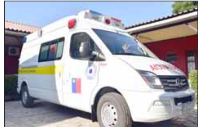
La flamante nueva ambulancia tuvo un costo de 36 millones de pesos financiados por el Consejo Regional.