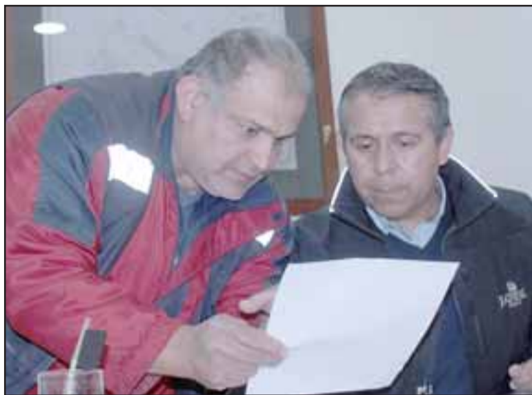
CONFIRMAN DENUNCIA. - La gerencia de Hotel Termas de Jahuel permitió a Diario El Trabajo revisar la denuncia ya en poder de la Inspección del Trabajo de San Felipe, contra este empleado, pero no el poder publicar el documento.

empleados asegurando que soy una mala empleada, también cuando yo busqué poner la denuncia, estos jefes desestimaron a mis testigos. Esta situación me tiene con licencia médica, ya que estoy muy afectada, me afecta poder hacer mi trabajo ante los clientes, porque somos la cara del hotel y debemos sonreír a los clientes, y en este caso todos ya han notado que estoy mal», dijo la joven empleada.