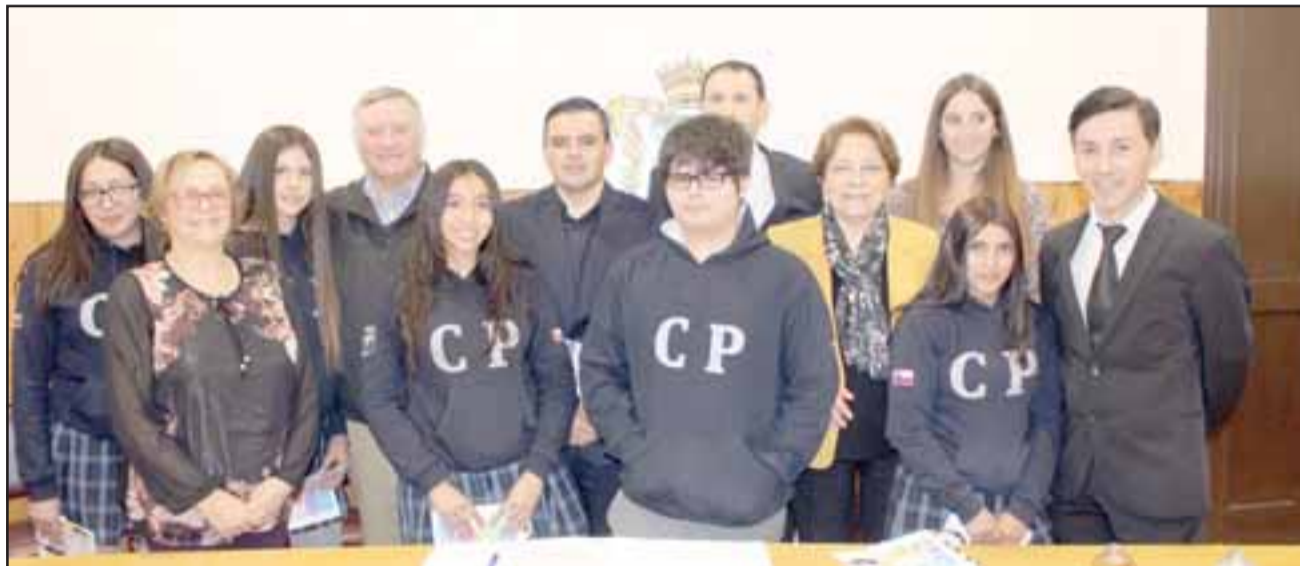
Un grupo de alumnos del Colegio Panquehue podrán ingresar de manera directa a la universidad, en cualquiera de sus carreras, después de un trabajo de dos años de preparación.

Iniciativa considera hacer un trabajo personalizado con 20 estudiantes del colegio para preparar su ingreso a la universidad, mientras estén cursando tercero y cuarto año medio.