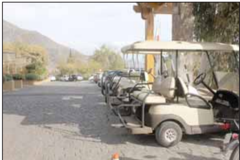
CENTENARIO HOTEL. - Este hotel tiene 106 años de existencia, y en los tiempos recientes no se conoce una situación como la que se investiga actualmente.