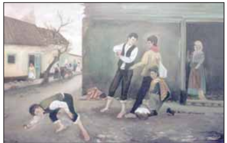
CHILE DEL AYER. - Aquí tenemos un paisaje urbano del Ayer, niños jugando con naturalidad, un Chile ya en el pasado.