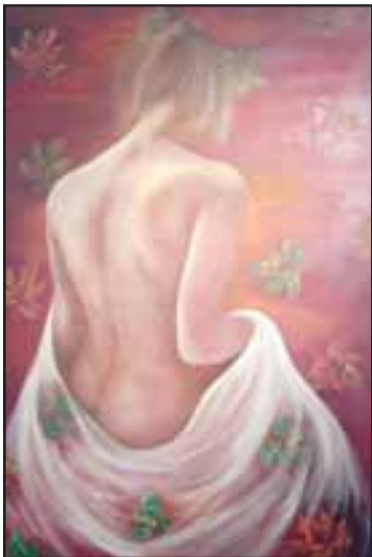
MUJER Y HOJAS DE PARRA. - Este óleo también es único, pues sólo este Desnudo hay en toda la colección.

«Son cuatro buenas pintoras las que están exponiendo durante todo un mes en el Ciem, tenemos óleos, espatulados, acrílico,