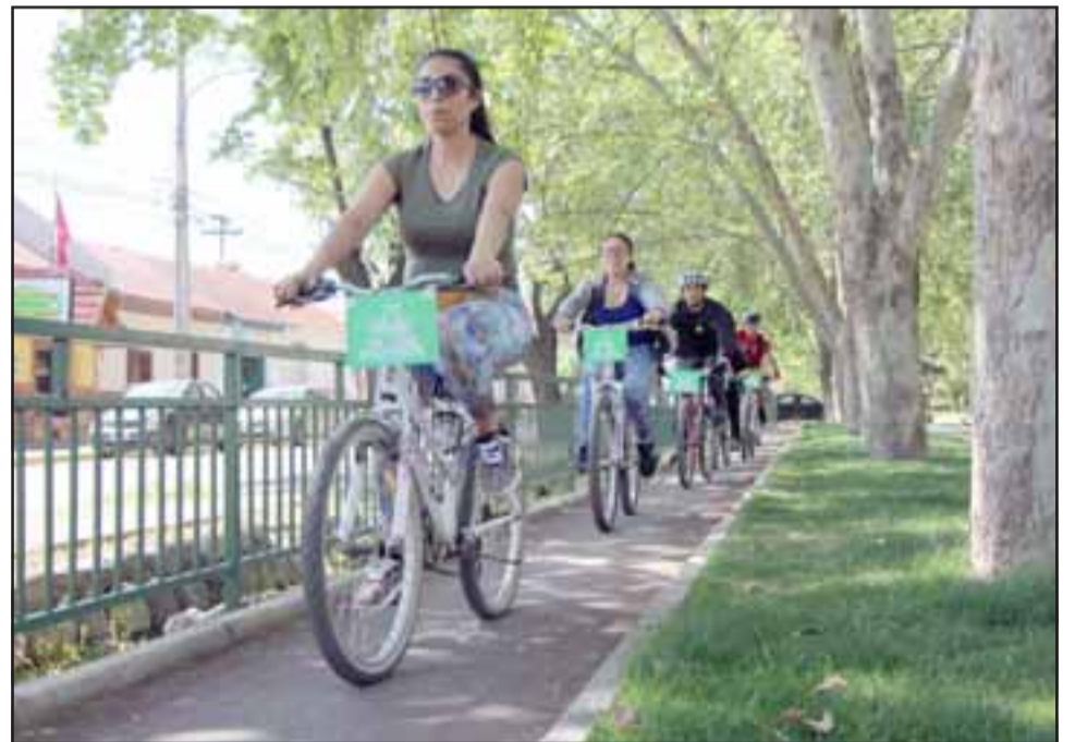
Diversos proyectos como las ciclovías han mejorado la calidad de vida en San Felipe.