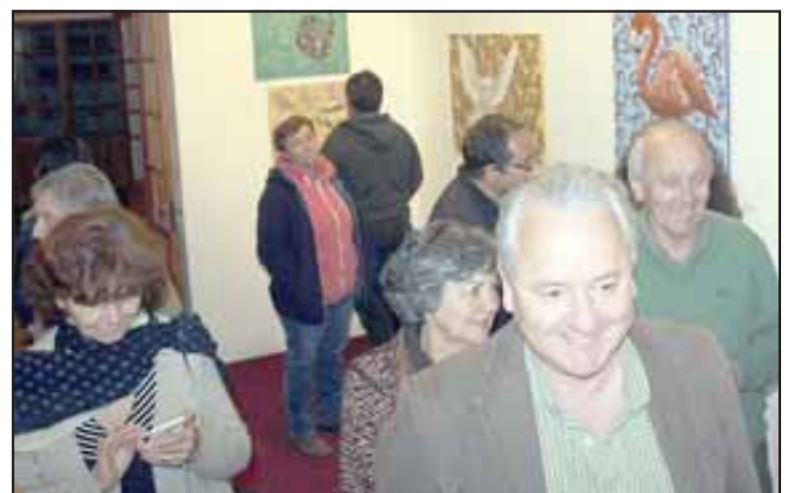
TODO UN MES. - Los invitados se mostraron agradados con la apertura de este gran montaje artístico del Ciem Aconcagua.