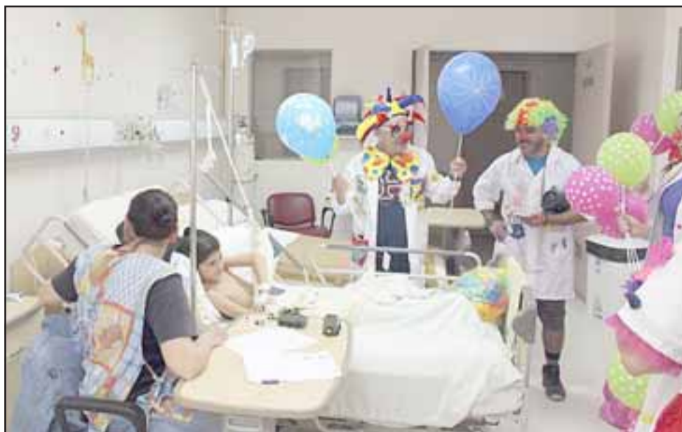
'Doctores de la Risa' agrupación sin fines de lucro en una de sus visitas a niños enfermos en los hospitales de la zona de Aconcagua.

"La idea es motivar a la gente para que de cierta forma dejen de tapar el abuso y la violencia que existe contra los niños, porque cuando pasa algo se ve afectado como en el caso de la niña que falleció hace poco, no es el único caso, hay muchos casos que no salen a la luz porque la gente no habla, entonces nuestra intención es como para motivar a la gente para que hable, no tenga miedo, hagan las denuncias ya que los niños no pueden hablar y expresarlo como corresponde, que sean los adultos en sí quienes alcen la voz por los niños, los cuiden y los defien-