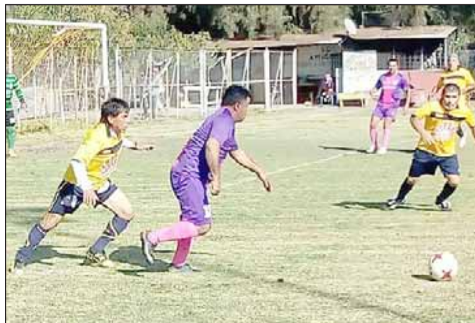
Tras jugarse otra fecha no hubo variaciones importantes en la tabla de posiciones de la Liga Vecinal.

Carlos Barrera 4 – Unión Esperanza 0; Villa Los Álamos 3 – Aconcagua 1; Unión Esfuerzo 2 – Hernán Pérez Quijanes 1; Resto del Mundo 1 – Andacollo 0; Tsunami 1 – Villa Argeña 0; Los Amigos 1 – Santos 0; Pedro Aguirre Cerda 1 – Barcelona 0.