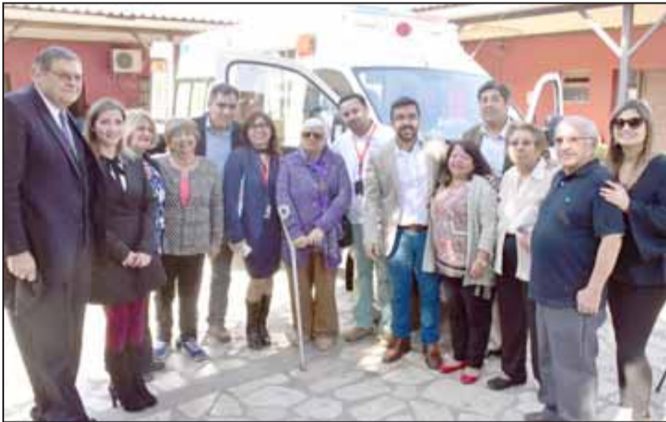
Autoridades junto a dirigentes sociales y usuarios del hospital posan felices junto a la nueva ambulancia.