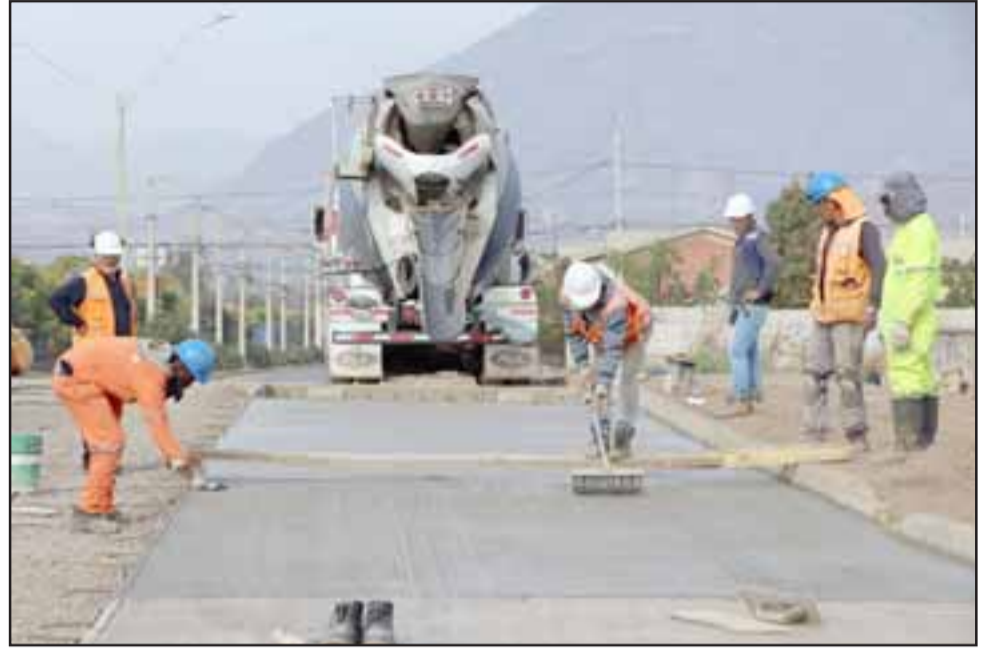
Los trabajos ya superan el 80% de avance por lo que muy pronto la conectividad San Martín y Avenida Hermanos Carrera Oriente será realidad.

«Hicimos una visita con los equipos técnicos de la Municipalidad porque sabemos que esta es una co-