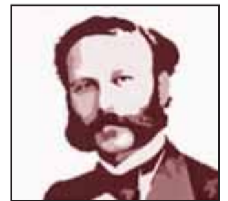
Henry Dunant, Fundador Cruz Roja.

Por último, es fundamental señalar su imparcialidad. La Cruz Roja no hace distinción alguna de nacionalidad, etnicidad, religión, condición social ni credo político. Se dedica únicamente a aliviar el sufrimiento de los individuos.