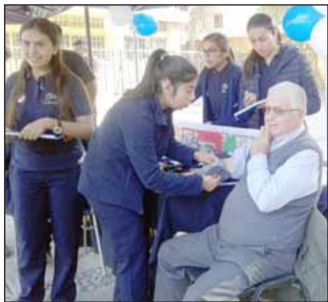
Una de las alumnas de pregrado de la carrera de Enfermería toma la presión a un transeúnte.

que hoy día el lema a nivel internacional es la salud como un derecho humano y en eso nosotras queremos ser súper tajante en el contexto de un entorno seguro, el tema de seguridad en nuestros usuarios, el tema de la contingencia que no podemos no estar ausente, en sí estamos preocupadas de nuestros usuarios, de la comunidad, es decir hoy no nos podemos enmarcar solamente como les decía, nosotros somos la ciencia y tenemos la convicción de que somos la ciencia, el arte, y la acción de cuidar, el médico cura, nosotros cuida-