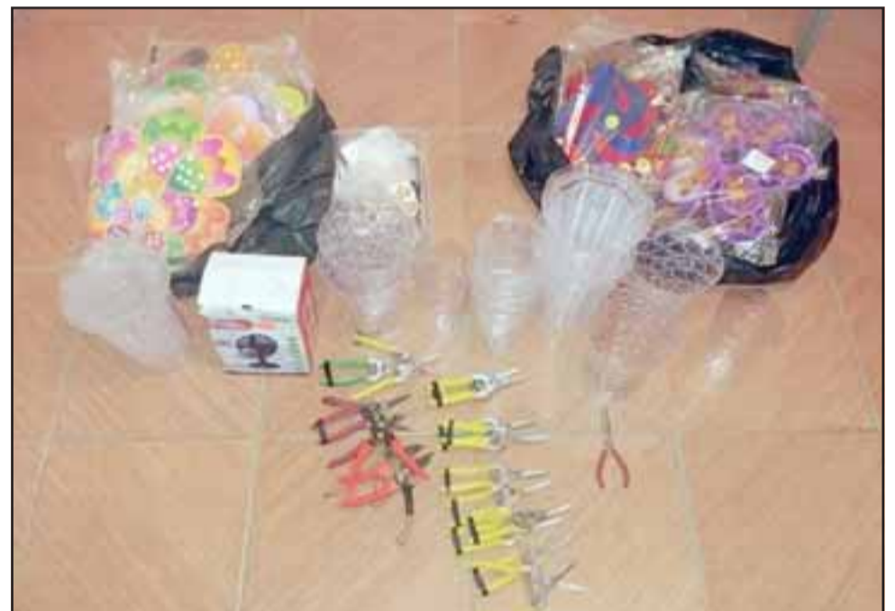
Las especies fueron recuperadas por Carabineros para ser regresadas a la comerciante afectada.