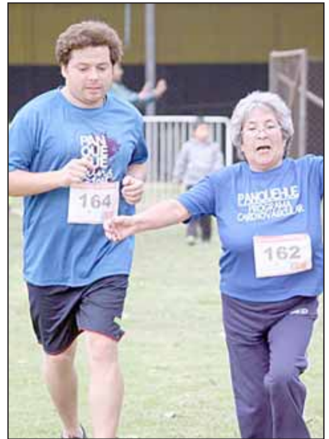
Una activa participación tuvieron los adultos mayores de Panquehue que participan de los programas de salud del Cesfam, en la media maratón realizada en Catemu.

Cabe recordar que el Cesfam de Panquehue, de manera anual efectúa corridas y cicletadas que tienen una alta participación de la comunidad local.