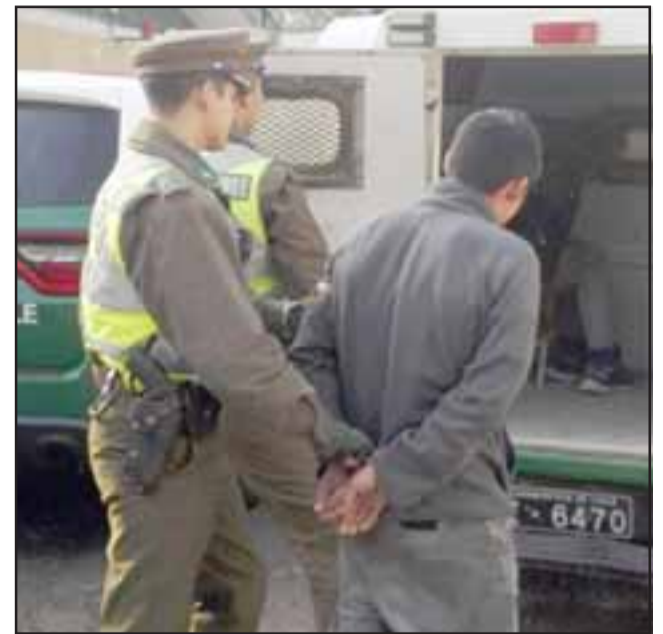
La pareja delictual fue detenida por Carabineros de la Tenencia de Santa María.