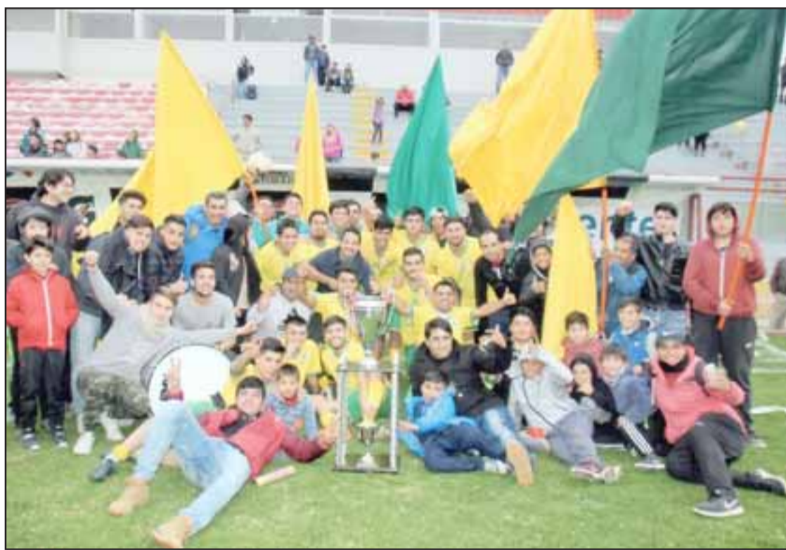
El club Central de Putaendo se convirtió en el mejor de todos en el torneo de la Amistad.