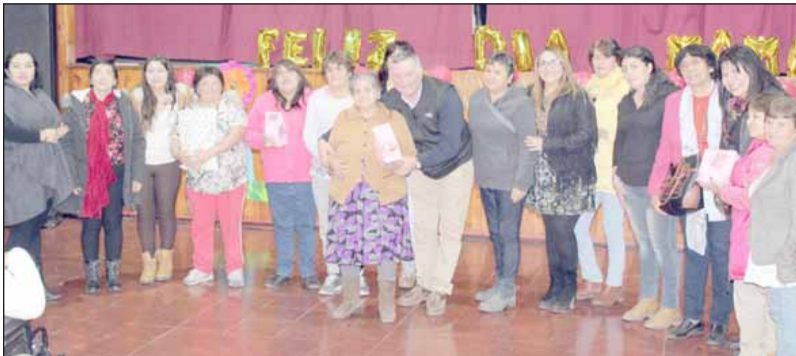
Con la presentación de artistas locales la Municipalidad de Panquehue estuvo celebrando y saludando a las madres en su día.

Fue en la Sala Cultural de la comuna de Panquehue, que madres de todos los sectores de Panquehue, recibieron un homenaje con un show con artistas locales.