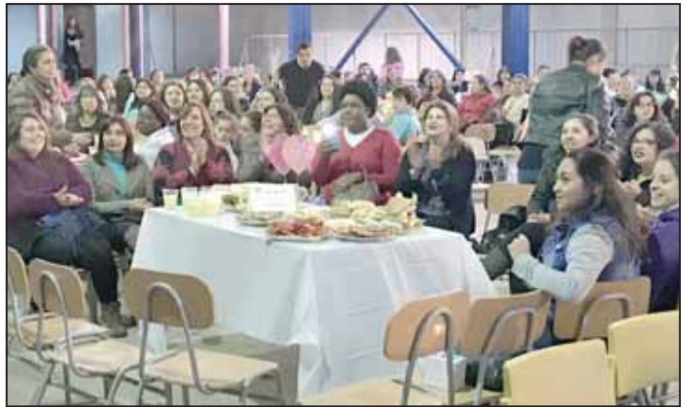
Tanto las mamás de básica como de media y las mamás profesoras celebraron su día en una actividad organizada por los centros de alumnas y de padres.

“En todo aspecto, es transversal, siempre va a estar la madre, para el desarrollo académico, para el desarrollo social, nosotros tenemos niñas de pre kínder a cuarto medio, por lo tanto, la mamá siempre va a estar presente y nosotros decimos, también pensando en ellas en un futuro, en un rol como madre, que puedan adquirir esta experiencia y relevar el rol