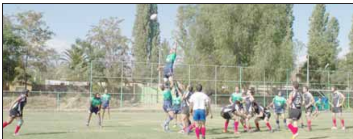
Una buena presentación cumplió la escuadra de los Halcones de Aconcagua en la Liga Arusa.