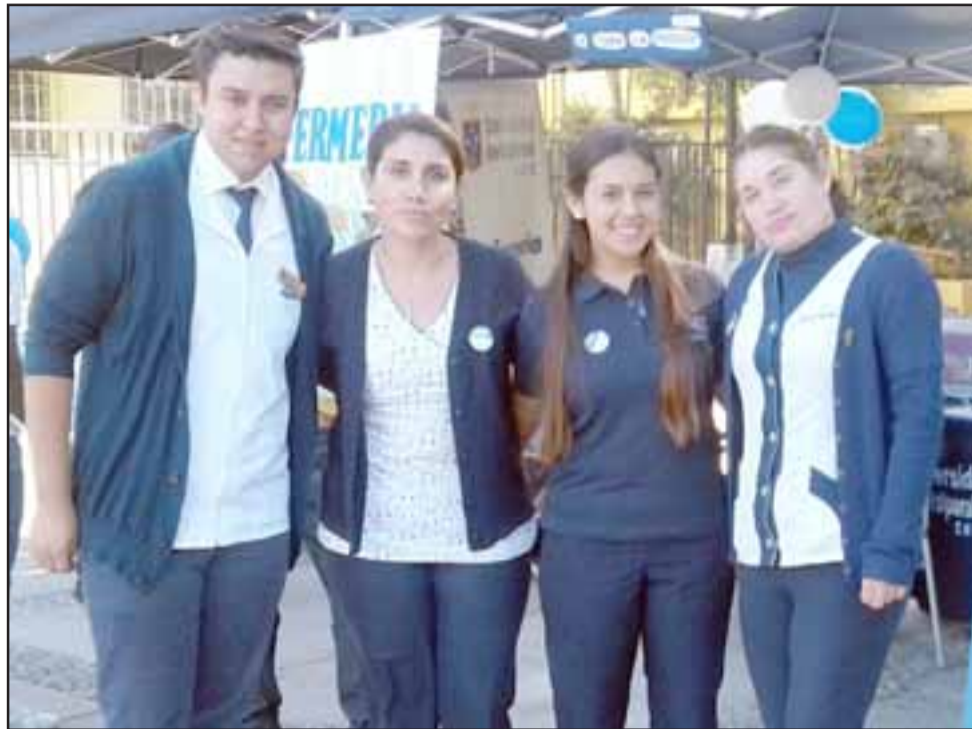
Acá podemos apreciar a estudiantes y las representantes regional y local del Colegio de Enfermeras.

- En la Quinta Región, colegiadas, somos más de mil activas, sin contar las jubiladas que ellas hasta que fallecen son parte del colegio, estamos en un proceso porque antes era obligatorio colegiarse, hoy en día no es obligatorio para todos los colegios en sí, por eso la idea es visualizarse, ahí ha habido una baja porque no había una tendencia a colegiarse, pero como te digo somos más de mil con enfermeras colegiadas con sus cuotas al día, la verdad es