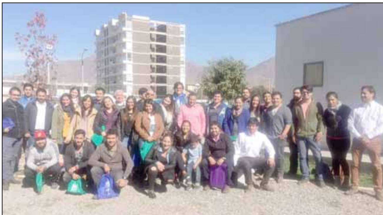
Con actividades académicas y de camaradería, unos cincuenta profesionales pertenecientes a los diferentes establecimientos de la red de salud, festejaron en dependencias de la Universidad Aconcagua el Día de la Kinesiología.

Con un gran ambiente de festejo, los profesionales de las provincias de San Felipe y Los Andes realizaron una nueva conmemoración del día de su profesión, el que incluyó actividades académicas y de camaradería que permitieron relevar su rol en los equipos de salud y proponer nuevas iniciativas de desarrollo.