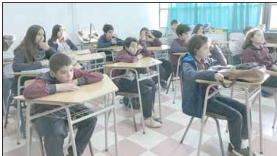
La academia Explora corresponde a un taller en el que están participando alrededor de 15 niños, en forma voluntaria, quienes están trabajando un programa de investigación a través del método científico.

«Si hay un insumo, donde hay una academia con una asesoría gratuita de científicos que son profesores universitarios, muchos de ellos doctores en la especialidad; si hay una universidad detrás, que es la Uni-