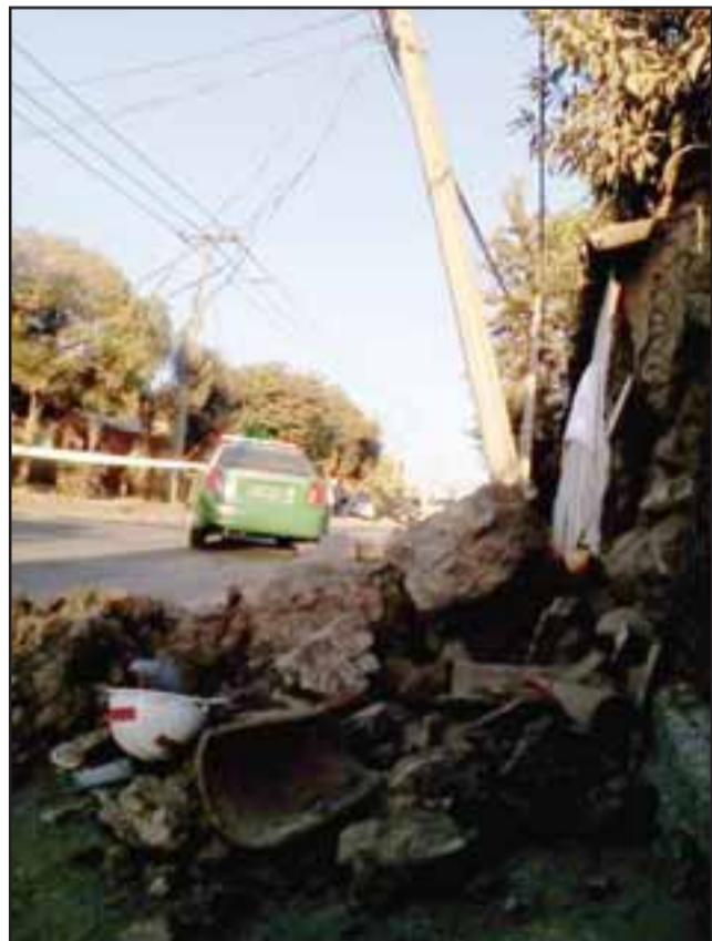
PUDO SER PEOR.- En esta pared perimetral chocó la camioneta, para rebotar y volcar aparatosamente en el pavimento.

Un aparatoso accidente ocurrió la tarde de ayer miércoles en Curimón, a la altura de Los Naranjos, entre los paraderos 10 y 11, cuando la camioneta TF 30 39, impactó violentamente contra el muro perimetral derecho, subiendo hacia Los Andes, impacto que ocasionó serios daños a un poste del tendido eléctrico.