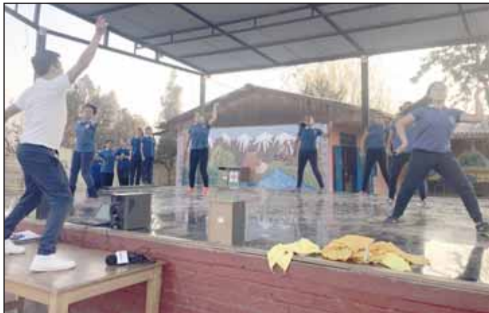
El taller de Danza, otra de las expresiones artísticas que ofrece la Escuela República Argentina a sus alumnos.

En octavo básico también registraron un aumento en el puntaje, logrando en lenguaje 245 puntos, a diferencia de lo logrado el 2015 que fueron 237 puntos, mientras que en matemáticas lograron 227 puntos el año 2016, a diferencia de los 202 puntos que obtuvieron en el año 2015.