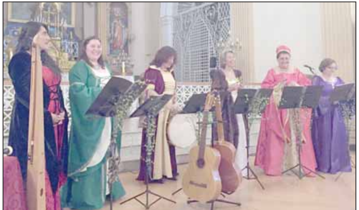
A LA ANTIGUA.- Camerata Aconcagua estará los dos días posando con los visitantes para sus fotos 'antiguas', con vestimentas especiales, habrá una impresora y quienes quieran comprar su foto, lo podrán hacer.

Según explicó Chopitea, también habrá una sección muy especial para los amantes de recuerdos, pues los artistas de Camerata Aconcagua facilitaron toda su instrumentaria a fin de que los visitantes se hagan retratos a la antigua, para ello prepararon un set. «Desde las 11:00 a las 17:30