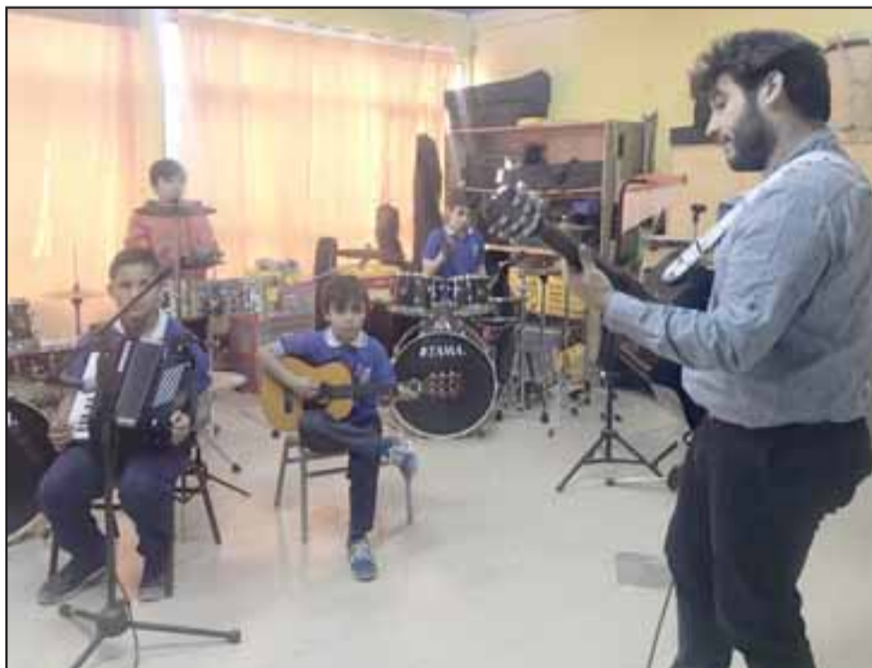
Entre los talleres que se realizan en la escuela, destaca el taller de música que se divide en vientos, de rock, música latinoamericana y el taller de cámara infantil.