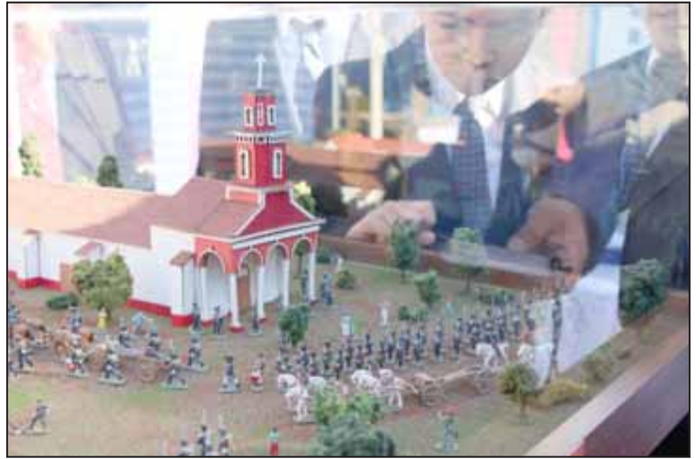
La atractiva e interesante obra fue confeccionada por el artista sanfelipeño Marcelo Segovia y tomó más de tres meses en su realización.

Esta entrega sólo es una de las actividades programadas para el día del patrimonio, que finalizarán el próximo lunes, pero que tendrá una serie de eventos culturales durante el fin de semana, destacando entre ellos la celebración de este día que se llevará a cabo el próximo domingo, a partir de las 11.00 horas, en la terraza de la Plaza de Armas. Junto con ello, también habrán exposiciones, visitas guiadas.