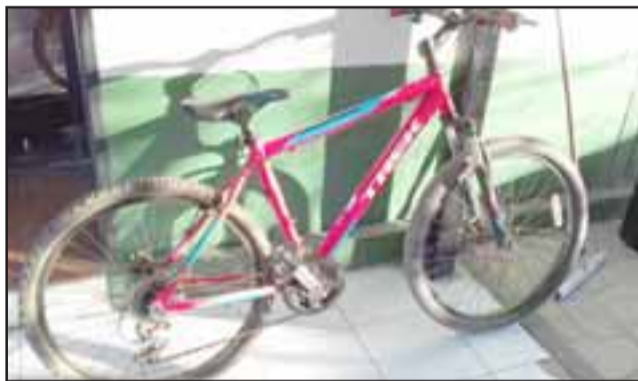
Carabineros recuperó esta bicicleta avaluada en $800.000 entre otras especies robadas a dos locatarios de la comuna de Santa María.