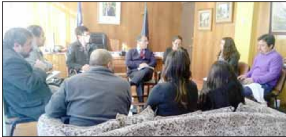
Diferentes servicios públicos estuvieron presentes en la reunión realizada en la Gobernación para comenzar a desarrollar el Plan de Invierno 2018 para las personas en situación de calle.

Por otra parte, el gobernador Rodríguez expresó su satisfacción por la rápida solución que se entregó a los estudiantes, padres y apoderados del Colegio Santa Juana de Arco por las agresiones que sufrían las alumnas de dicho establecimiento de parte del 'Socito' y de la tenencia responsable de