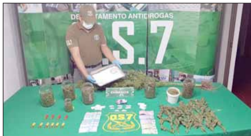
Personal del OS7 de Carabineros Aconcagua incautó marihuana en cogollos, pasta base de cocaína, municiones y dinero en efectivo desde el inmueble del imputado en el sector Hacienda de Quilpué en San Felipe.