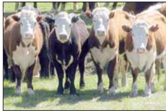
La '2ª Expo Feria Ganadera Indap Los Andes' se realizará este sábado a partir de las 10:00 hrs. en la Medialuna del Club de Huasos de la comuna de Rinconada.

Esta segunda feria ganadera de la región es organizada por Indap y cuenta con la colaboración del