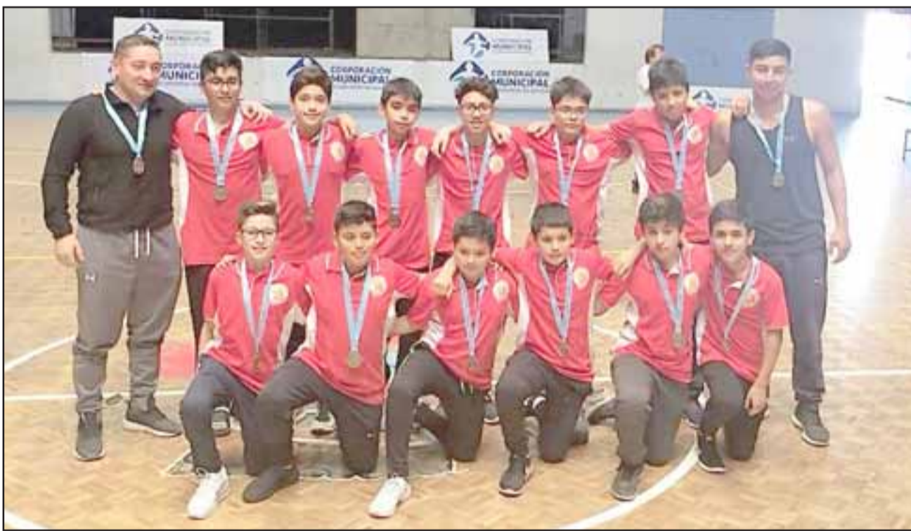
El equipo U13 de San Felipe Basket quedó cuarto en un torneo realizado en Iquique.

Naranjo destacó el hecho que su escuadra lograra meterse en el cuarto lugar del torneo: “Jugamos todos los partidos que tuvimos la oportunidad de disputar. Partiendo con Vallenar, el cual ganamos por 13 puntos, después vencimos a un equipo Iquique muy fácil, el tercero contra Dragones lo perdimos y quedamos segundos en nuestro grupo, por lo que jugamos la semifinal con Providencia, que la verdad tiene un gran equipo y nos venció bien; pero más allá del resultado y posición final, todo fue muy entretenido”, afirmó el monitor.