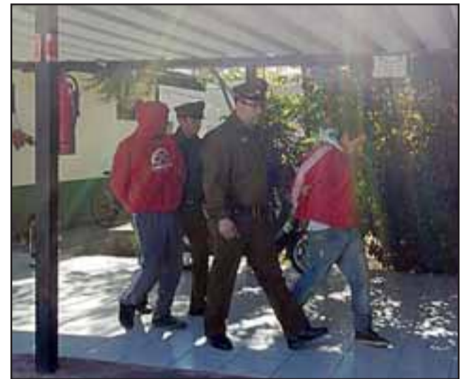
Los detenidos por Carabineros de Santa María quedaron a disposición de la Fiscalía por el delito de robo en lugar no habitado.

Las diligencias policiales continuaron hasta la Población Los Héroes de esa comuna, siendo detenida una mujer de 58 años de edad de iniciales M.R.M. , quien mantenía bandejas de carne y champiñones, siendo trasladada hasta la unidad