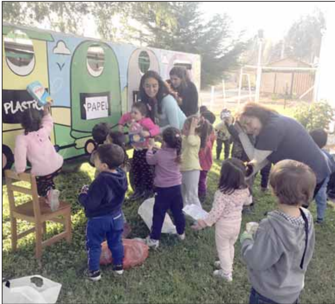
El Trencito Reciclador está recorriendo los jardines infantiles que son parte del comité ambiental comunal, donde han tenido una muy buena recepción de parte de los niños.

Iniciativa es parte de las actividades que está realizando la Municipalidad de San Felipe, a través de su programa de reciclaje.