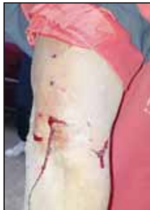
Así quedó el brazo del denunciante, él asegura que fue mordido por un perro de la insigne institución policial.

mente involucrados, pero pese a que fuimos personalmente a solicitar una respuesta y dejamos tarjeta de contacto, las autoridades policiales guardaron silencio.