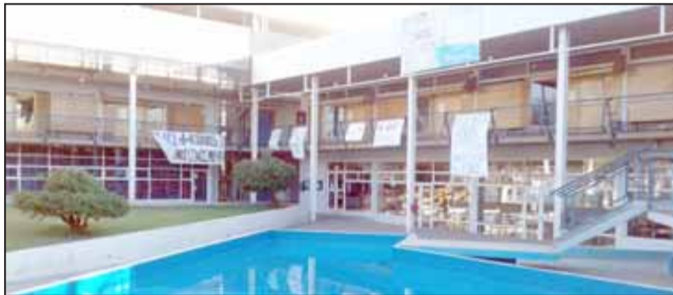
Pancartas alusivas a la toma en el interior de la Upla con los principales puntos en conflicto.

Esperan en su momento poder convocar una marcha junto a las compañeras de la Universidad de Valparaíso.