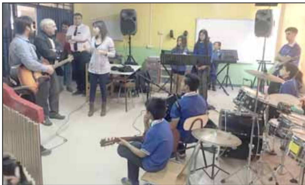
Una 'caminata pedagógica' por los distintos talleres artísticos que se realizan en la Escuela República Argentina de El Tambo, realizó el alcalde Patricio Freire Canto, para ver los avances que han registrado los alumnos en las distintas áreas.