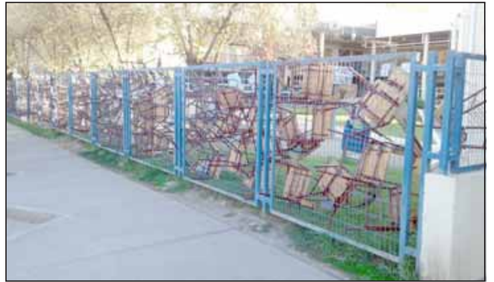
Las tradicionales sillas volvieron a ser puestas cierre perimetral de la Universidad, dejando en claro la toma por parte de un grupo de 25 alumnas.

- El fue desvinculado de la universidad y no está recibiendo sueldo hoy en día por haber sido sumariado en el sector público no puede ejercer clases ni docencia ni trabajar en el sector público por cinco años, eso fue todo lo que resultó de toda la investigación, además los antecedentes fueron recepcionados, tengo entendido por la Contraloría General de la República, quienes tienen que velar porque los procesos tienen que estar en los tiempos establecidos por la ley, lo otro que tenemos entendido es que hubo antecedentes contundentes de hechos grabaciones y testimonios bien fuertes de las afectadas y víctimas, creemos que por eso él sale culpable o sea no es llegar y desvincular a alguien de la Universidad y también por nuestra acción del 2016 de manera organizada con los es-