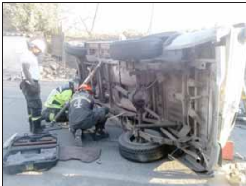
SE DIO A LA FUGA.- Así quedó la camioneta a la altura de Los Naranjos, en Curimón, luego de volcar para evitar chocar de frente contra otro auto.

Bomberos hizo extracción de dos mujeres, quienes fueron trasladadas al Hospital San Camilo por personal del Samu. Por más de dos horas el tránsito fue desviado por calle San Francisco.