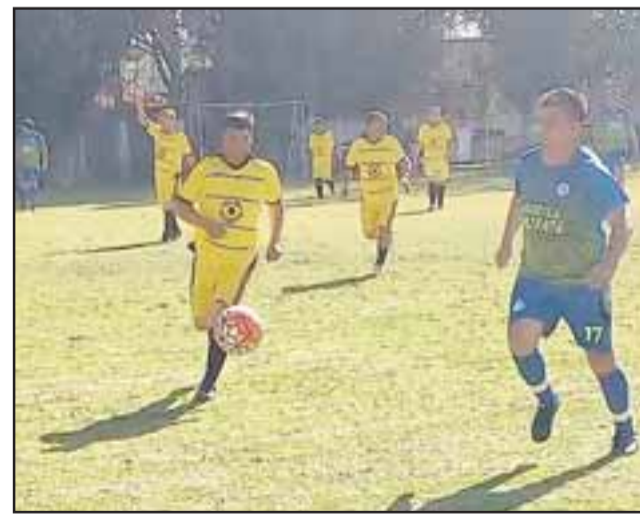
Con más trabajo del esperado los cuadros dominantes de la Liga Vecinal sacaron adelante los duelos de la fecha pasada en Parrasía.

Tsunami 5 – Resto del Mundo 0; Santos 3 – Aconcagua 1; Carlos Barrera 2 – Andacollo 0; Pedro Aguirre Cerda 2 – Unión Esperanza 1; Villa Los Álamos 2 – Villa Argelia 1; Hernán Pérez Quijanes 2 – Los Amigos 1; Unión Esfuerzo 2 – Barcelona 1.