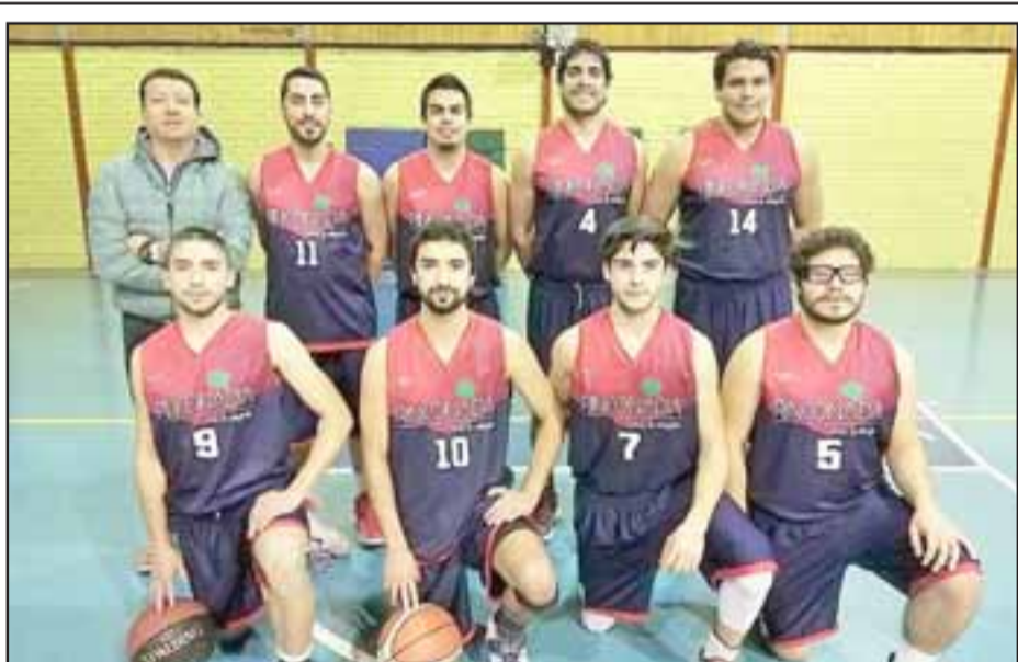
El quinteto de Rinconada cerrará la tercera jornada del torneo Abar.

La largada de la maratón será a partir de las 9 de la mañana desde la plaza de armas, para posteriormente tomar el camino a Los Molles, hasta la comuna de Santa María, desde donde los corredores deberán regresar hacia el centro de San Felipe.