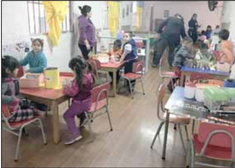
En estos momentos, el jardín mantiene cupos en la sala cuna menor, donde están los más pequeños y en la sala cuna mayor, mientras que los niveles medios y transición ya están con los cupos completos.

sus niños van a estar bien, van a aprender, van a alimentarse adecuadamente y nuestro jardín es grande, amplio para recibir a todos quienes quieran ser parte de él”, sostuvo la directora.