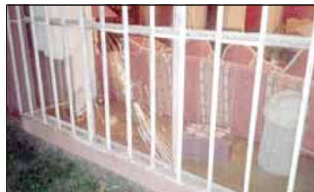
El vidrio de una de las ventanas fue quebrado por el o los antisociales que ingresaron a la vivienda.