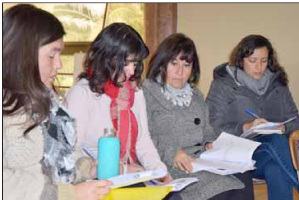
TRABAJO DE EQUIPO. - Cada uno de los participantes aporta trabajo investigativo, conocimiento, estadística, entrevistas e ideas para llegar a la meta.

gamos que 'quitan espacio'; 'quitan empleo'; 'tienen otra cultura'; 'que sus formas y cultura alteran nuestras tradiciones' y precisamente es sobre eso de lo que hemos discutido, para saber hasta qué punto hay un tema de mito en todo eso, hasta qué punto tiene que ver en que la misma comunidad de San Felipe y en general en Chile, los organismos e instituciones públicas no tienen todas las competencias y capacidades de responder a esa diversidad, y por lo tanto lo que buscan estos Pilotos de migración y el de Adulto Mayor, es reconocer la diversidad, mejorar competencias y habilidades para responder a esta diversidad. Roberto González Short