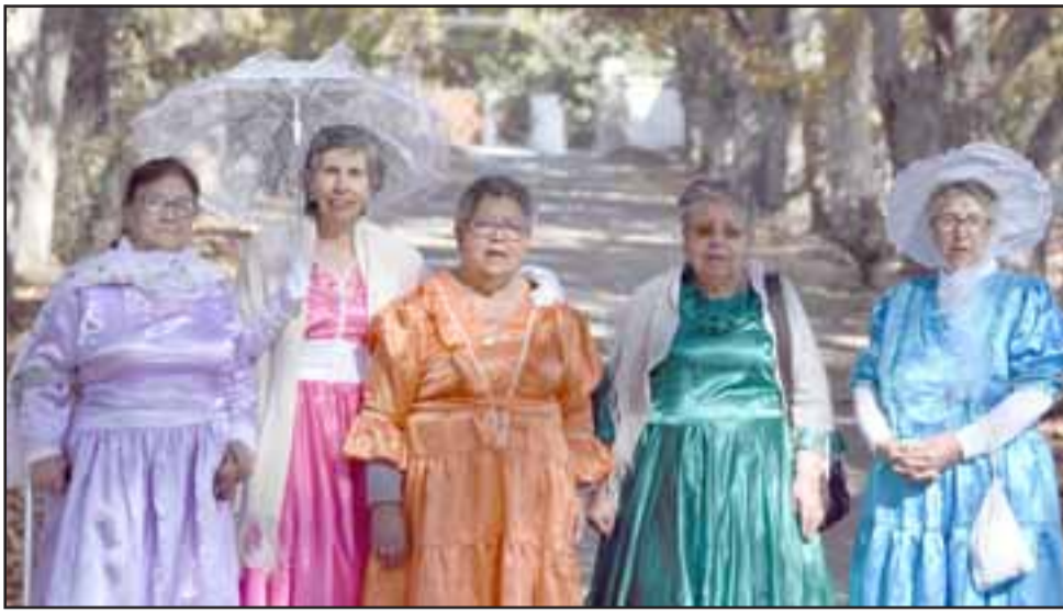
BAÑOS DE LA HIGUERA. - Aquí tenemos a los vecinos disfrutando en Los Baños de La Higuera, ya no está en uso público pero sigue siendo de un particular.