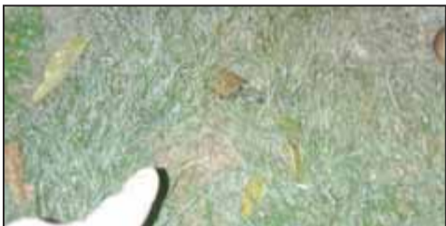
El candado de una de las puertas quedó tirado en el césped como mudo testigo del robo.

En cuanto a la PDI, indicó que ella le preguntó si podían sacar huellas de unos elementos que había en el interior, como un cuchillo cocinero encima de un sillón del living, recibiendo como respuesta que esto no es como en las películas, llegar y tomar huellas, que se debe comparar, es todo un tema técnico.