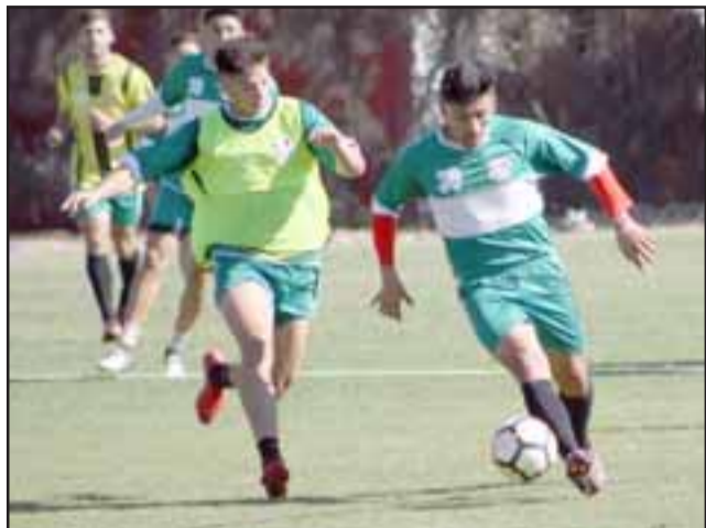
Para el cuadro sanfelipeño es muy importante cerrar con un triunfo la primera rueda del campeonato.

Con el fuerte envión anímico que le entregó su triunfo de la semana pasada ante Puerto Montt en el sur, Unión San Felipe llega en un excelente pie al juego de mañana con Rangers de Talca, duelo en el cual los albirrojos se despedirán de la primera rueda del campeonato.