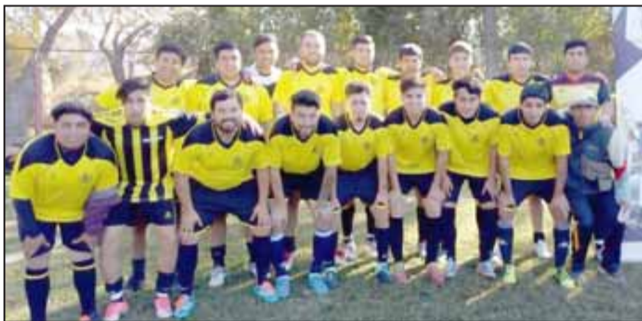
En la final del torneo, la Tercera del Santa Rosa se impuso por 2 a 1 a Pobladores.

Debido a la trascendencia e importancia de su logro, es que en El Trabajo Deportivo quisimos rendir un homenaje a la institución santamariana, poniendo en nuestras páginas a sus series Tercera y Sénior, las que en la jornada final se impusieron a Pobladores, otorgando con ello puntos fundamentales que después se tradujeron en la obtención del título del respetado y reputado torneo Cordillera.