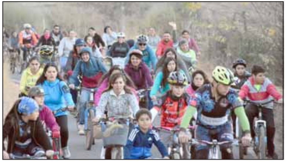
TREMENDA CICLETADA. - Cientos de vecinos de todas las edades disfrutaron al aire libre de esta cicletada familiar por distintos sectores de Santa María.