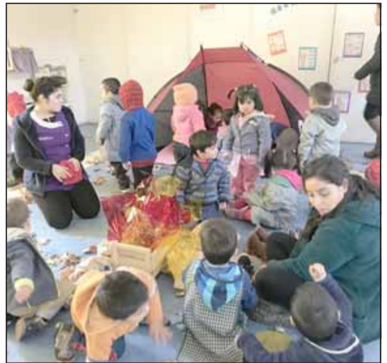
Las educadoras realizan actividades lúdicas para los niños, para que aprendan a través del juego libre, donde los adultos solo intervienen cuando los pequeños lo necesitan.