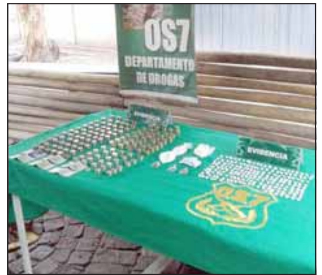
El operativo ejecutado por el OS7 de Carabineros Aconcagua incautó desde el domicilio del actual sentenciado en la Villa Departamental de San Felipe, pasta base de cocaína y marihuana elaborada.

A más de un año de los hechos descritos, el imputado fue enjuiciado esta semana en el Tribunal Oral en Lo Penal de San Felipe, siendo declarado culpable de este delito luego de las pruebas rendidas por la Fiscalía.