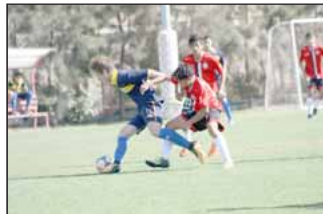
El sábado los cadetes albirrojos chocarán con sus similares de La Calera.