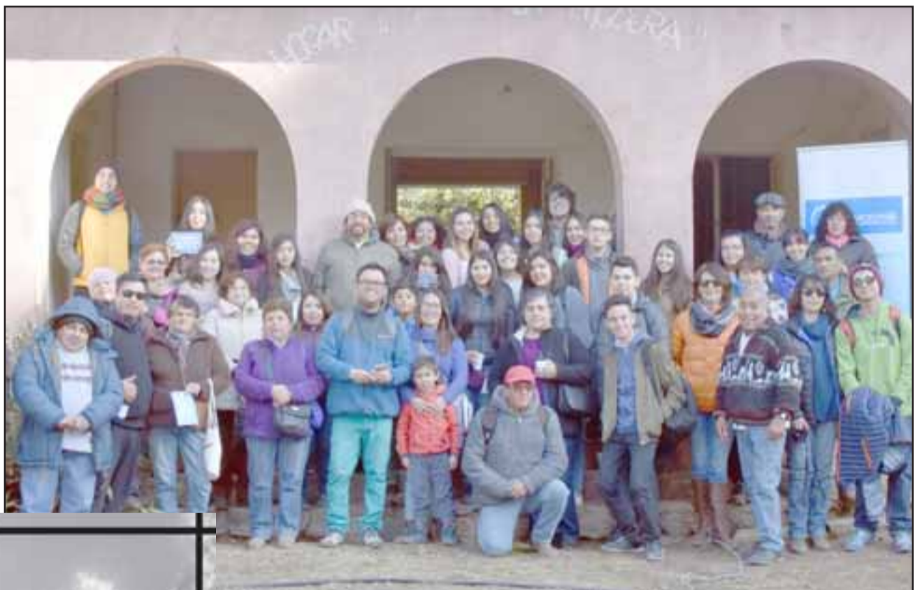
A LA ANTIGUA. - Ellas forman parte del elenco del Centro Adulto Mayor El Atardecer de Calle El Medio.