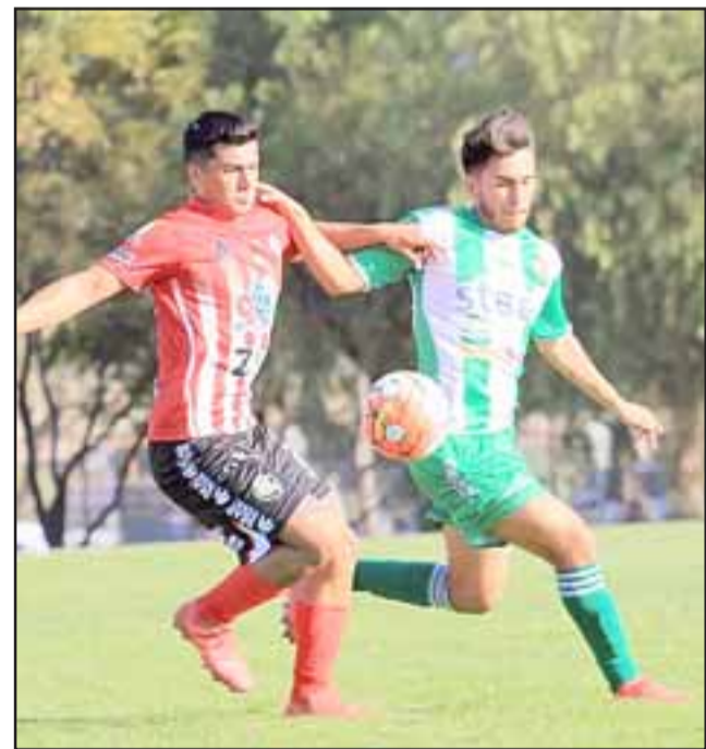
En el Regional de Los Andes los andinos intentarán volver al triunfo.

Tres mil pesos es el valor que la dirigencia del 'Tra' dispuso para el juego sabatino, aunque los hinchas que adquieran sus boletos con anticipación solo deberán cancelar $ 2.000 (dos mil pesos). Para eso deben acercarse hoy viernes a la secretaría del club en horario de oficina.