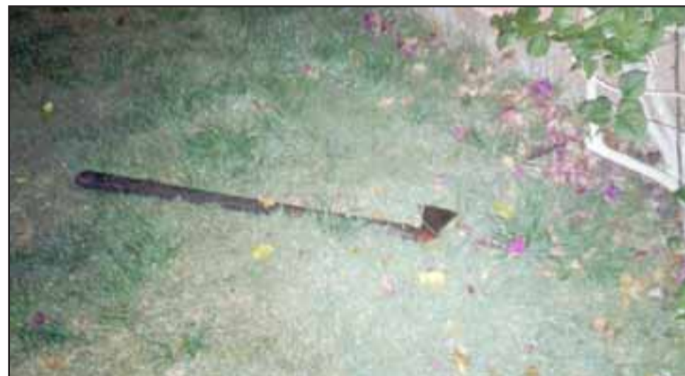
Con esta hacha se supone que el o los delincuentes rompieron el vidrio y cortaron un candado para entrar al inmueble.