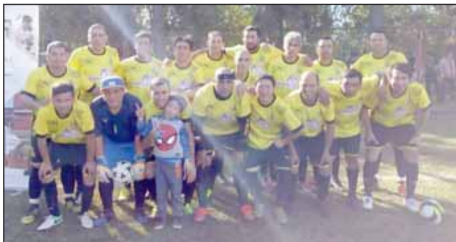
La serie Sénior de Santa Rosa aportó con un triunfo por la cuenta mínima.