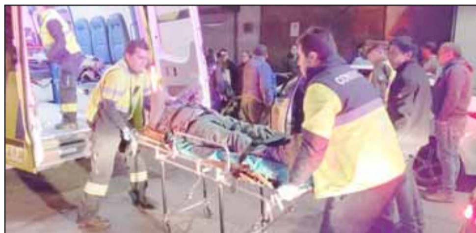
El taxista lesionado fue asistido por el personal de Samu la tarde noche de este viernes.