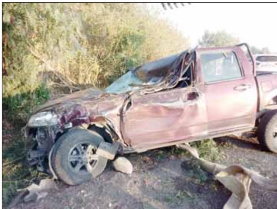
El accidente ocurrió la tarde de este viernes en la comuna de Santa María.