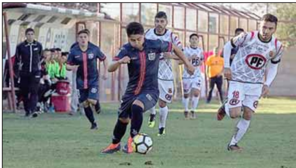
En una actuación redonda Unión San Felipe venció 2 a 0 a Rangers en el Municipal.

del conjunto sanfelipeño, en el cual también se asumía que la forma en que se lograra ese objetivo era importante, ya que es un hecho de la causa que los de Lovrincevich han evidenciado notables avances en su forma de jugar y encarar las últimas fechas de la fase fi-