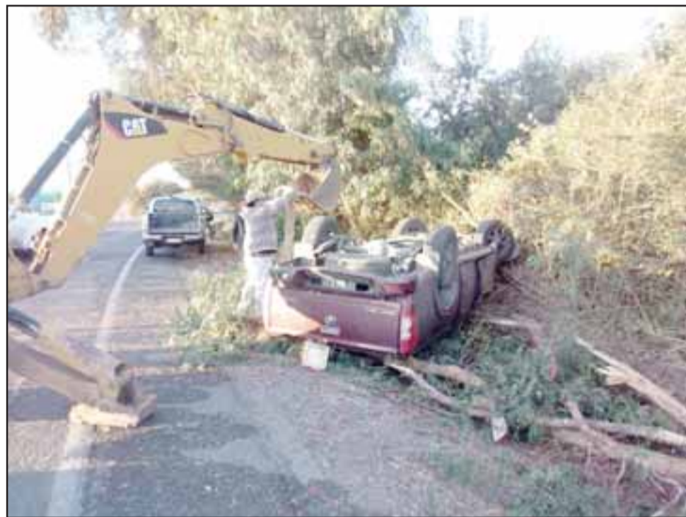
La camioneta terminó volcada a un costado de la ruta en Calle Jahuel de Santa María.

Conductor no habría respetado señal Pare