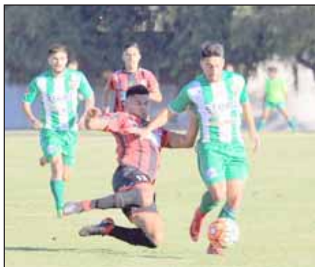
Trasandino no pudo superar en casa al luchador equipo de Rancagua Sur.

Por la octava fecha del torneo A de la Tercera División chilena, Trasandino no pudo superar al conjunto de Rancagua Sur, en el cotejo que durante la tarde sabatina tuvo lugar en el Estadio Regional de Los Andes.