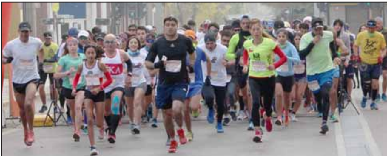
LA CREMA DEL ATLETISMO.- Unos 200 deportistas de varias partes del país se dieron cita en el centro de San Felipe para correr este domingo la primera Media Maratón Diario El Trabajo, organizada por Aconcagua Runners y patrocinadas por varias empresas de la comuna.