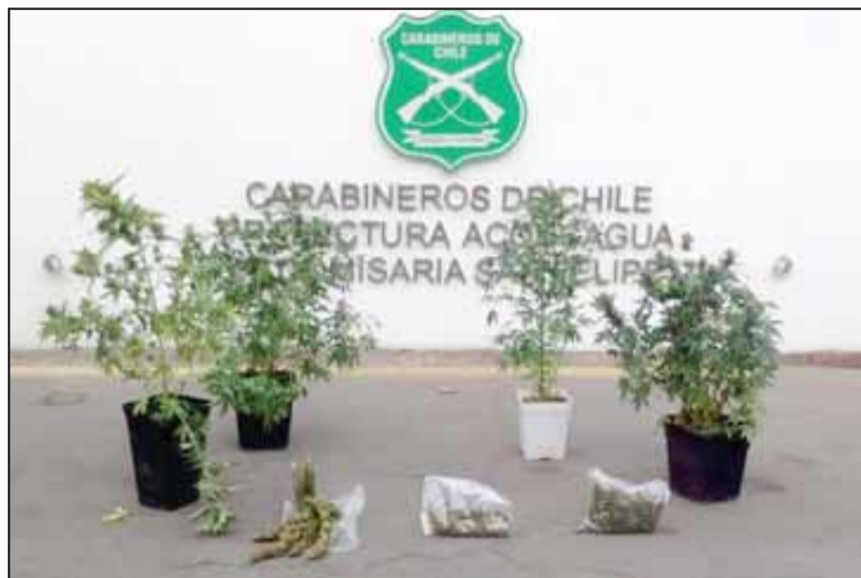
Personal de la SIP de Carabineros de San Felipe incautó el cultivo ilegal y más de 700 gramos de marihuana en el sitio del suceso.

Al mismo tiempo Carabineros recibió a Nivel 133 la denuncia de la víctima, señalando lo ocurrido, trasladándose unidades policiales hasta el sitio del suceso, iniciándose las primeras investigaciones del caso.