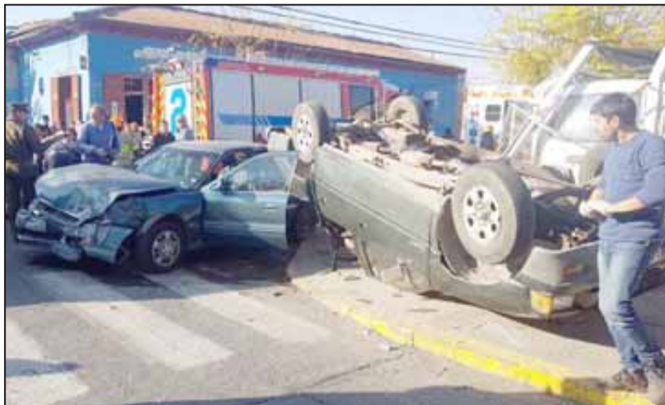
Esta era la escena del accidente, un fatal error que pudo tener peores consecuencias.