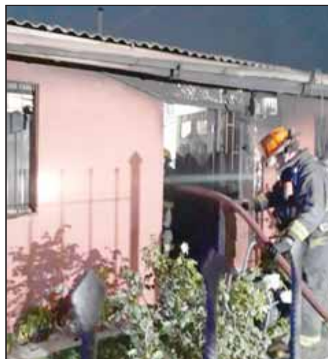
Bomberos trabajando en el combate del incendio de la casa.

Consultada por las necesidades que tienen post incendio, dijo que lo principal