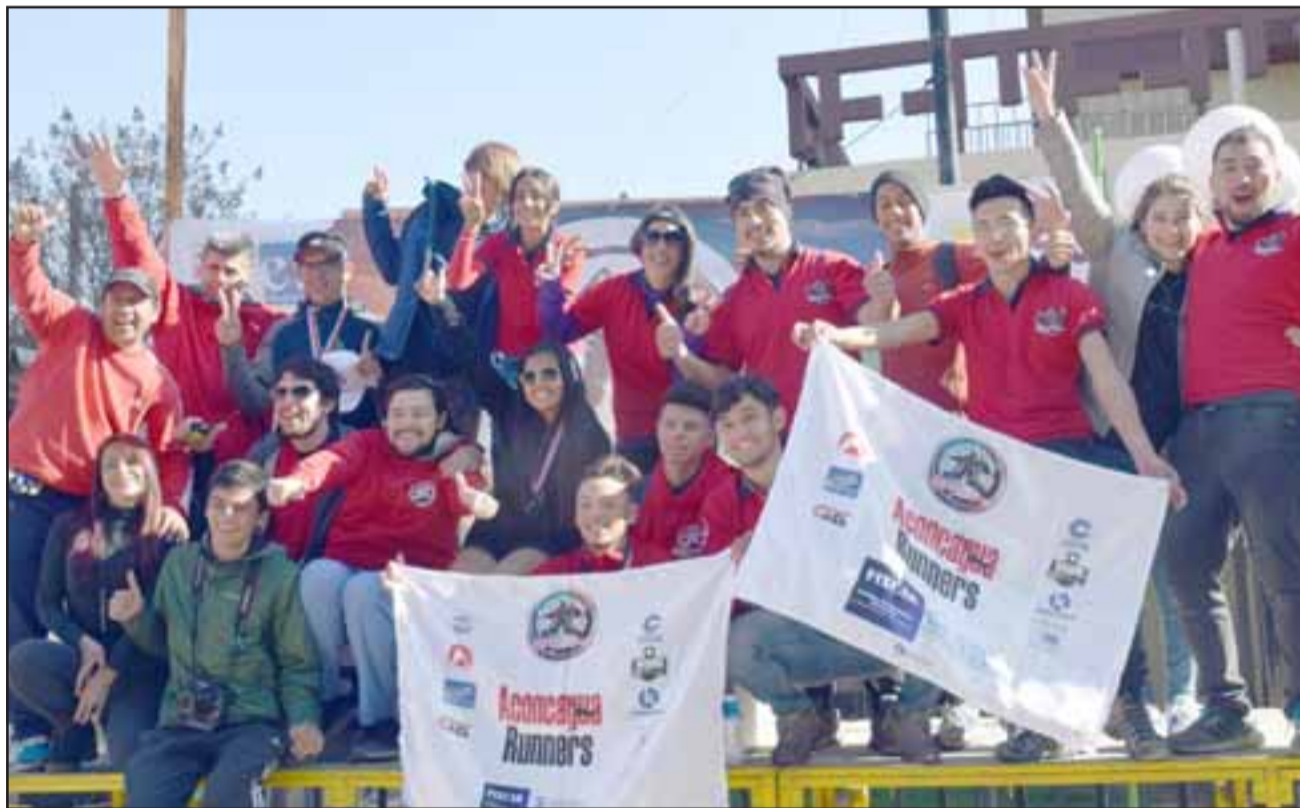
SIEMPRE RUNNERS.- Ellos son parte de la gran Familia Runners de Aconcagua, atletas de todas las edades y con las mismas ganas de seguir corriendo.