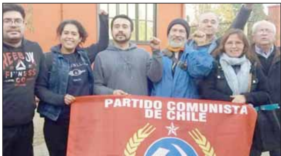
La nueva directiva del Partido Comunista.

Por último, consideran necesario que estas temáticas y otras que son propias de interés de la pobla-