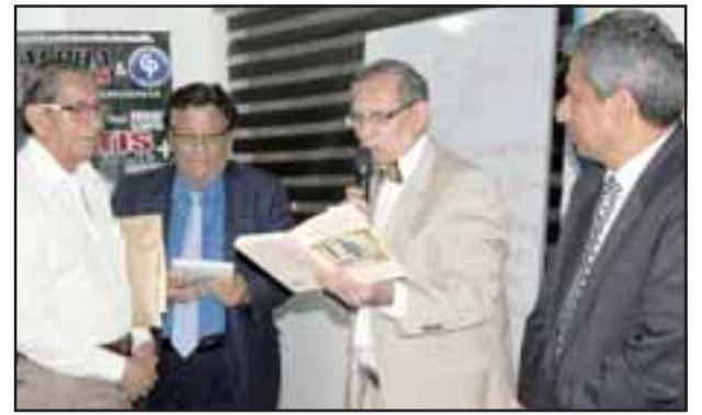
En la gráfica vemos al escritor aconcagüino haciendo entrega de sus libros a los personeros del Colegio de Periodistas de Guayaquil.

El título exacto de la charla fue: 'La institucionalización de la ciencia en Chile y el rol del periodismo'. En dicha exposición se analizó el rol de los gobernantes chilenos del siglo XIX, en cuanto a su apoyo y gestión para el fomento de las ciencias, la educación y los órganos de comunicación; y se dejó de manifiesto la oportuna visión futurista de los perso-