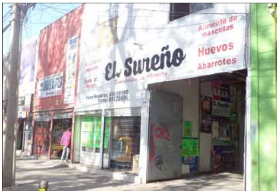
La entrada principal del local 'El Sureño', ubicado en Avenida Chacabuco.

- Claro, uno no está preparado para esto, pero al