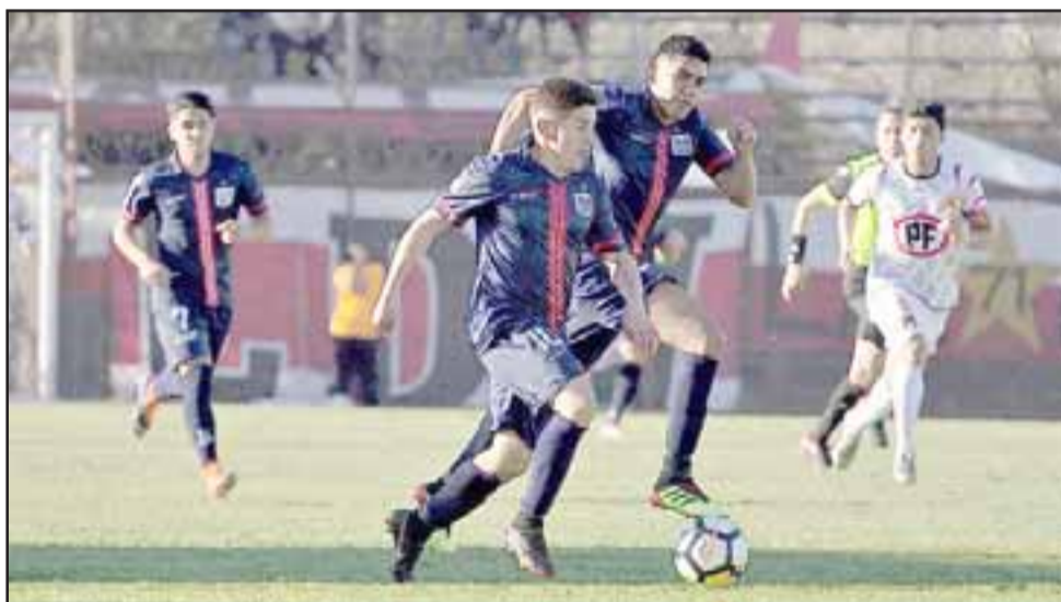
Con su triunfo sobre los maulinos, el conjunto sanfelipeño llegó a 22 puntos y cumplió con el objetivo de terminar en la 'zona de acecho' en la Tabla de la Primera B.