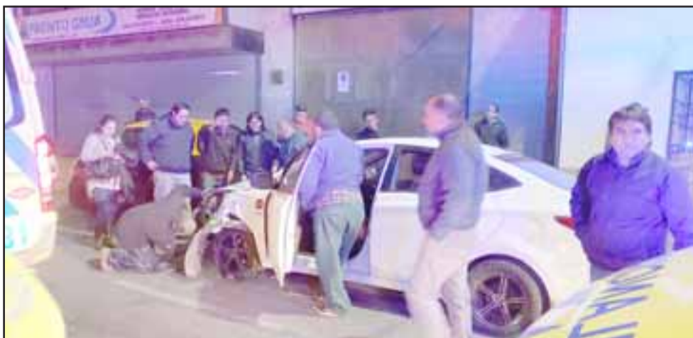
El accidente ocurrió en Avenida Chacabuco esquina Portus, en San Felipe.