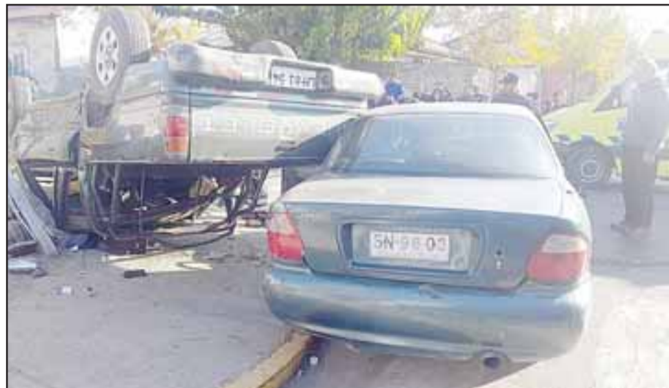
Las pérdidas económicas son altas en ambos vehículos, sus ocupantes no sufrieron heridas graves.