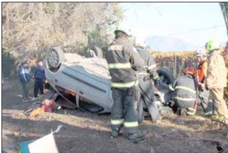
Al lugar concurrieron equipos de emergencia de Bomberos y Samu, los que estabilizaron a los lesionados y luego los derivaron hasta el Servicio de Urgencia del Hospital San Juan de Dios.