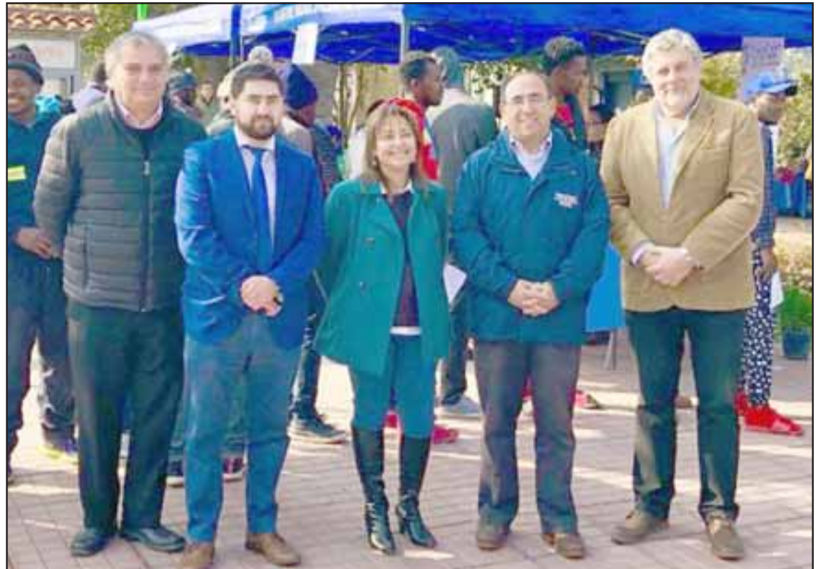
Esta iniciativa se realiza hace más de cinco años, y ya se ha replicado en la comuna con gran éxito.

El alcalde de la comuna recalco la importancia de acercar las empresas a la comunidad, ya que muchas veces es dificultoso para ellos poder trasladarse y acudir directamente, buscando una oportunidad laboral. «Hemos realizado siete ferias laborales a la fecha, una instancia que ayuda a quienes se encuentran en busca de trabajo y por diversos motivos no han podido acceder a ello. Agradecemos a las empresas que accedieron a nuestra invitación y