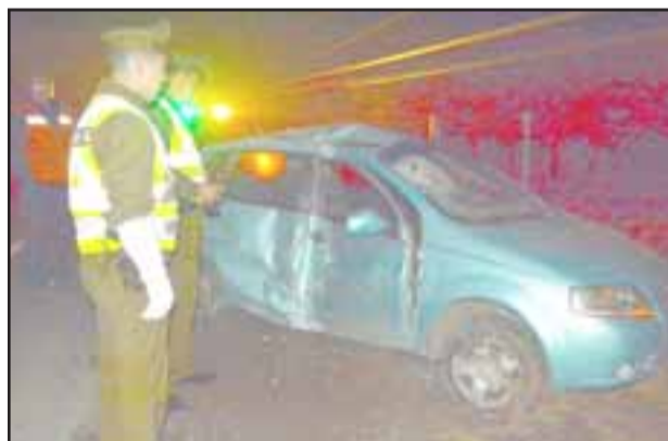
Carabineros investiga las circunstancias en que el conductor y único ocupante perdió el control del móvil.

LOS ANDES.- Un accidente de tránsito se produjo a las 0:00 horas de este sábado y dejó como saldo una persona lesionada y daños. Conforme a los antecedentes preliminares, el hecho se registró cuando un automóvil circulaba por el camino Los Villares, perdiendo el control su conductor, saliéndose de la vía e impactando un poste.