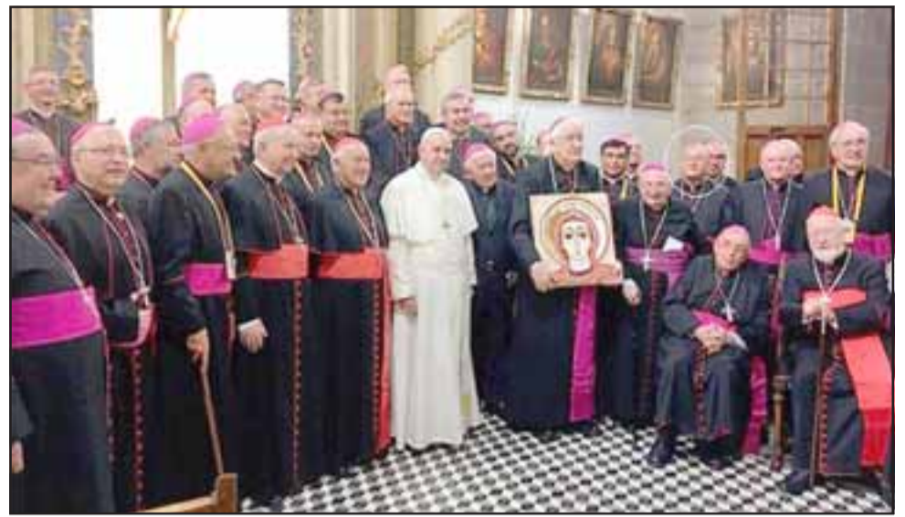
¿SEGUIRÁ TODO IGUAL? - Los 34 obispos activos de Chile fueron llamados a dar cuentas al Papa Francisco, aunque no sabemos si esto significará la renuncia de a alguno de ellos, o expulsión de la Iglesia.

- A ver, ahí hay que distinguir, yo creo que, para mí los abusos son la secuela o la supuración de una situación mucho más delicada y que dice relación con la fe, con Mi Identidad, con Mi Vocación, con Mi Ministerio, dice relación con el lugar que ocupa Dios en mi existencia y en la existencia de los demás, yo creo que tal