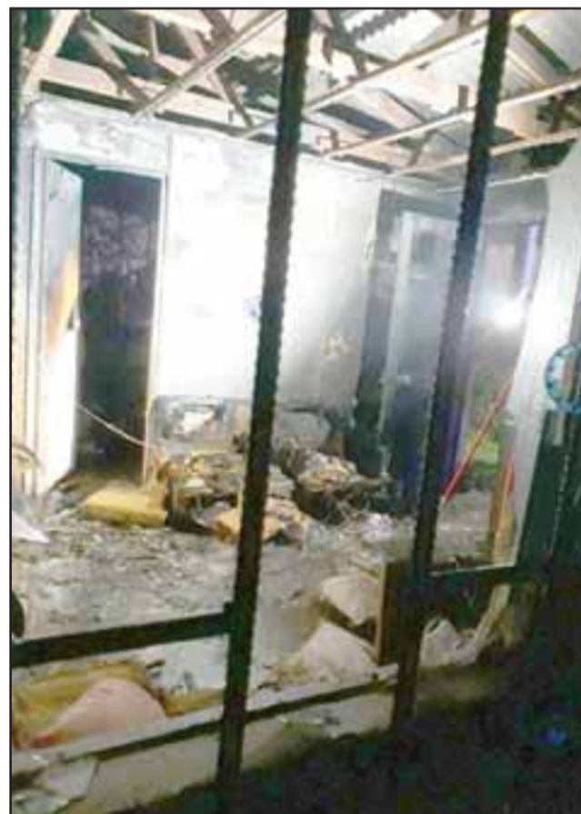
Parte del interior del estado como quedó la casa. (@aconcaguardio).

era reconstruir la casa, “eso es lo principal, poder levantarse de nuevo, necesitamos materiales de construcción para la electricidad, porque quedamos sin electricidad,, eso es lo primero”, indicó.