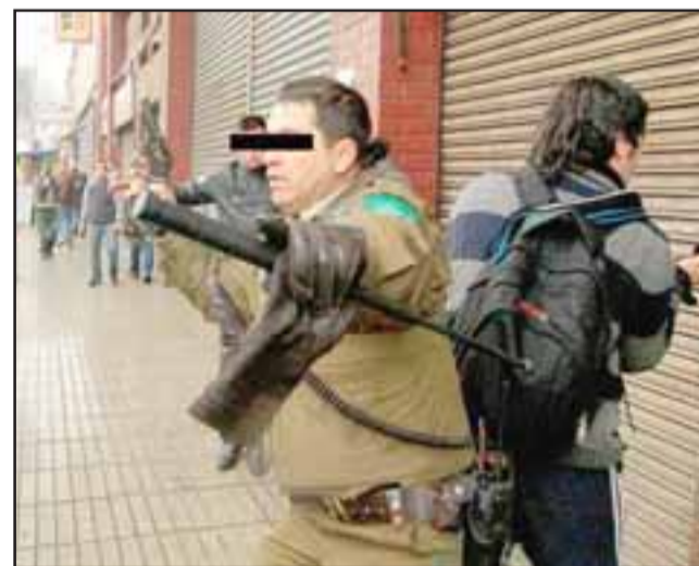
CON SU PROPIA ARMA.- En cuestión de segundos el carabinero quedó desarmado y tuvo que buscar refugio junto a sus compañeros uniformados de los balazos hechos por el delincuente. (Referencial)

Tras el intercambio de disparos el antisocial continuó escapando, arrojando el arma que le quitó al carabinero en algún punto del potrero. Finalmente el sujeto fue detenido y trasladado hasta dependencia de la Tenencia de Rinconada, mientras que se continúa con la búsqueda del arma sustraída al funcionario policial.