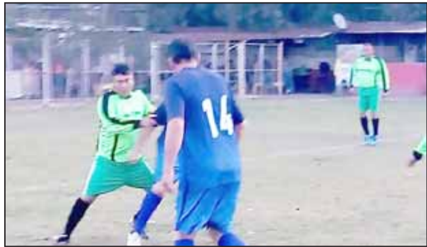
La fecha pasada de la Liga Vecinal fue completamente favorable para el actual líder en la cancha Parrasía.

Resultados de la fecha: Aconcagua 1 – Resto del Mundo 1; Santos 2 – Villa Argelia 1; Unión Esfuerzo 2 – Andacollo 0; Hernán Pérez Quijanes 1 – Barcelona 0; Tsunami 3 – Pedro Aguirre Cerda 2; Los Amigos 3 – Unión Esperanza 1; Carlos Barrera 5 – Villa Los Álamos 1.