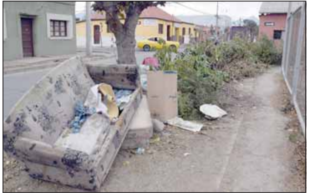
ANTES. - Así lucía el martes temprano la esquina Artemón Cifuentes con Calle Portus, nadie recordaba que ahí estaba sepultado el grifo para emergencias.