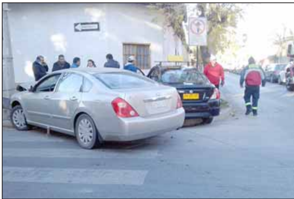
En esta posición quedaron ambos vehículos tras el impacto, el que por fortuna solo dejó daños.