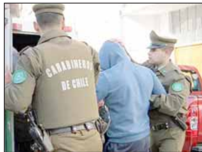
Este sábado 9 de junio, ambos sujetos conocerán la sentencia que emitirá el Tribunal Oral en Lo Penal de San Felipe tras ser declarados culpables del delito de robo en lugar habitado.