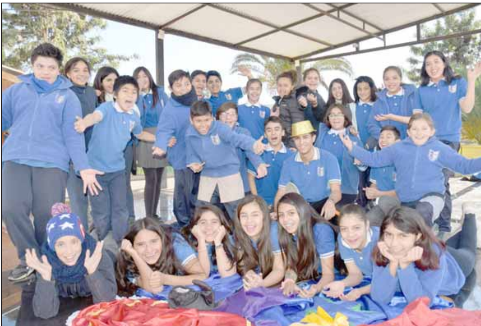
LOS ANFITRIONES.- Estos son los alumnos de la Escuela Artística El Tambo, quienes dan Fuerza y Vigor al teatro y danza de su escuela.

Según explicó el actor, podrán participar grupos de teatro inte-