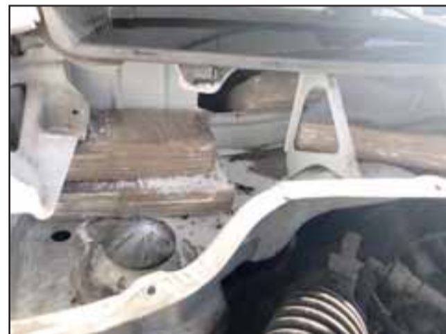
Así venía oculta la droga en el auto conducido por este antisocial.

El comisario de la Brianco, José Muñoz, explicó que durante el proceso investigativo, se logró establecer oportunamente que el detenido se trasladaría hasta la comuna de San Pedro de Atacama, para recoger un cargamento de droga que trasladaría hasta la Región de Valparaíso. Informó que la droga está avaluada en más de 115 millones de pesos, «es de origen boliviano y estaba destinada a la venta en la Región de Valparaíso a micro traficantes locales, por lo que la investigación permitió sacar de las calles más de 100.000