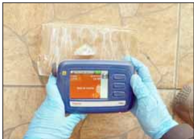
La sustancia fue puesta a controles y dio positivo para base de cocaína.

mañana del lunes fue puesto a disposición del Tribunal de Garantía de Los Andes por el delito de Tráfico de drogas.