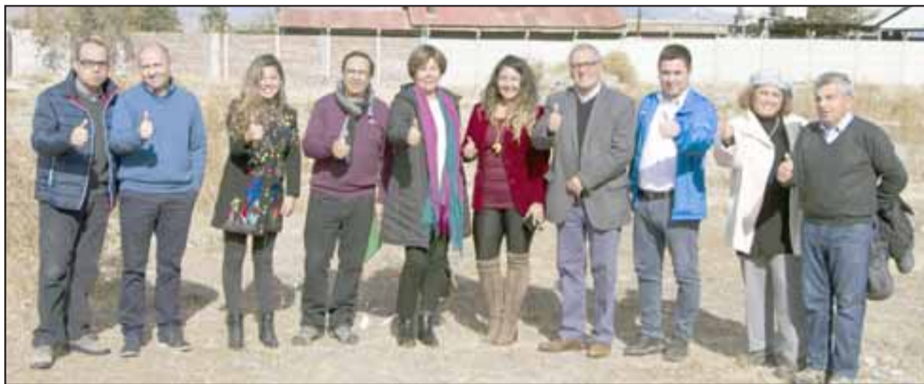
El Concejo Municipal visitó el lugar donde se construirá la futura 'Plaza Ecológica' de Putaendo.

Concejo Municipal anunció creación de un 'Punto Limpio' en la esquina de Avenida Alejandrina Carvajal y calle O'Higgins. El lugar estará destinado al reciclaje de diversos materiales.