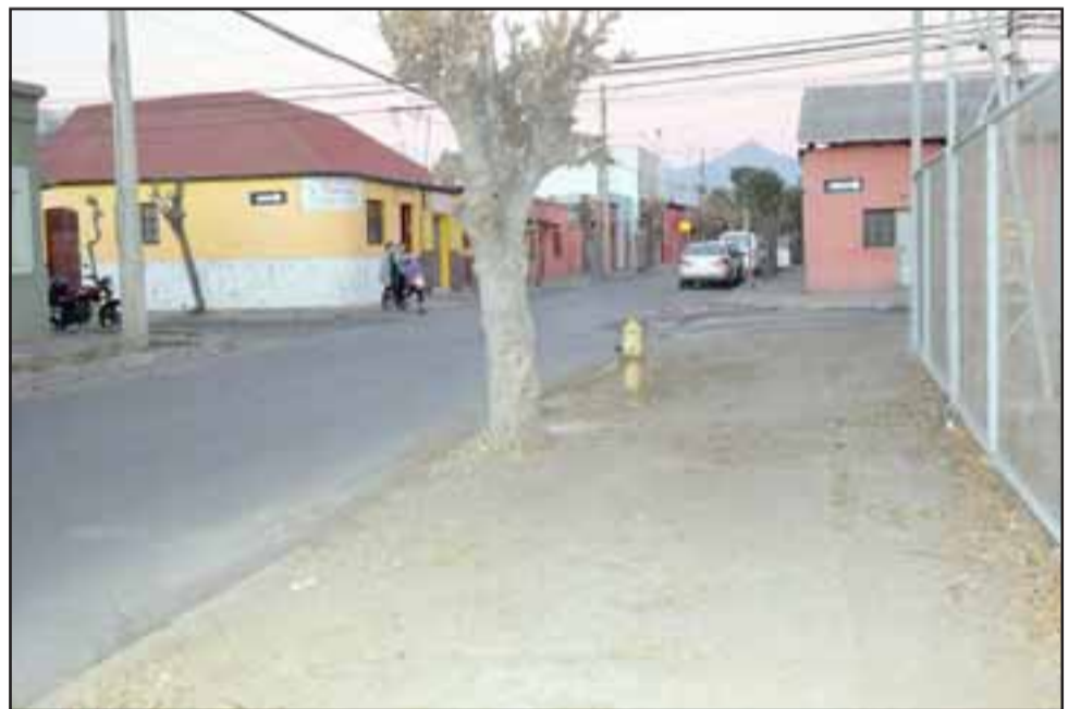
AHORA. - Así luce ahora la misma esquina, y en ese punto vemos el grifo en cuestión.