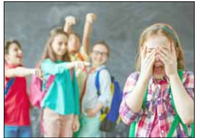
El bullying es un fenómeno mundial que ha adquirido ribetes dramáticos últimamente, con numerosos casos de suicidio, por lo que nadie puede quedar indiferente. (Referencial).

- En San Felipe, como se ve en otros lados, está el tema físico, si es gordo, chico, flaco; por su condición sexual, últimamente se ha masificado la burla hacia personas que tienen orientación distinta; también a personas con rasgos de piel distintos, se ve mucho sobre todo a los extranjeros, sobre todo ahora, existe la xenofobia y el racismo dentro de los establecimientos con la ola migratoria, han llegado alumnos a los colegios donde se discriminan y también se discriminan a los extranjeros, los hermanos bolivianos, argentinos, peruanos, colombianos, etc., se les molesta por el estereotipo mal diagnosticado por la población, como por ejemplo el Colombiano que es narcotra-