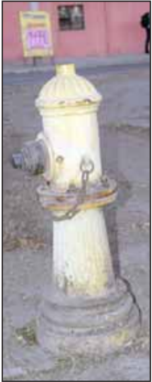
GRIFO MILAGROSO. - Este dispositivo puede salvar vidas en manos de Bomberos, y a algunos vecinos pareciera no importarles.

Pareciera que tras las protestas de algunos veci-