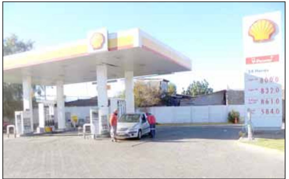
El asalto ocurrió la tarde de este martes en la estación de combustibles Shell ubicada en Encón en San Felipe.