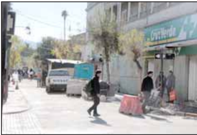
La buena noticia es que el mismo lunes 11 se abrirá el paso semi peatonal de calle Salinas, entre Prat y Santo Domingo, donde sería sumamente importante que la Municipalidad restrinja drásticamente la velocidad de los vehículos.

La información está disponible en la página web ( www.munisanfelipe.cl ) y redes sociales ( twitter: @munisanfelipe y facebook: @munisanfelipe) de la Municipalidad de San Felipe.