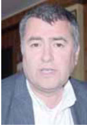
El ex gobernador Eduardo León conduce el programa 'Aire Puro', la nueva apuesta de radio 'Al día' en el 103.1 del dial FM.

El programa pretende tener invitados del Valle de Aconcagua todos los miércoles, quienes destaquen de alguna manera con el cuidado del medio ambiente. Desde Al Día comentaron que "es un honor tener a Eduardo dentro de nuestra parrilla, que sigue creciendo día a día con proyectos que pretenden ser un