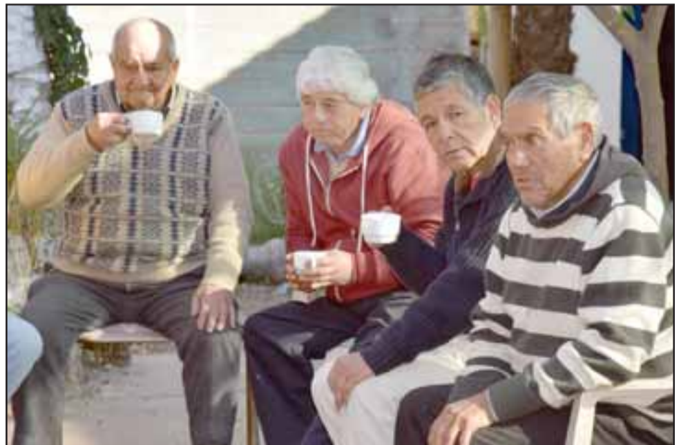
TODOS NAVEGANDO.- También los usuarios de este Hogar compartieron con su invitado de un rico 'Navego' para quitar el frío.