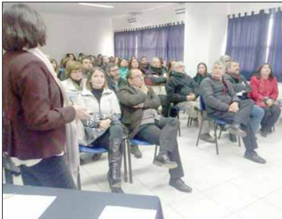
En un trabajo en conjunto de todos los servicios públicos de la provincia se realizó la mesa que busca, en una primera etapa, determinar las atenciones que se deben desarrollar en cada comuna de la provincia.

La presentación fue realizada por la profesional de la Seremi de Salud, Veró-